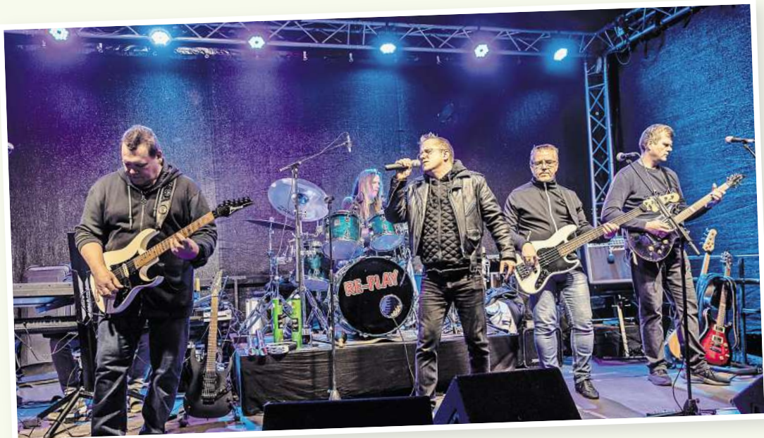
Die Partyband Re-Play heizt dem Publikum ein.

14.00 Uhr Musikschule Ostkreis Live (u.a. mit der Big Band) 20.00 Uhr El Paniko und das Katastrophenorchester (Udo-Lindenberg-Covershow)