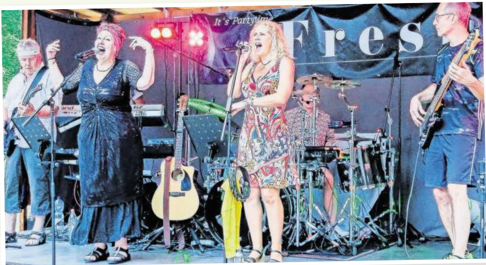
Mit Party-Musik sorgt die Band Freshh für Stimmung.

11.00 Uhr Frühschoppen mit dem Feuerwehrmusikzug Burgdorf-Hängsen 15.00 Uhr Kinderstunde mit Matthias Lück