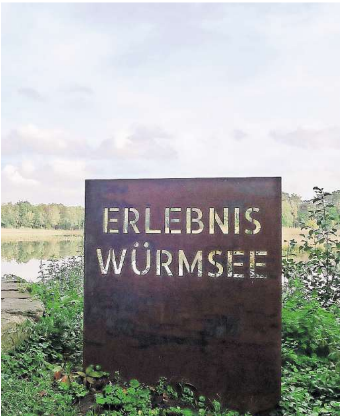
Mit dem neuen „Grünen Schatz“ geht es auf Räseltour rund um den Würmsee.

mit Kindern gut zu bewältigen. Insgesamt sind inzwischen 23 Titel der Reihe „Grüne Schätze“ erschienen, mit denen sich Familien quer durch die Region Hannover rätseln können. Das neue Heft liegt ab sofort im Foyer des Burgwedeler Rathauses und in der Stadtbücherei kostenlos zur Mitnahme aus. Gruppensätze für Kitas und Grundschulen können per E-Mail an umwelt@region-hannover.de bei der Region Hannover bestellt werden. Eine digitale Version aller „Grünen Schätze“ steht unter www.hannover.de/gruene-schaetze zum Download bereit.