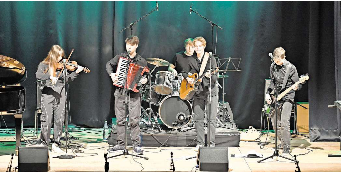
Die Deadfolks beim Neujahrskonzert 2024.

Mal laut, mal leise von Irish Folk bis Pop-Punk