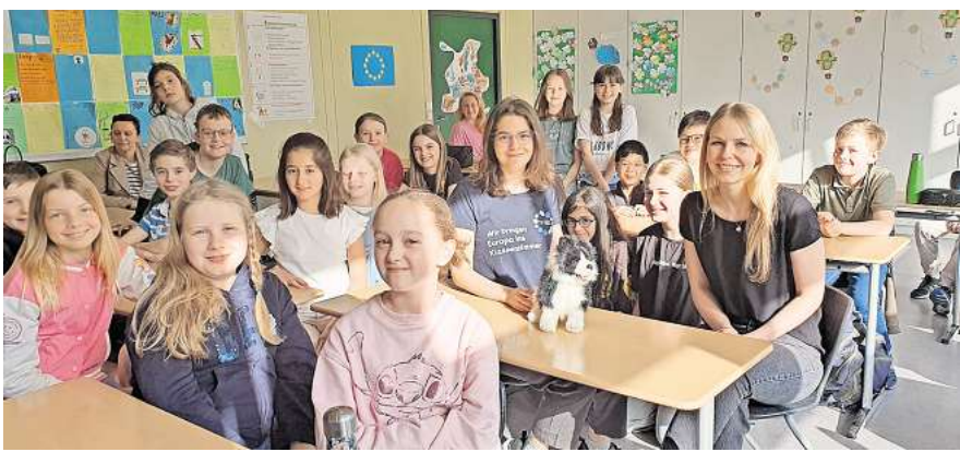
Die Europaklasse des Gymnasiums Isernhagen beschäftigt sich mit unterschiedlichen Ländern und der EU.