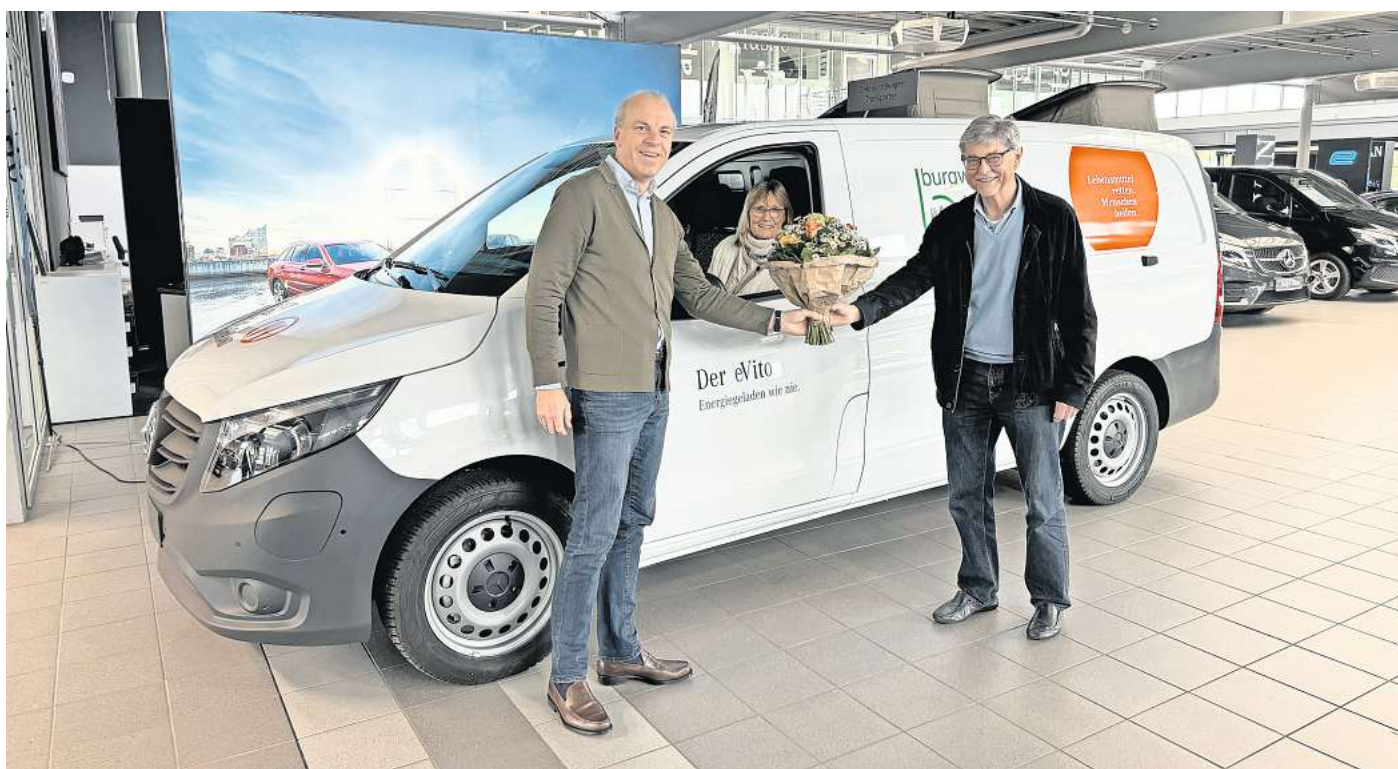
Freude bei der Schlüsselübergabe in Hannover.