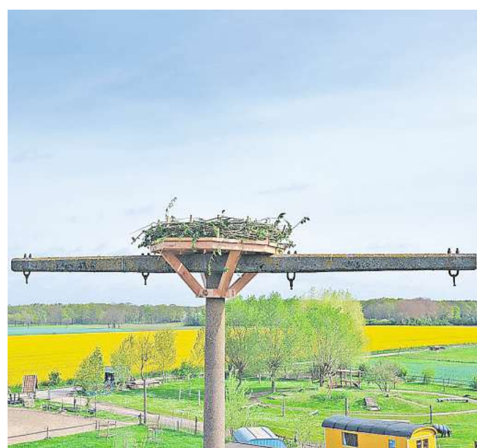
Auf einem ehemaligen Strommast: Das neue Storchennest in Oldhorst befindet sich an der Grenze zwischen dem Schulbauernhof und Trumpas Gartenideen.

Gekostet hat die Ortschaft das künstliche Nest nichts: Die Firma Lopian Holzbau aus Isernhagen F.B., der Zimmerer „Der Holzmichel“ aus Wettmar und die Firma Klemp Dach- und Kranservice aus Wettmar haben das Nest gespendet. Die Firmen kümmern sich gemeinsam um den Bau der Nisthilfe und um die Monta-