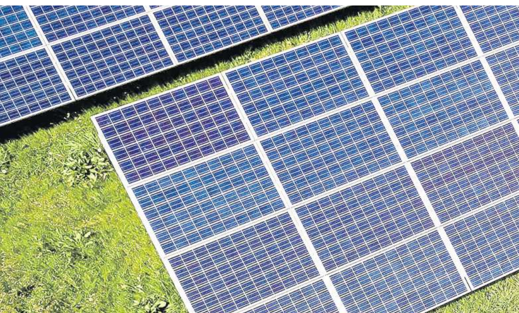
Freiflächen-Photovoltaikanlagen: Solche Anlagen sollen bei Fuhrberg als Solarpark installiert werden.

Lars Wöhler (CDU) gab zu bedenken, dass die Anlagen sehr nah am bebauten Teil von Fuhrberg liegen und fragte, ob der Ortsrat miteinbezogen wird. Dies wurde bejaht. Zudem soll eine frühzeitige Bürgerbeteiligung gestartet werden, bei der Anwohnerinnen und Anwohner ihre Stellungnahmen zum Projekt abgeben können. Dass nicht alle Fuhrbergerinnen und Fuhr-