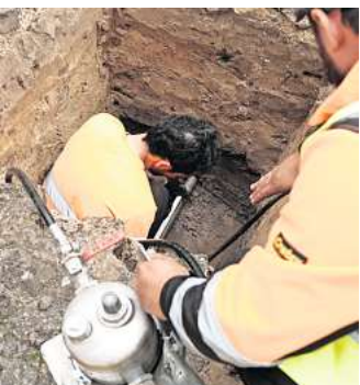
Hier muss jeder Millimeter stimmen: Mitarbeitende des von der Telekom beauftragten Bauunternehmens Flexinfra positionieren die Lanze.

(CDU). Beim Glasfaserausbau in den Dörfern gab es damals Probleme. Die Deutsche Glasfaser richtete zahlreiche Schäden an. So wurden etwa diverse Leitungen getroffen. Allein die Avacon registrierte überdurchschnittlich viele Schadensfälle. Damit sich so etwas nicht wiederholt, schaut die Stadt der Telekom genau auf die Finger. „Der Ausbau in Großburgwedel wird seitens der Stadt von einem Mitarbeiter des Bauamts eng begleitet“, so Wendt. Der Mitarbeiter stehe demnach in einem engen Austausch mit den Baupersonal vor Ort, der Bauplanung der Telekom und den Partnerunternehmen.