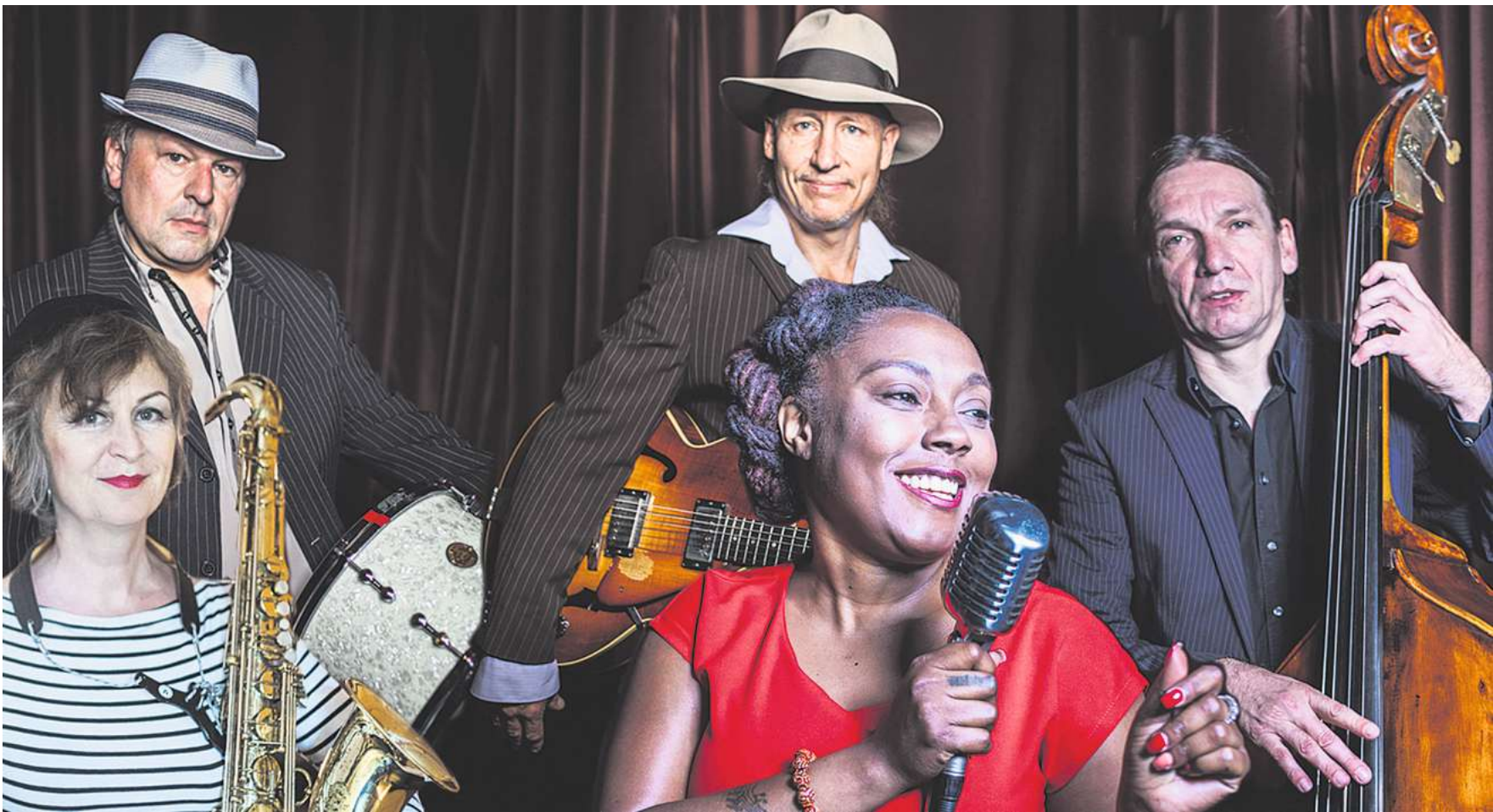
Mit ihrem heißen Swing, Jive und Rhythm' & Blues der 40er und 50er Jahre sorgen The Ballroomshakers für Stimmung im Amtshof.

Swing, Jive und Rhythm' & Blues mit „The Ballroomshakers“