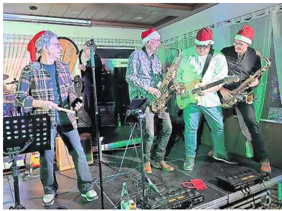
„Party before Christmas“ mit Looptheband aus Burgwedel.

Wer etwas dazugeben möchte, kann das in Burgwedel über die Kollekten der Kirchengemeinden und in den jeweiligen Gemeindebüros tun – oder auch direkt über die Internetseite brot-fuer-die-welt.de spenden.