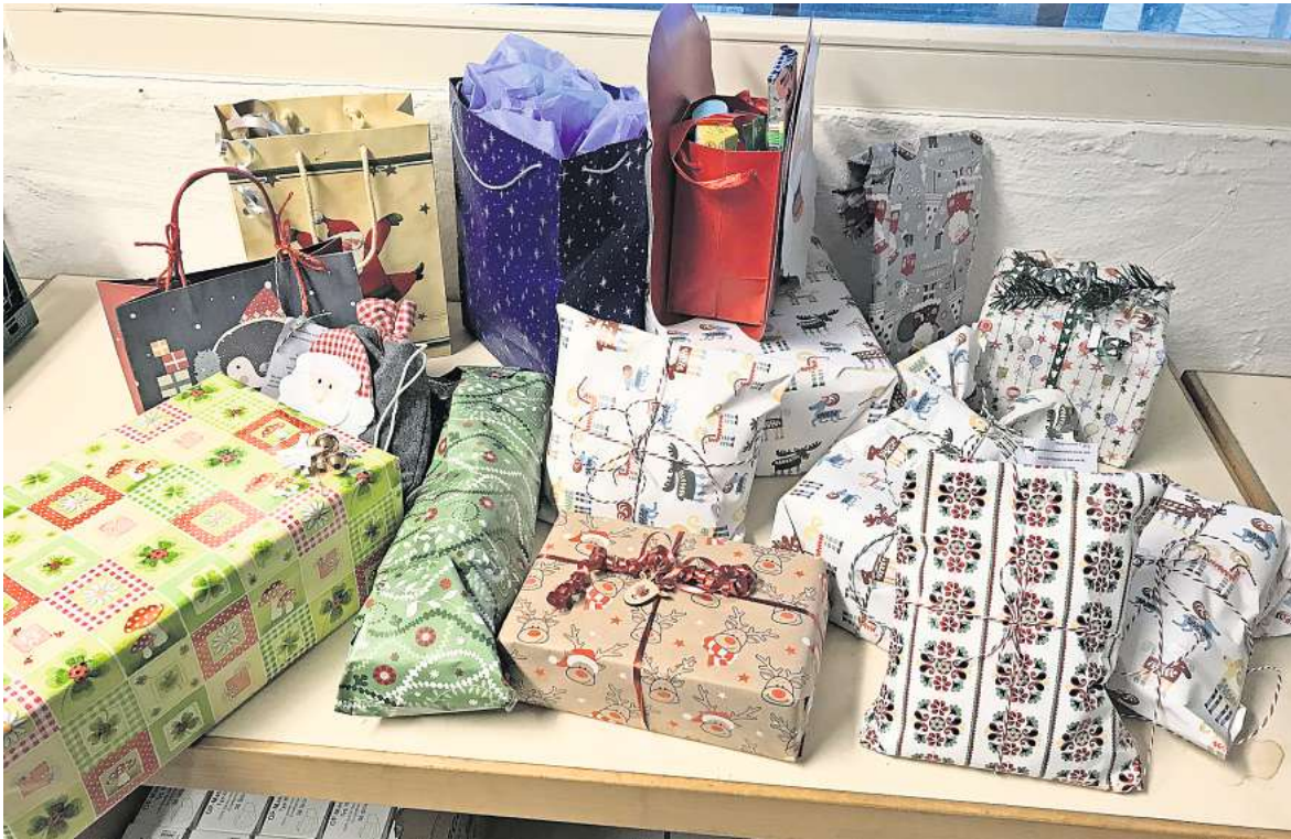
Weihnachtsaktion: Weihnachtstüten der Burgwedeler Tafel für bedürftige Kinder.

Wie hoch die Spendenbereitschaft in Burgwedel ist, zeigt etwa die gemeinsame Weihnachtsaktion von Bürgerstiftung, Sparkasse und Tafel. Eigentlich hätte man dort noch bis zum 12. Dezember Wünsche