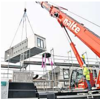
Am Haken: Ein Autokran platziert das tonnenschwere Modul an seinem Platz.