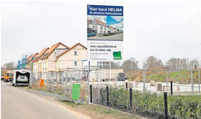
Droht nach der Insolvenz von HELMA Eigenheimbau zur Bauruine zu werden: das Neubaugebiet Flutwidde in Arpke.

Völlig beerdigt ist nun vermutlich ein anderes Helma-Projekt in Lehrte. Im November 2022 hatten Vertreter des Unternehmens in Hämelerwald Pläne für das lang erhoffte Baugebiet an der Fortunastraße vorgelegt. Es sollte 2,7 Hektar umfassen und Platz für 35 Häuser bieten. Helma hoffte damals erneut auf grünes Licht von der Stadt für die Erschließung und Vermarktung in Eigenregie. Das Projekt verlief im Sand, auch weil es hohe Auflagen für den Lärmschutz auf dem Gelände dicht an der benachbarten Bahnlinie gab. „Und jetzt wird daraus wohl gar nichts mehr“, seufzt Hämelerwalds Ortsbürgermeister Dirk Werner.