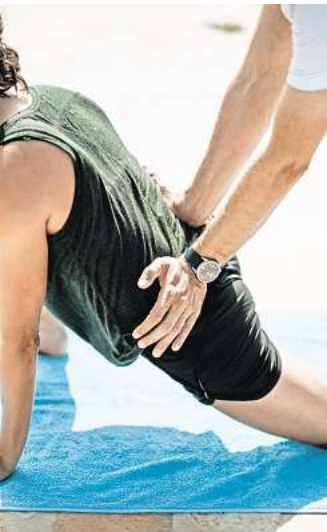
„Dein Kompass zur Rückengesundheit“ lautete das Motto am diesjährigen Tag der Rückengesundheit.