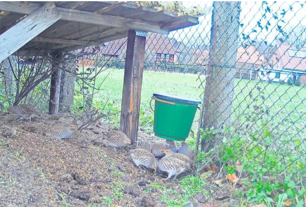
Geschützter Futterbereich für die Feldhühner.

SEHNDE. Im vorigen Jahr startete der Hegering „Das Große Freie“ das Projekt „Futter für Feldhühner“, mit behördlicher Genehmigung zur Sommerfütterung, um die Population von Rebhuhn und Fasan zu stärken. Für den Hegering berichtet Sabine Scholz de Wall. Beide Arten, Rebhuhn und Fasan, benötigen für die Aufzucht der Küken eiweißreiches Kerntierfutter, dass in Ackerrandstreifen zu finden ist. Häufig findet sich aber in diesen sogenannten Feldrainen nicht mehr ausreichend Pflanzenbewuchs, der kleinen Insekten Lebensraum bietet. Hinzu kommt, dass ein starker Prädatorendruck durch Füchse, Waschbären und Marder die Hühnervögel bedroht und schließlich auch die großen Landmaschinen für manchen Vogel den Tod bringen, wenn er nicht schnell genug ausweichen kann. So wurden von den insgesamt zwölf Revieren im Großen Freien rund einhundert Futtereimer bestellt, an geeigneten Plätzen, wie beispielsweise Blüh- und Brachflächen, verteilt und regelmäßig kontrolliert und be-