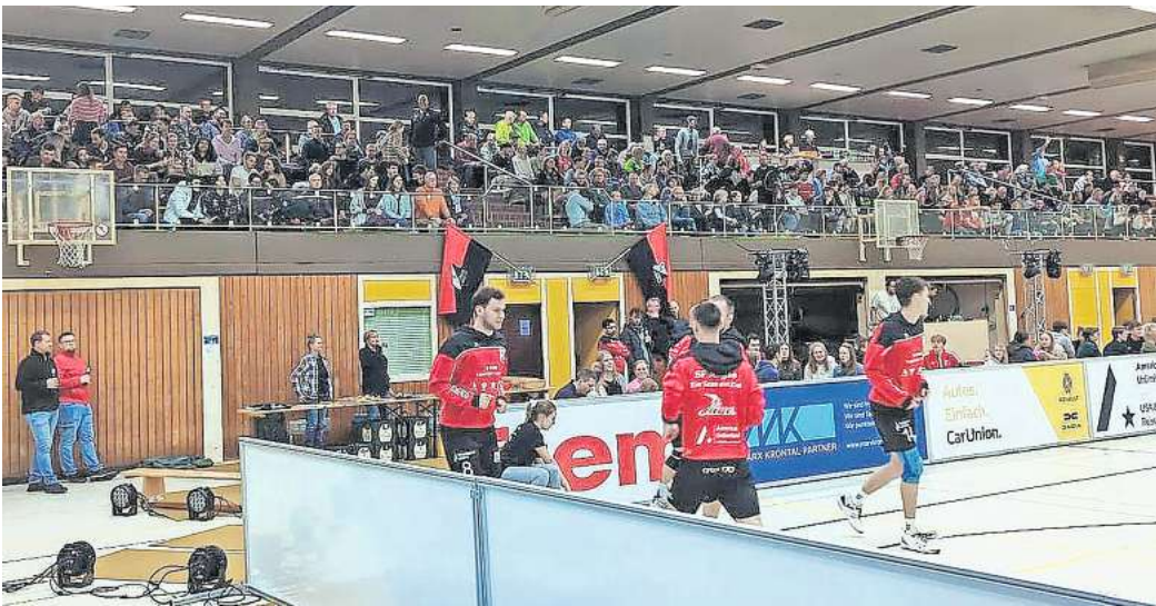
Zum letzten Heimspiel der Saison erwarten die SF Aligse viele Zuschauer in der Sporthalle an der Schlesischen Straße.

Die Ausgangssituation vor den letzten beiden Spieltagen dieser Saison könnte nun spannender nicht sein. Die Braun-