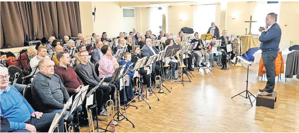
Fest des Posaunenchores Immensen.

IMMENSEN. Im Saal des Landgasthauses Scheuers Hof erklangen am 10. März, Lätare im Kirchenkalender, Trompeten- und Posaunenklänge zum 130. Geburtstag des Posaunenchores Immensen. 70 Bläser aus Immensen, Burgdorf, Lehrte, Uetze-Obershagen und Ehlershausen, im Alter zwischen zehn und 84 Jahre, ließen ihre Instrumente anlässlich dieses Jubiläums mit verschiedenen Stücken erklingen. Geleitet wurde der große Chor vom Landesposaunenwart Henning Herzog. In einigen Grußworten wurde an die Gründung des Immenser Posaunenchores im Jahr 1894 erinnert. Der musikalische Wert wirkt bis heute. Es gibt zahlreichen Einsätze bei kirchlichen und weltlichen Veranstaltungen. In Folge dessen ist der Chor musika-