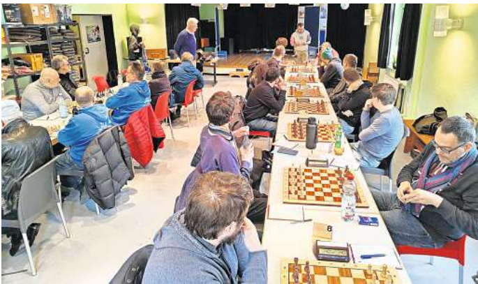
Schachklub Lehrte im Punktspiel-Betrieb.