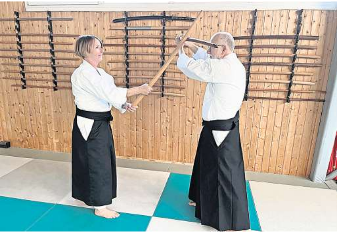
Training mit dem Holzsword.

SEHNDE. Am Montagmittag, 11. März, ist eine 76 Jahre alte Frau leblos in ihrem hauseigenen Brunnen an der Straße „Am Gehrkamp“ aufgefunden worden. Die Polizei leitete ein Todesermittlungsverfahren ein. Aktuell kann weder ein Unglücksfall noch ein Suizid ausgeschlossen werden. Nach bisherigen Erkenntnissen des Kriminaldauerdienstes Hannover alarmierte ein 76-jähriger Mann gegen 12.20 Uhr den Polizeinotruf. Zuvor hatte er seine Ehefrau im Brunnen treibend aufgefunden. Einsatzkräfte der Polizei und Feuerwehr konnten die Frau nur noch leblos aus dem Brunnen bergen. Die Polizei hat die Todesermittlungen eingeleitet. Bislang gibt es keine Hinweise auf ein Fremdverschulden. Die Ermittlungen zur Todesursache dauern an.