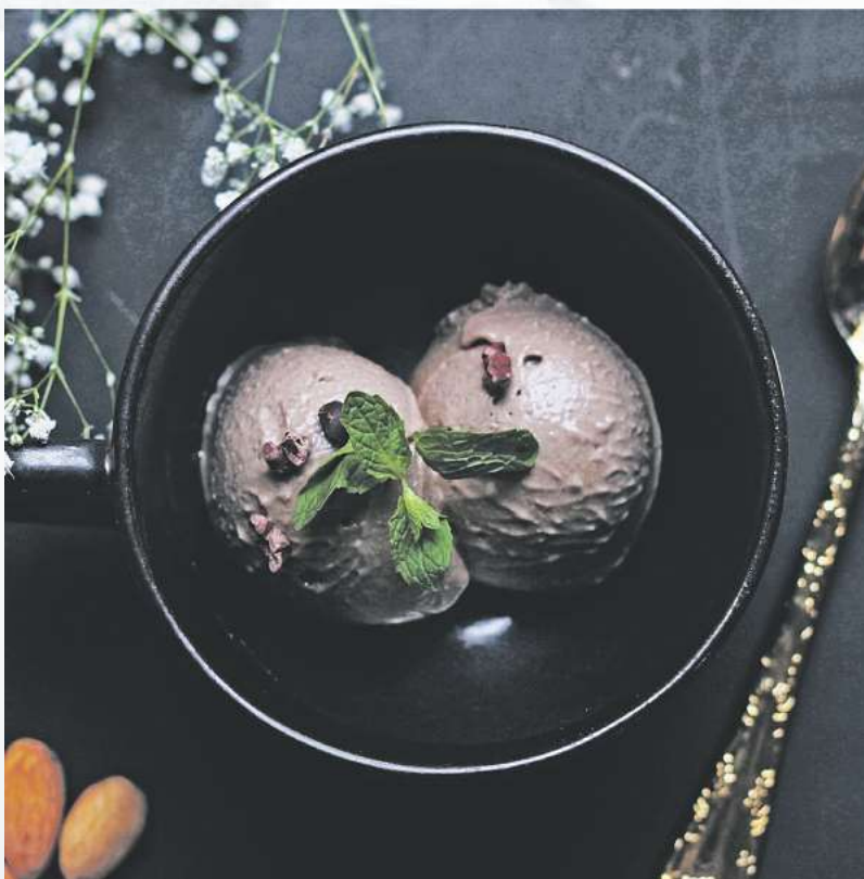
Eis bildet dank seiner cremigen Süße den perfekten Abschluss des Weihnachtsmenüs.