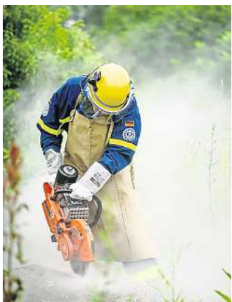
Die Grundausbildung am technischen Gerät ist für ehrenamtliche Helfer beim THW kostenfrei.

LEHRTE. Mit einem Aufruf zur Unterstützung wendet sich der THW-Ortsverband jetzt an die Anwohner. „Wer sich ehrenamtlich engagiert, tut Gutes. Verantwortung übernehmen, sich für andere einsetzen, einander helfen – es gibt dutzende Gründe, sich für das THW zu entscheiden“, so die Mitteilung. Und konkret: „Bei Stürmen entfernst du umgestürzte Bäume, bei Hochwasser pumpst du Gebäude leer, bei Stromausfällen versorgst du Menschen mit Trinkwasser und Strom. Oder Du unterstützt in der Verwaltung. Wir passen aufeinander auf, arbeiten Hand in Hand und können uns aufeinander verlassen. Wir erheben keine Mitgliedsgebühr und die Ausbildung ist kostenlos. Wir vom THW Ortsverband (OV) Lehrte freuen uns auf