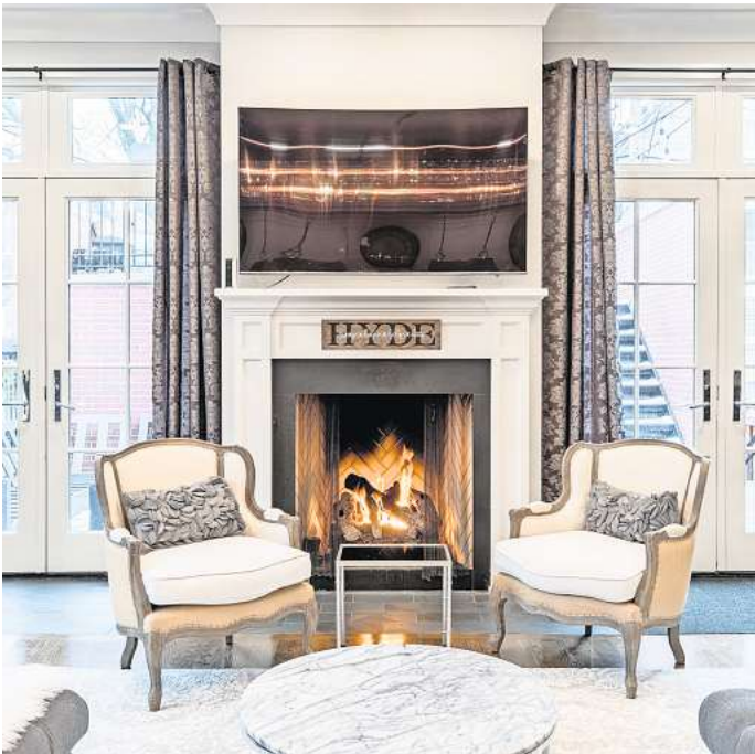
Ein Kamin kann das Highlight des Wohnzimmers sein.