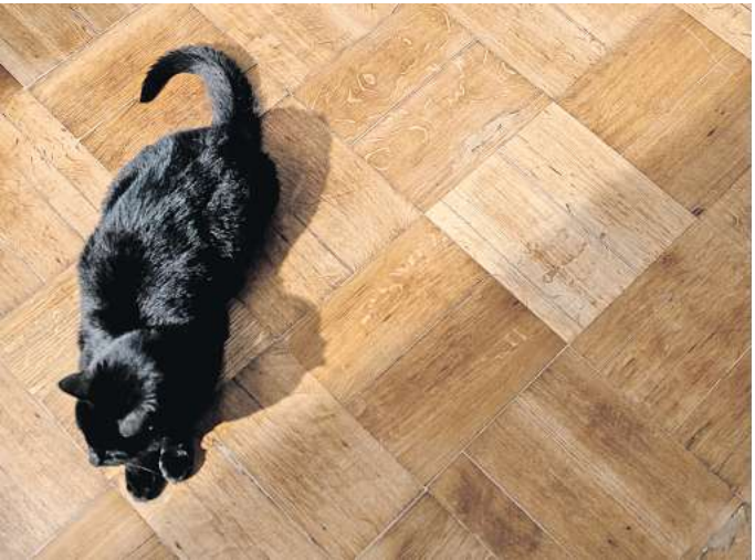
Nach etwa zehn Jahren sollte das Parkett abgeschliffen werden.