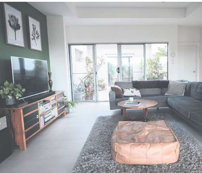
Bodenkissen sind bequem und stylisch.

Wer kennt das nicht: Diese eine Ecke im Zimmer ist zwar zu klein für einen Sessel, aber für „nichts“ ist der Raum zu groß. Oder folgende Situation: Das Wohnzimmer würde noch besser aussehen, wenn eine Kleinigkeit integriert werden würde, nur was? Bodenkissen und Poufs sind eine attraktive und flexible Lösung. Denn die hübschen Polster sind im Nu verschoben, sorgen für einen Blickfang, eine Abstell- und Sitzmöglichkeit. Bodenkissen und Poufs gibt es in vielen Größen, so dass jeder sein Ideal finden kann. Steht man auf den orientalischen Look, das klassische Design oder die verspielte Strick-Optik, wird man schnell fündig. Ein weiterer Clou von Poufs: Durch die feste Füllung des Sitzkissens neigt man schnell zum geraden Sitzen. Die