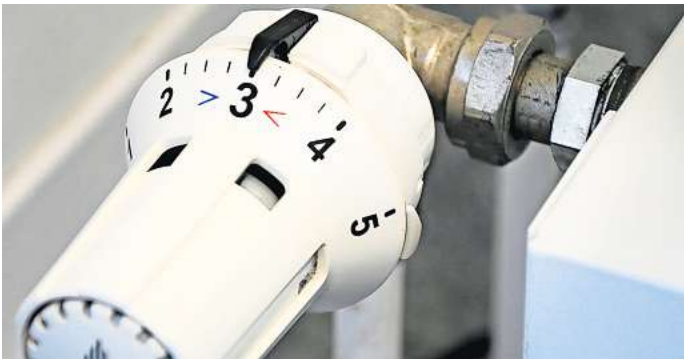
Wer richtig heizt, spart Energie und Geld.

Wie heizt man richtig? Diese Frage stellen sich viele Menschen, sobald im Oktober die Heizperiode beginnt. Zunächst ist es wichtig, die Heizung nicht auszuschalten, wenn man nicht daheim ist. Dieser Fehler ist weit verbreitet und begünstigt sogar Schimmelbildung. Richtig ist vielmehr, eine konstante Raumtemperatur zu erreichen. 18 Grad sollte eine Wohnung mindestens aufweisen. Schaltet man die Heizung aus, wenn man das Haus verlässt, fallen die Temperaturen im Laufe der Stunden rapide. Kalte Räume am Abend wieder aufzuheizen, kostet weitaus mehr Energie, als eine konstante Raumtemperatur beizubehalten. Zudem kann kalte Luft Feuchtigkeit schlechter aufnehmen. Aus diesem Grund entsteht in ausgekühlten Räumen schnell Schimmel. Ein weiterer Aspekt für das richtige Heizen sind die Fenster. Bis zu 40