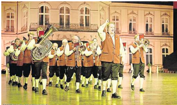
Zeitlose Stimmungsgaranten: Egerland Musikanten spielen auf.