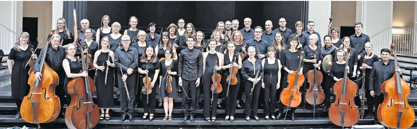
Das Orchester der Universität Hannover.

Uni-Orchester „Befreiung“ gastiert am Sonnabend, 10. Februar, in Lehrte