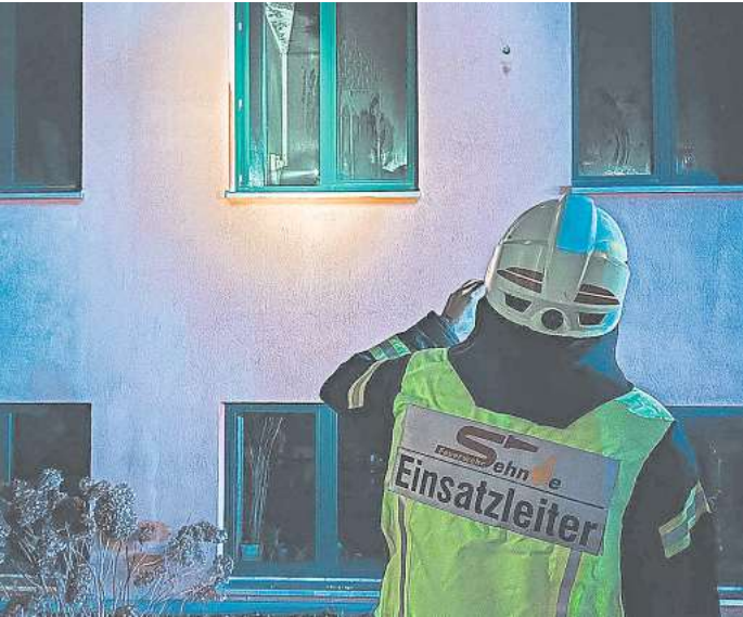
Einsatz am frühen Morgen des dritten Advent im Klinikum Wahrendorff. Stadtfeuerwehr Sehnde

Im Einsatz waren die Ortsfeuerwehren Ilten und Bilm mit vier Fahrzeugen sowie der Rettungsdienst mit zwei Rettungstransportwagen und einem Notarzteinsetzfahrzeug.