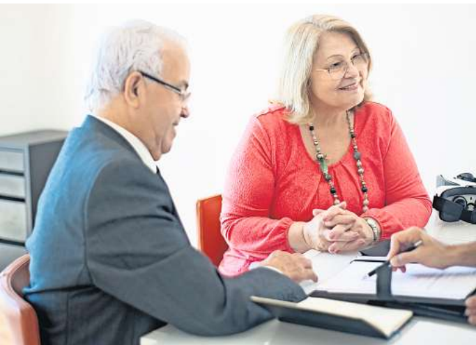
Immobilienverkäufe auf Rentenbasis sind für einige Senioren sehr lukrativ.