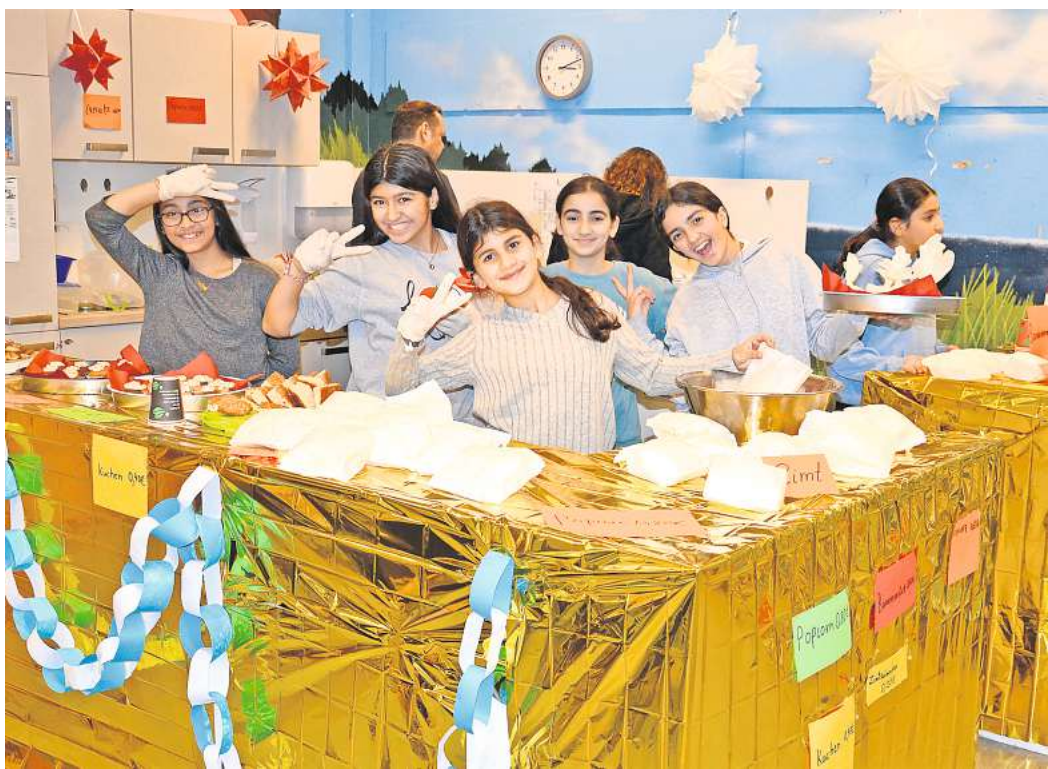
Das Team aus der Klasse 5b hatte Spaß beim Verkaufen.