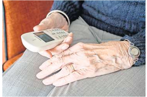
Die Senioren- und Pflegestützpunkte sind auch zwischen den Feiertagen erreichbar.

Die Sozialpsychiatrische Beratungsstelle Burgdorf, Schillerslager Straße 2, hat zwischen den Feiertagen zu den üblichen Zei-