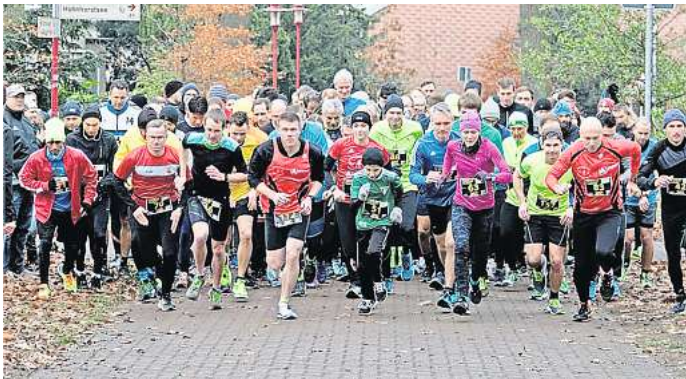
Der Lehrter Silvesterlauf ist wieder in Vorbereitung.

Für Kinder und Jugendliche der Jahrgänge 2009-2017 gilt es eine Strecke von 1,2 Kilometer zu absolvieren, der Startschuss erfolgt um 11 Uhr. Der Hauptlauf (Jahrgang 2008 und älter) startet um 11.30 Uhr auf den 6,6 Kilometer langen Kurs, der über zwei Runden à 3,3 Kilometer gelaufen wird. Die Ausgabe der Startunterlagen erfolgt zwischen 9.30 und 10.30 in der Sporthalle an der Schlesischen Straße. Dort befinden sich auch Möglichkeiten