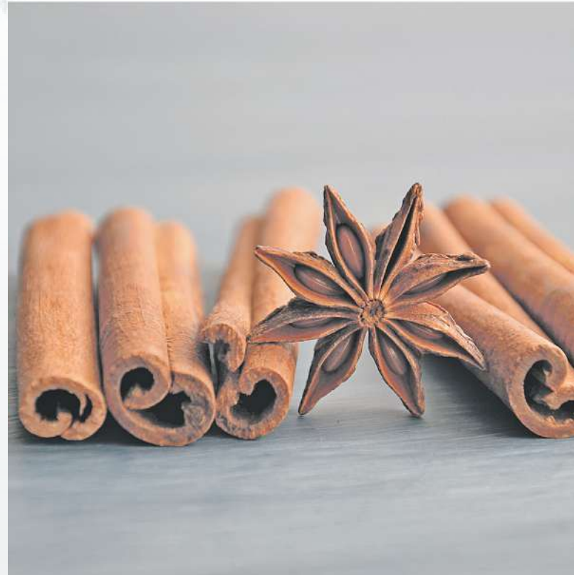
Zimt, Anis und Co. sorgen nicht nur für verfeinerte Speisen, sondern auch für Weihnachtsstimmung.

Wenn die Luft nach Zimt, Kardamom und Nelken duftet, weiß man, es ist wieder Weihnachtszeit. Obwohl diese Gewürze natürlich das ganze Jahr über verwendet werden dürfen, sind sie im Advent und zu den Festtagen besonders beliebt. Auch Muskatnuss, Vanille und Anis gehören zu den weihnachtlichen Lieblingen im Gewürzschrank. Vor allem in süßem Gebäck oder wärmenden Getränken wie Punsch und Glühwein kommen diese zum Einsatz. Sie machen sich aber genauso gut an herzhaften und deftigen Speisen. Das gilt auch für Fleisch. Muskat verfeinert außerdem Kohl- und Kartoffelgerichte. Kardamom ist vor allem in der asiatischen Küche zuhause und aromatisiert Currys, Reis und Hähnchen. Damit die Gewürze ihr volles Aroma entfalten, lohnt es sich, diese im Ganzen zu kaufen. Die fertig gemahlene Alternative ist zwar besonders praktisch, beinhaltet aber auch die Gefahr, dass die Aromen mehr Luft und Licht ausgesetzt sind und somit schneller verdampfen. Wer seine Gewürze selbst mahlt, erhält nicht nur mehr Frische und Intensität, sondern kann auch über den Mahlgrad bestimmen. Soll bereits zu Beginn des Kochvorgangs gewürzt werden, ist es sinnvoll den Mahlgrad gröber zu wählen. Gibt man die aromatisierenden Zutaten erst zum Schluss hinzu, sollten sie feiner sein. Wer Zimt in Stangen, Kardamom in Kapseln und Muskat