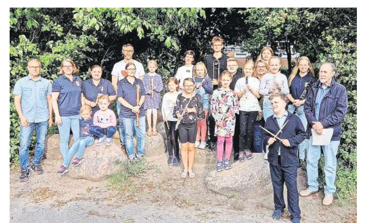
Die Ahltener Musikanten bleiben aktiv.

Interessierte Musiker sind willkommen. Auf der Internetseite www.ahltener-musikanten.de gibt es weitere Informationen. Proben finden freitags statt, und öffentliche Auftritte kommen auch nicht zu kurz. Kontakt: E-Mail an info@ahltener-musikanten.de .