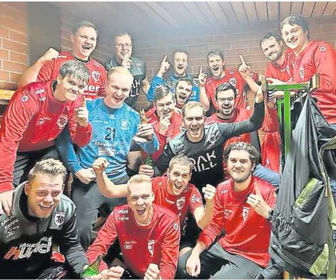
Zumindest der Punktgewinn gegen Lehrte wurde bei den zweiten TVE-Handball-Herren gefeiert.