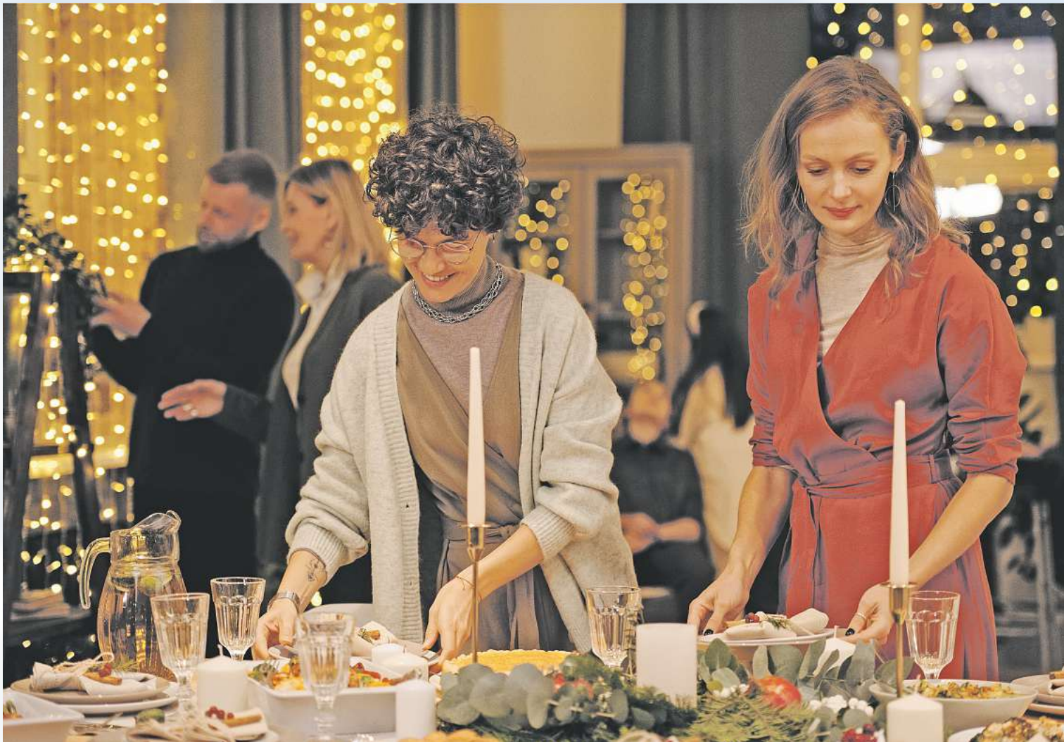
Das Weihnachtessen ist häufig geprägt von Traditionen.

Kulinarische Inspirationen aus anderen Ländern