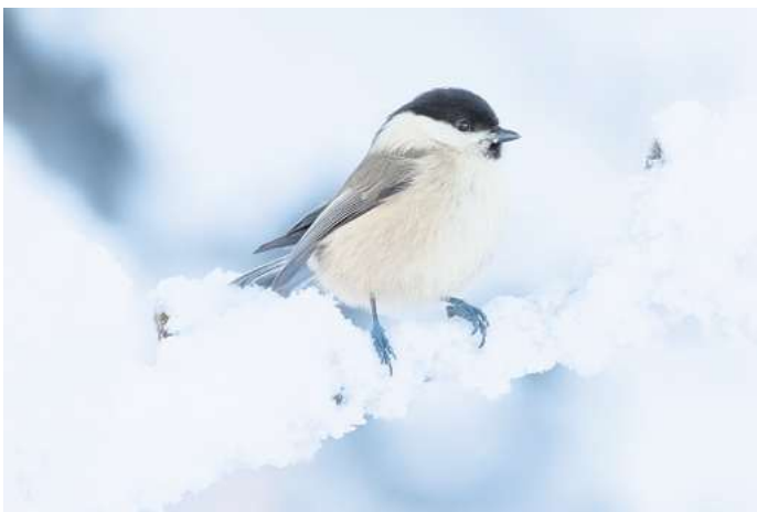
Seltener Gast: Weidenmeise im Schnee.

Der frühe und heftige Winter- einbruch Ende November stellte kein Problem für Amsel, Meise, Sperling und Co. dar. Ein langan- haltender Temperatursturz mit viel Schnee wäre eher am Ende des Winters kritisch, wenn die Energiereserven der Vögel und das natürliche Futterangebot schon weitgehend aufge- braucht sind. „Mit qualitativ hochwertigem Vogelfutter las- sen sich die Tiere besonders bei kalten Temperaturen und Schnee unterstützen. Sonnen- blumenkerne und Samen- mischungen sowie Fettfutter sind dann willkommene Energie- quellen, die viele Vogelarten gerne annehmen“, so die NABU-Mitarbeiterin.