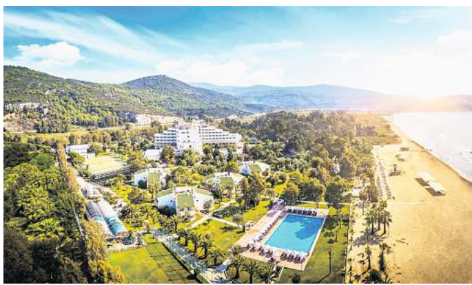
Mit Glück gewinnen: Flugreise an die Ägäis.

Möchten Sie im kommenden Jahr einmal wieder eine richtig schöne Reise machen? Dann haben Sie hier die große Chance dazu. Wir verlosen unter allen Teilnehmern, die ihre ganz persönlichen Lieblingskunstwerke aus der Weihnachtswerkstatt gewählt haben, eine 10-tägige Flugreise für zwei Personen nach Izmir, das Juwel der Ägäis im Wert von