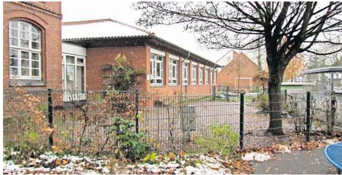
Zu wenig Platz: Die Grundschule Breite Straße soll nach Norden erweitert werden.

Der Schulbezirk für die Grundschule Breite Straße umfasst die Ortsteile Bolzum, Grentenberg, Klein Lobke, Müllingen, Sehnde (mit Ausnahme des Schulbezirks der Astrid-Lindgren-Grundschule), Wassel, Wehmigen und Wirringen.