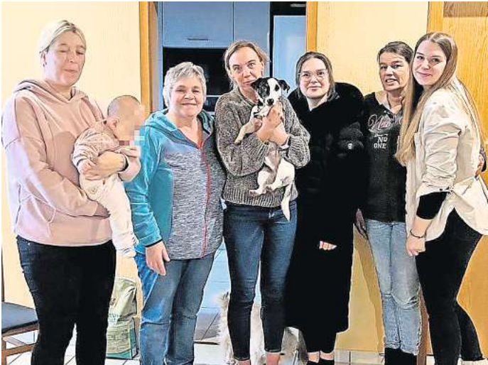
Zurück bei der Halterin: Das Team der Hundesicherung konnte den vermissten Cooper übergeben.

LEHRTE. Was Haustiere wohl zu erzählen hätten, wenn sie sprechen könnten. Im Fall von Cooper wäre das besonders interessant: Der Jack-Russell-Terrier wurde mutmaßlich am 4. Dezember zwischen Lehrte und Peine ausgesetzt – wie man zunächst jedenfalls glaubte. Nach vier Tagen zwischen Schnee und Minusgraden konnten engagierte Helfer den Hund einfangen. Aber die Geschichte vom ausgesetzten Hund war dann doch ganz anders, wie man inzwischen weiß: Coopers Frauchen und Herrchen sind Binnenschiffer aus Belgien. An der Anderter Schleuse soll der Hund plötzlich ins Wasser gefallen sein. Was dann geschah, ist nebulös: Zwischen 20 und 20.30