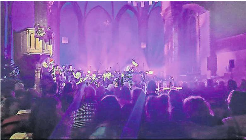
Das Flötenorchester realisierte das Weihnachtskonzert in der Matthäuskirche mit beeindruckenden Lichteffekten.