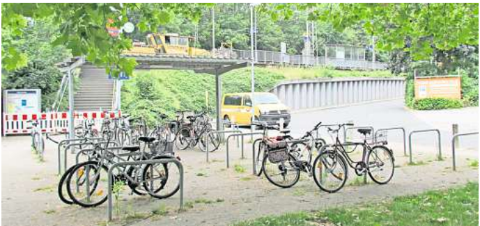
Abstellplätze am Bahnhof: Das derzeit eher dürftige Angebot für Pendler soll mit einem Fahrradparkhaus eigentlich deutlich attraktiver werden.

Entsprechend sahen die Pläne vor, das Parkhaus auch mit einer Photovoltaikanlage auf dem Dach energieautark und damit klimafreundlich zu betreiben. Auch eine Begrünung von Fassade und Dach ist grundsätzlich vorgesehen.