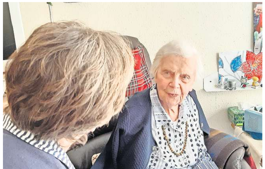
Zuhören, Erzählen, Dasein: Ehrenamtliche Mitarbeiterin in der Begleitung.

Ziel ist es, sich gemeinsam auf den Weg zu machen und zu überprüfen, ob Interessierte sich weiter mit der Thematik beschäftigen wollen, um einmal kranke und sterbende Menschen zu begleiten. Grundsätzlich sollte für dieses Engagement die Bereitschaft zur Auseinandersetzung mit dem Lebensende, mit eigenen Lebens- und Todesbildern und den eigenen Erfahrungen mit Sterben und Trauern vorhanden sein. Die Klärung der eigenen Lebenssituation und Perspektiven ist Grundlage, um Wünsche und Bedürfnisse Sterbender wahrzunehmen. In der Einführungsschulung werden die Teilnehmer die Aufgaben und Strukturen der ambulanten Hospizarbeit kennenlernen. Sie