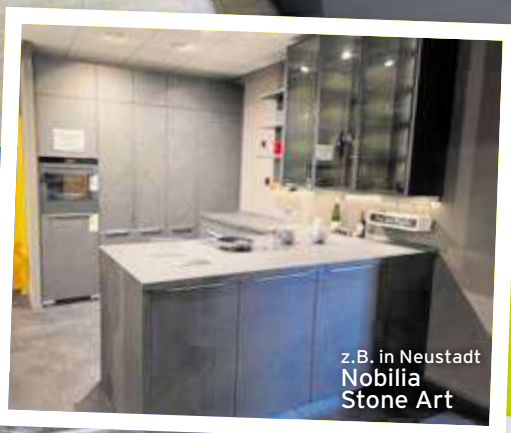
z.B. in Neustadt Nobilia Stone Art