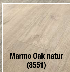
Marmo Oak natur (8551)