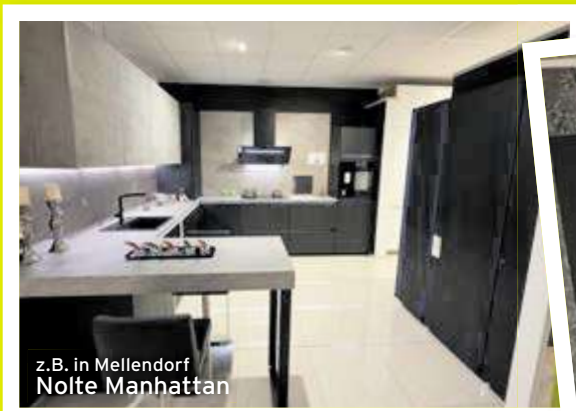
z.B. in Mellendorf Nolte Manhattan

Bis zu 70% weniger – aber 100 % Kochgenuss.