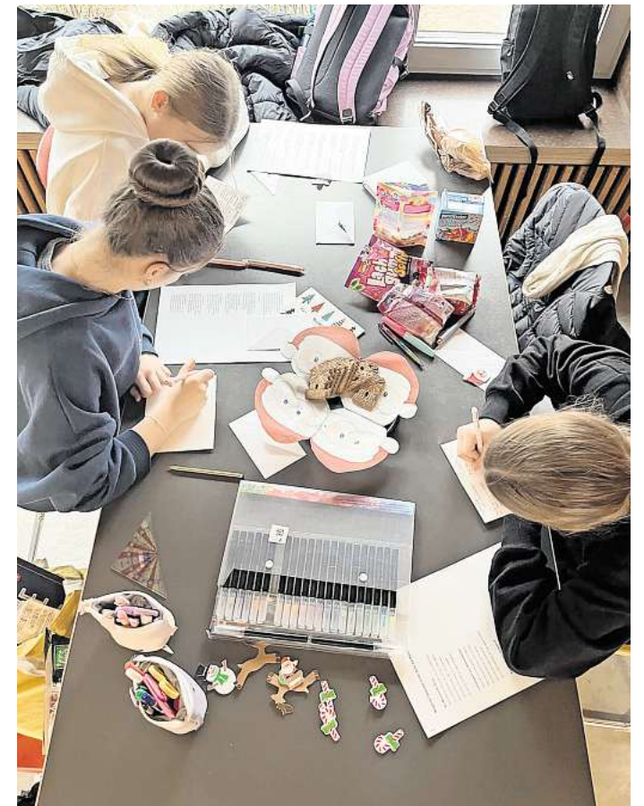
Weihnachtsprojekt am Gymnasium: Das Basteln der Grußkarten in großer Menge.

Mit Lebkuchen und Spekulatius und Weihnachtsmusik im Hintergrund entstanden mehr als 350 Karten, die mit Gedichten, besinnlichen Sprüchen, eigenen Zeichnungen und fest-