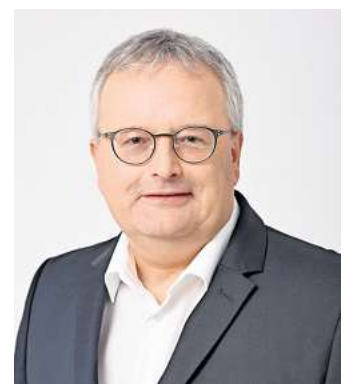
Olaf Kruse, Bürgermeister der Stadt Sehnde

Wer Einsamkeit vorbeugen möchte, kann bei Festen und Veranstaltungen gute Gesellschaft finden. Sie bringen Menschen zusammen, stärken das Wir-Gefühl, fördern den sozialen Austausch und sorgen für Abwechslung. Auch 2025 wurde im gesamten Stadtgebiet unterschiedlichste Veranstaltungsformate angeboten. Höhepunkt war sicher das Bergfest. Getragen von unglaublich viel ehrenamtlichem Engagement und einem großen Einsatz aller Beteiligten wurde auch das Bergfest 2025 wieder zu einer ganz besonderen Veranstaltung. 22.000 Menschen waren