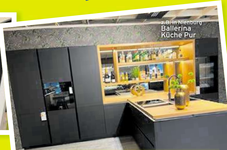
z.B. in Nienburg Ballerina Küche Pur