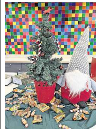
Die Wichtel sind Programm.