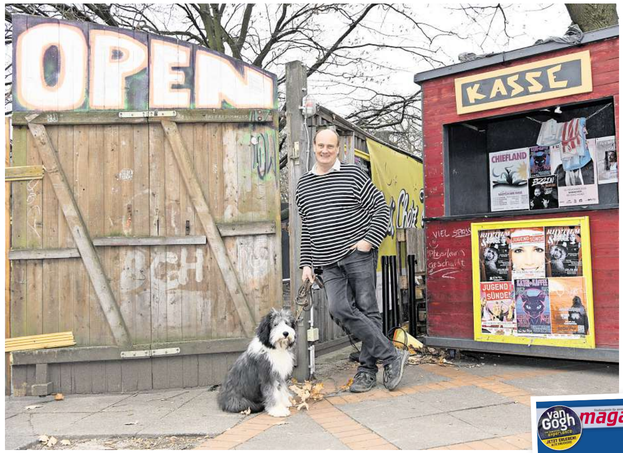
„Unser Programm hat sich immer gewandelt und geht mit der Zeit.“

magaScene: Kommen wir zum Umzug ins Musiktheater BAD. Ihr dürft sicher bis Ende 2026 in den alten Räumen bleiben. Vielleicht sogar auch noch ein halbes Jahr länger. 2027 soll, wenn alles gut läuft, im BAD eröffnet werden. Wie sieht das ideale Béi Chéz Heinz in den Räumen des Musiktheaters BAD für Dich aus? Grambeck: Ideal wäre, dass wir das komplette Gebäude durchsanieren und wir dort drei Indoor-Areas haben. Ähnlich wie hier eben. Eine für rund 400 Leute und zwei kleinere für um die 40 oder 50 Leute. Die genauen Kapazitäten müssen wir aber noch prüfen. Wenn ich sanieren sage, meine ich auch den Keller, das Erdgeschoss und auch, dass oben der Dachstuhl komplett ausgebaut ist. Den brauchen wir, um all unseren Mitarbeitenden gute Arbeitsbedingungen zu bieten. Dazu gehört auch, dass das Haus komplett barrierefrei wird. Zumindest erstmal das Erdgeschoss und das Souterrain. Ein absolutes Highlight