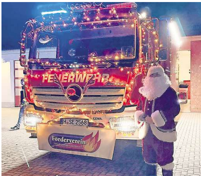
Der Nikolaus in Ilten unterwegs.

Förderverein der Ortsfeuerwehr sorgt für Stimmung