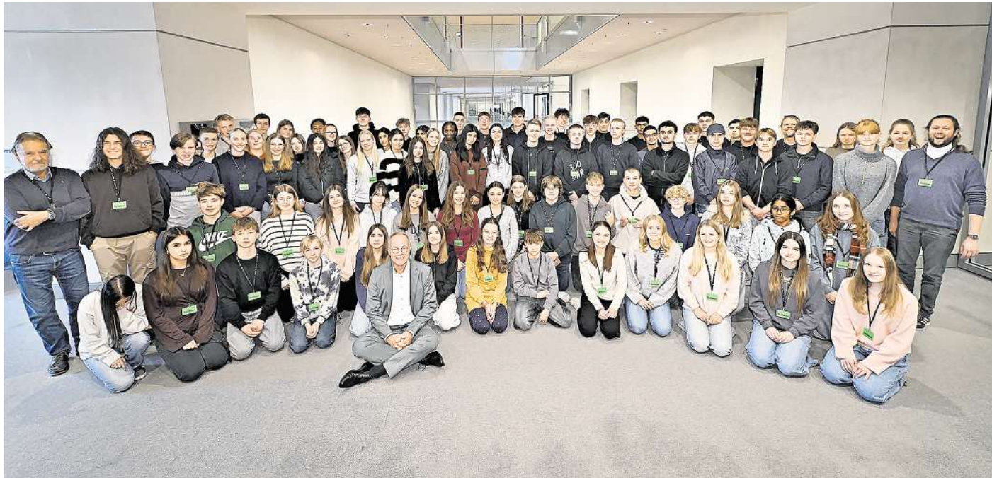
Lehrer Schüler des zehnten Jahrgangs im Bundestag.

Neun Lehrer begleiten den Ausflug mit politischem Programm