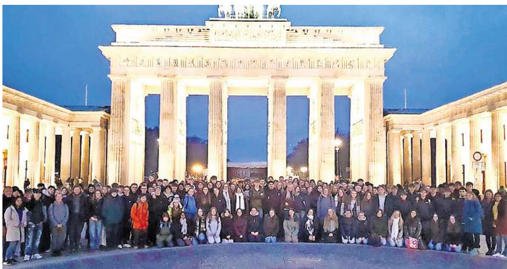
Ausflug des zehnten Jahrgangs: Schüler des Gymnasiums Lehrte in Berlin.

Für 48 Schüler stand außerdem ein Besuch im Bundesrat auf dem Programm, wo sie an einem Planspiel teilnahmen und politische Entscheidungsprozesse selbst erleben konnten.