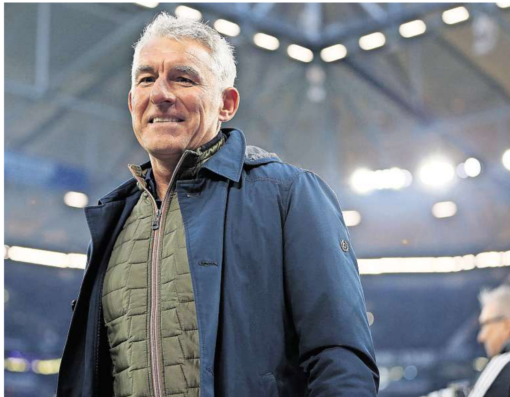
Mirko Slomka ist zu Gast beim Fußballtalk der Neuen Presse am 17. Dezember in der Alten Druckerei.

Neben den sportlichen Eindrücken geht es wie immer auch um Fan-Kultur, Vereinspolitik und die Frage, welche Entwicklungen den Klub langfristig prägen könnten. Slomkas Wurzeln in Hannover sitzen tief: 2010 übernahm er 96 erstmals als Cheftrainer, führte sie in der darauffolgenden Saison zu einem sensationellen Platz vier in der Bundesliga und damit ins internationale Geschäft.