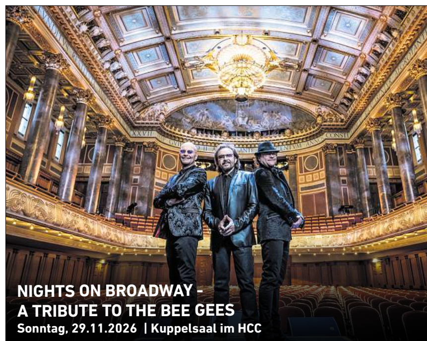
NIGHTS ON BROADWAY - A TRIBUTE TO THE BEE GEES Sonntag, 29.11.2026 | Kuppelsaal im HCC

Ihr persönlicher Ticketservice der HAZ & NP