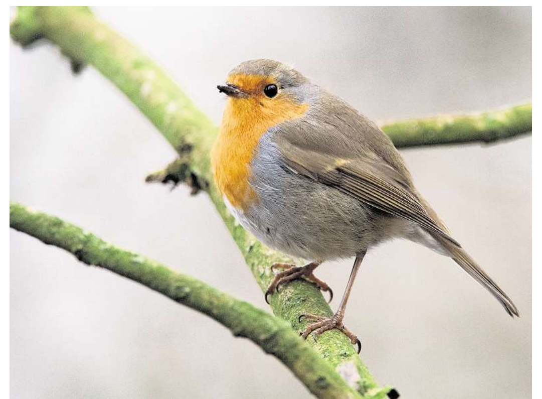
Gartenvögeln kann man eine Futtersäule im Garten oder auf dem Balkon spendieren. Eichhörnchen und Vögel brauchen bei Frost Trinkwasser.

Wildkatzen, Füchse, Wildschweine, Wölfe, Rehe und Rothirsche sind im Winter aktiv. Sie haben sich ein dickeres Fell zugelegt und passen ihre Aktivität den Witterungsverhältnissen an. Rothirsche etwa verkleinern Magen und Organe, um mit weniger Nahrung auszukommen. Während Huftiere jede Form von Anstrengung vermeiden, gehen Füchse, Wildkatzen und Wölfe im Winter sogar auf Jagd. Wildschweine haben eine dicke Unterwolle, die Nässe und Kälte von der Haut abhält. Wird es sehr eisig, kuschelt sich die Rotte im Unterholz aneinander und wärmt sich gegenseitig. Gartenvögel wie Amseln, Meisen oder Rotkehlchen bleiben ebenfalls im Winter wach und gehen auf Nahrungssuche. Schutz suchen sie in dichten Hecken und Büschen. Eichhörnchen halten Winterruhe, Winterschlaf halten Garten- und Siebenschläfer, Haselmaus, Alpenmurmeltier, Feldhamster und Igel. Sie fahren