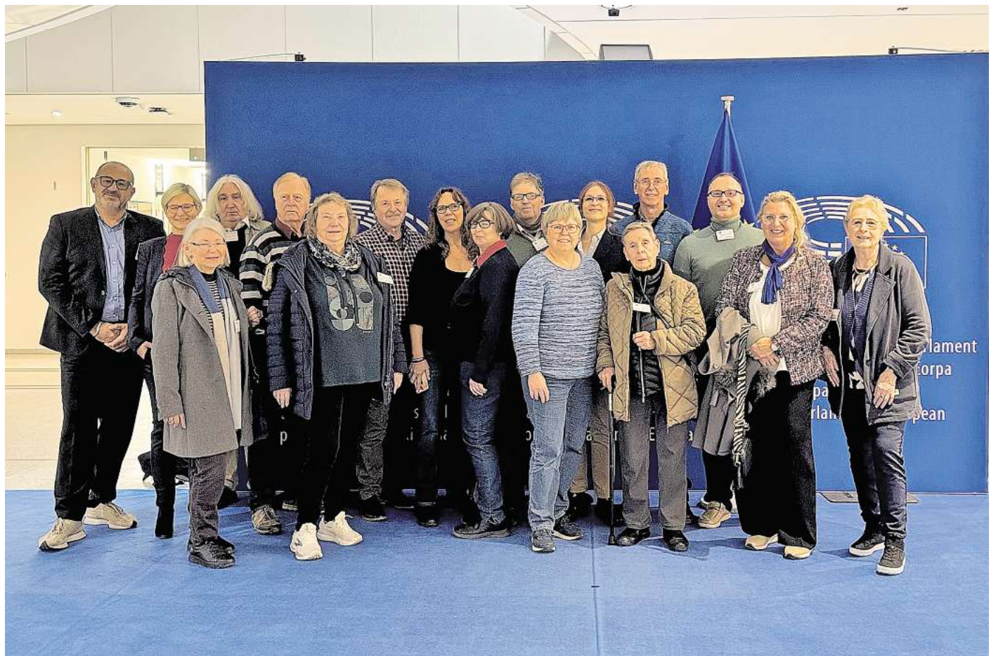
Reisegruppe des CDU-Ortsverbands in Brüssel.

Nadine Schaaf schreibt abschließend: „Mit vielen neuen Eindrücken, einem besseren Verständnis für die Arbeit der europäischen Institutionen und zahlreichen persönlichen Erlebnissen kehrten die Teilnehmerinnen und Teilnehmer erschöpft, aber zufrieden und wohlbehalten nach Höver zurück.“