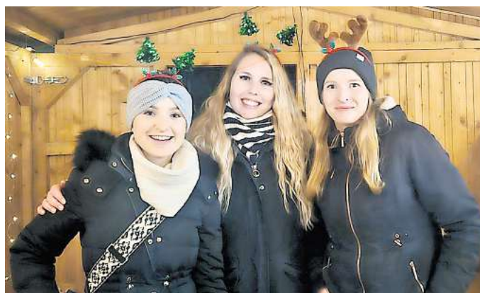
Wie im Vorjahr soll es in Immensen beste Unterhaltung geben.