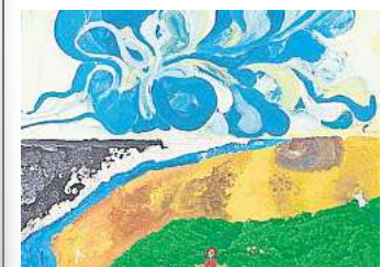
Auktion für einen guten Zweck.

HANNOVER. Farbe als Einladung, Landschaft als Möglichkeitsraum, Fantasie als gemeinsamer Nenner: Der Verein „Fliegende Blume Kunst hilft“ zeigt die Ausstellung „Fantasiereise & Landschaften“ – Kunst für den guten Zweck. Entstanden sind die Serien „Fantasiereise in die Vergangenheit – Fantasiereise in die Zukunft“ und „Landschaften“ 2022 bis 2023 in der Zusammenarbeit von Hobby- und Profikunstschaffenden. Der Verein arbeitet ehrenamtlich, inklusiv und integrativ; der Erlös aus Verkauf und Auktionen unterstützt das inklusive Theaterfestival Klatschmohn sowie das Frauenhaus Donna Clara in Laatzen. Eröffnung mit Auktion ist am Sonntag, 7. Dezember, ab 15 Uhr, die Finissage mit Auktion am Sonnabend, 20. Dezember, ab 15 Uhr. Öffnungszeiten sind montags bis freitags von 8 bis 22 Uhr, am Wochenende von 10 bis 22 Uhr, im Freizeithaus Linden, Windheimstraße 4. Der Eintritt ist frei. RHR