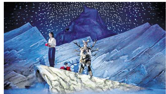
Wintermärchen: Das Schauspielhaus zeigt „Die Schneekönigin“.

► Weitere Termine und Tickets: staatstheater-hannover.de