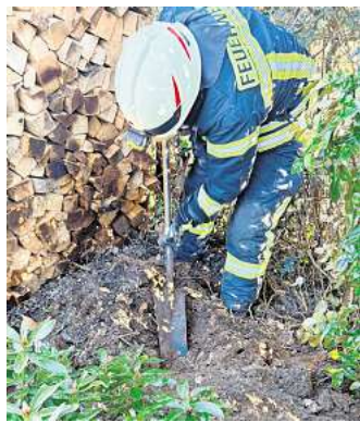
Nach dem Löschen überprüfen die Einsatzkräfte, ob noch Glutnester vorhanden sind.

kontrollierten die Einsatzkräfte die Brandstelle mit einer Wärmebildkamera und kühlten verbliebene Glutnester mit Wasser weiter herunter.