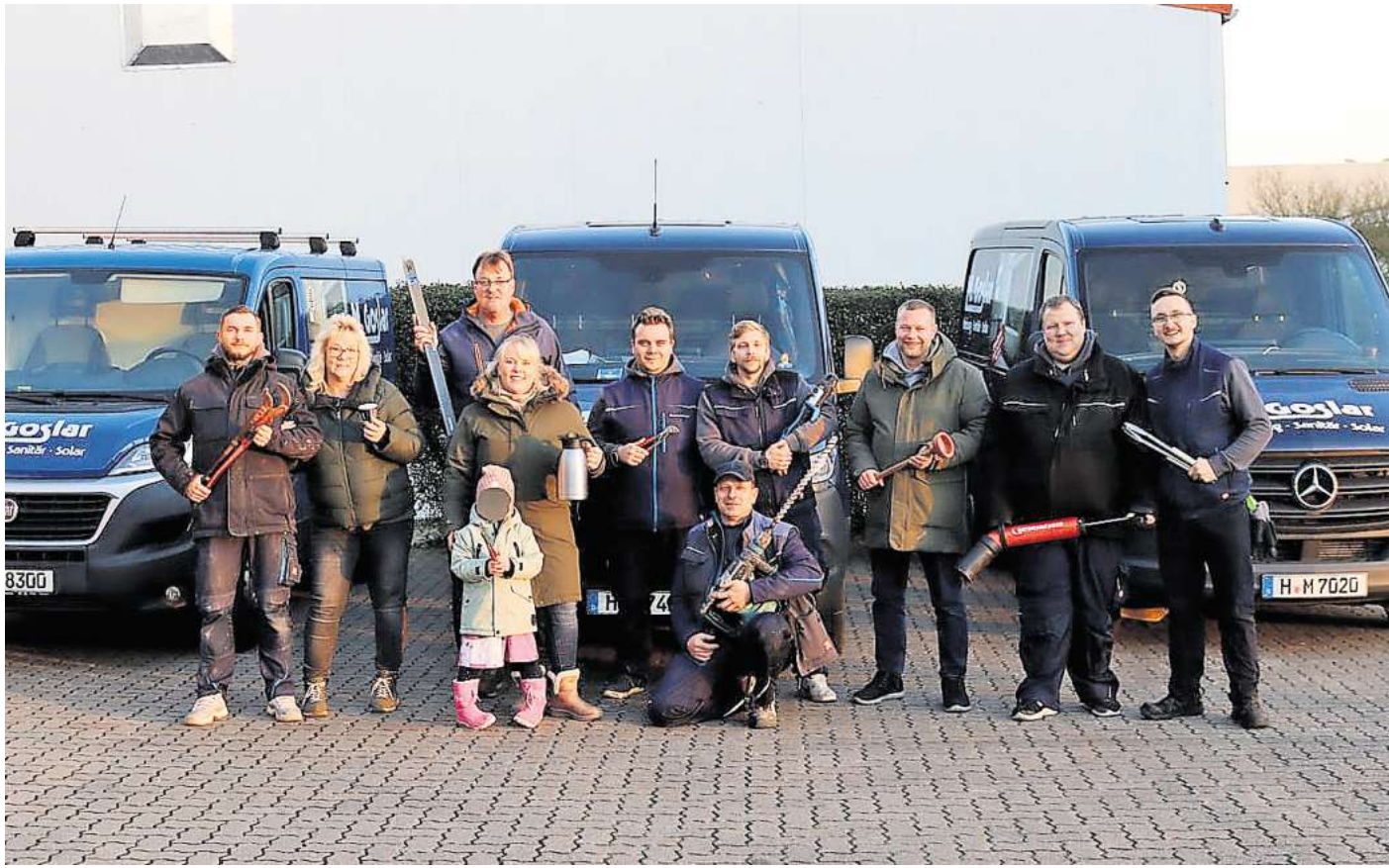
Handwerker-Team für Lehrte: Heizungs- und Wärmepumpen-Installation leistet die Firma Markus Goslar.

Rückblick auf den Wärmepumpen-Tag im Meisterbetrieb Markus Goslar