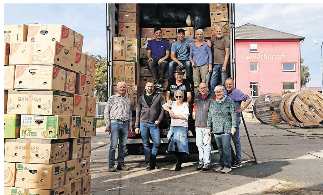
Einpacken für den Transport nach Moldawien: Hilfsgüter-Sammelstelle am Dia-Gewerbepark.

Am 3. Oktober war der 40-Tonner an der Sammelstelle auf dem DIA Gelände in Arpke von neun Helfern beladen worden. Die Probleme am hannoverschen Zoll konnten schnell beseitigt werden, und so startete der ukrainische Schwerlastler am 6. Oktober Richtung Osten und erreichte am 9. Oktober abends Chisinau, die Hauptstadt des Landes. Schon am nächsten Tag kamen die Kleintransporter aus allen Richtungen zur dortigen Entladestelle, denn schon im Voraus wird bei den Behörden angemeldet, welche Einrichtung was und wieviel bekommen. Kinderheime, Kindergärten und Kinderkrankenhäuser wurden als erstes bedacht. Zwei psychiatrische Kliniken und ein weiteres Krankenhaus in Transnistrien beluden ihren Transporter. Die 14 Tische und 80 Stapelstühle kamen einer Kirchengemeinde zugute, die ihren Kirch- und Unterrichtsraum damit ausstatten wird. Viele Bananenkartons werden auch unter Rentnern, kinderreichen Familien, Invaliden, Flüchtlingen aus der Ukraine und anderen hilfsbedürftigen Privatpersonen verteilt. Es wird noch eine ganze Weile dauern,