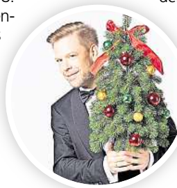
Mit Swing: Tom Gaebel spielt im Theater am Aegi.

Klezmer sowie Chanukka- und Musicals. Der Eintritt ist frei. ► Der Hannoversche Oratorienchor führt am Sonntag, 7. Dezember, ab 17 Uhr gemeinsam mit dem Barockensemble Concerto Ispirato in der Gartenkirche St. Marien, Marienstraße 35, Charentiers „Messe de Minuit pour Noël“ und weitere Werke auf. Der Eintritt ist frei. ► Der Heaven Can Wait Chor gastiert mit seinem „Christmas Special“ am Sonntag, 7. Dezember, ab 18 Uhr im Theater am Aegi. Tickets kosten 41,80 bis 62,50 Euro über HAZ/NP-Ticketshops. ► Das Junge Vokalensemble Hannover gestaltet das vorweihnachtliche Konzert „Europäische Weihnachten“ am Montag, 8. Dezember, ab 19.30 Uhr in der Gartenkirche St. Marien. ► Tom Gaebel und sein Orchester