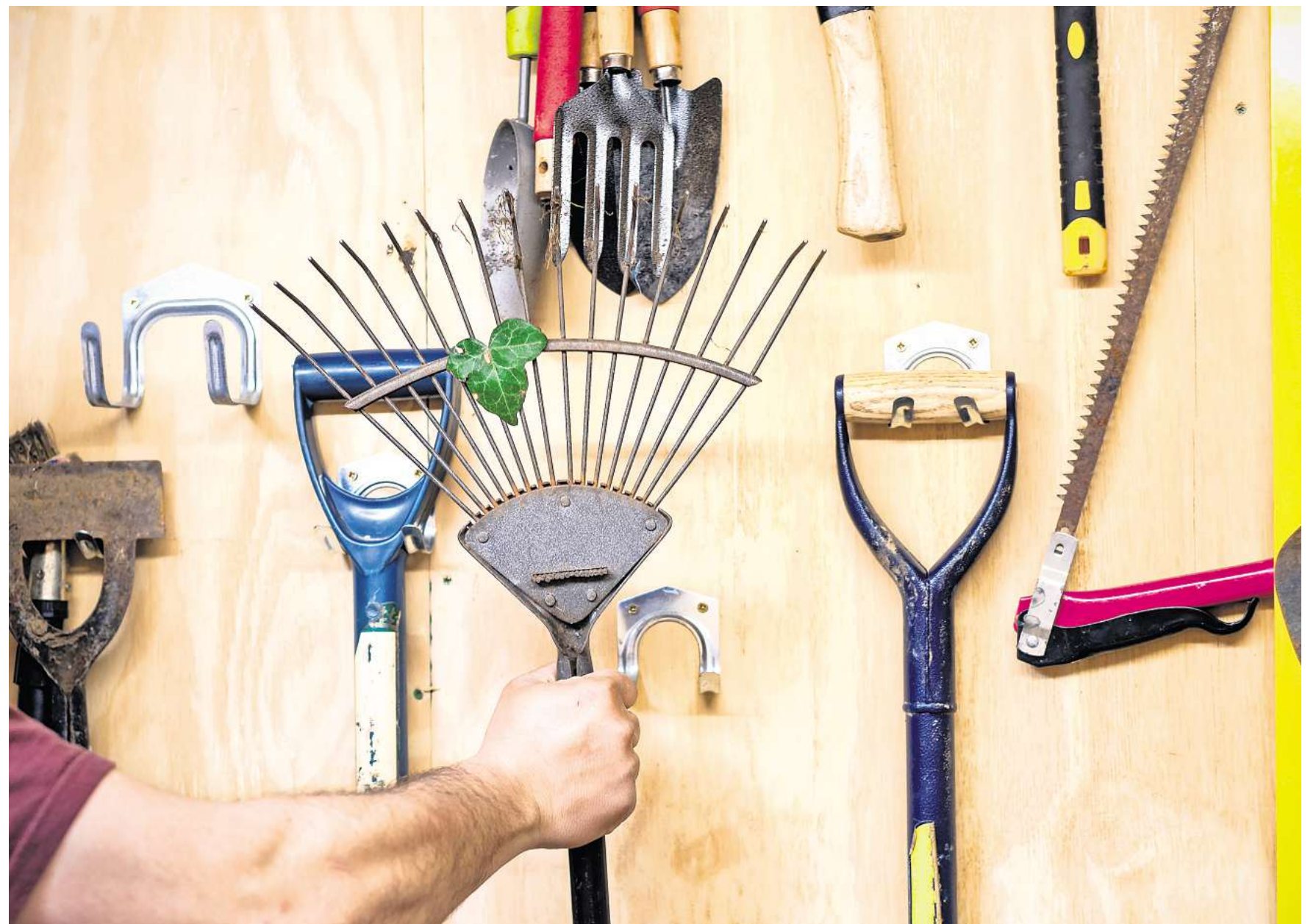
Stumpfe Werkzeuge machen die Gartenarbeit nicht nur anstrengender, sondern auch weniger effektiv.

Nach Reinigung und Schliiff steht der Schutz vor Rost und Verschleiß an. „Alle Metallflächen sollten mit einem feinen Ölfilm überzogen werden, um sie vor Feuchtigkeit zu schützen“, empfiehlt Surburg. Für Schneidekanten reiche herkömmliches Pflanzenöl vollkommen aus, alternativ eigne sich auch spezielles Rostschutzöl. Scharniere von Scheren oder Astsägen sowie Gewinde von Teleskopstielen oder verstellbaren Geräten erfreuten