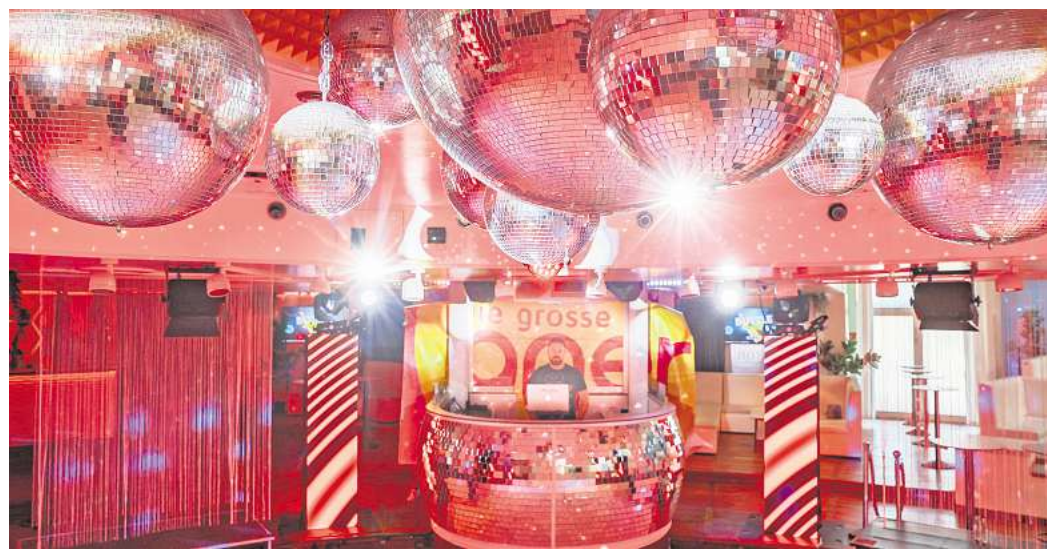
Schöne Glitzerwelt: In der Osho Baggi geht's am 19. Dezember auf Zeitreise in die Achtziger- und Neunziger.

Am Freitag, 19. Dezember, geht es zurück in die Achtziger und Neunziger. DJ Giorgio und Kanzler-DJ Michael Gürth stehen am Mischpult und spielen die legendären Hits aus dieser Zeit. Kein neomodisches Zeug. Oldschool. Ein besonderer Abend, der alte Erinnerungen weckt. „Für mich ist das ein ganz besonderes Fest. Ich bin selbst in diesen Disco-Zeiten groß gewor-