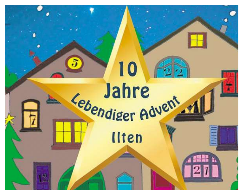
Das Jubiläums-Logo des Iltener „Lebendigen Advents“ ziert die neue Trinkbecher-Edition.