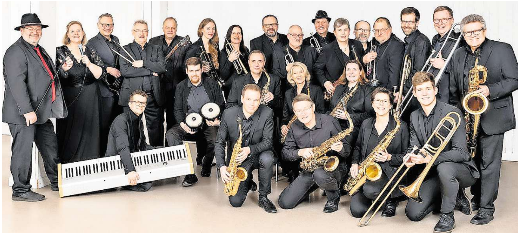
In Vorbereitung auf das Konzert Swinging Christmas: Die Big Band Ahlten.

Konzert des Vereins Swing Music am 29. November im Forum