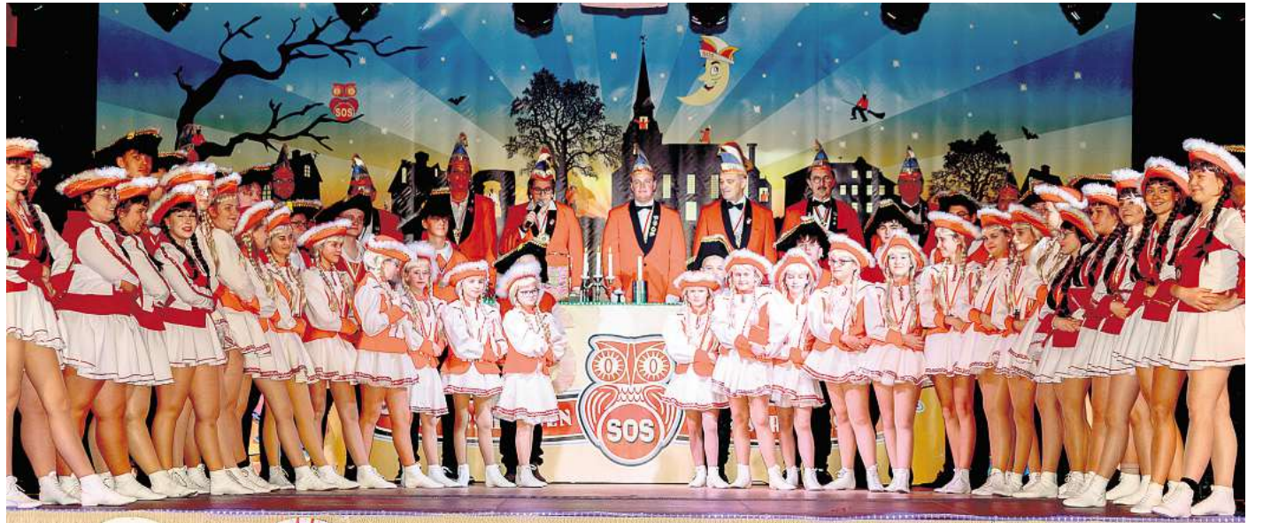
Prächtig ist der Karneval in Frickes Festsälen, Gäste sind willkommen.

Wie im Rheinland so beginnt die Karnevalszeit in Sievershausen auch am 11.11. eines Jahres. Da der Termin auf einen Wochentag fällt, werden die neuen Prinzenpaare jedoch am Sonnabend danach im Rahmen des Prinzenballs inthronisiert. Doch wer sind die neuen Prinzenpaare der Karnevals-Kampagne 25/26? Dieses ist eines der am besten gehüteten Geheimnisse des Lehrter Orts-