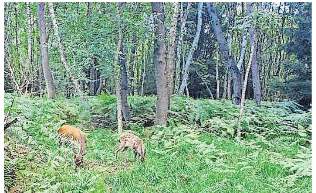
Der Erhalt des Rotwild-Bestands wird im Vortrag thematisiert.

Die Diplom-Biologin Reinhild Gräber wird zum Thema Rotwild und Lebensraumsansprüche referieren. Sie kennt die Rotwildvorkommen in Niedersachsen und beschäftigt sich mit der drohenden genetischen Verarmung die-