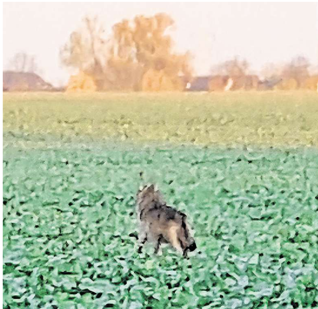
Am Montag um 8 Uhr war ein Wolf am Ortsrand zwischen Ilten und Ahlten unterwegs.

Weitere Informationen liefert Raoul Reding, der das Wolfsmo- nitoring in Niedersachsen leitet. Als Wolfsbeauftragter der Landesjägerschaft Niedersachsen