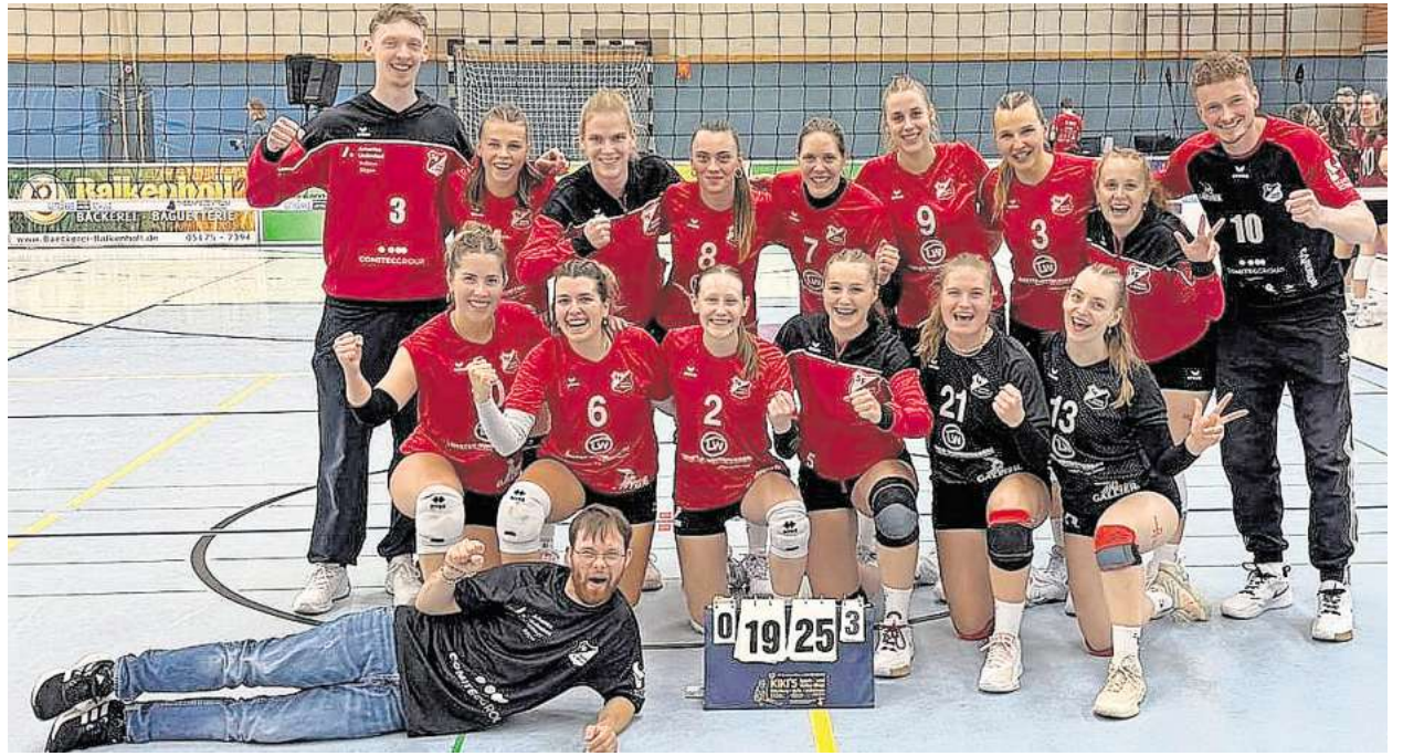
Die erste Damenmannschaft der SF Aligse freut sich über zwei gewonnene Spiele.

So sehr sich das Schüttorfer Team auch über die Aligser Vorlage freut hat, so wird es heute sicherlich keine Punktgeschenke an das Gallier-Team ver-