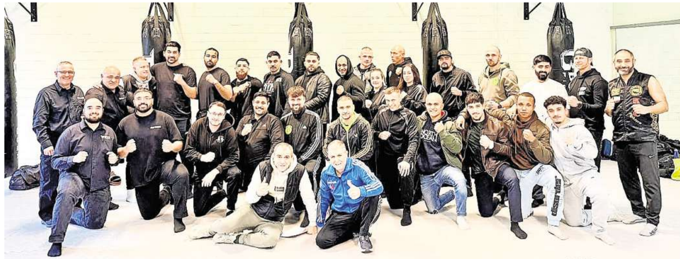
Großer Teamgeist im SV Yurdumspor: Tigers Fight Club Lehrte.

Erfolg für den SV Yurdumspor, gelungene Premiere für das Fight Club Team