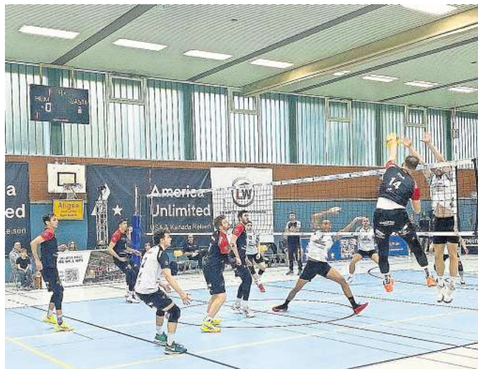
Bereits im Vorjahr boten die Schüttorfer eine starke Leistung gegen die Aligser Volleys.

keit und Konzentration brauchen, um erfolgreich zu sein,“ so Urbanek, der sein Team erneut in der Rolle des Underdogs sieht. Dass die Mannschaft aus dieser Position heraus durchaus zum Punktgewinn kommen kann, hat sie bereits beim TuS Mondorf bewiesen, dem sie über weite Strecken ein ebenbürtiger Geg-