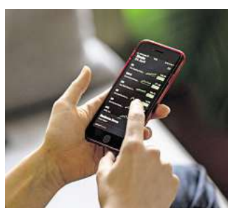
Aktien und Fonds günstig kaufen und verkaufen? Damit werben einige Depotanbieter.

Außerdem gut zu wissen: Wer mit einem Wertpapierdepot zu einer anderen Bank wechseln möchte, sollte aufpassen, nicht ungewollt und unbewusst in eine Steuerfalle zu tappen, sagt Scherfling. Denn nur Überträge auf ein Depot, das auf den eigenen Namen läuft, sind steuerlich nicht relevant. Anders sieht es bei Übertragungen auf einen anderen Na-