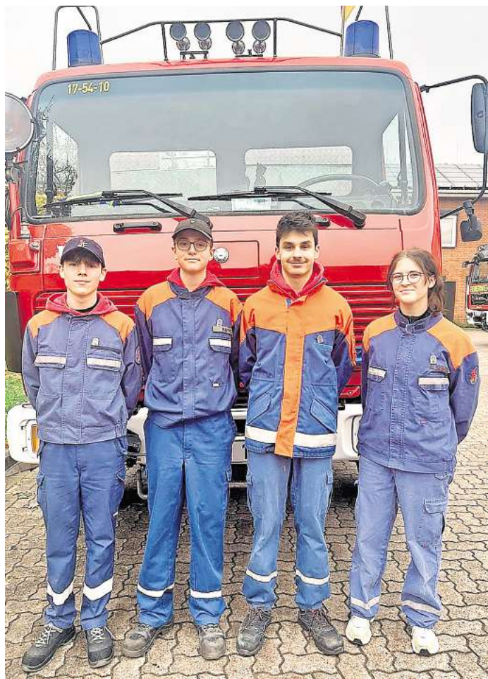
Vier Kameraden der Jugendfeuerwehr Rethmar haben das Abzeichen Jugendflamme 3 erhalten.

„Die höchstmögliche Auszeichnung, die ihr persönlich erhalten könnt!“, betonte Lars Hedwig, Fachbereichsleiter Wettbewerbe der Regionsjugendfeuerwehr Hannover freudstrahlend, während der Verleihung der Jugendflamme 3 an alle beteiligten Jugendlichen. Insgesamt hatten sich mehr als 30 Jugendliche aus der gesamten Region Hannover in Empelde versammelt, um die Prüfungen für das begehrte Abzeichen zu absolvieren. Die Voraussetzungen sind umfassend. Im Vorfeld mussten die Teilnehmer einen Erste-Hilfe-Schein erwerben und ein soziales oder sportliches Engagement außerhalb der Jugendfeuerwehr nachweisen. Am Prüfungstag wurden feuerwehrtechnische Fertigkeiten geprüft. Dazu gehörte, einen doppelt gerollten C-Schlauch in unter 43 Sekunden auszurollen, und einfach wieder aufzurollen, sowie einen sogenannten Rettungsknoten an einem