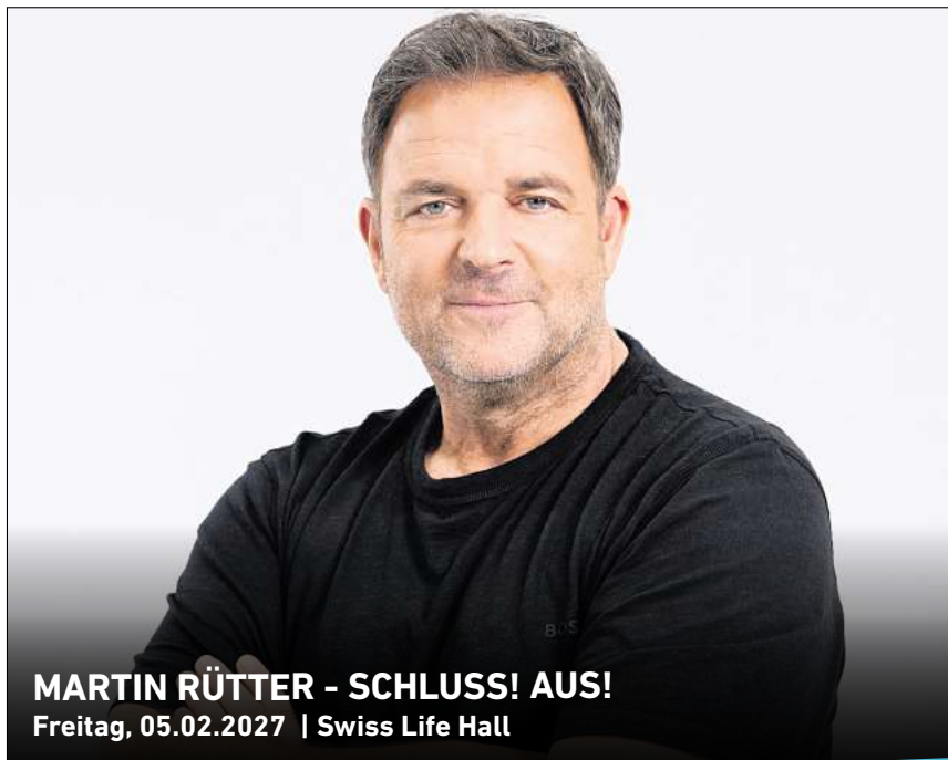
MARTIN RÜTTER - SCHLUSS! AUS! Freitag, 05.02.2027 | Swiss Life Hall

Ihr persönlicher Ticketservice der HAZ & NP