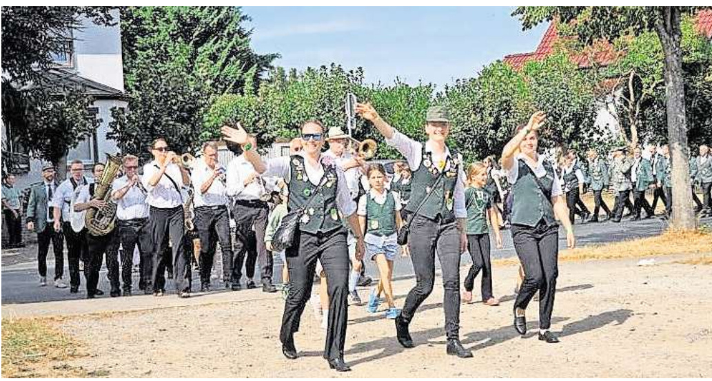
Schützenumzug in Wassel Anfang September.