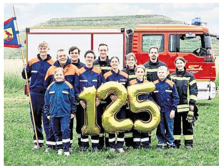
Jubiläum mit beachtlicher Zahl: Ortsfeuerwehr Wassel.

Abseits des Festprogramms herrschte ausgelassene Stimmung auf dem Schützenplatz. Mit Autoscooter, Kinderkarussell und einer Vielfalt an Speisen und Getränken war für jeden Geschmack etwas dabei. Den krönenden Abschluss bildete eine große Party mit DJ.