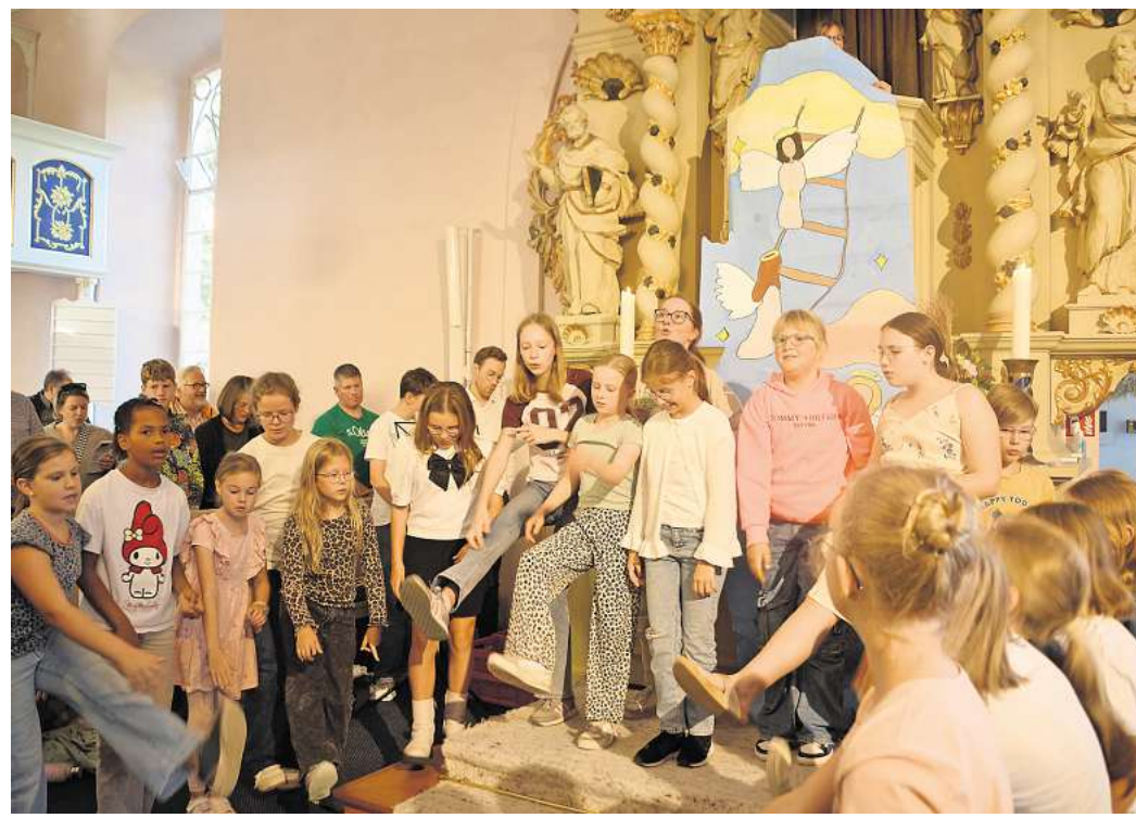
Mitmachen in der Kreuzkirche: Musical-Gottesdienst mit Kindern und Jugendlichen.