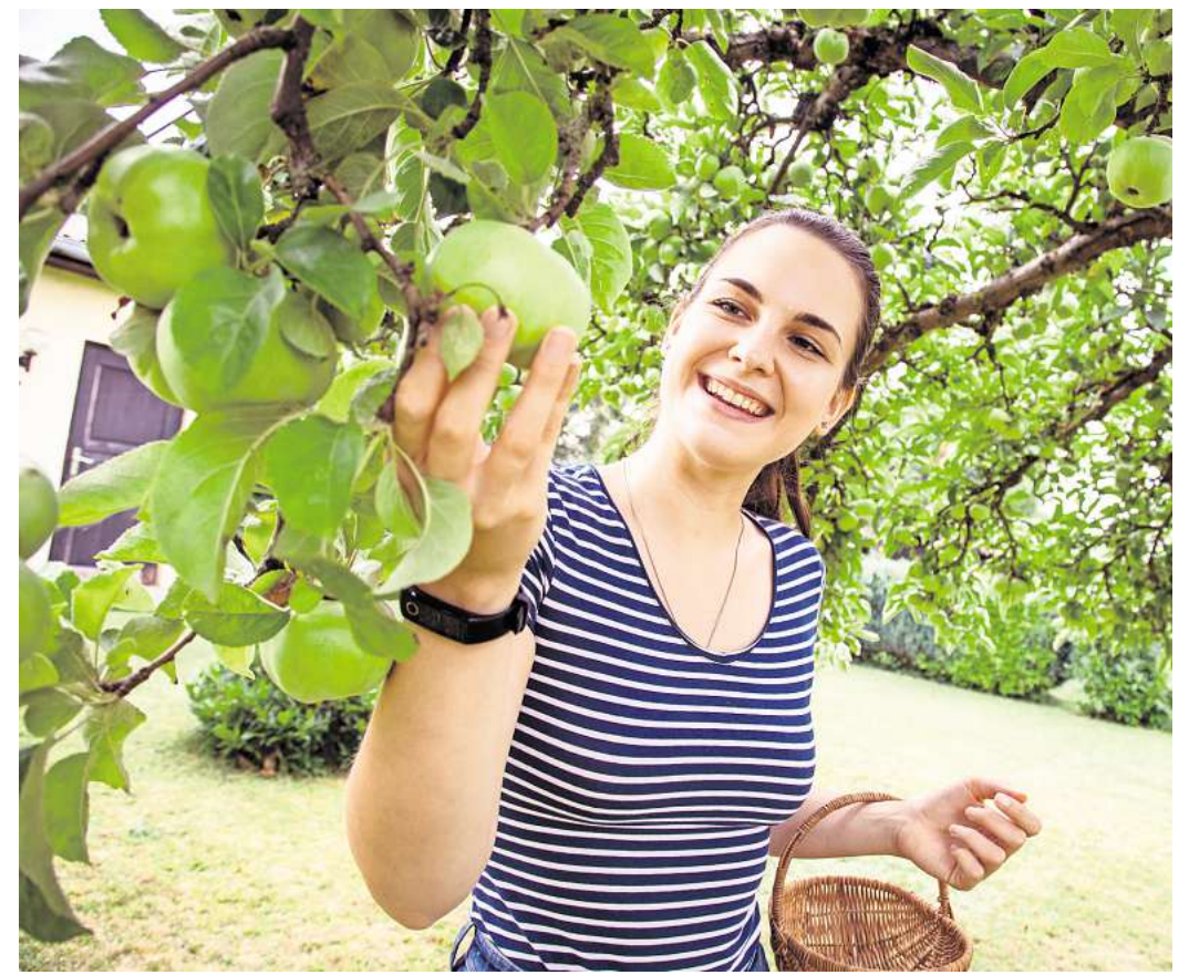
Weder pralle Sonne noch Regen: Das Wetter spielt bei der Ernte von Äpfeln eine wichtige Rolle.

► 2. Reife Äpfel erkennen Anhand der Färbung der Schale oder der Kerne lässt sich nur bedingt ablesen, ob Äpfel wirklich reif sind. Stattdessen kann man es mit der sogenannten Kipp-Probier herausfinden. Und so funktioniert es: den Apfel am Zweig um bis zu 90 Grad nach oben biegen. Wenn sich die Frucht mitsamt Stiel einfach vom Zweig löst, ist sie reif und darf den Baum verlassen. Bleibt