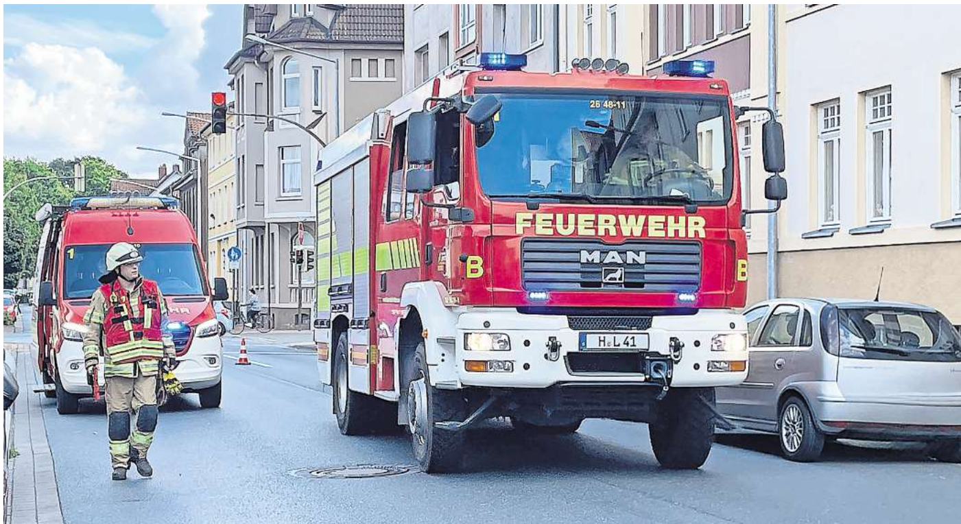
Eintreffen der Einsatzfahrzeuge an der Ahlthener Straße.

ßend die Wohnung und konnten diese anschließend wieder an die Bewohner übergeben. Während des Einsatzes musste die Ahlthener Straße zwischen der Köthenwaldstraße und dem Westring kurzzeitig voll gesperrt werden. Im Einsatz war die Ortsfeuerwehr Lehrte mit 13 Einsatzkräften und drei Fahrzeugen, der Feuerwehrpressesprecher und der Rettungsdienst.