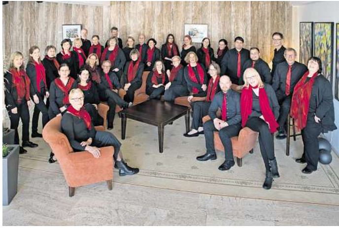
Der Popchor „Voices of Harmony“ lädt zum Konzert ein.

Konzert „A Million Dreams“ am Sonntag, 21. September