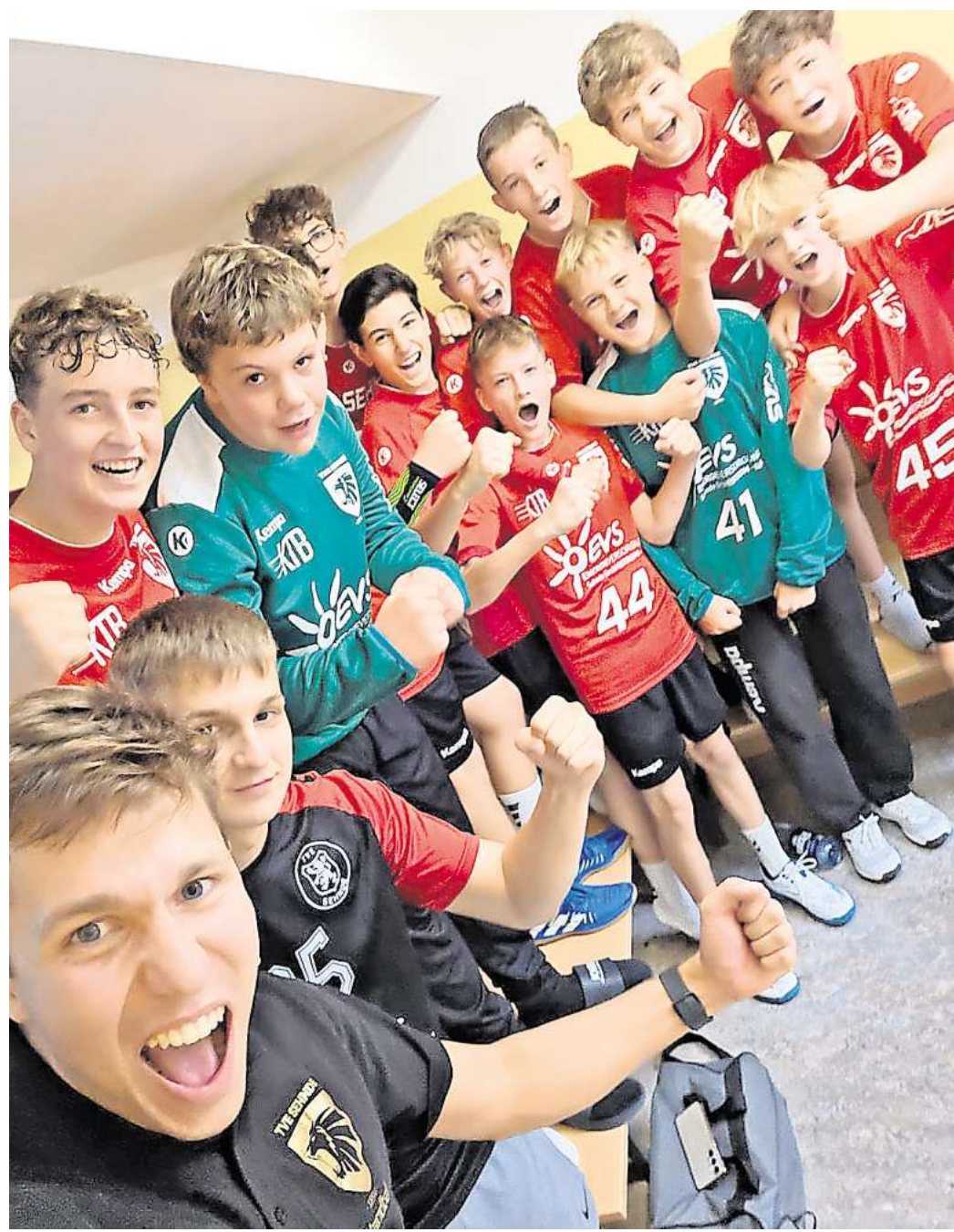
TVE-Jubel: Die Handball-Jungs der C-Jugend feiern den Saisonauftakt.