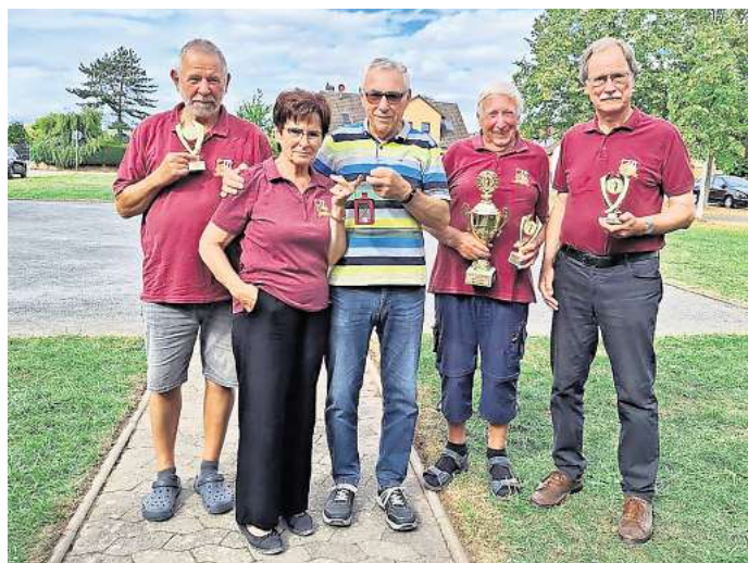
Sieger und Platzierte der Boule-Meisterschaft in Rethmar.

Interne Meisterschaft beim Boule Club Rethmar