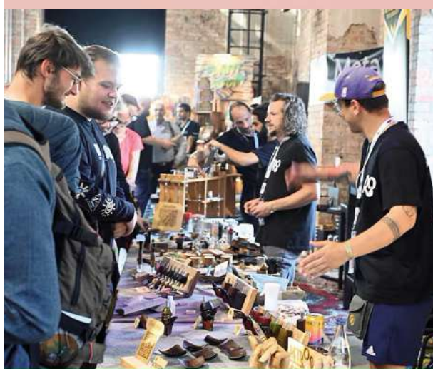
Großer Andrang herrschte 2024.