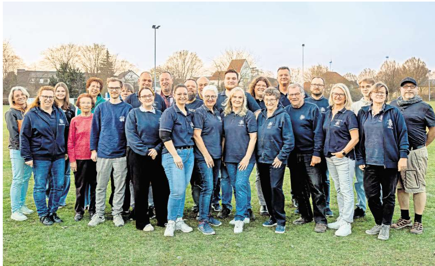
Eingespieltes Team: Zur Brummerbühne gehören 35 Mitglieder, darunter Spieler, Bühnenbauer, Bühnentechniker, Catering, Souffleuse und Maske.

Neues Stück: Premiere für „Haarige Zeiten“ am 25. Oktober