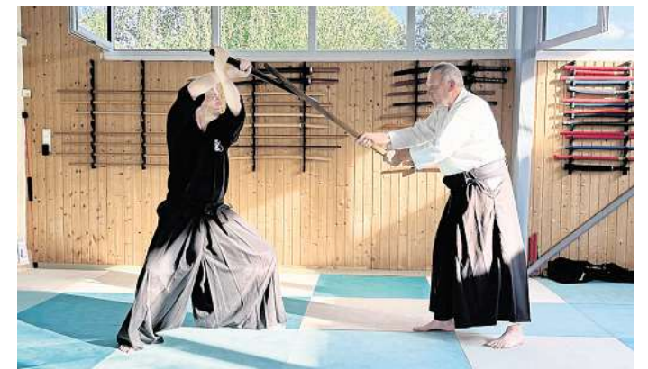
Kyushin Iaido Ken-Jutsu wird im Aiki-Dojo Sehnde vermittelt.

SEHNDE. Das Aiki-Dojo bietet einen kostenlosen Schnupperkurs zum Thema Kyushin Iaido Ken-Jutsu. Dieser Kurs ist offen für Personen im Alter ab 16 Jahre und findet jeweils am Freitag statt: erster Termin 10. Oktober, letztes Training am 31. Oktober. In der Zeit von 18 bis 19.30 Uhr können Interessierte am Training teilnehmen und einen Einblick in diese traditionelle japanische Schwertkampfkunst bekommen. Iaido enthält die alten Kampftechniken der Samurai. Im Iaido gibt es keine Auseinandersetzung mit einem realen Gegner. Es wird mit einem imaginären Gegner gekämpft. Diese Übung (Kata) wird mit einer stumpfen Nachbildung eines Samuraischwert (Iaito) durchgeführt. Um das Verständnis der Techniken aus dem Iaido zu vertiefen, werden diese durch Schwertanwendungen mit Partnern geübt. Für die Ken-Jutsu-Übungen wird ein Holzsword (Bokken) verwendet. Das Training baut sich folgendermaßen auf: In einer Auf-