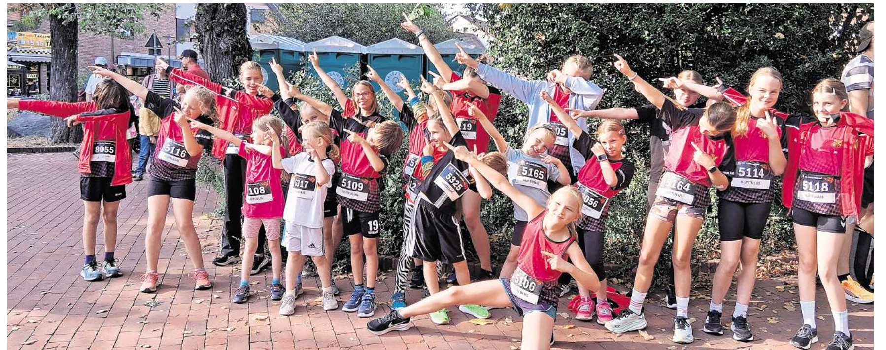
MTV-Teilnehmer beim Citylauf.