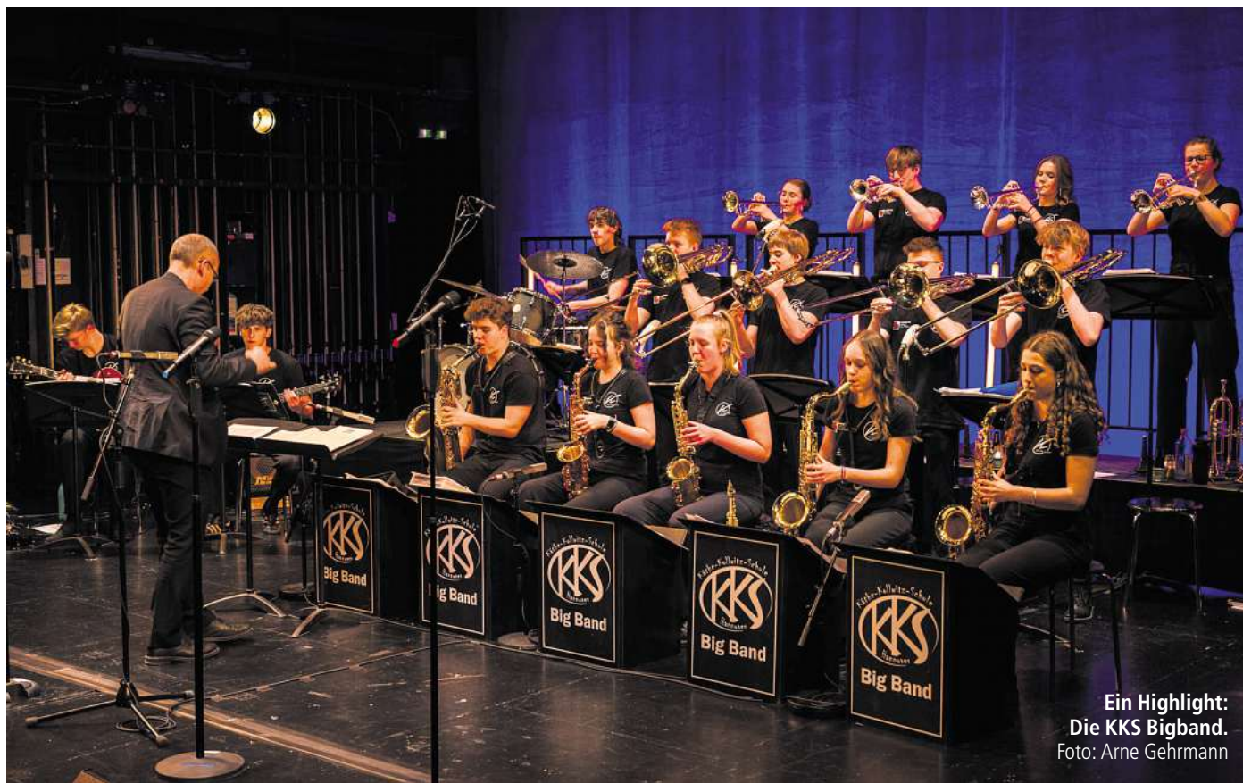
Ein Highlight: Die KKS Big Band.

Jedes fünfte Los ist hier ein Gewinn. Wenn der Stadtteil feiert, darf Live-Musik natürlich nicht fehlen, und die gibt es auf den vier Bühnen an beiden Tagen