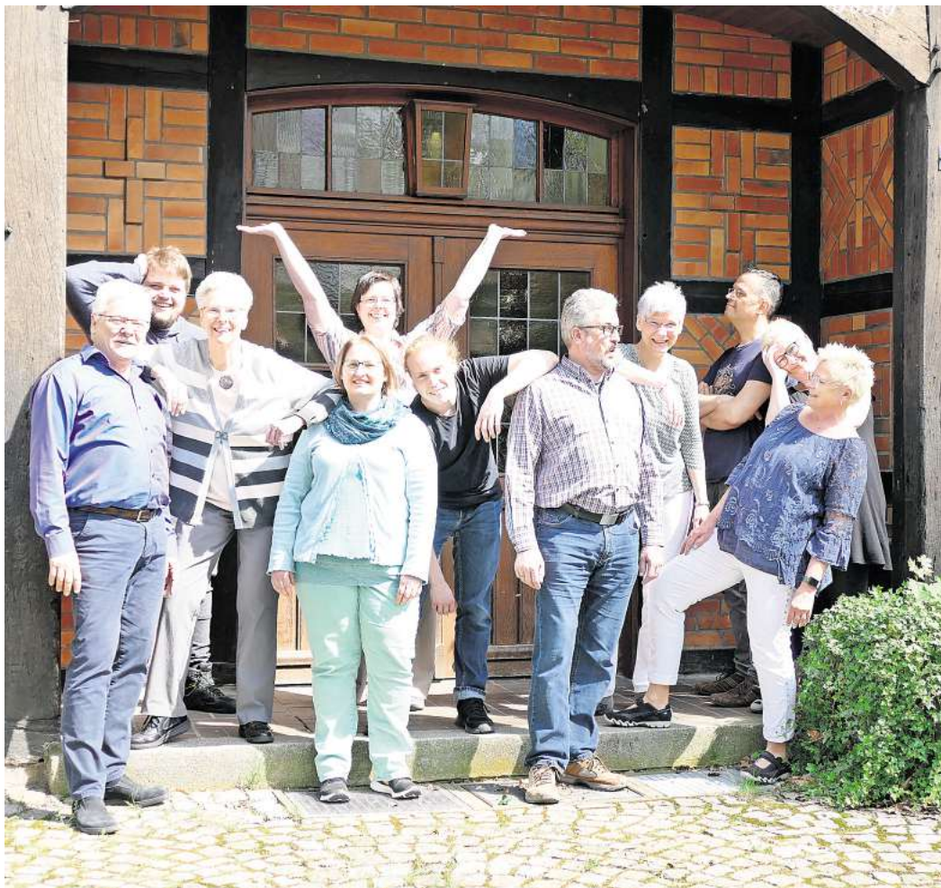
Das ensemble vis-à-vis lädt zum Konzert ein.

So ist im September also ein vielfältiges Chorprogramm zu hören und mancher wird vielleicht animiert, hier oder da mitzusingen. Das „ensemble vis-à-vis“ kann man per E-Mail vav@doppelterz.de erreichen, auch, um Probentermine zu erfahren. Nach dem Konzert beginnt ein neuer Probenabschnitt.