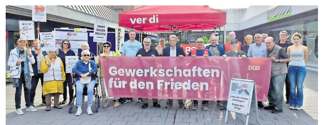
DGB-Präsenz zum Antikriegstag im neuen Zentrum.