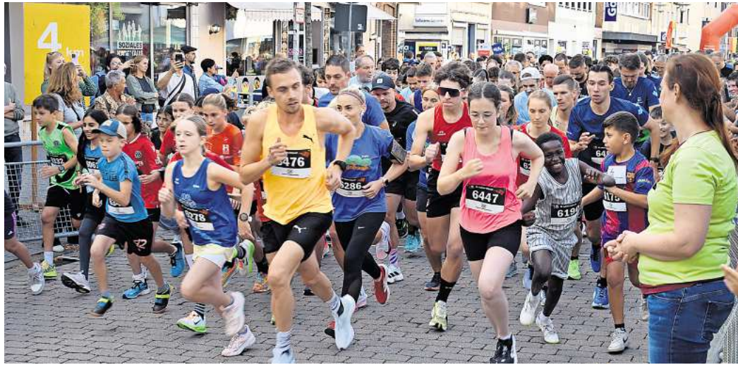
Los geht's: Beim Zwei-Kilometer-Lauf sind ambitionierte Sportler ebenso dabei wie Kinder, Jugendliche und Gelegenheitsjogger.