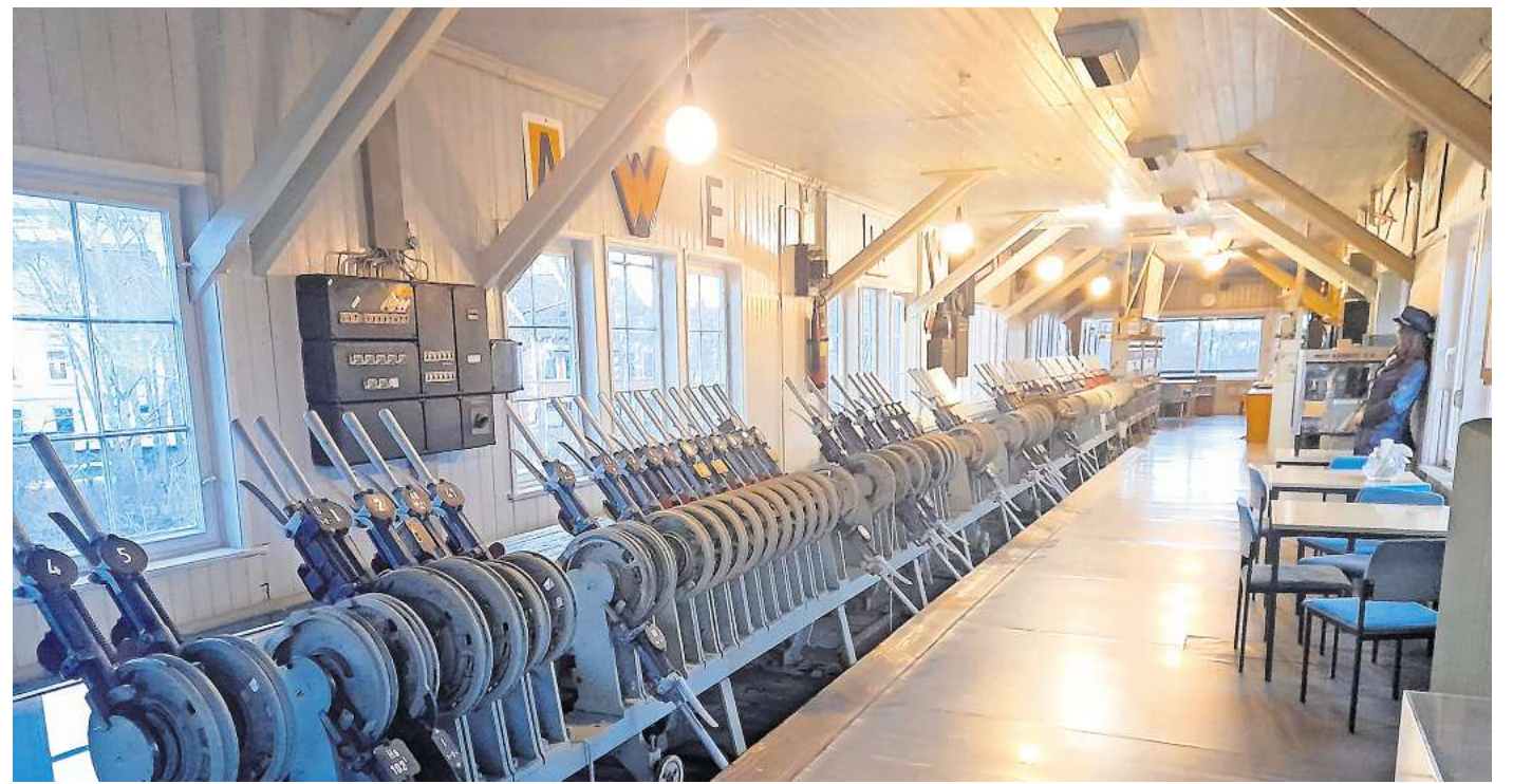
Technik ist im Stellwerk-Museum in beeindruckender Weise erhalten.

Modelleisenbahnverein lädt für 14. September ein