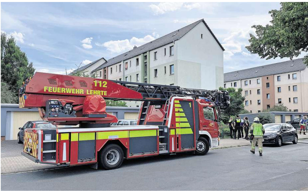
Drehleiter auf Goethestraße.

LEHRTE. Am 4. Juli wurde die Ortsfeuerwehr um 16.12 Uhr zu einem Küchenbrand in einem Mehrfamilienhaus an der Goethestraße alarmiert. Aufgrund der starken Rauchentwicklung und des betroffenen Gebäudetyps wurde die Alarmstufe erhöht. Somit wurden zusätzlich die Ortsfeuerwehren Steinwedel und Aligse sowie ein Fahrzeug aus Ahlten nachalarmiert. Beim Eintreffen der ersten Einsatzkräfte bestätigte sich die Lage: Eine Küche im dritten Obergeschoss stand in Vollbrand. Zu diesem Zeitpunkt befanden sich keine Personen mehr in der brennenden Wohnung. Alle Bewohner hatten das Gebäude bereits verlassen.