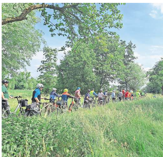
Börderegion-Tour: 50 Radfahrer unterwegs.

Das Dorffest in Groß Lobke war der perfekte Abschluss der Tour, obwohl noch ein Regenschauer niederging. Teilnehmer hatten die Möglichkeit, sich zu stärken und die gemeinsame Zeit zu genießen.