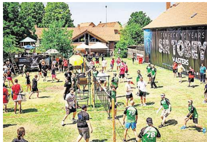
Vier Spielfelder wurden gleichzeitig genutzt.

Bei aller Feierlaune stand auch ein bisschen Sport im Mittelpunkt: In zwei Ligen traten die Teams gegeneinander an und schenken sich bis zum Finale nichts. Die Partien waren geprägt von Fairness und beeindruckendem sportlichem Niveau. Im Finale wurde jeder