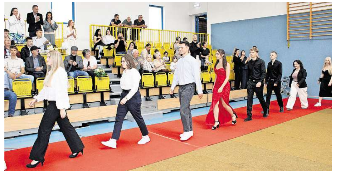
Zum Abschluss: Der IGS-Jahrgang 2025 marschiert ein.