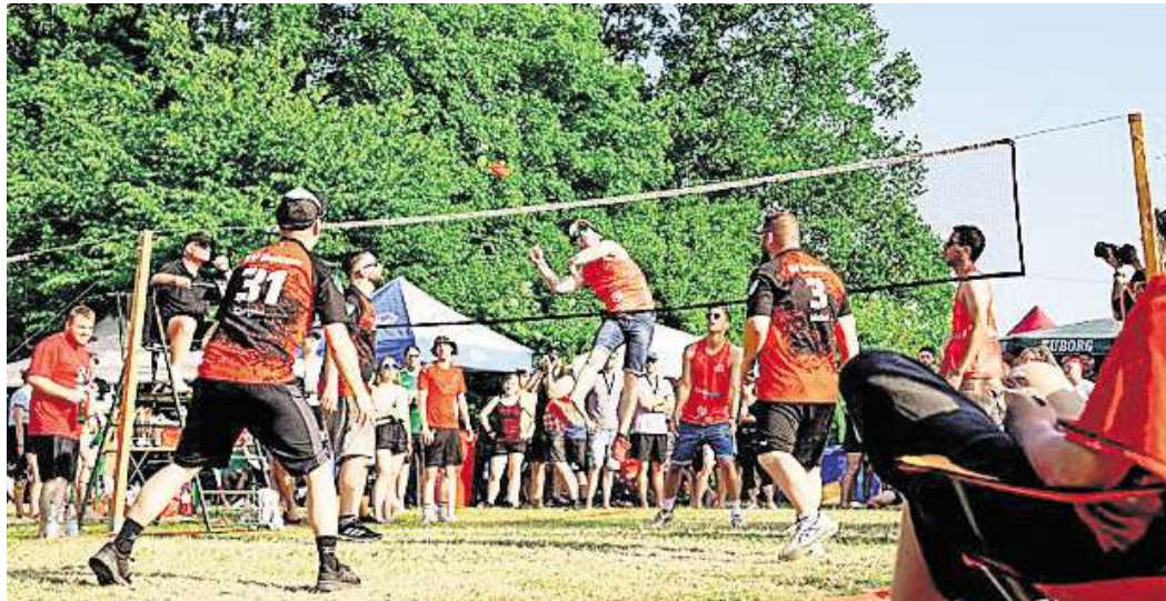
Indica-Finale auf der Bürgerwiese.

Mit zunehmender Mittagshitze wurden die zwei extra aufgestellten Pools zum beliebtesten Anziehungspunkt leicht abseits der Spielfelder. Viele Spielerin-