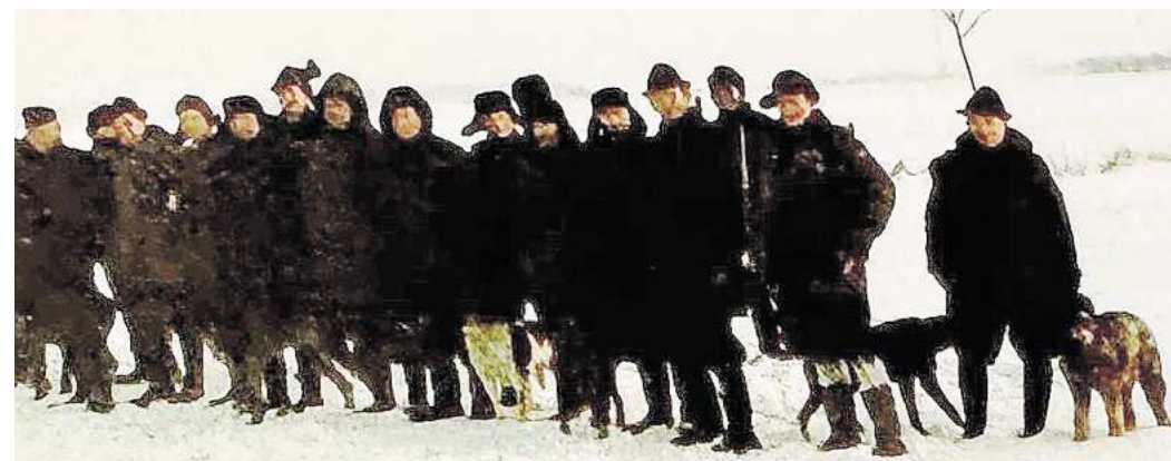
Jagd Anno 1981: Einheitlich grüne oder braune Kleidung ist seinerzeit getragen worden. Heute ist Signalfarbe aus Sicherheitsgründen Pflicht.

Denn seiner Meinung nach sollten die Sorgen und Nöte der Tierhalter wegen gerissener Pferde, Kühe und Schafe durchaus ernst genommen werden als bisher. Dafür wünscht sich Scholz mehr Initiative von der Politik und fordert vor allem „gesunden Menschenverstand“ von den Entscheidungsträgern ein.