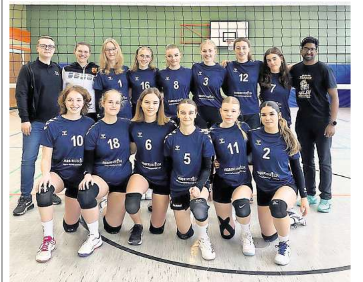
Volleyball-Damen des MTV Rethmar mit Vertretern des Sponsors Hahn Lacke.

als auch außerhalb zeigte das Team eine gute Harmonie, die sich positiv auf die Leistungen auf dem Feld ausgewirkt hat. Besonders in knappen Situationen war zu sehen, wie die Spielerinnen sich gegenseitig unterstützten und als Einheit agierten“, so die Vereinsmitteilung. Besonderer Dank gelte dem Sponsor, Firma „Hahn Lacke“, der die neuen Trikots der Damenmannschaft ermöglicht hat. In frischem Look und mit zusätzlicher Motivation ausgestattet, gingen die Spielerinnen auf das Feld.