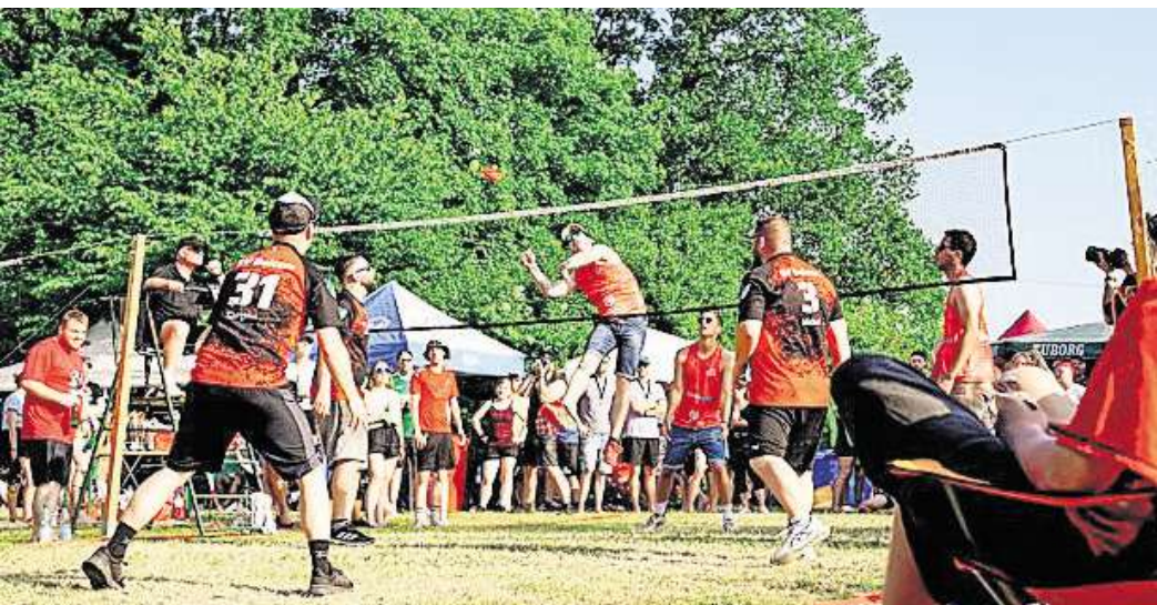
Indica-Finale auf der Bürgerwiese.

Mit zunehmender Mittagshitze wurden die zwei extra aufgestellten Pools zum beliebtesten Anziehungspunkt leicht abseits der Spielfelder. Viele Spielerin-