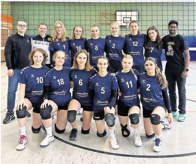
Volleyball-Damen des MTV Rethmar mit Vertretern des Sponsors Hahn Lacke.

als auch außerhalb zeigte das Team eine gute Harmonie, die sich positiv auf die Leistungen auf dem Feld ausgewirkt hat. Besonders in knappen Situationen war zu sehen, wie die Spielerinnen sich gegenseitig unterstützten und als Einheit agierten“, so der Vereinsmitteilung. Besonderer Dank gelte dem Sponsor, Firma „Hahn Lacke“, der die neuen Trikots der Damenmannschaft ermöglicht hat. In frischem Look und mit zusätzlicher Motivation ausgestattet, gingen die Spielerinnen auf das Feld.