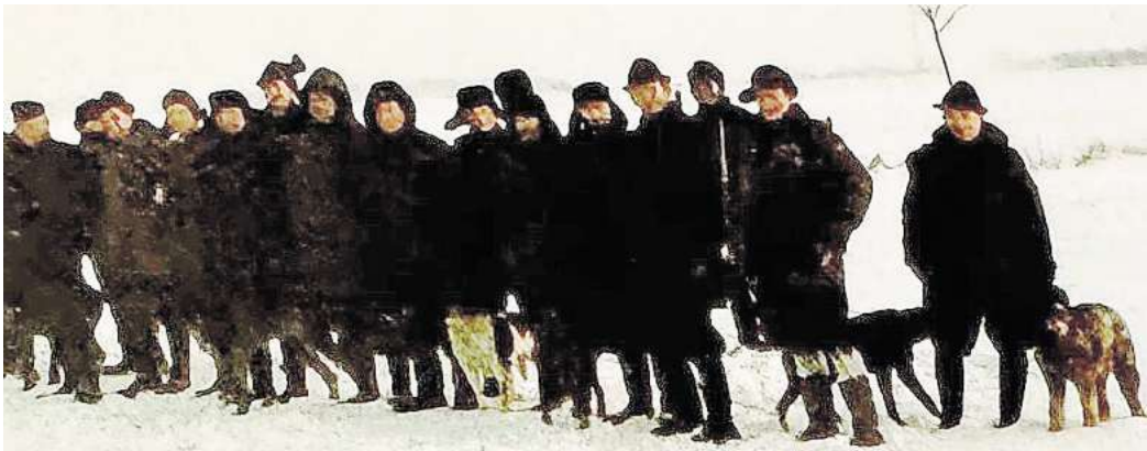
Jagd Anno 1981: Einheitlich grüne oder braune Kleidung ist seinerzeit getragen worden. Heute ist Signalfarbe aus Sicherheitsgründen Pflicht.

Jäger fordert mehr „gesunden Menschenverstand“ „Der Wolf hat seinen Erhaltungszustand längst erreicht“, betont der Lehrter. Scholz sagt aber auch, dass er die Rückkehr des Wolfes durchaus begrüßt. Mit Blick auf die vielen Rudel allein in Niedersachsen fordert er aber eine verhaltene Jagd auf den sogenannten Spitzenprädatoren, der also keine natürlichen Feinde hat. Denn seiner Meinung nach sollten die Sorgen und Nöte der Tierhalter wegen gerissener Pferde, Kühe und Schafe durchaus ernster genommen werden als bisher. Dafür wünscht sich Scholz mehr Initiative von der Politik und fordert vor allem „gesunden Menschenverstand“ von den Entscheidungsträgern ein.