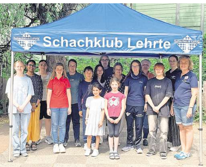
Sommerliche Atmosphäre kommt im Schachklub gut an.