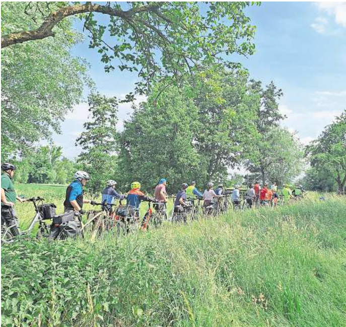
Börderegion-Tour: 50 Radfahrer unterwegs.

Das Dorffest in Groß Lobke war der perfekte Abschluss der Tour, obwohl noch ein Regenschauer niederging. Teilnehmer hatten die Möglichkeit, sich zu stärken und die gemeinsame Zeit zu genießen.