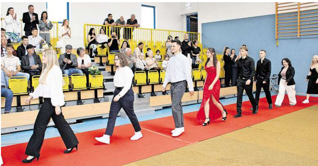
Zum Abschluss: Der IGS-Jahrgang 2025 marschiert ein.