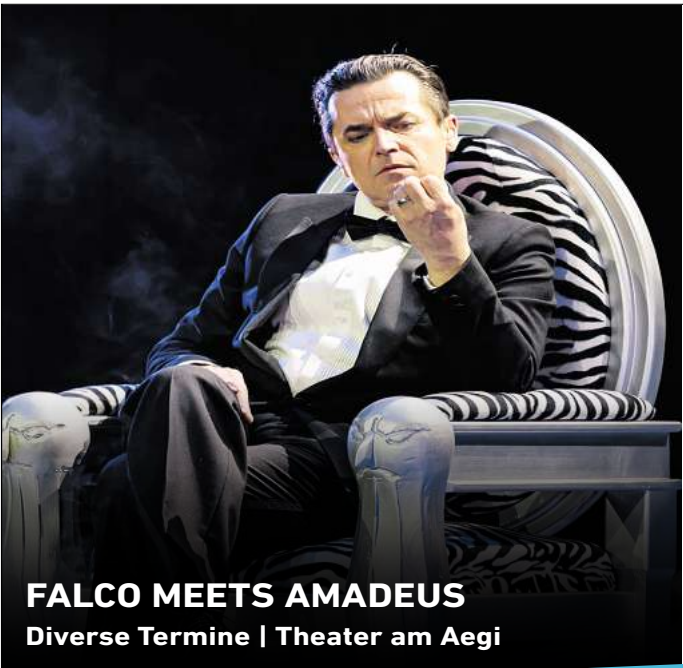
FALCO MEETS AMADEUS Diverse Termine | Theater am Aegi