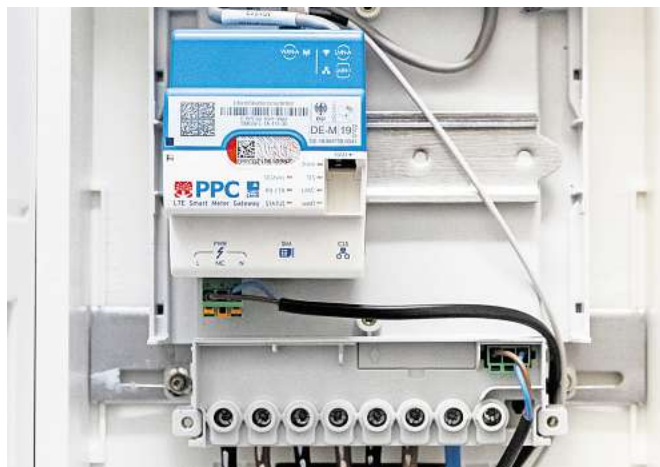
Smart Meter ermitteln den Stromverbrauch und können die erhobenen Daten direkt etwa an den Stromversorger oder den Netzbetreiber versenden.

Wichtig zu wissen für Wohnungseigentümergeinschaften: Der Zählerschrank gehört zum Gemeinschaftseigentum.