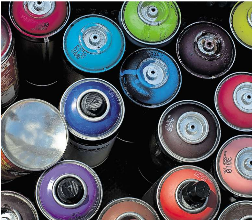
Auf Gefahrenhinweise achten – selten sind Spraydosen komplett leer, daher gehören sie auf den Wertstoffhof.

Farben, Lacke und Pinselreiniger sowie deren Reste haben im Abwasser nichts zu suchen. Die darin enthaltenen Chemikalien können Gewässer gefährden oder Abflussrohre verstopfen, so die Verbraucherzentrale NRW. Man muss sie also als Sondermüll entsorgen. Auch Holzschutzmittel, Abbeizmittel, Verdüner und deren Reste muss man zu den städtischen Sondermüllsammelstellen bringen. Das gilt auch für das Reinigungswasser, in dem man Pinsel und Rollen ausgewaschen hat. Auch das ist Sondermüll, sagt Marieke Mariani. Angetrocknete Dispersionsfarben, die man etwa zum Streichen von Raufasertape-