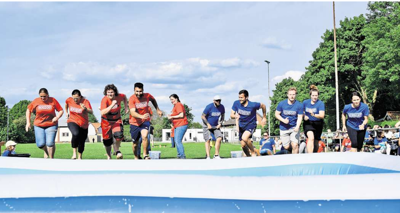
Die nicht ganz ernst gemeinte Dorffehde bringt Spaß für die ganze Familie.

Jede Menge Spiel und Spaß für die ganze Familie