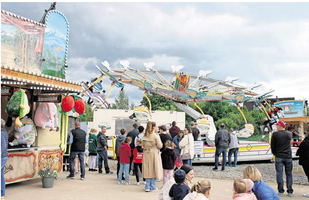
Zurück am traditionellen Ort: Zu ihrem 75-jährigen Bestehen hat die Sehnder Schützengesellschaft wieder auf dem Festplatz an der Chausseestraße gefeiert.

Allerdings lief das Sehnder Schützenfest 2025 unter erhöhten Sicherheitsvorkehrungen. Die Stadt hatte zur Prävention gegen mögliche Anschläge Maßnahmen zur Gefahrendabwehr angeordnet. So war der Zugang zum Festgelände auf einen schmalen Eingang begrenzt, und der Platz wurde durch Fahrzeuge an den Rändern geschützt. Behrens sah in diesen Vorkehrungen keine große Einschränkung. „Wir