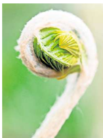
Majestätisch: Königsfarn ist einer der größten Farne für den Garten.