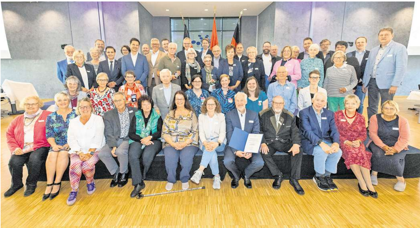
Die Region Hannover hat Ehrenamtliche aus unterschiedlichen Kommunen ausgezeichnet.

Mit inklusivem Anspruch und hohem persönlichen Einsatz setzen sich die hauptsächlich weiblichen Mitglieder für ein friedliches Miteinander und gesellschaftliche Teilhabe ein. Aktuell zählt der Verein 33 Mitglieder im Alter von 18 bis 62 Jahre. Der Verein hat sich schnell zu einer wichtigen Säule der Burgdorfer