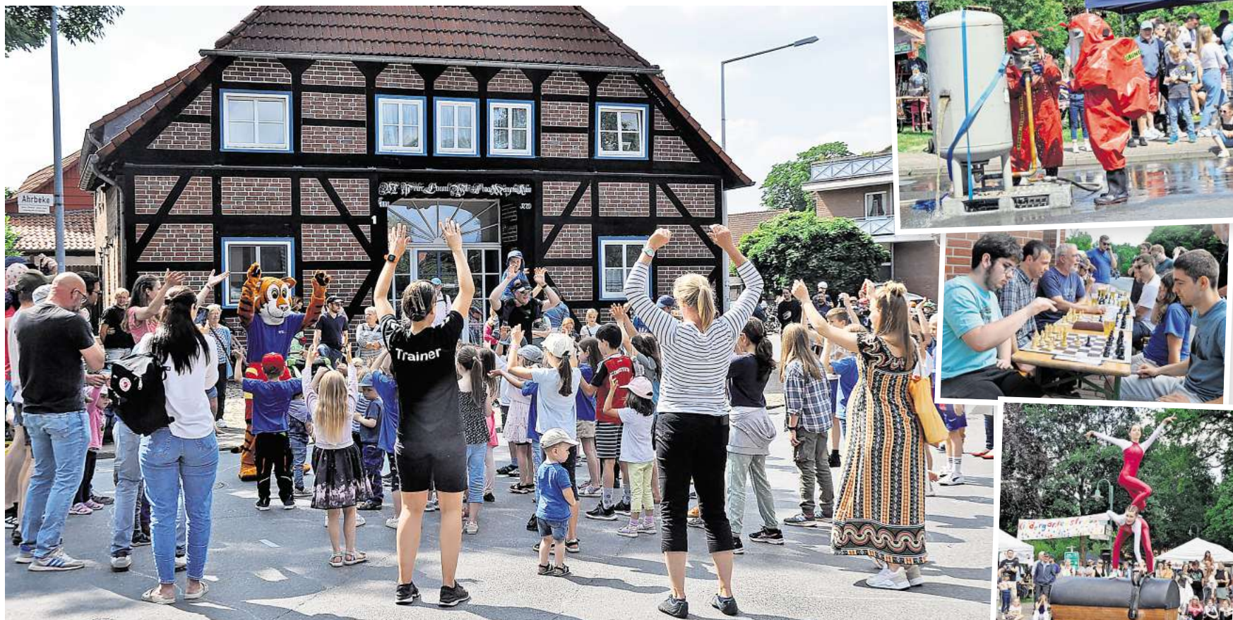
Tanz mit dem Turntigger – Groß und Klein machen mit (Bilder im Uhrzeigersinn von links nach rechts unten). Arpker Feuerwehrmänner der ABS-Sondereinheit zeigen, wie sie einen Behälter mit chemischen Gefahrenstoffen abdichten. Der Schachklub Lehrte bittet zum Spiel, und der Voltigier-Verein zeigt Übungen auf dem Trainingspferd aus Holz.

Beeindruckende Darbietungen und spannende Spiele an beiden Tagen