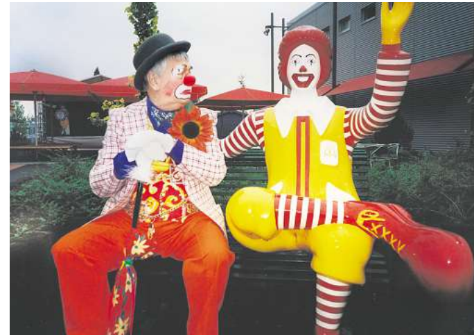
Jeremy Deller, Performance: „Has The World Changed or Have I Changed?“, Expo2000, Hannover

morvoll inszenierte Kettenreaktion, die zu einem Meilenstein der Videokunst des 20. Jahrhunderts wurde. Während Ryan Gander eine animatronische Maus herumknabbern lässt, erschafft Rivane Neuenschwander