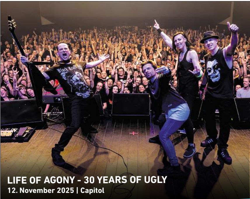
LIFE OF AGONY - 30 YEARS OF UGLY 12. November 2025 | Capitol

Ihr persönlicher Ticketservice der HAZ & NP