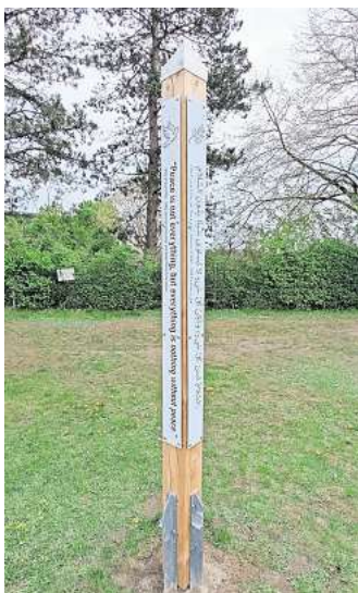
In unterschiedlichen Sprachen wirbt der Pfahl für Frieden.