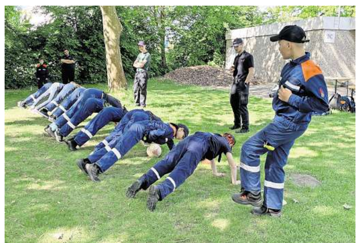
Jugendfeuerwehr Lehrte beim "menschlichen Tunnelschießen" Sportlich: Beim „lebendigen Tunnelschießen“ ist voller Körpereinsatz gefragt.

Sportlich ging es beim „lebendigen Tunnelschießen“ zu. Dabei mussten die Jugend-