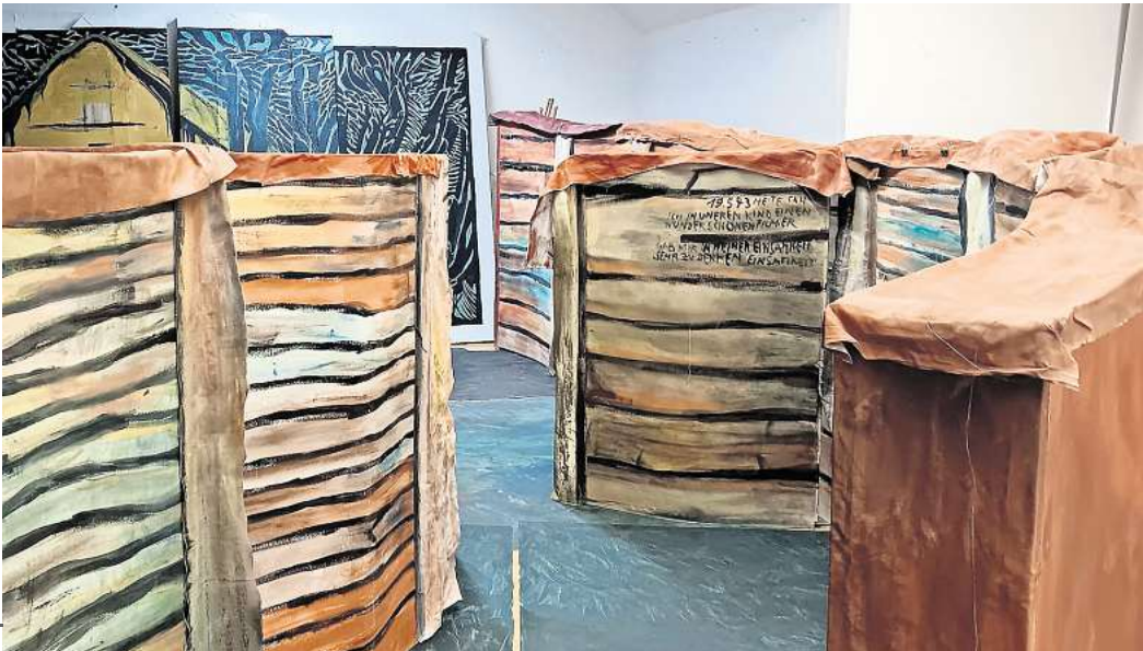
Teil der Rauminstallation "Enheimatet" im Aufbau.

Rauminstallation thematisiert den Wunsch nach Frieden