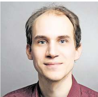
Die Glaubenssache stammt diesmal von Pastor Henrik Heinicke.

Wünsche, die dürfen bei einer Konfirmation indes nicht fehlen. Ein guter Wunsch, ein aufmunterndes Wort und schließlich: