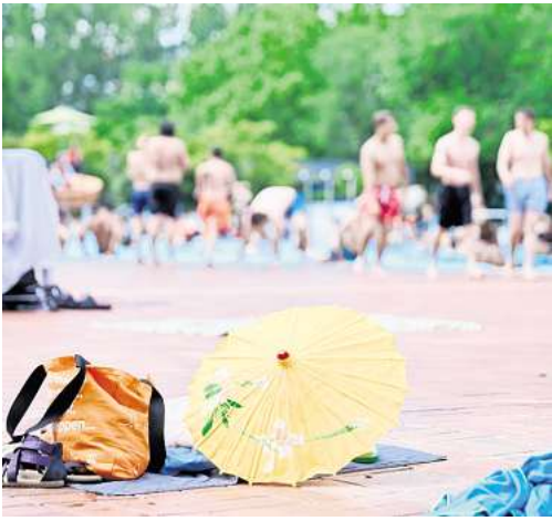
Wer seine Wertsachen im Freibad unbeaufsichtigt lässt, sollte wissen, dass die Hausratversicherung in der Regel nicht für einfache Diebstähle aufkommt.

Besser daher: abschließbare Spinde oder Locker in einem Gebäude nutzen, die Betreiber im Idealfall zur Verfügung stellen. Wenden Langfinger hier Gewalt an, um an die Wertsachen zu gelangen, handelt es sich um Einbruchdiebstahl, der von der Hausratversicherung abgedeckt ist. Werden Wertgegenstände unter Androhung von Gewalt herausgegeben, leistet die Hausratversicherung ebenfalls Ersatz zum Neuwert. Allerdings: Dem BdV zufolge bieten einige Versicherer inzwischen auch Hausrat-Tarife mit erweiterten Leistungen an, die mitunter auch einfachen Diebstahl bis zu einer bestimmten Entschädigungsgrenze einschließen. Versicherte tun daher gut daran, ihre bestehende Police sorgfältig zu prüfen und im Zweifel direkt beim Versicherer nachzufragen, ob und in welchem Umfang einfacher Diebstahl abgedeckt ist. (DPA)