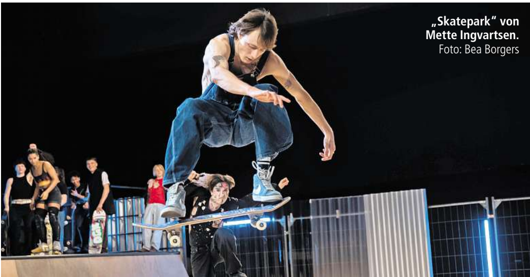
„Skatepark“ von Mette Ingvarsen.

sik und ihren provokanten Shows folkloristische Saiteninstrumente mit techno-inspirierten Jams.