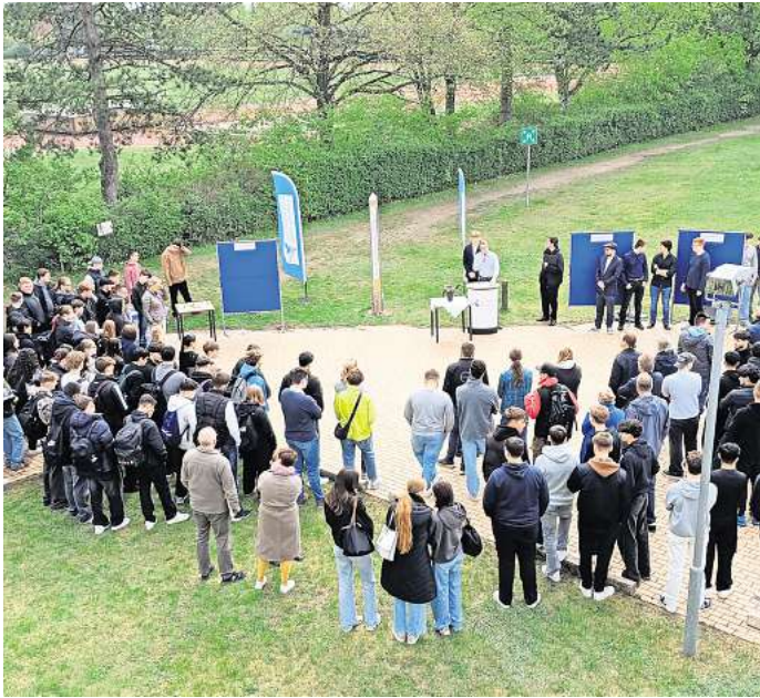
Schüler und Lehrer der BBS Burgdorf enthüllen den neuen Friedenspfahl.

Zum Abschluss der Veranstaltung lud der Kurs alle Anwesenden ein, ihre eigene persönliche Friedensbotschaft an einer Pinnwand zu hinterlassen. Viele nahmen das Angebot an – und so entstand im Laufe des Vormittags eine bunte, bewegende Sammlung von Gedanken, Hoffnungen und Appellen.