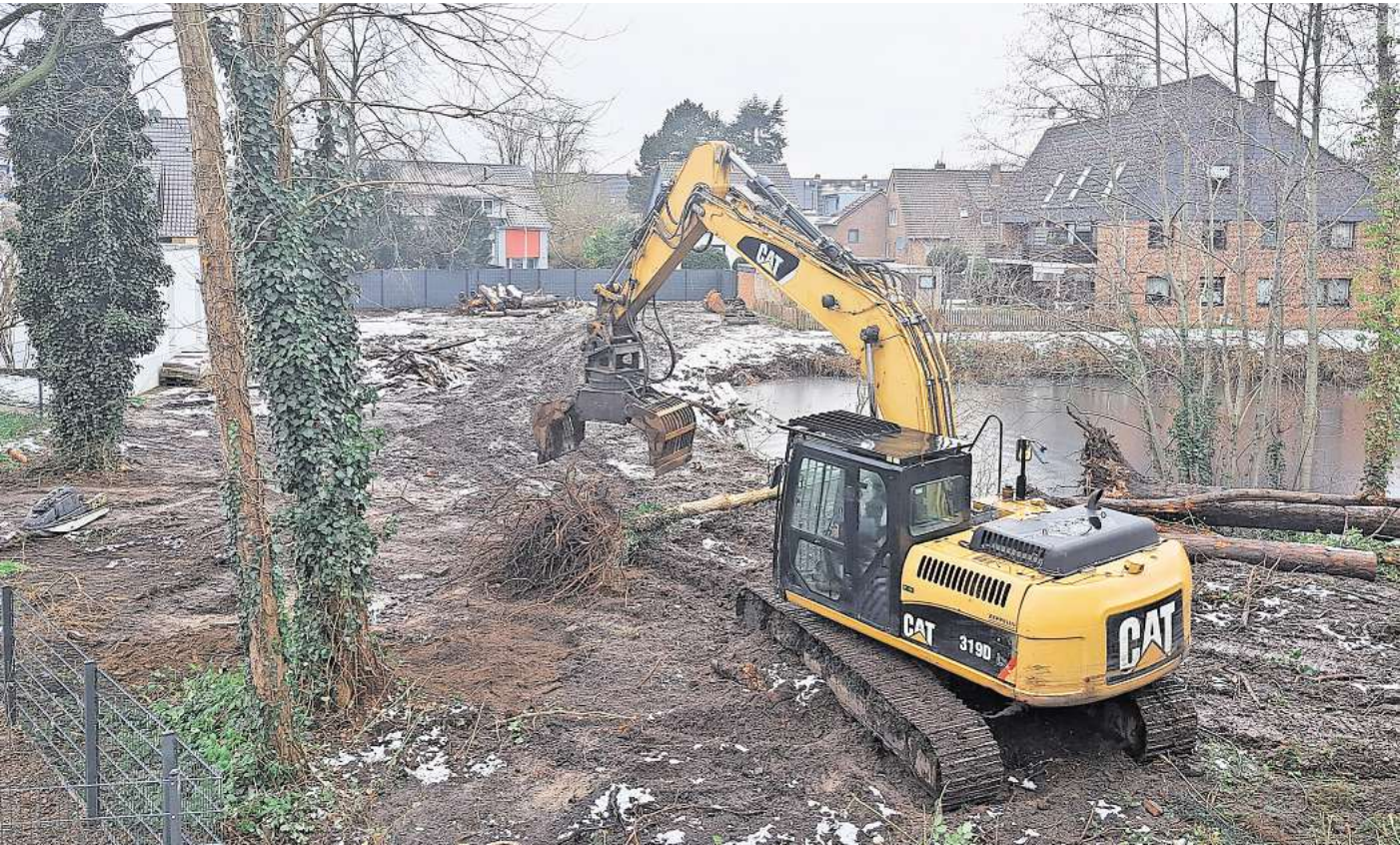
Großes Gerät: Mit einem Bagger hat der Bauherr auf seinem Grundstück am Steingartenweg Bäume fällen lassen.

LEHRTE (r/tz). Nachdem es auf einem Grundstück mit Teich, zwischen Eichen- und Steingartenweg, im Januar Baumfällungen gab, um Platz für einen Hausbau zu schaffen, meldeten Nachbarn den Vorgang bei der Stadtverwaltung. Sie vermuteten, dass einige der Bäume dort nicht hätten gefällt werden dürfen, da sie unter die Baumschutzsatzung fielen. Wie sich nun herausgestellt hat, war der Verdacht der Nachbarn nicht unbegründet. Wie Stadtsprecher Fabian Nolting jetzt auf Anfrage bestätigte, sind den Fällarbeiten auch zwei Erlen zum Opfer gefallen. Die