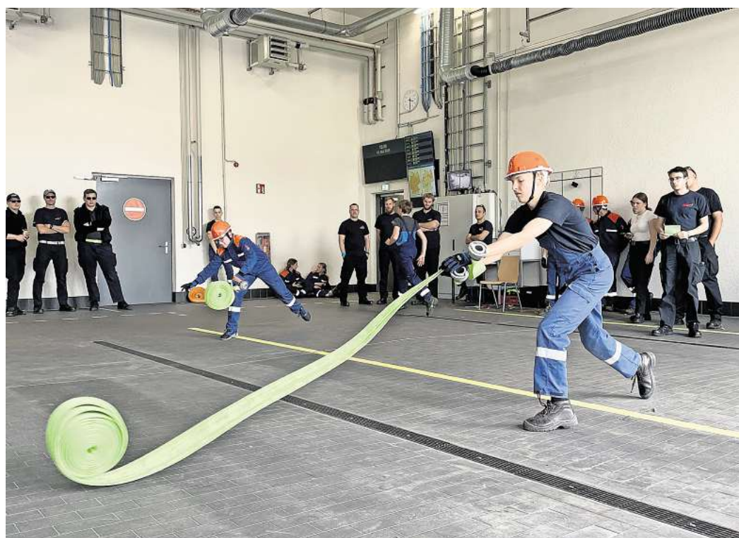
Jugendfeuerwehren Ahlten und Sievershausen beim etwas anderen Staffellauf Beim Staffellauf: Die Teilnehmenden mussten einen Schlauch nicht nur ausrollen, sondern zusammengerollt wieder zum Startpunkt zurückbringen.

feuerwehrleute mit ihren Körpern eine Art Tunnel bilden, durch den dann ein Ball hindurchgeschossen wurde. Natürlich auf Zeit.