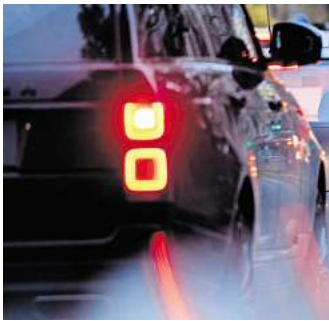
Fast eine Stunde Fahrt für 30 Kilometer - das nervt: Eine doppelte Haushaltsführung rechtfertigt ein anstrengender Arbeitsweg allerdings nicht automatisch.

Der konkrete Fall: Ein Steuerzahler hatte seinen Hauptwohnsitz in einem Ort, der 30 Kilometer von seiner Arbeitsstätte entfernt lag. Mit Berufsverkehr dauerte die Fahrt mit dem Pkw dorthin fast eine Stunde, mit öffentlichen Verkehrsmitteln sogar über zwei Stunden. Darum mietete er eine Zweitwohnung in der Nähe seiner Arbeit – und wollte die Kosten als Werbungskosten in der Steuererklärung geltend machen. Das Finanzgericht Münster entschied aber, dass eine Entfernung von 30 Kilometern und eine Fahrtzeit von unter einer Stunde für den Steuerzahler zumutbar seien und der Zweitwohnsitz demnach nicht notwendig sei. Dass die Fahrtzeit mit den öffentlichen Verkehrsmitteln deutlich