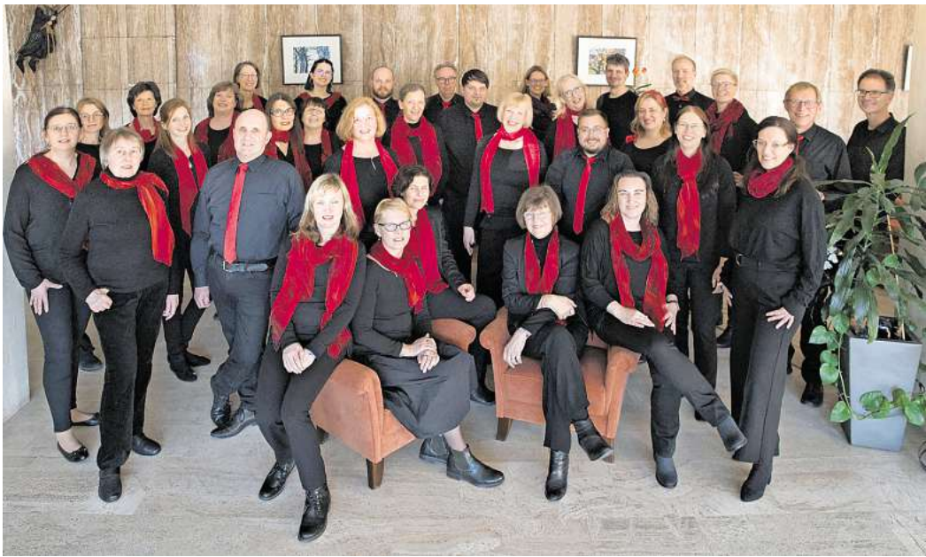
Der Popchor Voices of Harmony singt in der Alten Schlosserei.