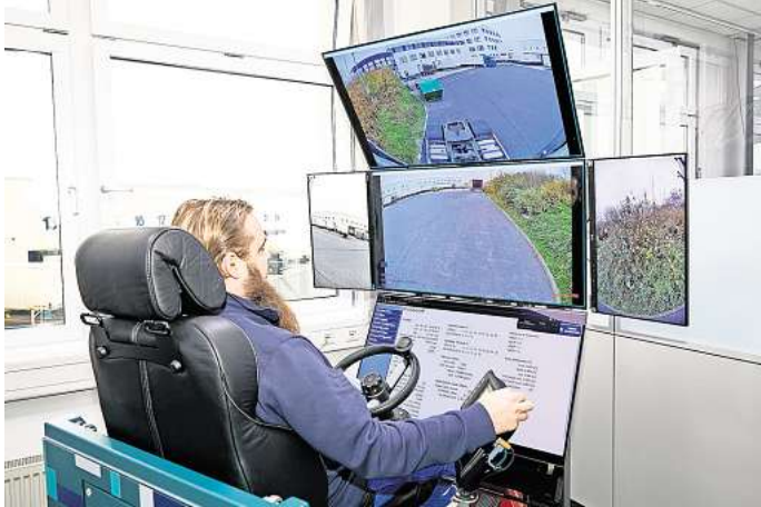
Überwachung per Bildschirm.

Forschungsprojekts diese Fahrzeuge bei einem Logistikunternehmen in Bremen dauerhaft im öffentlichen Straßenverkehr auf einer begrenzten Strecke eingesetzt werden. Wir halten die Teleoperation für eine zukunftsweisende Lösung im Bereich der Nahverkehrslogistik, besonders im Hinblick auf den Fachkräftemangel im Berufskraftverkehr.“ Allgemein gebe es eine gewisse Euphorie zum autonomen Fahren. Die vollständige Automatisierung (Level 5) in komplexer Umgebung, beispielsweise in der Innenstadt, werde aber noch länger auf sich warten lassen. Das größte Potenzial liege aktuell vor allem im Berufskraftverkehr. Die Götting KG teilt mit: „Die Nachfrage im Bereich der Fahrzeugautomatisierung hat deutlich zugenommen, sodass auch wir uns erweitern müssen und die Einstellung von weiterem Personal vorgesehen haben. Das ist insbesondere in diesen schwierigen Zeiten eine gute Nachricht.“