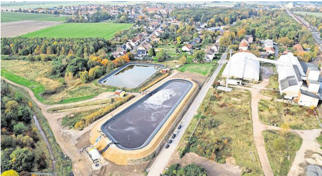
Zwischenlagerung: Die Sole in dem 8500 Kubikmeter fassenden Speicherbecken ist für die Flutung des Wunstorfer Schachts Sigmundshall vorgesehen.

An der Bismarckstraße herrschten vor Baubeginn Bedenken, ob die Transporte von Material und Geräten über die Straße laufen würde. Diesen Verkehr ließ K+S aber über den