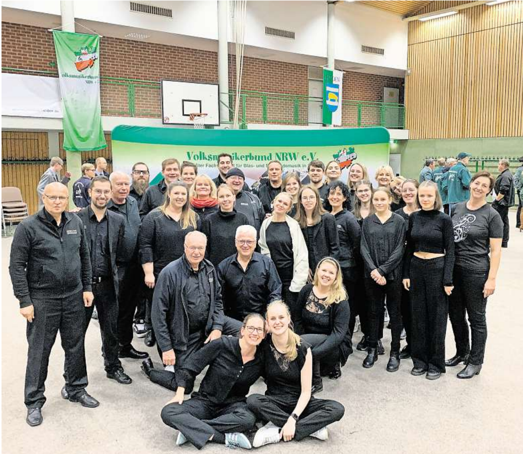
Das Ahltener Flötenorchester bei der Qualifikation.

thäuskirche zu kommen. Eintrittskarten gibt es online unter www.konzert-ahlten.de , beim Kiosk Franz in Ahlten (Zum Großen Freien 40) und telefonisch unter der Rufnummer 0151 51 700 168.