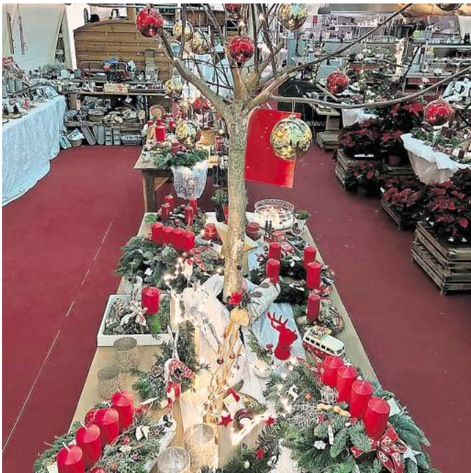
Weihnachtliche Atmosphäre im Wellblechpalast: Der Erlebnishof Lahmann lädt zur großen Adventsausstellung ein.

Für den Adventsverkauf öffnet der Erlebnishof Lahmann, Burgdorfer Straße 26, in Otze am Freitag von 17 bis 22 Uhr zum Moonlight Shopping sowie am Sonnabend von 11 bis 22 Uhr und am Sonntag von 13 bis 16 Uhr.