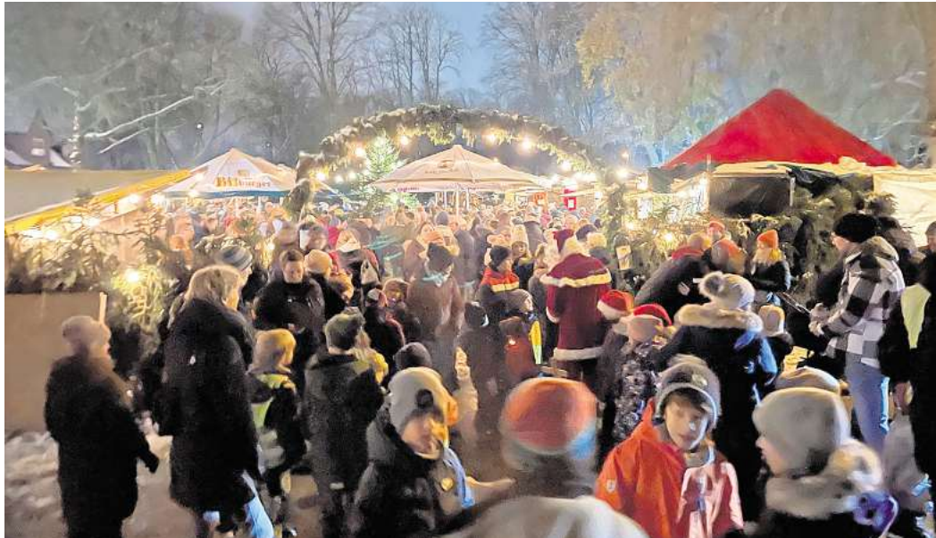
Aufbau-Helfer sind gesucht, um den Aligser Weihnachtsmarkt stimmungsvoll zu gestalten.

durch den Verein zur Förderung der Dorfgemeinschaft in Kolshorn, Röddensen und Aligse und seine vielen fleißigen Helfer. Der Verein wurde am 15. Dezember 1994 gegründet und besteht somit bereits seit 30 Jahren. Die Mitgliedschaft im Verein ist kostenlos und der Erlös aus dem Weihnachtsmarkt kommt gemeinnützigen Projekten und Vereinen in den drei Dörfern zugute. Neue Mitglieder und Unterstützer sind herzlich willkommen. Weitere Informationen zum Verein, den Auf- und Abbaetermineinen sowie dem „ehrenamtlichen“ Stellenmarkt für Einsätze in den Buden finden sich auf der Homepage www.weihnachtsmarkt-aligse.de .