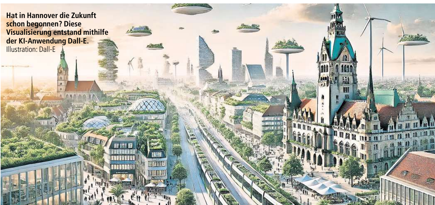
Hat in Hannover die Zukunft schon begonnen? Diese Visualisierung entstand mithilfe der KI-Anwendung Dall-E.