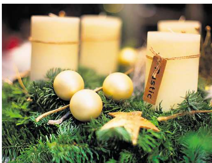
Für den Advent wird in der Dorffgärtnerei die Schönheit der Natur in Szene gesetzt.

Besucherinnen und Besucher können eine Vielzahl handgefertigter Dekorationen in den Farbklassikern Rot, Silber und Schwarz