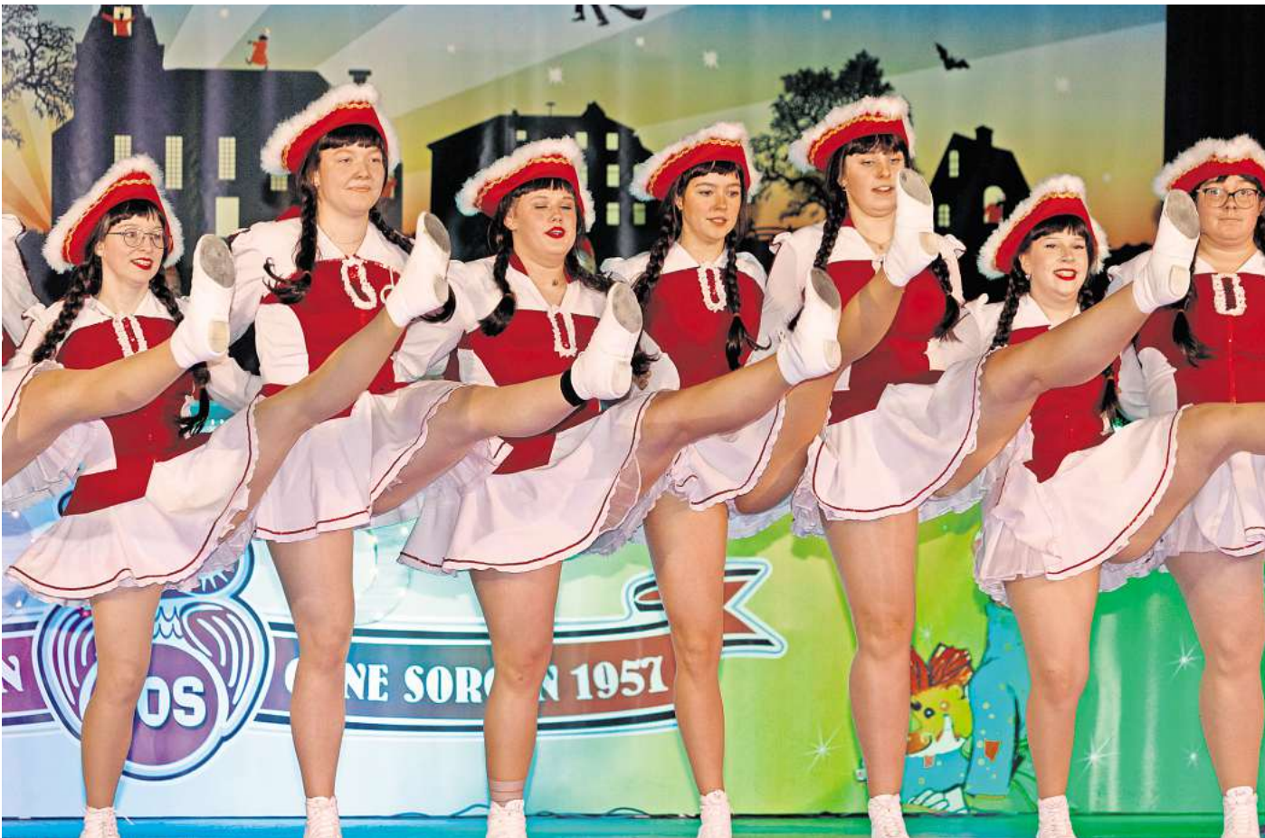
Karneval wird in Frickes Festsälen zelebriert.

Auftakt am heutigen Sonnabend, 16. November