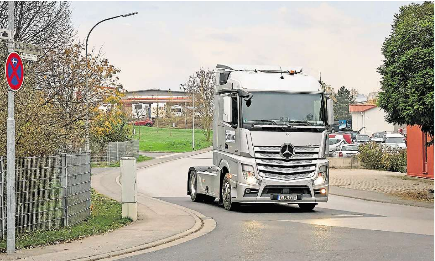
Mit der Technologie der Götting KG unterwegs: Schwerlastler ohne Fahrer am Steuer.

Götting KG aus Röddensen bringt das autonome Fahren voran