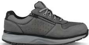
Dynamo ZIP dark grey

L. Kay: Mit der Wahl des richtigen Schuhs sollte sich grundsätzlich jeder auseinandersetzen. Insbesondere jedoch Menschen, die berufsbedingt oder in der Freizeit viel Gehen oder Stehen, bieten Joya Schuhe optimale Entlastung und Prävention von Fehlstellungen, Verletzungen und den damit verbundenen Beschwerden. Auch Ärzte und Therapeuten empfehlen Joya Schuhe bei Rücken- und Gelenkproblemen und setzen sie erfolgreich bei verschiedenen Beschwerden des Bewegungsapparates ein.