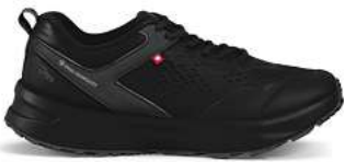
Veloce SR black