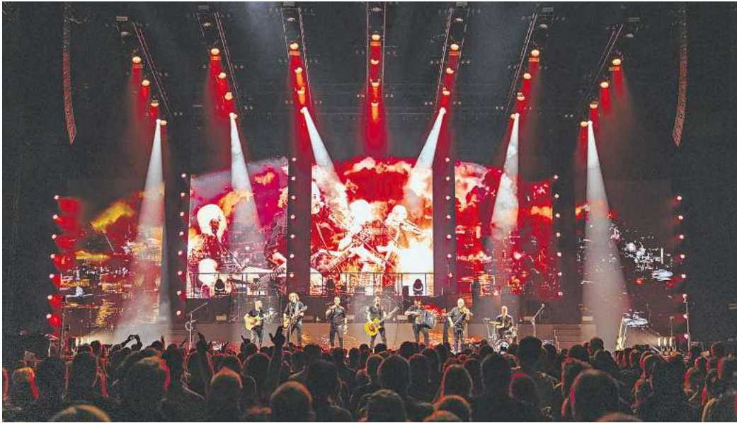
Auf ihrer „Doggerland! 2025“-Tour wollen Santiano nicht nur musikalisch, sondern auch visuell neue Maßstäbe setzen.

Norddeutsche Kultband kommt auf den Schützenplatz