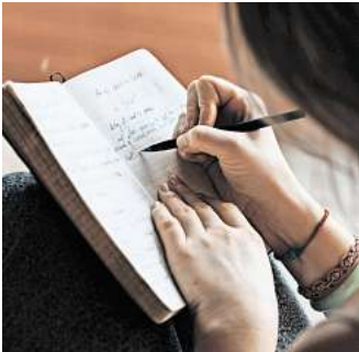
WortLaut: kreatives Schreiben, gemeinsames Lesen.