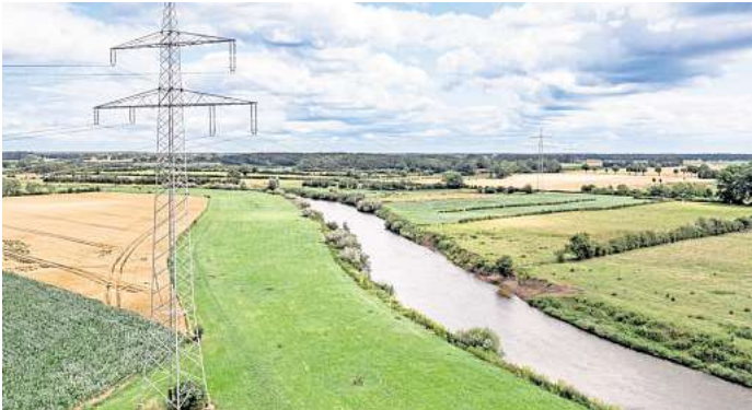
Wie in Neustadt am Rübenberge steht auch für Lehrte das Planfeststellungsverfahren zur Trassenführung bevor.

Eine Anmeldung ist nicht erforderlich. Die Infomärkte bieten eine gute Gelegenheit, sich frühzeitig vor Beginn des Planfeststellungsverfahrens einzubringen. Dieses offizielle Genehmigungsverfahren für den Abschnitt Lehrte – Mehrum/Nord