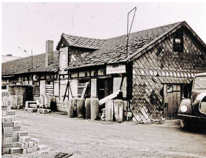
LANGE FAMILIENGESCHICHTE: Das Unternehmen wurde am 1. September 1899 in der Hopfenstraße in Peine gegründet – seitdem ist viel passiert.