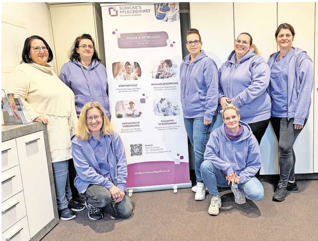
Mit großer Motivation im Team: Schicke's Pflegedienst.