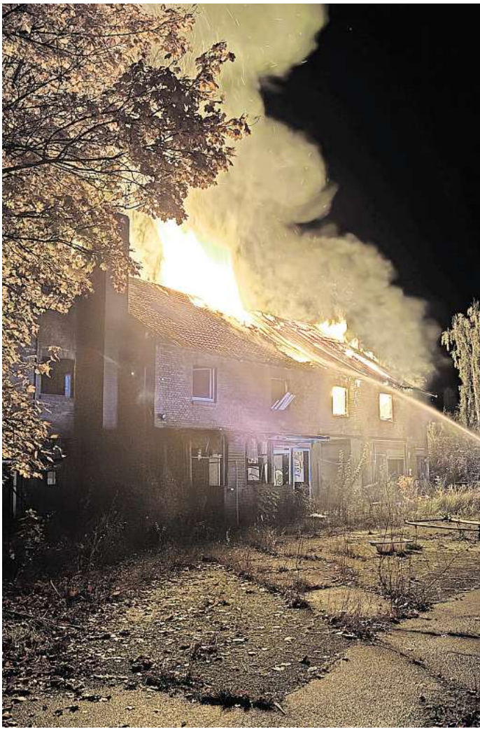
Feuer an der Peiner Straße: Der Dachstuhl eines der Gebäude der früheren Keramischen Hütte brennt.

schaumteppich benetzt, sodass auch die letzten Glutnester erstickt wurden. Um 22.47 Uhr konnte „Feuer aus“ an die Regionsleitstelle gemeldet werden. Die Aufräumarbeiten zogen sich bis weit in die Nacht. Im Einsatz waren die Ortsfeuerwehren Sehnde, Rethmar, Müllingen-Wirringen, Evern sowie die Einsatzleitung Ort, der Rettungsdienst und die Polizei. Am Dienstagabend, 22. Oktober, um 20.16 wurde die Ortsfeuerwehr zum selben Einsatzort alarmiert. Unrat brannte in einer Halle. Ein Trupp löschte unter Atemschutz. Auch am Folgetag, Mittwoch, 23. Oktober, um 18.27 Uhr wurde die Ortsfeuerwehr zum selben Einsatzort alarmiert. Es brannte in derselben Halle. Unrat der an zwei Stellen im Erdgeschoss und ersten Obergeschoss in Flammen aufging musste von den Einsatzkräften bekämpft werden. Umgehend wurde die Drehleiter in Stellung gebracht, eine Wasserversorgung aufgebaut und der Brand gelöscht. Die Glutnester wurden auseinandergezogen und abgelöscht. Bereits nach kurzer Zeit konnte durch den Einsatzleiter „Feuer aus“ gemeldet werden. Im Einsatz waren die Ortsfeuerwehr Sehnde, der Rettungsdienst und die Polizei.