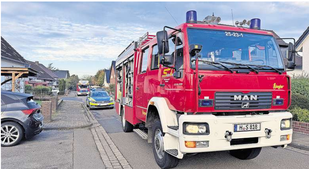
Morgendlicher Einsatz der Ortsfeuerwehr.

SEHNDE. Am Freitagmorgen, 18. Oktober, um 9 Uhr wurde die Ortsfeuerwehr zu einer Rauchentwicklung in einem Heizungsraum eines Hauses an der Straße Am Steinwedeler Wald alarmiert. Ein Trupp unter Atemschutz und mit Kleinlöschgerät rückte in den betroffenen Bereich vor, konnte brennendes Material zügig nach draußen bringen und dort endgültig löschen. Das Gebäude wurde anschließend noch belüftet und die Feuerwehr konnte wieder einrücken. Zur Brandursache und Schadenshöhe gibt es seitens der Feuerwehr keine Angaben. Im Einsatz war die Ortsfeuerwehr Sehnde sowie der Rettungsdienst.