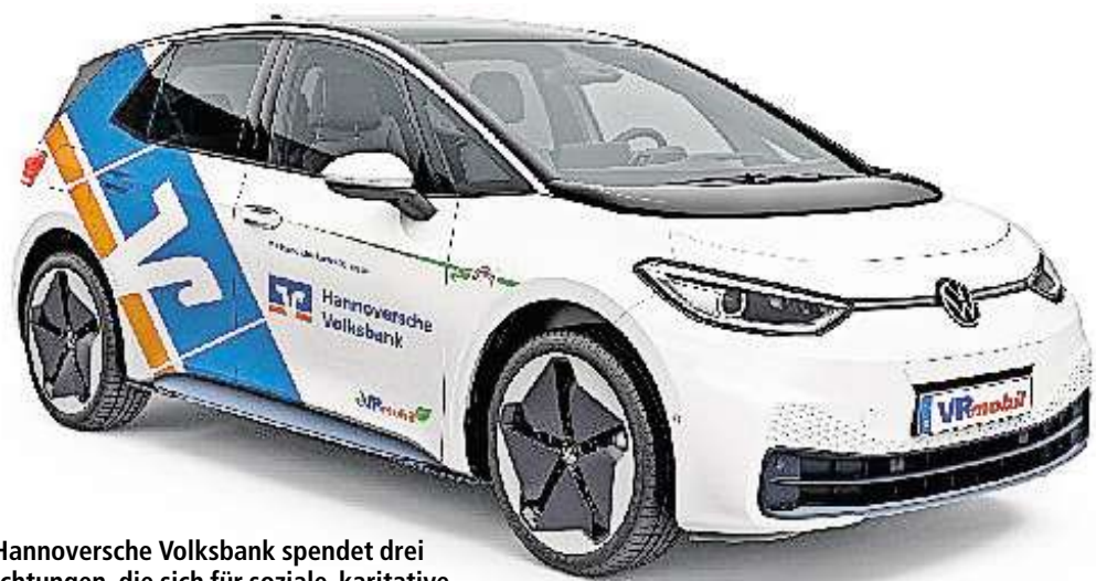
Die Hannoversche Volksbank spendet drei Einrichtungen, die sich für soziale, karitative oder kulturelle Zwecke engagieren, jeweils einen Volkswagen vom Typ ID.3 Pro.

Weitere Informationen: hannoversche-volksbank.de/vrmobil