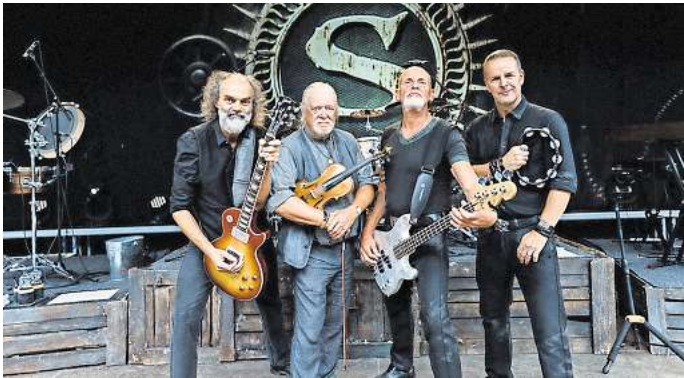
Im Rahmen ihrer „Doggerland! 2025“-Tour gibt die Rockgruppe Santiano am 30. August ein Konzert auf dem Burgdorfer Schützenplatz.

Die Kosten betragen 61 Euro für Stehplätze, 81 Euro für Sitzplätze, Rollstuhlfahrer zahlen 61 Euro. Für Kinder gibt es Ermäßigungen. Wer das Konzert exklusiv erleben möchte, kann ein VIP-Ticket für 199 Euro erwerben. Alle Preise verstehen sich zuzüglich Vorverkaufsgebühren.