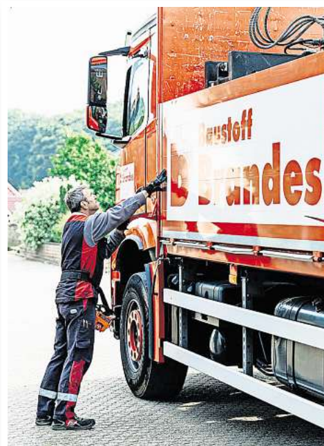
LOGISTIK, DIE ÜBERALL GUT ANKOMMT: Das Familienunternehmen mit Hauptsitz in Peine ist insgesamt an neun Standorten in ganz Norddeutschland vertreten.