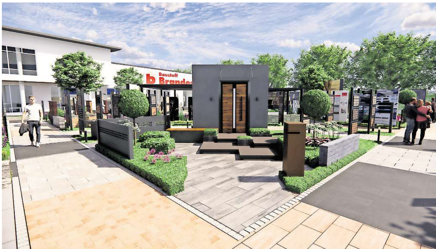
Bis Ende Oktober soll die neue Außenausstellung in Burgdorf fertig sein, dann ist sie rund um die Uhr frei zugänglich zu besichtigen.

Auch der Burgdorfer Filialleiter Jörg Ulrich wirbt für die neue Ausstellung im Außenbereich: „Wir haben einen Senkgarten angelegt und eine Outdoorküche