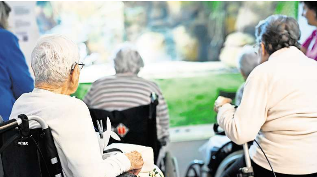
Besuche im Pflegeheim können für Angehörige emotional herausfordernd sein.

Auch wenn es Angehörigen erst einmal schwerfällt: Die eigenen Gefühle anzusprechen, etwa gegenüber dem Pflegepersonal, ist ein Anfang. Im besten Falle haben sie Ideen, was die Besuche angenehmer machen kann - zum Beispiel, wenn man sie mit einer Aktivität im Heim verknüpft. «Dann ist man eben beim Gedächtnstraining dabei, bei der Gymnastik oder dem Konzert», schlägt Pflege-