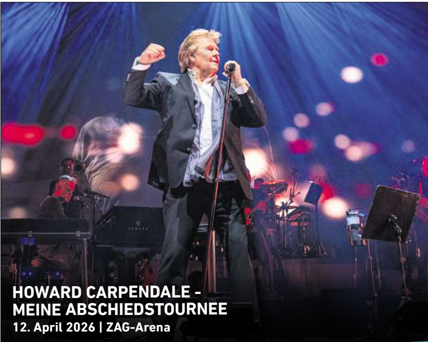
HOWARD CARPENDALE - MEINE ABSCHIEDSTOURNEE 12. April 2026 | ZAG-Arena