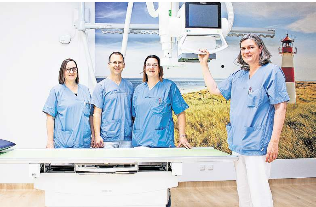
Das MVZ-Team am KRH Lehrte am neuen Röntgengerät.

Investition zum Aufbau des Facharztzentrums im Klinikum Lehrte