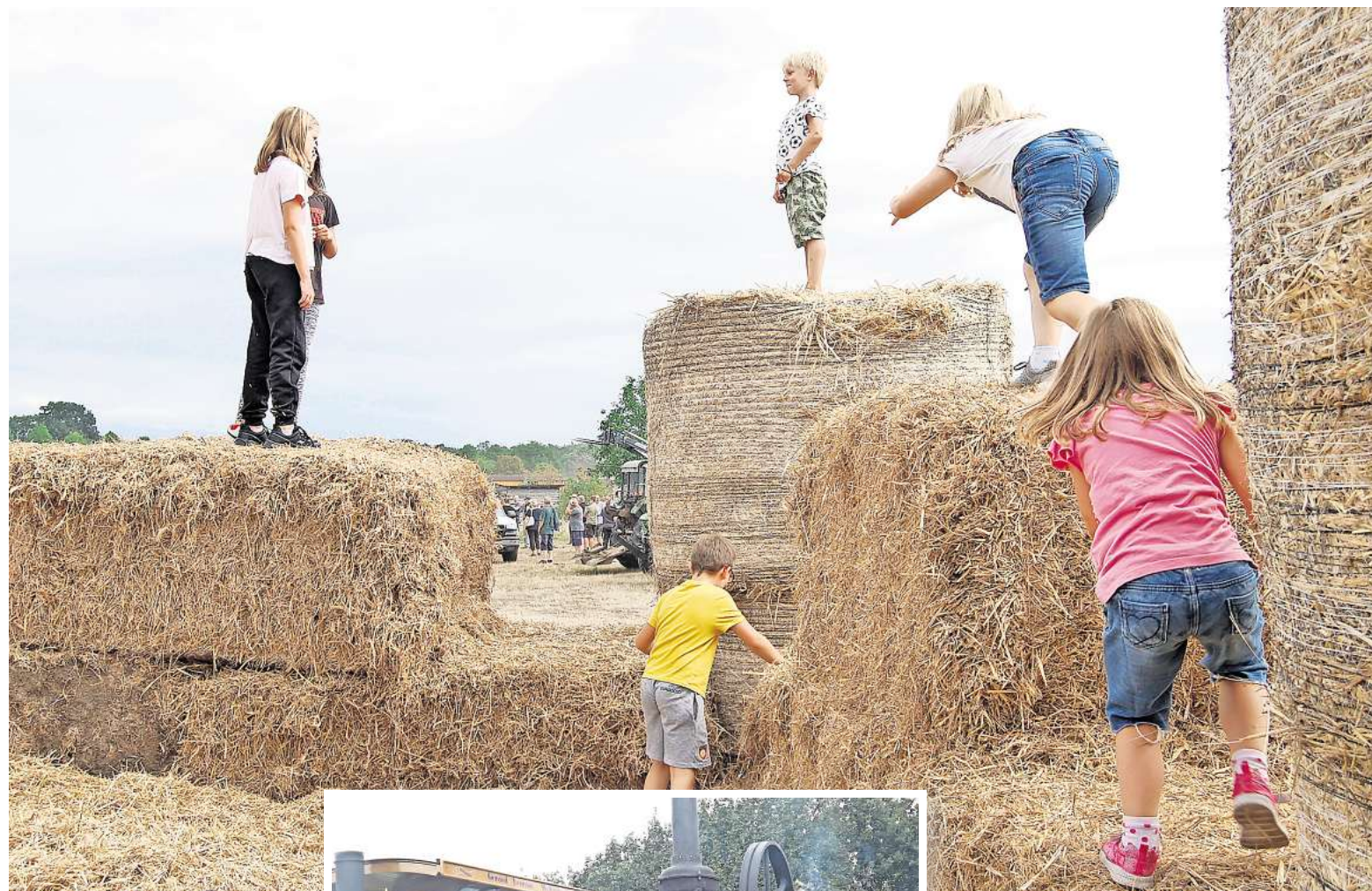
Die Strohburg gehört beim Dreschefest als Attraktion für die Jugend immer dazu.

Ausstellung alter Maschinen, Hobbymarkt, Zelt disco und noch viel mehr