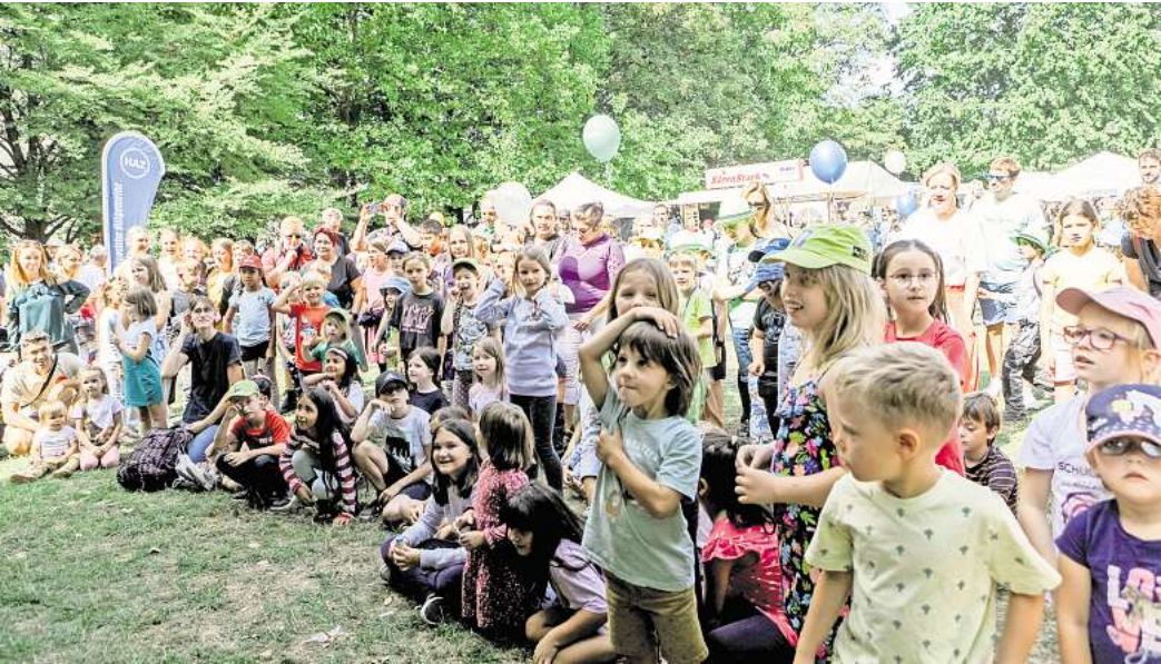
Das Einschulungsfest mit einem Programm rund um Verkehrssicherheit hat Tradition.

Das komplette Programm mit allen Aktionen ist kostenlos, es läuft von 11 bis 17 Uhr. Der Maschpark liegt in direkter Nachbarschaft zum Neuen Rathaus. Und natürlich kann man dort bei dem Familienfest auch die Einschulung gemeinsam gebührend feiern, Picknickdecken ausbreiten und sich kulinarisch versorgen lassen.