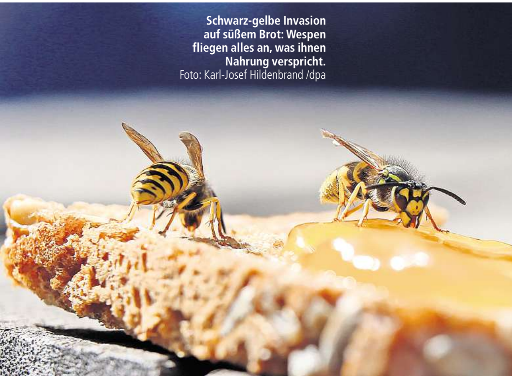
Schwarz-gelbe Invasion auf süßem Brot: Wespen fliegen alles an, was ihnen Nahrung verspricht.

Warum kommen Wespen im Spätsommer überhaupt so oft an unseren Tisch? Zunächst einmal gut zu wissen: In Deutschland gibt es zwar mehrere staatenbildende Wespenarten, allerdings nur zwei Arten, die Nahrungsmittel und Getränke anfliegen: die Gemeine Wespe und die Deutsche Wespe. Im Frühjahr geht es bei diesen Wespen los mit der Nestgründung, im Spätsommer tummeln sich dann besonders viele Tiere dort – das Nest ist voll. Und das heißt auch: Die Nahrung wird knapp, die Wespen begeben sich auf die Suche nach Leckereien. Düfte, die von Süßem wie Kuchen, Marmelade oder Säften ausgehen, ziehen sie dann magisch an. Wobei das Zuckrige und kohlenhydratreiche Nahrung für ältere Wespen sei, sagt Tarja Richter vom Lan-