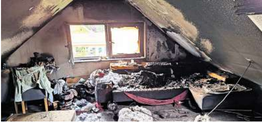
Brand-schaden im Spitzboden.

Lobke, Sehnde und Rethmar, sowie die Einsatzleitung der Stadtfeuerwehr.