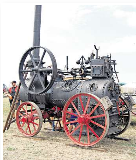
Dampfmaschinen und Trecker sind in beachtlicher Vielfalt in der Ausstellung zu sehen.