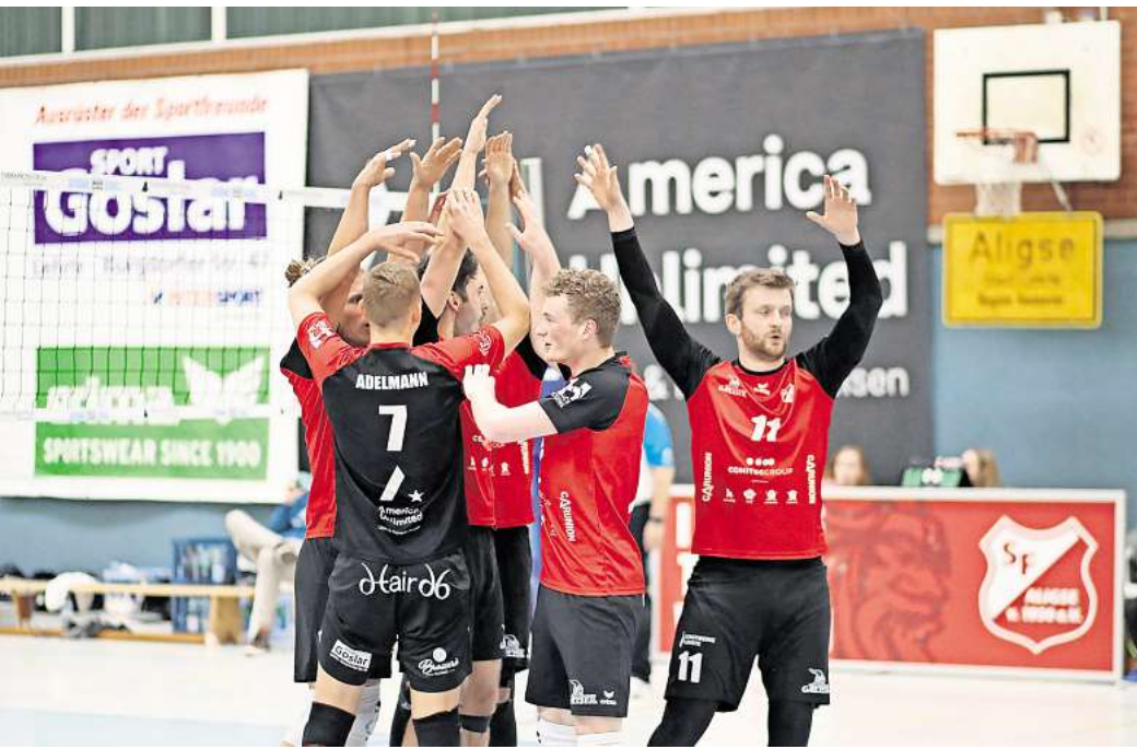
Volleyball. SF Aligse - Tecklenburger Land Volleys. Die Aligser feiern den Punktgewinn