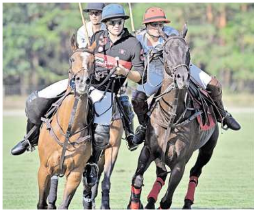
Beim Rixförder High Goal Cup geben die Spieler und ihre Pferde alles.

Beim Rixförder High Goal Cup messen sich vier Teams