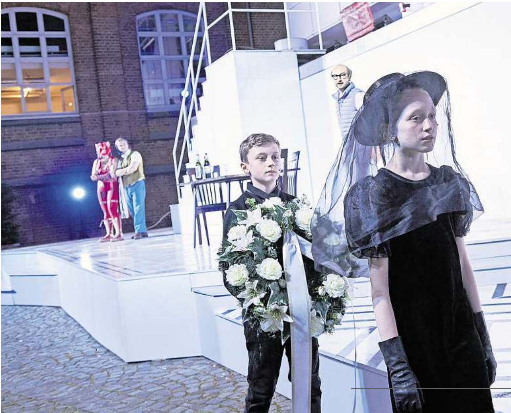
Biedermann und die Brandstifter im August im Freien erleben.

Das Schauspiel Hannover bespielt auch in diesem Sommer seinen Innenhof, der neuerdings Kulturhof genannt wird, mit einem Open Air-Stück. Auf dem Spielplan steht ab dem 8.8. erneut „Biedermann und die Brandstifter“ von Max Frisch. Zum Inhalt: Eines Tages steht die mittellose Ringerin Schmitz bei Biedermanns vor der Tür. Sie erzählt dem Ehepaar von ihrer schweren Kindheit. Die beiden sind so überrumpelt, dass sie ihr kurzerhand den Dachboden als Unterschlupf anbieten. Sie können sich nicht vorstellen, dass Schmitz etwas mit den brennenden Häusern zu tun hat, die seit neuestem die Stadt in größte Unruhe versetzen. Am darauffolgenden Tag steht erneut ein