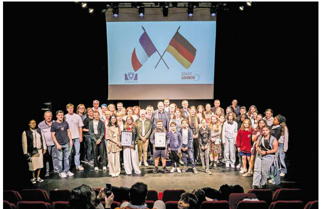
Im Rahmen der Städtepartnerschaft: Preisverleihung zur Kurzfilmproduktion in Vanves.

Zu den offiziellen Delegationsmitgliedern gehörten