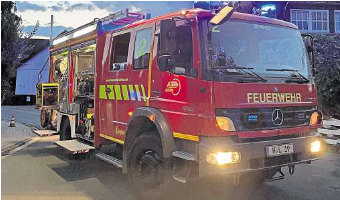
Einsatzfahrzeug der Ortsfeuerwehr Ahlten.

Laut der Alarmmeldung hatte auf der Ahltener Straße in Höhe der Einmündung Am Rehwinkel ein iPhone einen automatischen Notruf abgesetzt. Da die Feuerwehrleitstelle keinen Sprechkontakt zu dem Eigentümer herstellen konnte, wurden Rettungs- und Einsatzkräfte zu der Unfallstelle geschickt. Vor Ort wurde ein defektes iPhone, jedoch keine verunfallte Person festgestellt. Das iPhone, dessen Eigentümer durch die Feuerwehrleitstelle ermittelt worden war, wurde der Polizei übergeben. Der Einsatz war damit beendet.