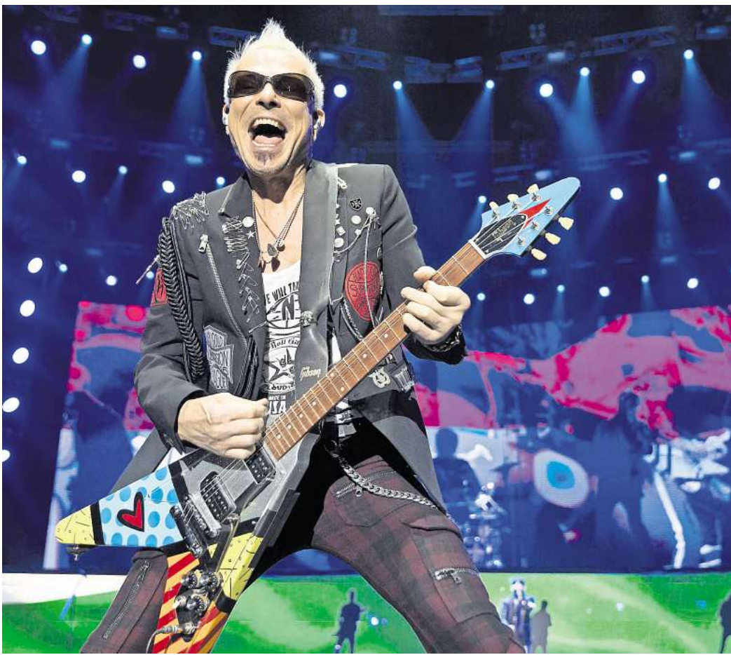
Scorpions-Gitarist Rudolf Schenker ist mal nicht auf Welttournee, sondern besucht die NP am Maschsee.