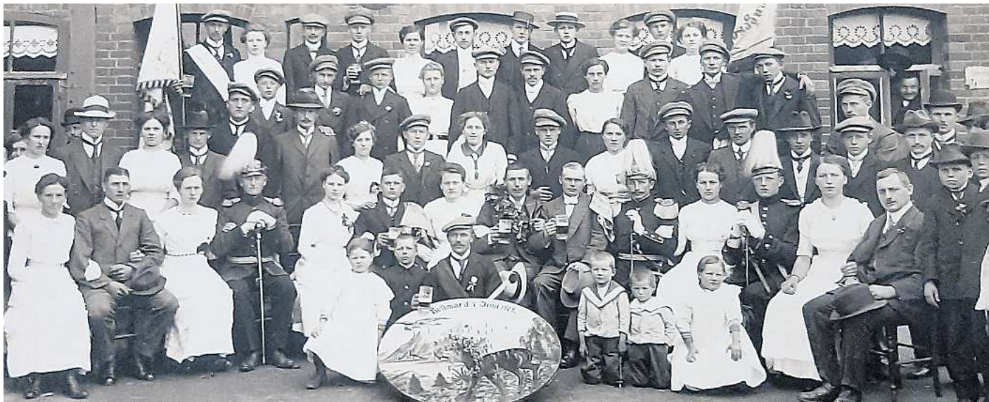
Gruppenbild mit Damen: Die Rethmarer Schützen im Jahr 1914.

Schützenverein Rethmar feiert hundertjähriges Jubiläum