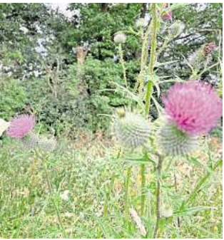
Schmetterlinge haben eine Nahrungsquelle.