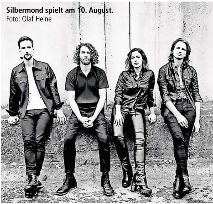
Silbermond spielt am 10. August.

Weiter geht es am 21. August mit Jan Delay & Disko No. 1. Der