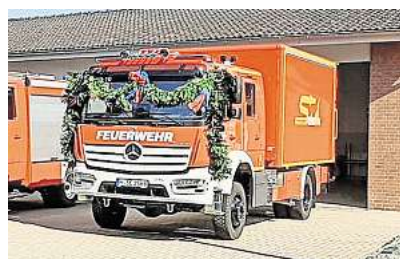
Feierlich in den Fuhrpark aufgenommen: Der Gerätewagen Logistik der Ortsfeuerwehr Ilten.

Summe von 412.000 Euro, die die Stadt Sehnde in Fahrzeug und Ausstattung investiert hat, wird der Förderverein den neuen Gerätewagen Logistik mit weiterem, sinnvollen Zubehör komplettieren, um die Arbeit der Kameraden sicherer und leichter zu machen. Die ersten Bestellungen wurden bereits ausgelöst. Der Förderverein wünscht der Feuerwehr Ilten allzeit gute Fahrt und unfallfreie Einsätze mit dem neuen Fahrzeug.“