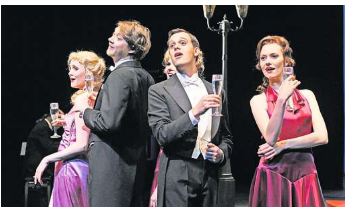
Im Theater am Berliner Ring gastiert demnächst die Musical-Gala „Showtime“.

Das Ensemble vom Theater für Niedersachsen (TfN) präsentiert romantische Balladen, legendäre Jazz-Stücke und Musical-Klassiker aus der Feder von Cole Porter, George Gershwin, Friedrich Hollaender, Charles Trenet, Leonard Bernstein und vielen weiteren. Für die Live-Be-