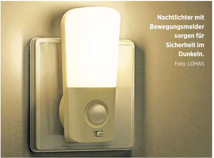
Nachtlichter mit Bewegungsmelder sorgen für Sicherheit im Dunkeln.