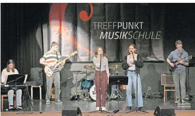
Die Musikschule Ostkreis lädt zu ihrem Wintertreffpunkt ein.

Außerdem spielt das Querflöten-Ensemble „Querformat“ eine Mischung aus bekannten und unbekannten klassischen