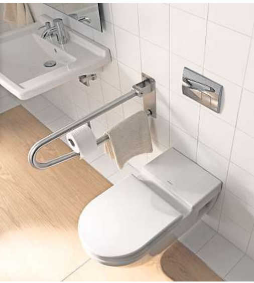
Haltegriffe sind nicht nur für einen festen Halt wichtig, sondern können auch funktional eingesetzt werden.

Viele Menschen wünschen sich bis ins hohe Alter möglichst selbstständig zu bleiben. Das betrifft auch das eigene Zuhause. Altersgerechtes Wohnen bringt allerdings gewisse Anforderungen mit sich. Am besten ist es, wenn man dieses so früh wie möglich berücksichtigt. Eine Wohnung im Stadtzentrum ermöglicht kurze Wege zu Supermärkten, Arztpraxen, Apotheken und den öffentlichen Verkehrsmitteln. Ein Pluspunkt sind barrierefreie Parkplätze in der unmittelbaren Umgebung. Auch die Erreichbarkeit von Grünanlagen für ruhige Spaziergänge ist vorteilhaft. Die Wohnung selbst muss auch mit Gehhilfen oder einem Rollstuhl erreichbar sein. Weiterhin sorgen breite Türdurchgänge und ebene Bodenbeschaffenheiten für eine barriere- und stolperfreie Begehrbarkeit. Das Anbringen von Haltegriffen, Sitzmöglichkeiten und einer guten Beleuchtung erfordert meist nur einen geringen Aufwand und sorgt