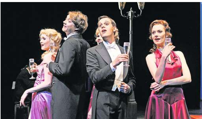
Im Theater am Berliner Ring gastiert demnächst die Musical-Gala „Showtime“.

Das Ensemble vom Theater für Niedersachsen (TfN) präsentiert romantische Balladen, legendäre Jazz-Stücke und Musical-Klassiker aus der Feder von Cole Porter, George Gershwin, Friedrich Hollaender, Charles Trenet, Leonard Bernstein und vielen weiteren. Für die Live-Be-