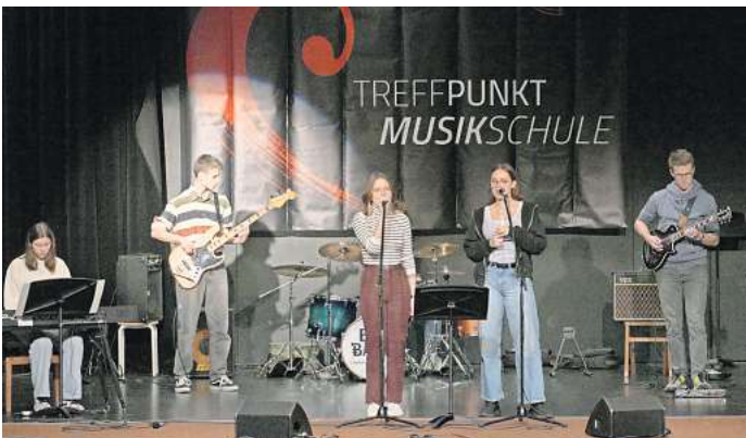
Die Musikschule Ostkreis lädt zu ihrem Wintertreffpunkt ein.

Außerdem spielt das Querflöten-Ensemble „Querformat“ eine Mischung aus bekannten und unbekannten klassischen