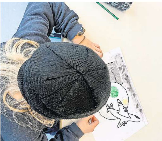
Burgdorfer Grundschüler zeigen in ihren Bildern, was sie wütend oder traurig macht.

Eröffnet wird die Ausstellung am morgigen Sonntag, 18. Februar, ab 10.30 Uhr, im Rahmen eines Familiengottesdienstes in der St.-Pankratius-Kirche am Spittaplatz. Im Anschluss können die Bilder bei einem kleinen