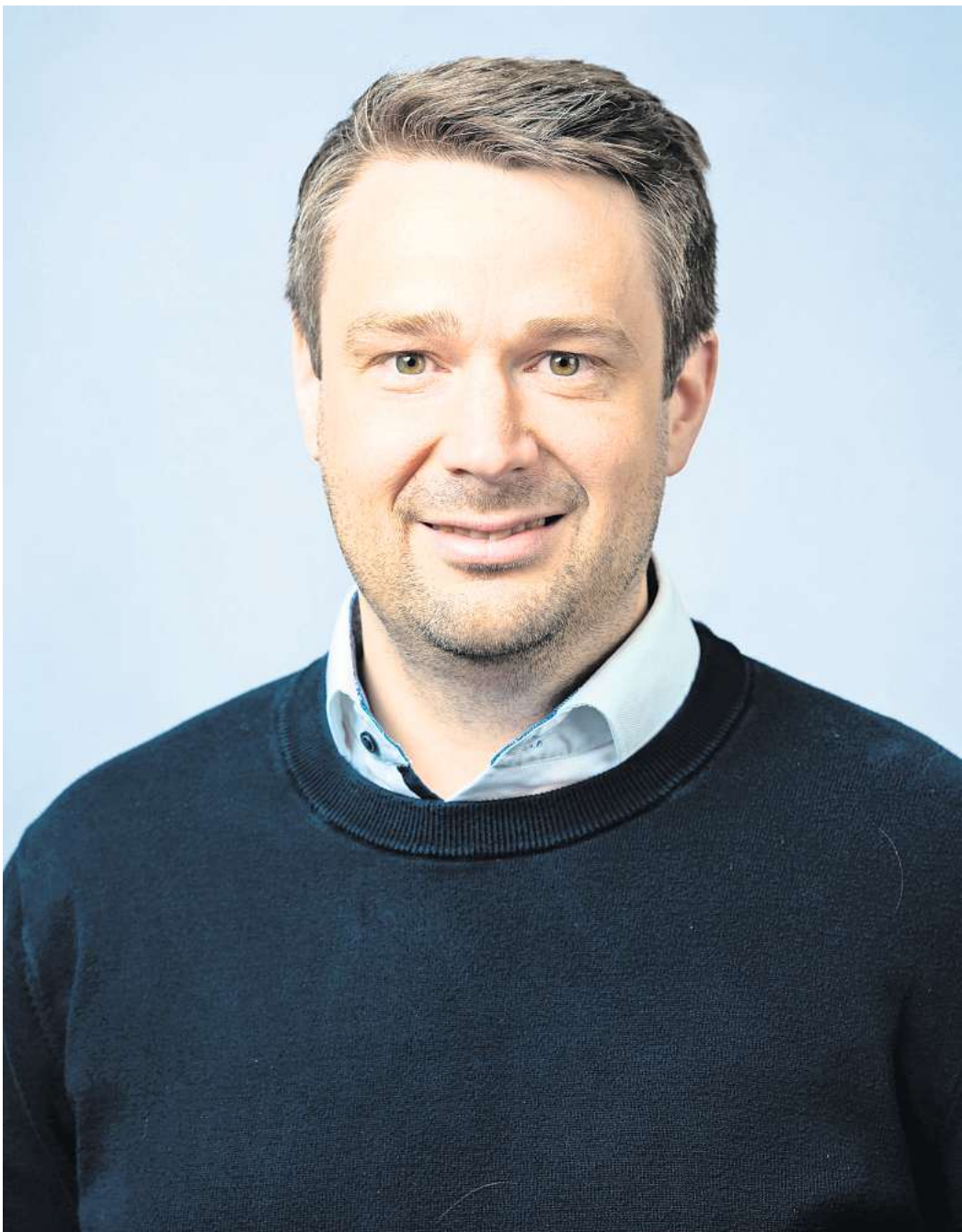
Der Uetzer Bürgermeister Florian Gahre blickt auf das Jahr 2023 zurück.

Ich möchte in diesem Jahr einer Riege von Ehrenamtlichen ein besonderes Augenmerk widmen; Menschen die sich viel zu selten auch mal selbst auf die Schulter klopfen. Ich mache das hiermit, ganz öffentlich. Ich rede von unseren ehrenamtlichen Politikerinnen und Politikern, die