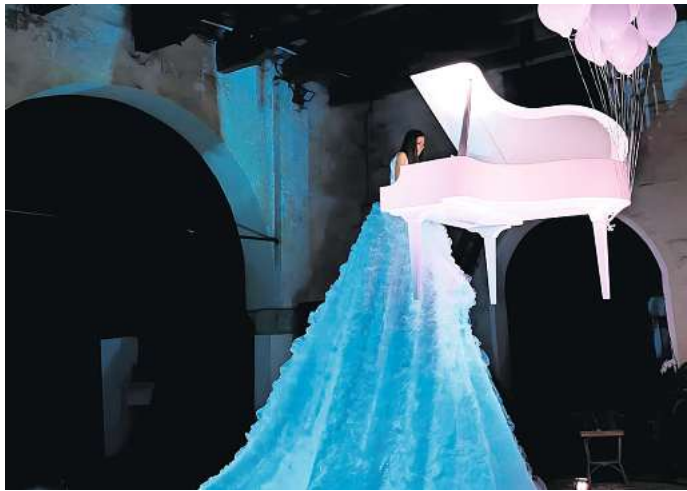
Bei der „Langen Nacht der Kultur“ soll ein Klavier über den Spittaplatz schweben.