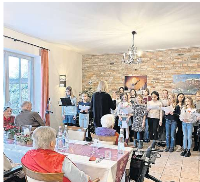
Schüler der Musical-AG singen für die Senioren Weihnachtslieder.

UETZE. Mit unterschiedlichen Aktionen haben Schüler des Gymnasiums anderen Menschen vor Weihnachten eine kleine Freude bereitet. Die Initiativgruppe der Schülervertretung sammelte über 300 liebevoll gepackte Weihnachtstüchchen in den Klassen ein, die dann bei der Lebensmittelausgabe der Tafeln in Burgdorf und Uetze verteilt wurden. Die Musical-AG unter der Leitung