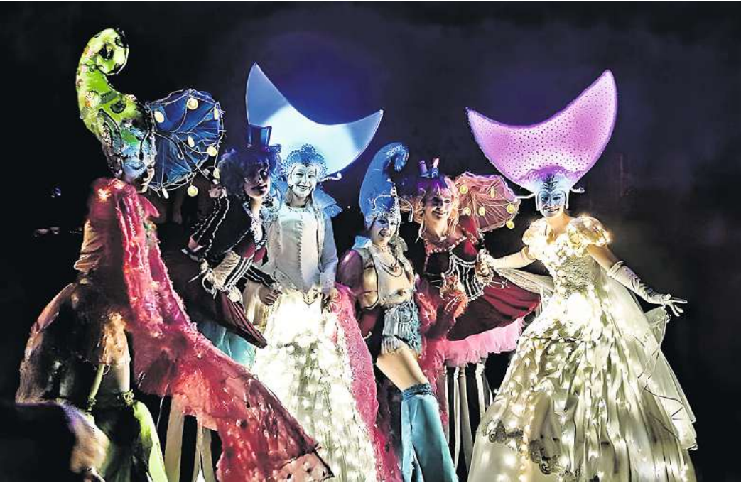
Zu den Höhepunkten des Themenjahres gehört der Lichtzauber am Schwanenteich mit Illumination und Walk-Acts.

denen Geschäftsleute, Organisationen und Vereine sind. Zusätzlich zu den besonderen Themenjahr-Höhepunkten wird es auch wieder viele Traditionsveranstaltungen geben wie beispielsweise die verkaufsoffenen Sonntage (10. März, 1. September, 6. Oktober und 3. November), die Stadtführungen ab dem 7. April und den Spargelempfang im Juni. Außerdem sind eine Ausbildungsmesse am 8. Februar und eine Jobmesse voraussichtlich am 10. November geplant. Und am 3. November soll es eine Eis-Performance in der City geben. Eine detaillierte Übersicht zum Themenjahr ist nach dem Jahreswechsel auf den Webseiten www.stadtmarketing-burgdorf.de und www.ichkaufin-burgdorf.de zu finden.