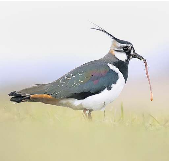
Bei der Wahl zum Vogel des Jahres hat der Kiebitz gewonnen.

1996 war der Kiebitz schon einmal Vogel des Jahres. Doch seitdem hat sich die Lage für ihn weiter verschlechtert: Seit 2016 steht er als stark gefährdete Art auf der Roten Liste Niedersachsen. „Mit dem Kiebitz haben die Menschen einen Vogel gewählt, der in Niedersachsen nur noch