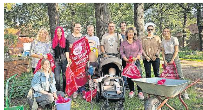
Viele machen mit: Im Burgdorfer Ortsteil Ahrbeck haben Anwohner Unrat aus der Landschaft geklaubt. Der Abfallentsorger Aha hat die Säcke kostenlos zur Verfügung gestellt.

AHRBECK. In Burgdorfs Ortsteil Ahrbeck wird Nützliches gerne mit dem Angenehmen verbunden: Kürzlich haben sich viele Einwohner an einer großen Müllsammelung beteiligt. Und zur Belohnung schloss sich hinterher das „Ahrbecker Fest“ an – ein gemütliches Beisammensein am Grill zur Stärkung der Gemeinschaft. Neben illegal entsorgten Abfallsäcken fanden die Reinigungsstrüpps ein leeres Bierfass, eine Trainingshose sowie Verpackungen von Fast-Food-Ketten. Aha hatte Müllsäcke kostenlos gestellt.