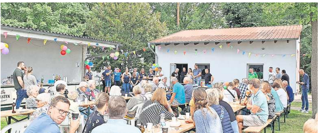
Viel los: Als sich der neue Dorftreff in Katensen vorstellt, strömen die Besucher.

Wer in die Schaukästen im Ort guckt, sieht dort einen gut gefüllten Terminplan, über dem das Motto „Dorfleben erhalten, Freizeit gemeinsam gestalten“ zu lesen ist. Der neu gegründete Verein „Dorftreff Katensen“ bietet zahlreiche Angebote: einen