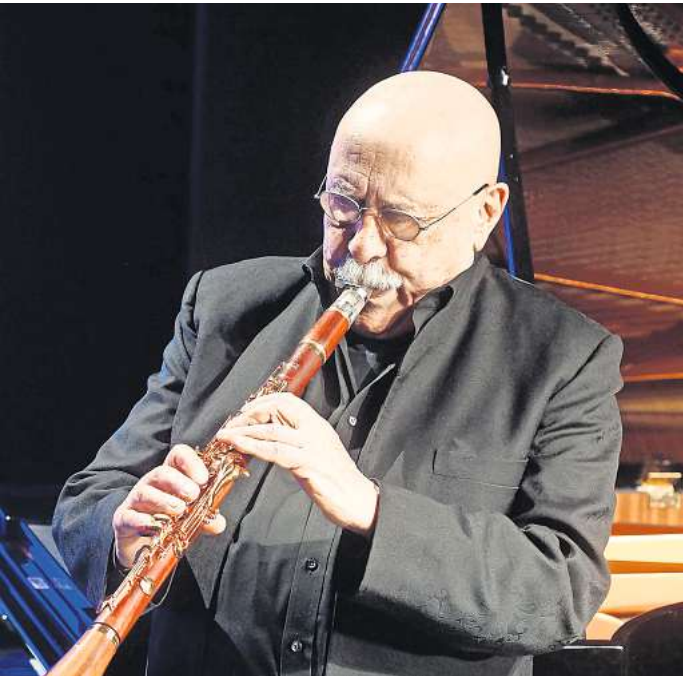
Giora Feidman tritt im Stadthaus auf.