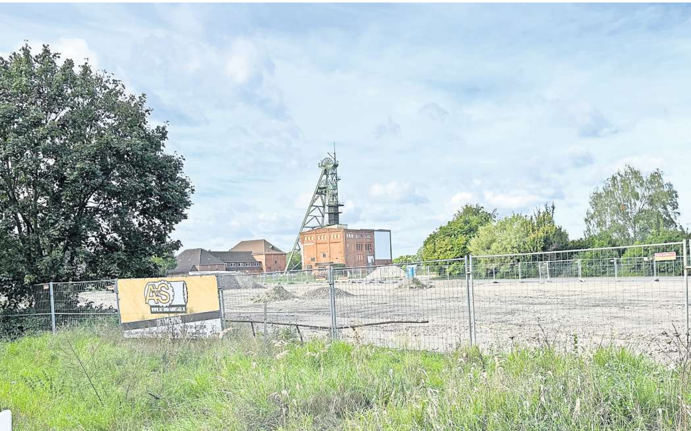
Wahrzeichen: Der Förderer auf dem ehemaligen Bergwerksgelände in Riedel soll wohl erhalten bleiben.

Kürzlich hat sich der Ausschuss für Klima, Verkehr, Umwelt und Planung mit dem Thema befasst. Das Gremium hatte eigens in Hänigsen getagt, um dem Interesse der Anlieger an