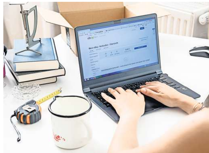
In der Regel können gebrauchte Gegenstände steuerfrei weiterverkauft werden – sofern man es nicht zu oft und gezielt macht. Foto: Christin Klose/dpa-mag

Wer häufig Dinge im Netz verkauft, sollte das laut der Bundessteuerberaterkammer im Blick haben. Denn durch das seit Jahresbeginn 2023 geltende Plattformen-Steuertransparenzgesetz müssen Betreiber von Online-Marktplätzen wie «Kleinanzeigen.de» den Behörden melden, wenn jemand im Jahr mehr als 30 Verkäufe getätigt und dabei insgesamt mehr als 2000 Euro Einnahmen erzielt hat. DPA