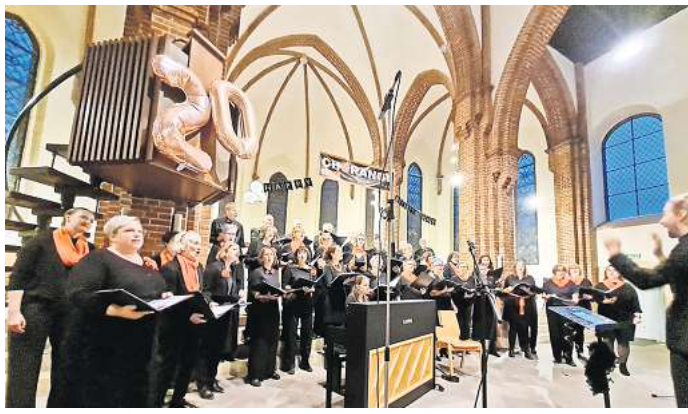
Das Ensemble Chorange hat 20 Stücke aus früheren und aktuellen Programmen präsentiert.