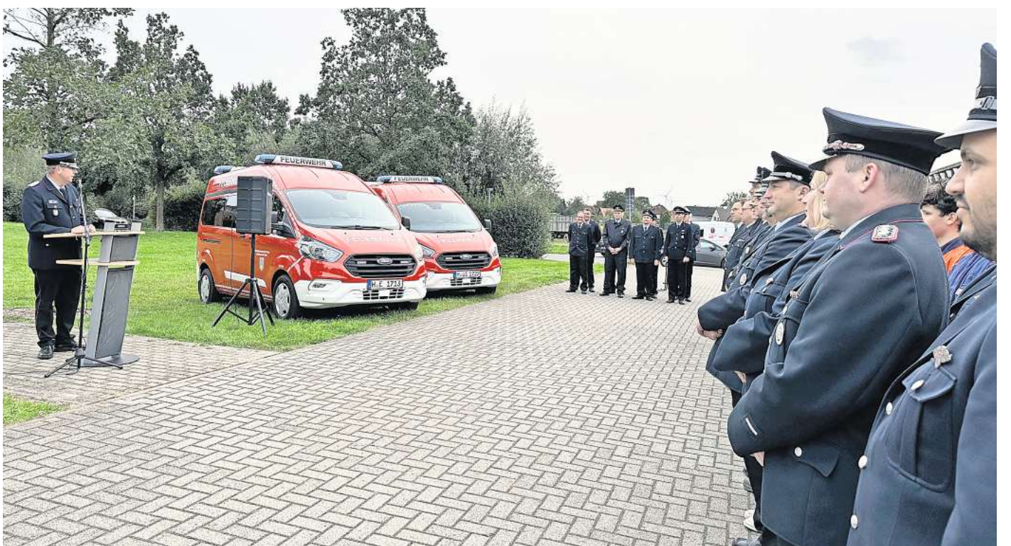
Feierliche Übergabe: Gleich fünf Ortsfeuerwehren in der Gemeinde Uetze erhalten neue Mannschaftstransportwagen.