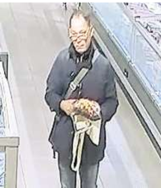
Mithilfe von Bildmaterial einer Überwachungskamera sucht die Polizei einen Tatverdächtigen.

Im gleichen Lebensmittelmarkt in Uetze entwendete der Gesuchte am Freitag, 7. Juli, gegen 12 Uhr die Geldbörse eines 83-jährigen Mannes. Zu einem weiteren Diebstahl durch den Unbekannten kam es am gleichen Tag, gegen 10 Uhr in