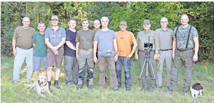
Jäger aus Schillerslage haben ehrenamtlich Rehkitze und andere Jungtiere mit einer Drohne geortet.

re nicht direkt berührt, denn sie dürfen nicht den Geruch von Menschen an sich haben, anderenfalls wird sie die Rikke nicht wieder annehmen. Die Jäger hatten die Drohne 2021 mit finanzieller Unterstützung der Stiftung für Tier- und Naturschutz ProTiNa angeschafft. Die Ehrenamtlichen freuen sich über den Erfolg ihrer Arbeit und wollen sie fortsetzen.