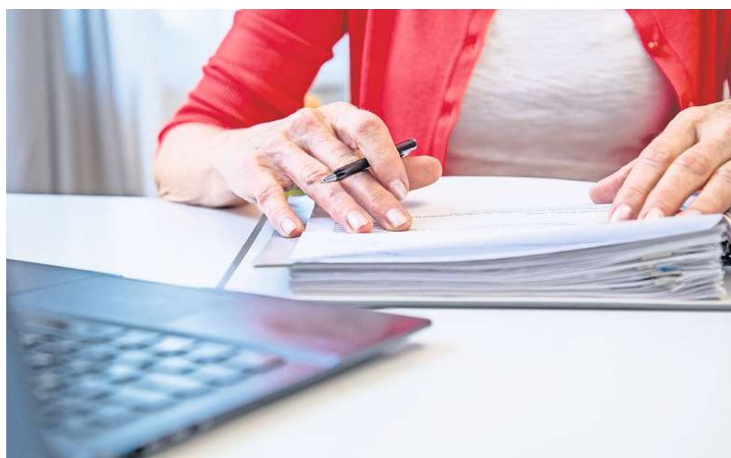
Steuern auf Krankengeld gibt es nicht. Die Zahlung wird aber bei der Ermittlung des Steuersatzes berücksichtigt – und kann zu einer höheren Einkommenssteuer führen.

So war es auch bei der Frau. Für sie ergab sich daraus eine Erhöhung der zu zahlenden Einkommensteuer für den Arbeitslohn. Die Rentenversicherungsbeiträge berücksichtigte das Finanzamt nicht steuermindernd. Dagegen klagte die Steuerzahlerin: es kom-