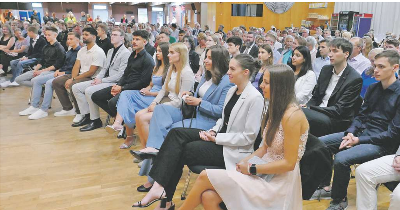
Bei der Feierstunde im Stadthaus warten die Abiturienten gespannt auf die Zeugnisübergabe.