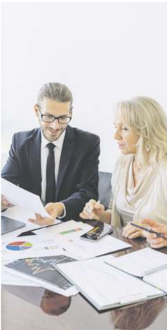
Auch Steuerberater müssen klare Grenzen einhalten.

Sehr viele Menschen nehmen die Hilfe eines Steuerberaters für ihre Einkommensteuererklärung in Anspruch. Das hat, neben dem geringeren Eigenaufwand, den großen Vorteil, dass der bestmögliche Gewinn aus der Erklärung gezogen wird. Steuerprofis handeln im Interesse ihrer Mandanten, ohne das Gesetz oder die Satzung ihres Berufszweiges zu verletzen. Steuerberater gehören den freien Berufen an und sind somit ein unabhängiges Organ der Steuerrechtspflege. Sie folgen den allgemeinen Grundsätzen der Unabhängigkeit, Eigenverantwortlichkeit, Gewissenhaftigkeit, Verschwiegenheit und verzichten auf berufsmäßige Werbung. Steuerberater müssen zudem vertrauensvoll mit den Daten und Zahlen ihrer Mandanten umgehen und sich allem enthalten, was mit dem Ansehen ihres Berufes nicht vereinbar ist. Darüber hinaus dürfen Steuerberater nicht tätig werden, wenn eine Kollision mit den eigenen Interessen gegeben ist. Das kann beispielsweise dann entstehen, wenn ein Steuerberater die Steuererklärung für seine erwachsene Tochter macht. Hier könnte es dazu führen, Grauzonen auszureizen oder sie gar zu überschreiten, damit es der Tochter finanziell zugutekommt. Eine weitere klare Grenze eines Steuerberaters ist die Beratung selbst. Er darf seine Mandanten nur in steuerlichen Fragen beraten, bei rechtlichen Fragen hat er ein