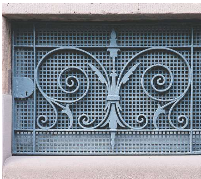
Ein Gitter vorm Kellerfenster sichert den Keller gut ab.