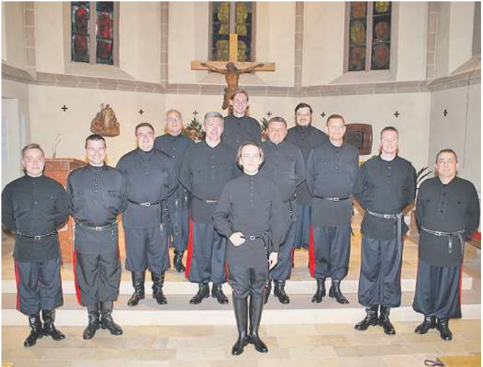
Der Don Kosaken Chor tritt in Uetze auf.

ke von Tschaiowski, Loworsky, Rimskij-Korsakow, Bortnjanskij sowie das Ave Maria von Johann Sebastian Bach und Charles Gounod. Karten sind im Vorverkauf für 22 Euro im Kirchenbüro an der Kirchstraße 7 erhältlich.