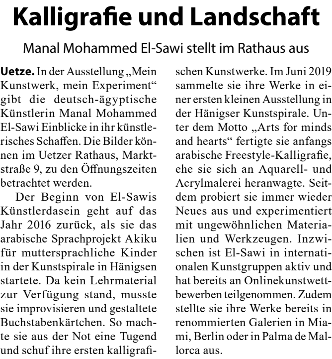
In der Ausstellung im Uetzer Rathaus zeigt Manal Mohammed El-Sawi unter anderem ihr Werk „Die Blauen Wellen im dunklen Meer“.