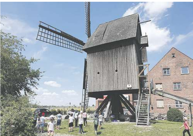
Die Kinder der Sommerschule des Burgdorfer Mehrgenerationenhauses freuen sich, als sich die Flügel der Bockwindmühle plötzlich drehen.