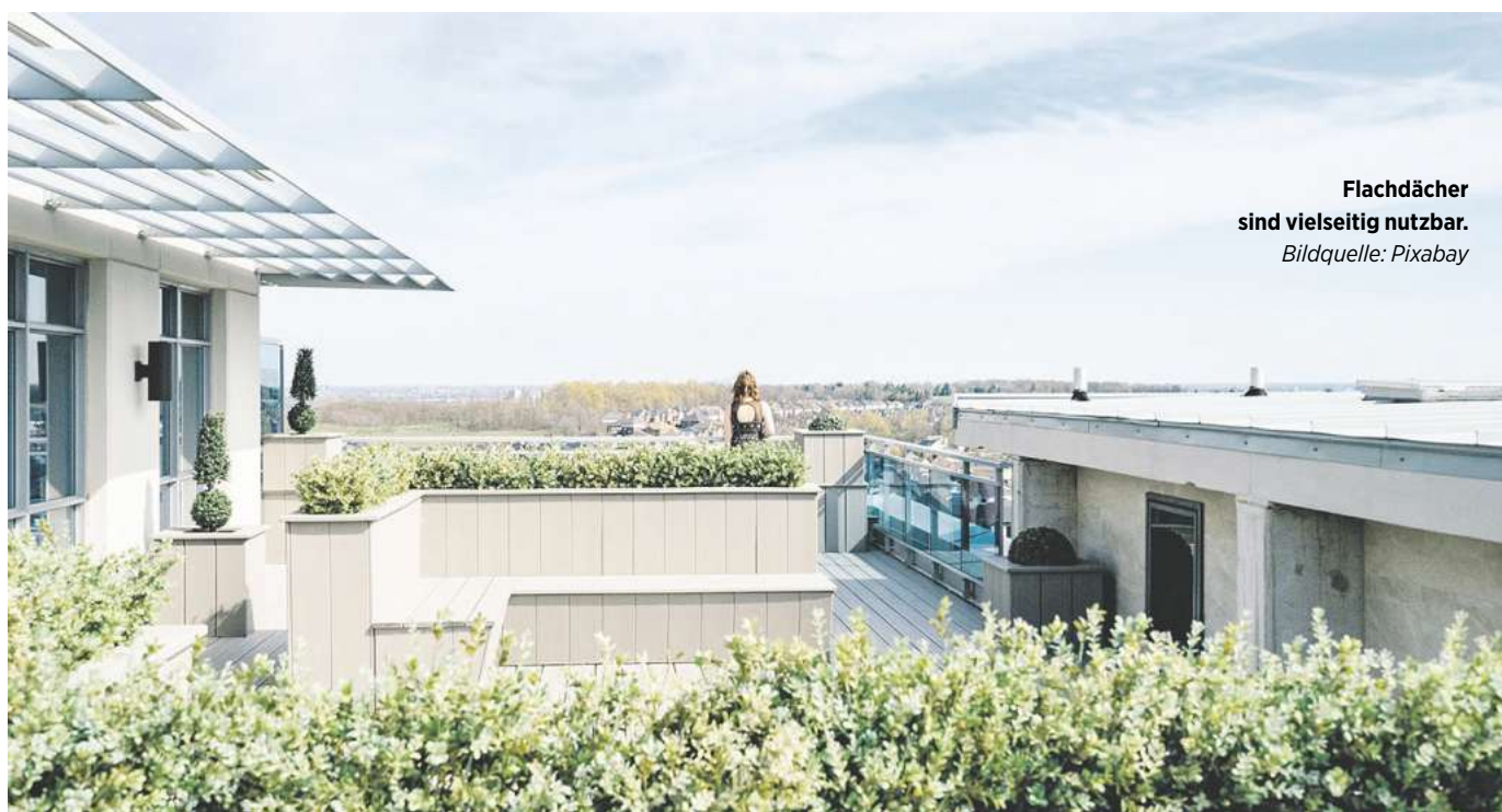
Flachdächer sind vielseitig nutzbar.