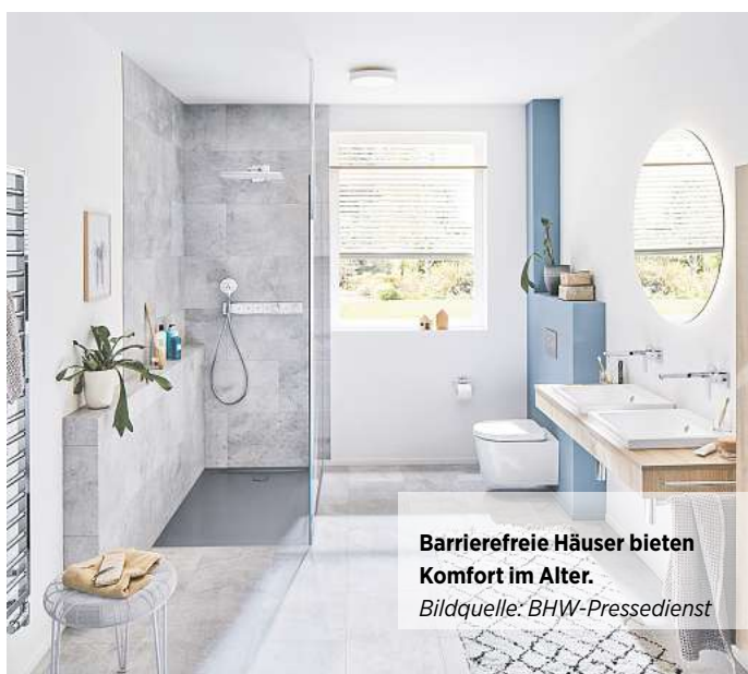
Barrierefreie Häuser bieten Komfort im Alter.

Mit zunehmendem Alter ändern sich die Bedürfnisse an das häusliche Umfeld. Alltägliche Situationen, die in jungen Jahren keinerlei Schwierigkeiten darstellen, werden im Alter nicht selten zur Herausforderung. Dies gilt es bei der Planung des Hausbaus zu berücksichtigen, um später wenige Veränderungen vornehmen zu müssen. Besonderes Augenmerk liegt dabei bei der täglichen Körperpflege. Ein altersgerechtes Badezimmer bietet auch jungen Familien Komfort und einige Vorteile. Heutzutage werden daher meist ebenerdige Duschen geplant und installiert. Der stufenlose Zugang ist praktisch und reduziert Gefahren durch Stolperfallen. Außerdem sind diese Lösungen meist auch optisch ansprechend und entsprechen heutigen Designstandards. Sollte ein Familienmitglied später auf eine Gehhilfe in Form eines Rollators oder gar auf einen Rollstuhl angewiesen sein, ist ein problemloser Zugang zur Dusche weiterhin möglich. Des Weiteren kann man beim Hausbau auf Barrierefreiheit achten. Treppenstufen sollten wo möglich vermieden werden und am Hauseingang beispielsweise durch einen stufenlo-