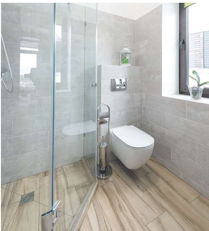
Beständig und robust: Fliesen in Holzoptik eignen sich auch fürs Bad.