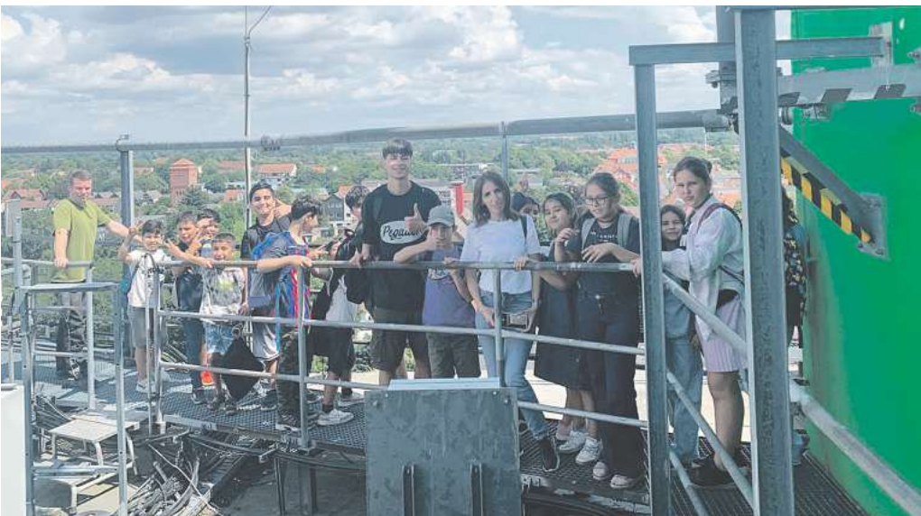
Vom Raiffeisen-Turm aus haben die Sommerschüler einen tollen Ausblick auf Burgdorf.

Auch Ausflüge, die nicht zu dem Thema zählen, gehören zur Sommerschule. Das inklusive und für die Teilnehmenden kostenfreie Angebot wird in Kooperation mit dem Nabu Burgdorf-Lehrte-Uetze, der Ju-