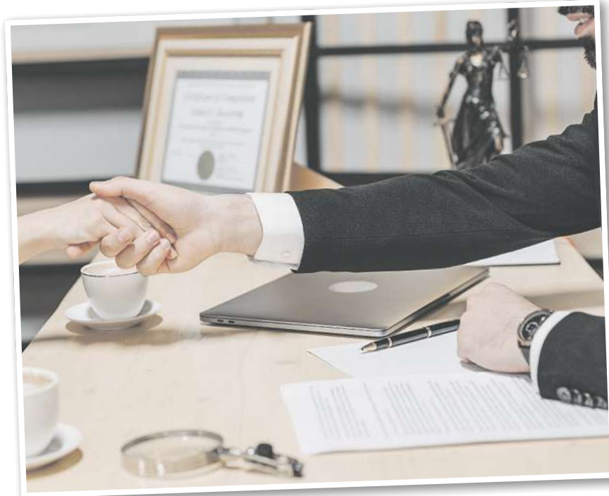
Anwälte für Sozialrecht kämpfen für soziale Gerechtigkeit.