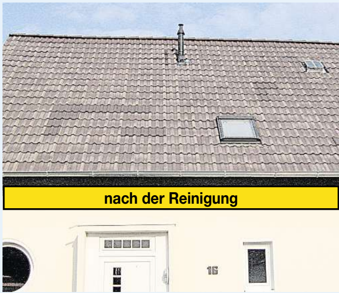
nach der Reinigung

Ein gepflegtes Dach schützt und verjüngt Ihr Haus und macht es wieder funktionstüchtig. Selbstverständlich bieten wir Ihnen auch zusätzlich eine Beschichtung Ihres Daches an. Nutzen Sie jetzt dieses Angebot, es wird auch mit Beschichtung insgesamt günstiger.