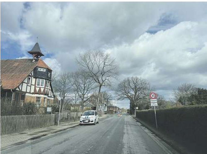
Bisher haben Kommunen nur an besonders gefährdeten Punkten wie hier vor der Kita Katensen innerorts ein Tempolimit anzuordnen.

Gemeinde tritt bundesweiter Initiative bei