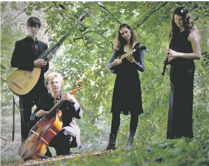
Das Bremer Barockmusikensemble La Ninfea tritt im Burgdorfer Schloss auf.

Das Bremer Barockmusikensemble La Ninfea hat Bearbeitungen des bekannten Gasenhauers „Greensleeves und Pudding Pies“ ebenso im Gepäck wie etliche weitere Traditionals und Tanzmusik. Außerdem spielen die vier Musiker Werke von Georg Friedrich Händel und wei-