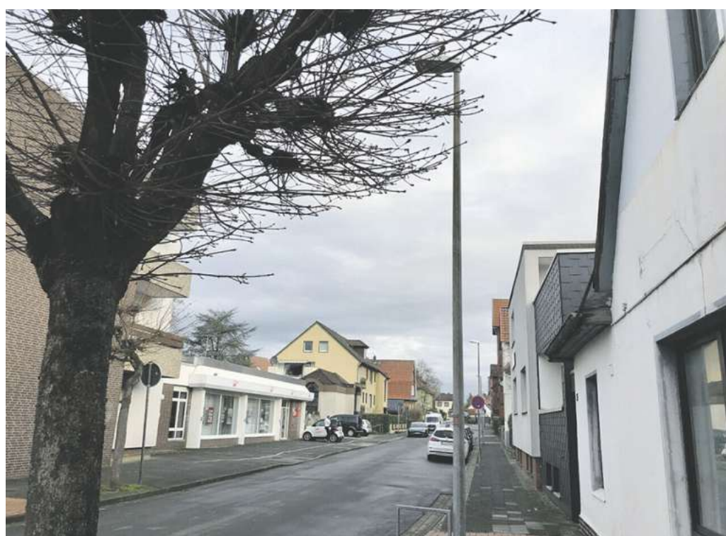
Die Schulstraße soll saniert und aufgewertet werden.

Auch die Barrierefreiheit soll nicht zu kurz kommen. So ist vorgesehen, die Fußgängerampel an der Ecke Gartenstraße/Schulstraße barrierefrei umzubauen und mit einem Blindenleitsystem auszustatten.