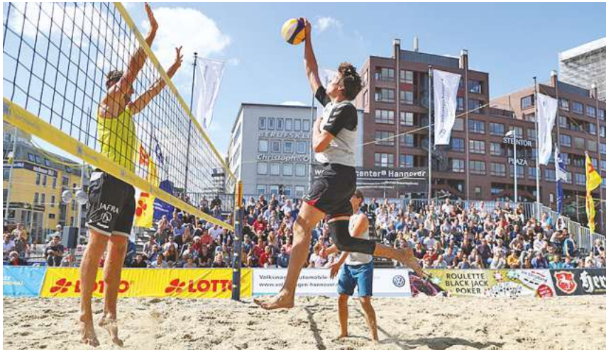
Faszinierende Spielzüge werden beim Beachvolleyball-Turnier am Steintor zu sehen sein.

Beachvolleyball-Turnier vom 21. bis 23. April