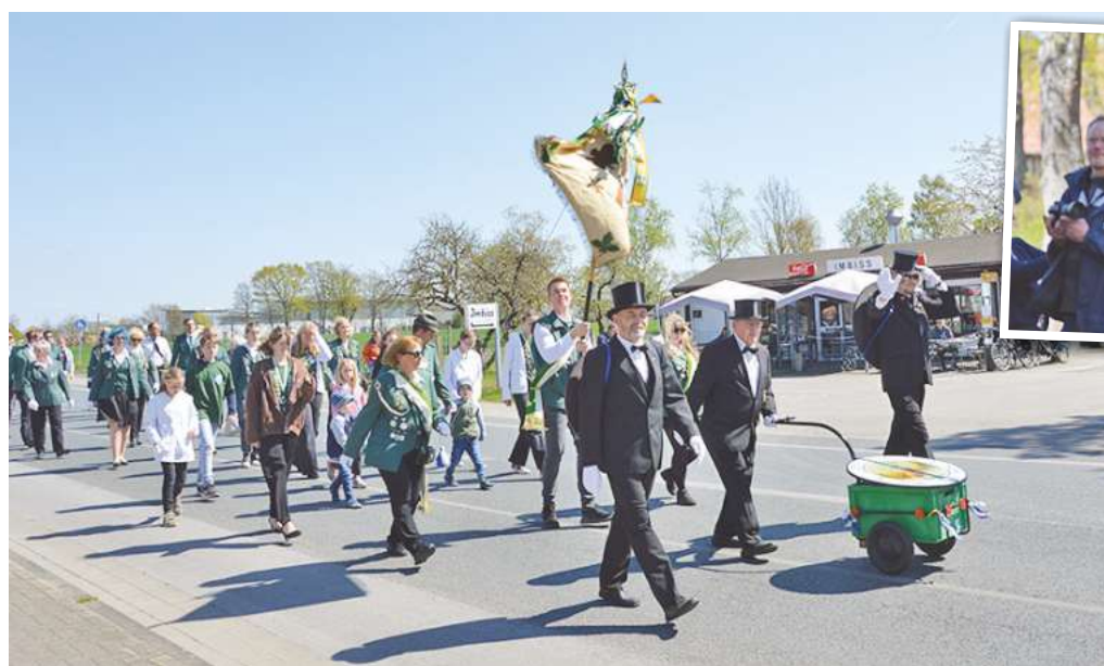
Die Hülptingser Schützen marschieren bei den Festumzügen durch den Ort.

Nur im ersten Corona-Jahr haben sie wie alle anderen Ortschaften auch pausiert. Aber schon 2021 hat der Hülptingser Schützenverein als einziger im Kreis schützenverband (KSV) Burgdorf wieder ein Fest gefeiert – damals unter strengen Auflagen zum Infektionsschutz. Auch im vergangenen Jahr gab es noch