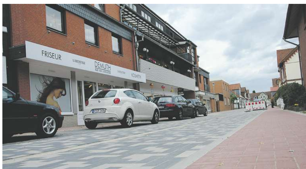
Als Vorbild soll die bereits sanierte Nordstraße dienen.