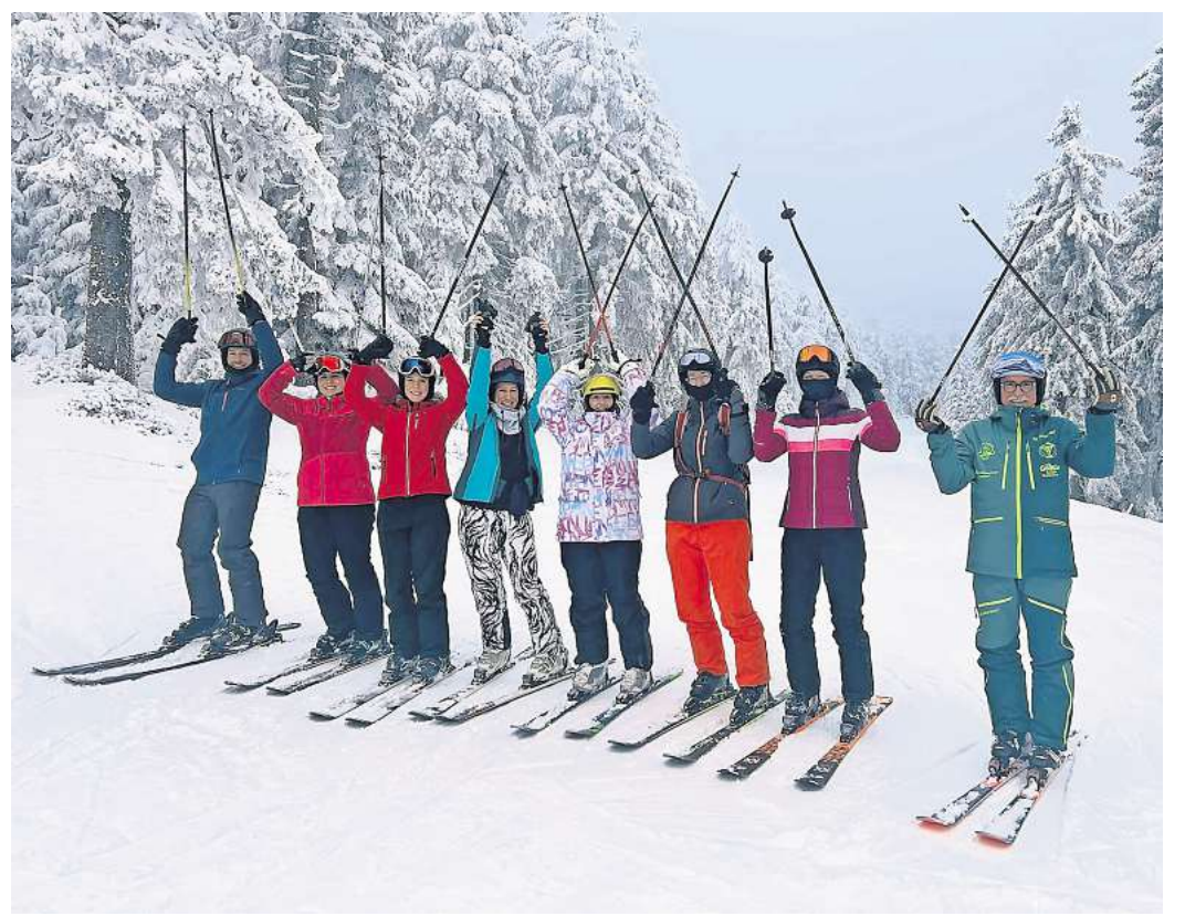
In den Zeugnisferien ging es ins Skigebiet Klínovec in Tschechien.

Der Skiclub der TSV Burgdorf zieht damit eine insgesamt positive Saisonbilanz und richtet den Blick bereits auf die Planungen für den kommenden Winter.