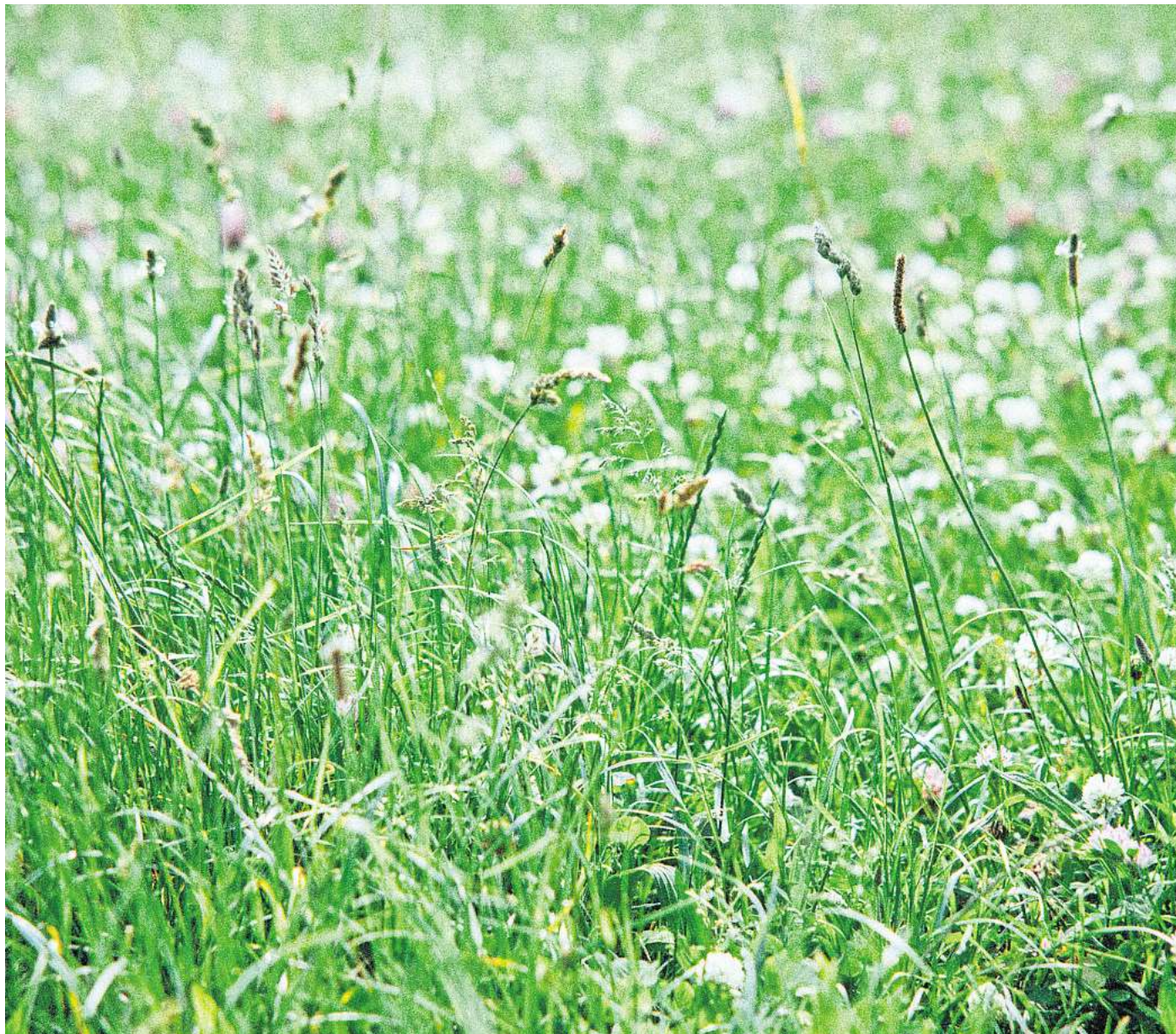
Eine ungemähte Wiese bietet Lebensraum und Nahrung für Insekten.

Neben dem Schutz der Artenvielfalt bietet der mähfreie Monat weitere Vorteile: Höheres Gras beschattet den Boden, speichert Feuchtigkeit besser