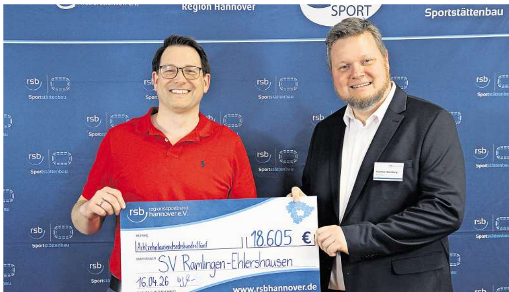
In Burgdorf profitiert der SV Ramlingen-Ehlershausen von einem Zuschuss in Höhe von 18.605 Euro für die Errichtung einer Bewässerungsanlage für die Sportplätze A und B.