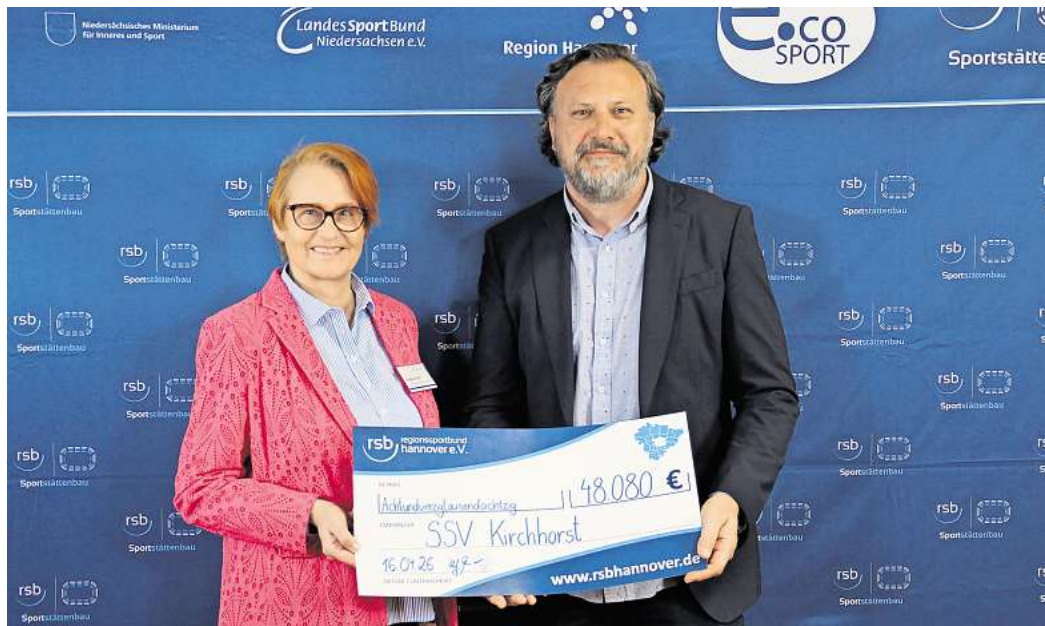
Der SSV Kirchhorst freut sich über einen Zuschuss von 48.080 Euro für den Neubau eines Mehrzweckplatzes.

REGION HANNOVER (r/bs). Der organisierte Sport im Osten der Region Hannover kann sich über kräftige finanzielle Unterstützung freuen: Im Rahmen des Sportstättenbauprogramms 2026 fließen erhebliche Fördermittel in Vereine in Burgwedel, Isernhagen, Burgdorf, Uetze, Lehrte und Sehnde. Der Regionssportbund Hannover (RSB) verteilt gemeinsam mit dem LandesSportBund Niedersachsen sowie weiteren Fördergebern Zuschüsse in Millionenhöhe.