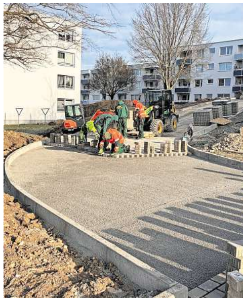
Für Pflasterarbeiten in größeren Projekten ist das ganze Team im Einsatz.