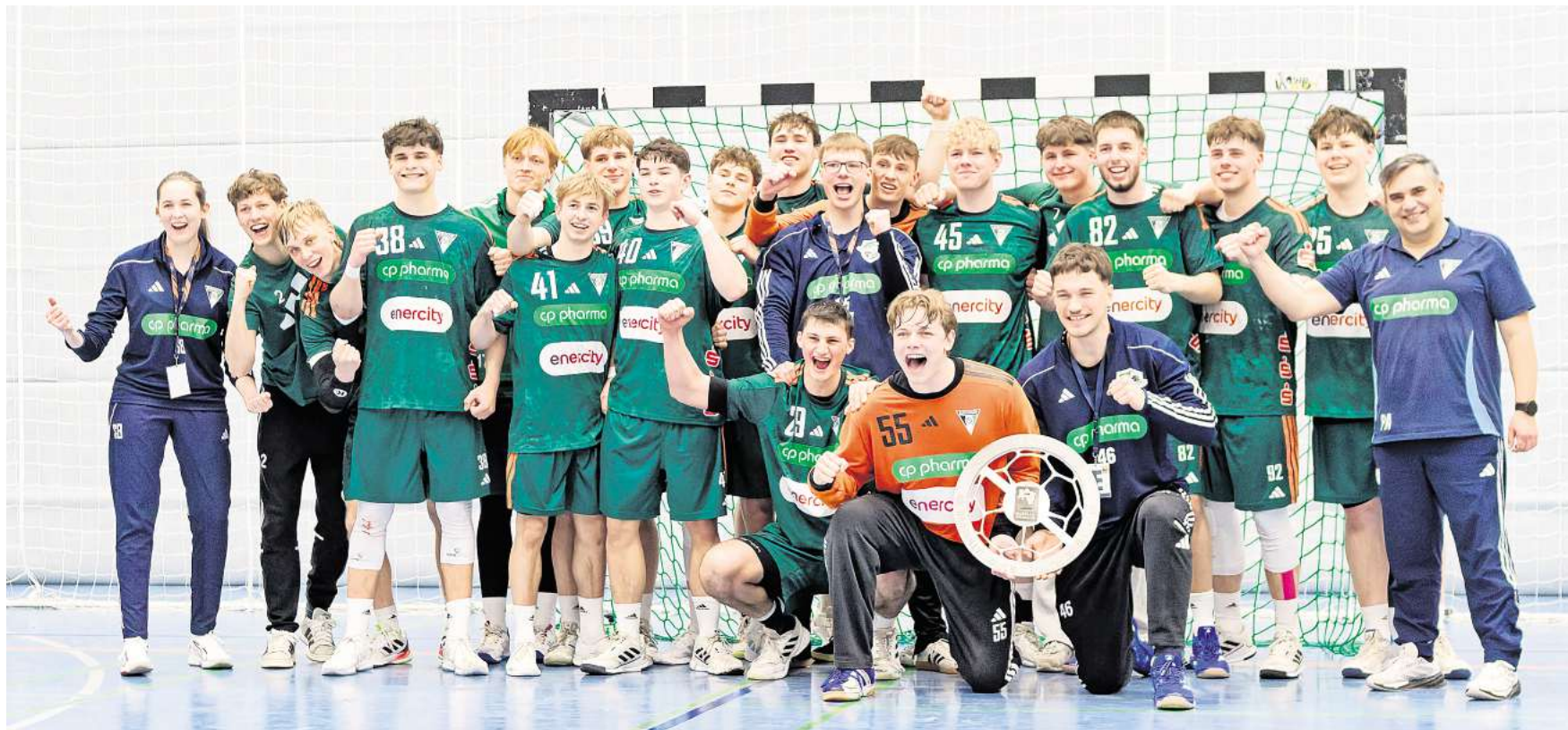
Jubel nach dem Spiel: Die U23-Mannschaft freut sich über ihren Aufstieg.

Am vorletzten Spieltag hat die Mannschaft sich nach langem Rückstand doch noch den entscheidenden Sieg geholt