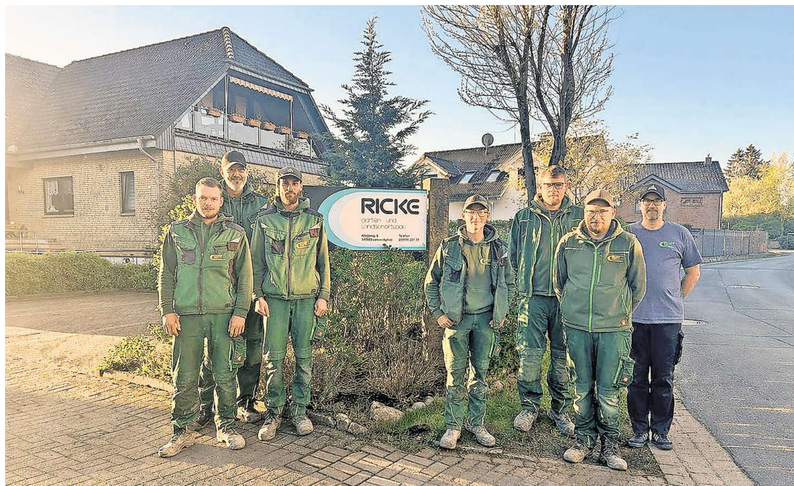
Das Team von Ricke Garten- und Landschaftsbau auf dem Betriebs- hof in Lehrte- Arpke, Ahrbeke 9.