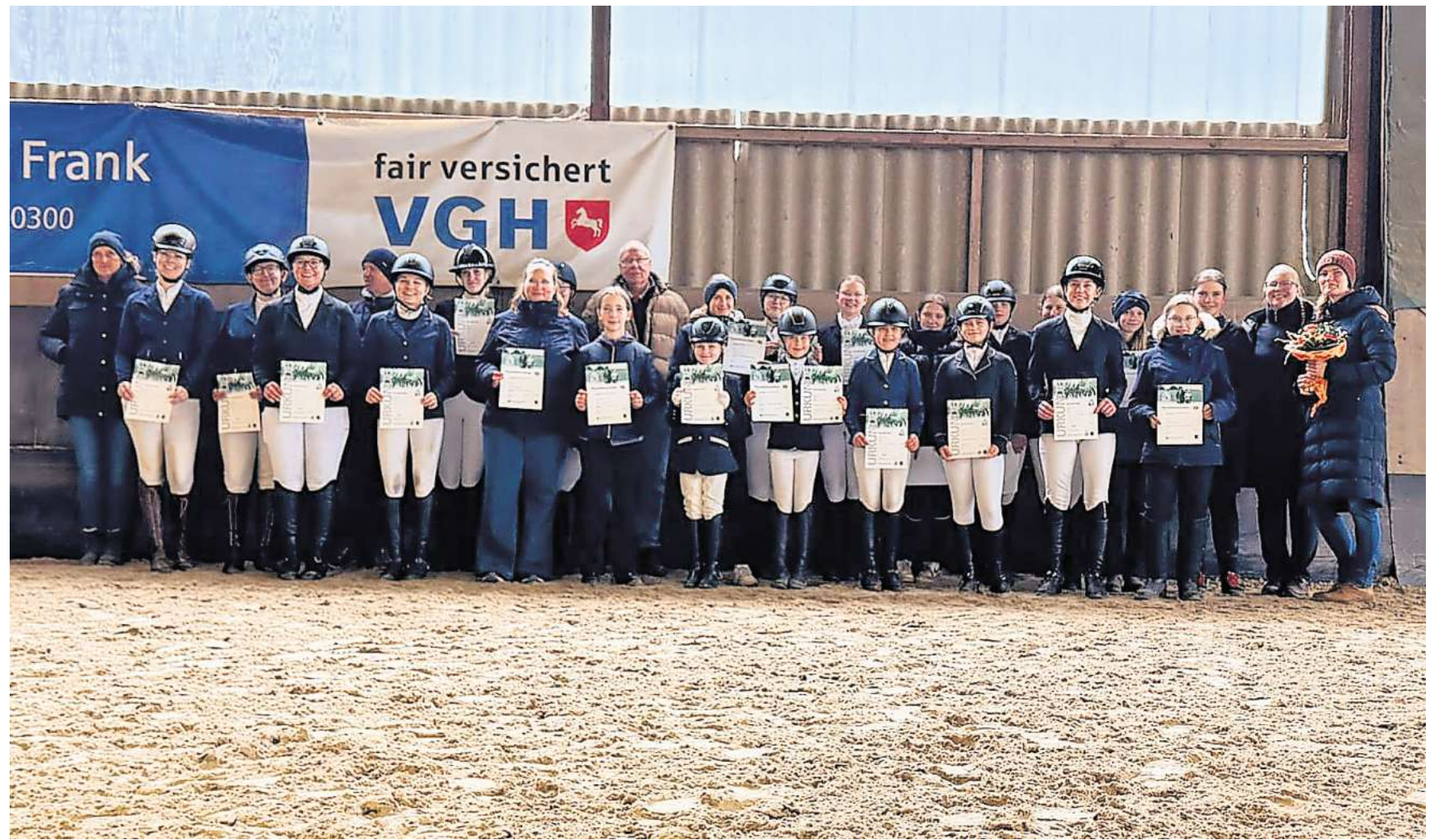
Nach dem Reitabzeichenlehrgang ist die Freude über die bestandenen Prüfungen groß.

Mitglieder im Alter von neun bis über 40 Jahren legen erfolgreich die Prüfungen ab