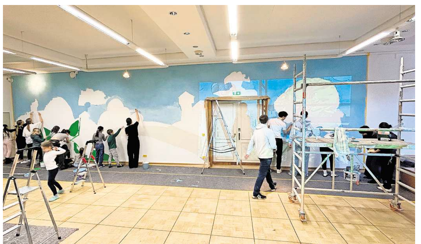
Die Kinder und Jugendlichen gestalten das Wandbild in der Aula.

Der Besuch Ingo Siegners am 10. April verlieh dem Projekt schließlich eine besondere Bedeutung. Der Autor zeigte sich beeindruckt von der künstlerischen Leistung und der Zusammenarbeit der jungen Beteiligten.