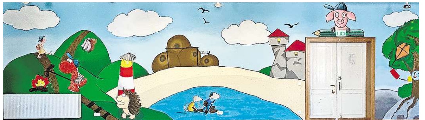
Die Aula der Ingo-Siegner-Grundschule ist mit dem kleinen Drachen Kokosnuss und weiteren Figuren aus den Kinderbüchern des Namensgebers neugestaltet.