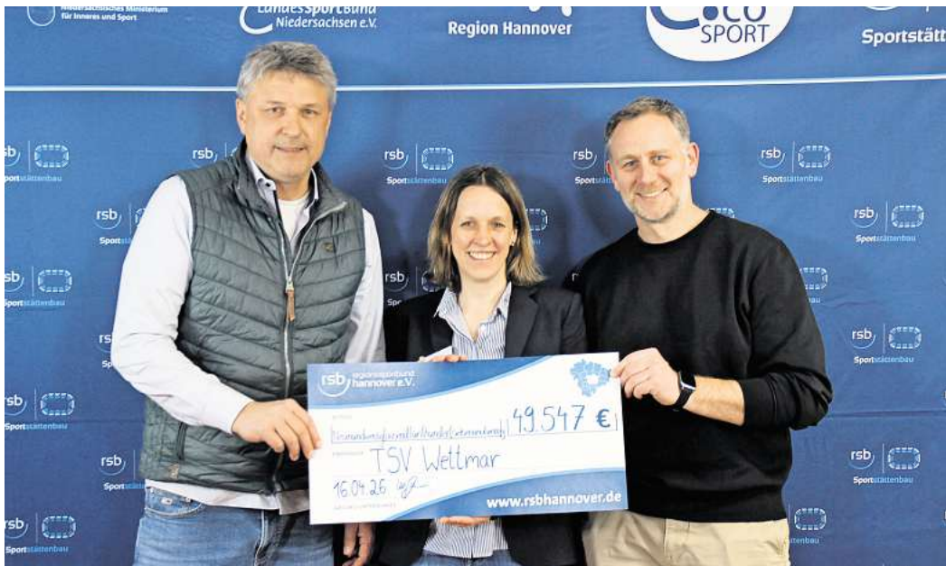
Für den Austausch der alten Heizungsanlage und den Anschluss an ein Nahwärmenetz bekommt der TSV Wettmar vom Regionssportbund einen Zuschuss in Höhe von 49.547 Euro.

Zahlreiche Projekte in Burgwedel, Isernhagen, Burgdorf, Uetze, Lehrte und Sehnde profitieren von Rekordförderung