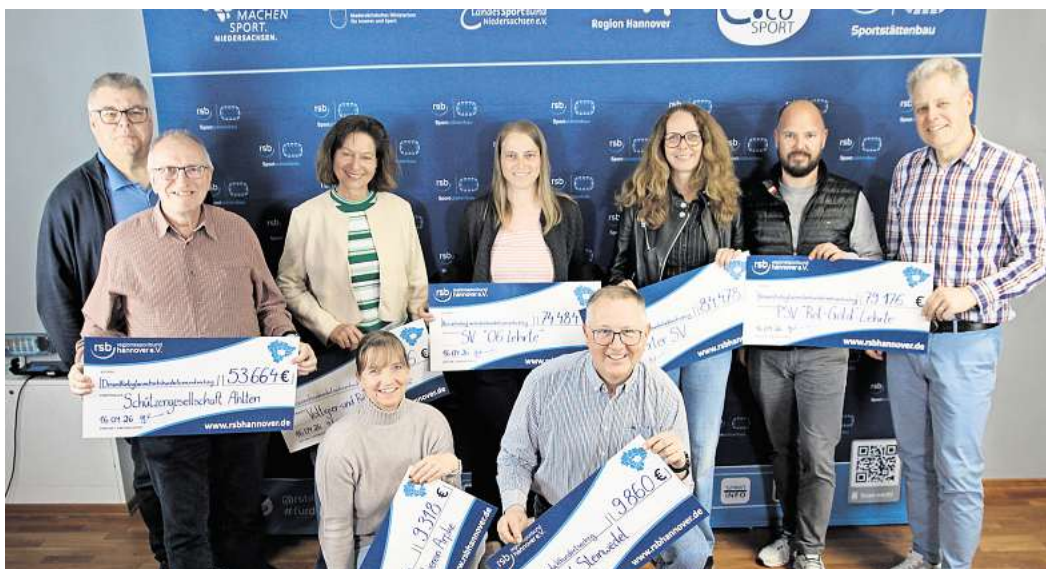
Ein Schwerpunkt der Förderung liegt in Lehrte: Der Lehrte SV erhält vom Regionssportbund 84.478 Euro für die energetische Sanierung der Heizungs- und Lüftungsanlage sowie die Fenstersanierung in der Jahnturnhalle.

Mit Blick auf die Vielzahl der Projekte wird deutlich: Die Förderung kommt in der Fläche an. Ob große Sanierung oder kleinere Einzelmaßnahmen – nahezu jede Kommune im Ostkreis profitiert. Für die Vereine bedeutet das einen entscheidenden Schritt, um auch in Zukunft attraktive Sportangebote vorhalten zu können.