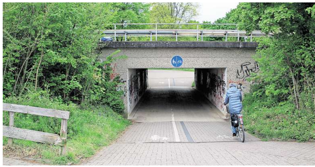
Nicht sicher genug: Der Radweg im Magdalenenentunnel in Burgdorf kann gefährlich werden.

Das Planungsbüro der Üstra prüft nun, wie hoch die Kosten für einen Neubau des Magdalenenentunnels liegen würden. Nach einer Zustimmung zur Vorgehensweise sei der Beginn der