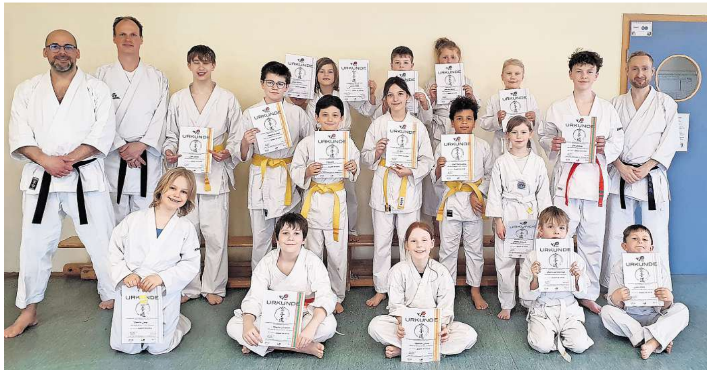
Die Trainer freuen sich zusammen mit den Kindern und Jugendlichen über die bestandenen Gürtelprüfungen.