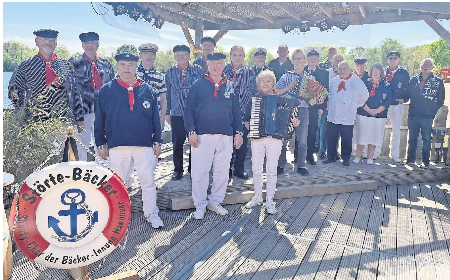
Insgesamt elf Chöre aus der Region Hannover und ein Chor aus Salzgitter freuen sich am 9. und 10. Mai auf viele Besucherinnen und Besucher.

Fünftes Shantychor-Festival geht am 9. Und 10. Mai am Silbersee über die Bühne