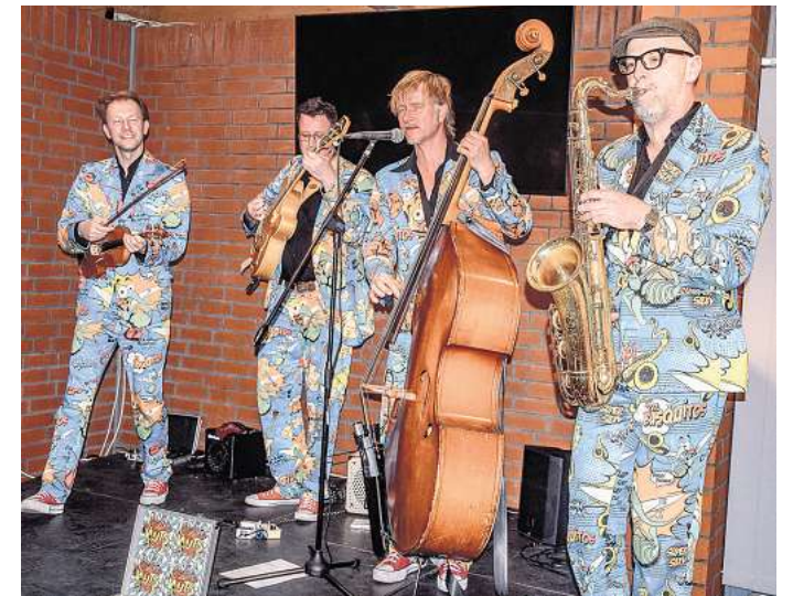
The Busquitos aus den Niederlanden haben im JazzSalon des Stadthauses für gute Laune gesorgt.

Musikalische Höhepunkte waren unter anderem „Yackety Sax“ im rasanten Doo-Wop-Stil