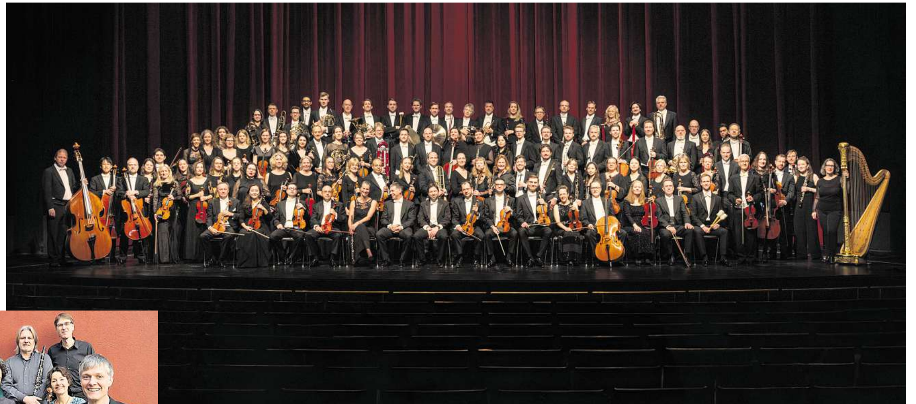
Das Niedersächsische Staatsorchester Hannover spielt gleich zwei Neujahrskonzerte am 1. Januar 2026: ab 12 Uhr und ab 19.30 Uhr.