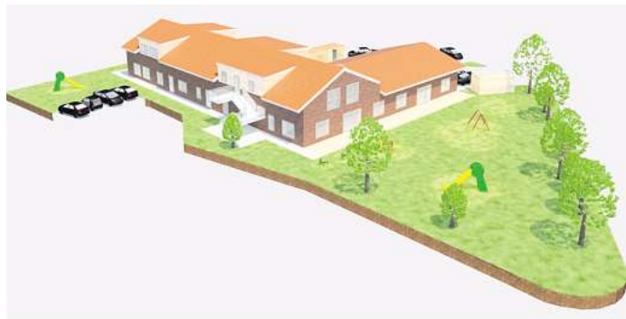
Nach ersten Bedenken aus dem Ortsrat hatte der private Investor umgeplant: So soll die auf drei Gruppen reduzierte Kita am Kapellenweg nun aussehen. Foto: Visualisierung: Johanniter

Die dreizügige Kindertagesstätte mit rund 60 Plätzen soll auf dem Grundstück eines aufgegebenen Hofes am Kapellenweg entstehen, auf dem bereits mehrere Wohnhäuser errichtet wurden. Im Zentrum der Kritik steht