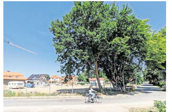
Die neue Kita soll auf dem Grundstück eines aufgegebenen Hofes am Kapellenweg entstehen.

Die neue Einrichtung ist vor allem für den überörtlichen Bedarf