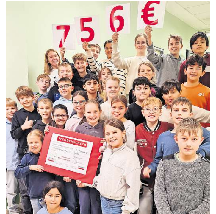
Die Klasse 5b präsentiert den Spendenscheck für den Verein Herzenswünsche.

Die Spendensumme wird nun gleichmäßig auf zwei wohltätige Zwecke aufgeteilt. Jeweils 756 Euro gehen an den Verein Herzenswünsche, der schwer kranken Kindern und Jugendlichen besondere Wünsche erfüllt, sowie an das Tierheim Burgdorf.