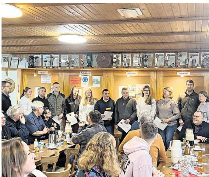
Die Ortsfeuerwehr Altmerdingsen ist zu einem gemütlichen Frühstück zusammengelassen.