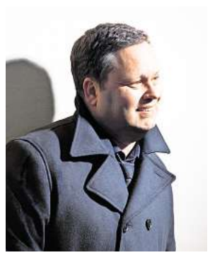
Der britische Star-Tenor Paul Potts tritt im Stadthaus auf.

Mit der Kombination aus Stimme und Piano entsteht ein Klangbild, das gleichzeitig kraftvoll und bewegend ist – ein Konzerterlebnis, das noch lange nachhallt. „Ich möchte die Menschen berühren –