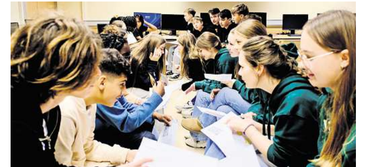
Die Schüler vom Gymnasium Uetze kommen mit ihren französischen Austauschpartnern ins Gespräch.

Kreis vertieften. Der Austausch im Rahmen von Erasmus+ zeigte einmal mehr, wie wertvoll internationale Begegnungen für junge Menschen sind – für das gegenseitige Verständnis, für die Sprachkenntnisse und nicht zuletzt für persönliche Freundschaften, die oft weit über den Austausch hinaus Bestand haben.