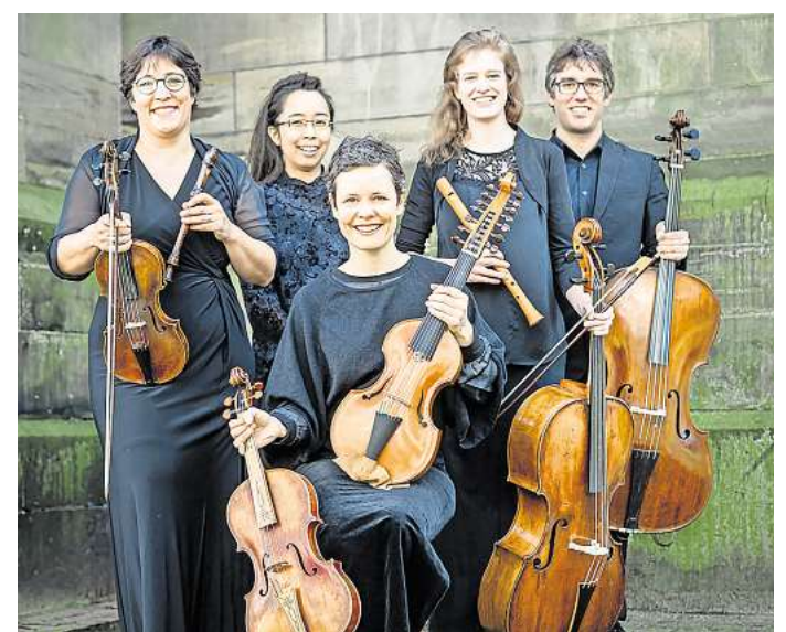
Das Ensemble La Festa musicale spielt Werke von Telemann, Bach und weiteren Komponisten.

Der Veranstaltungskalender bietet eine Übersicht über Konzerte, Comedy, Theater und vieles mehr.