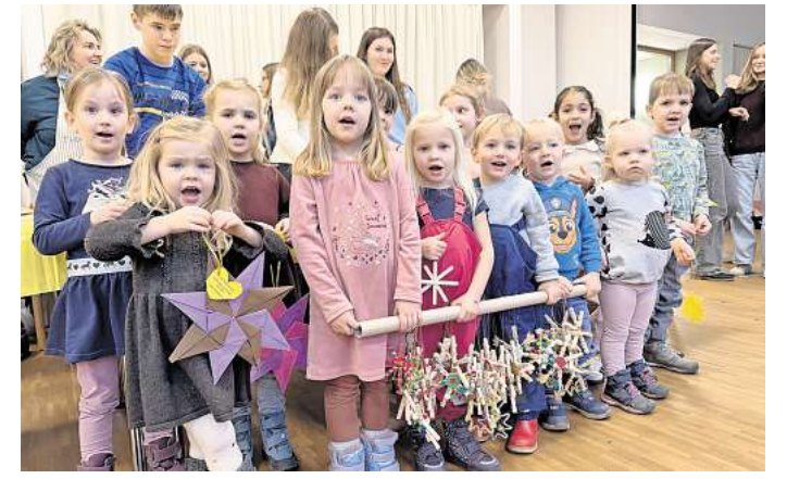
Sterne gebastelt: Uetzer Kita-Kinder wollen anderen Menschen in Not helfen.