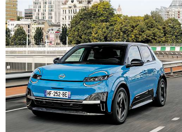
Neuauflage des Nissan Micra bald erhältlich.

gen wie eine abnehmbare Anhängerkupplung und Dachquerträger. Zwei Batterieoptionen mit 52 kWh und 75 kWh stehen für den Nissan Leaf zur Wahl und bieten bei einem Energieverbrauch von nur 13,8 kWh/100 km eine Reichweite von rund 440 Kilometern beziehungsweise bis zu 622 Kilometern (WLTP). Der Nissan Leaf unterstützt das