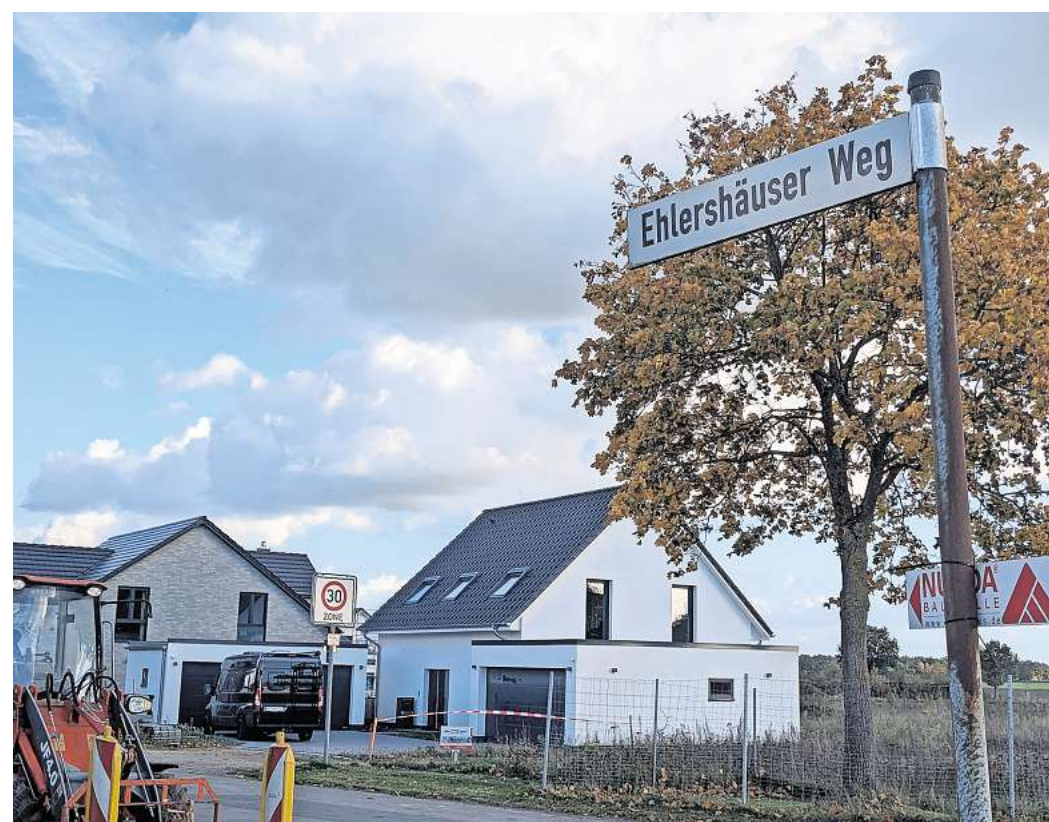
Am Ehlershäuser Weg: Einige der Grundstücke im Burgdorfer Neubaugebiet sind noch nicht verkauft.

Vor vier Jahren bei Beginn der Vermarktung bewarben sich 700 Interessierte auf die Grundstücke. Wegen der enormen Nachfrage sah sich die Stadt gezwungen, die Grundstücke per Losverfahren zu vergeben. Daran will sie auch weiter festhalten,