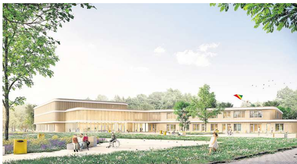
Mit ansprechender Kubatur und viel Platz auf dem Außengelände: Visualisierung der neuen Förderschule am Wasserwerk in Burgdorf. Visualisierung: Loomn Architektur / Jost Hauer Dipl.-Ing. Arch. TU

Die Region Hannover als Trägerin der Förderschule mit dem Schwerpunkt geistige Entwicklung rechnet mit Kosten in ähnlicher Höhe, wie sie die Stadt Burgdorf zuletzt für ihren IGS-Neubau aufbringen musste: fast 68 Millionen Euro plus weitere 2 Millionen Euro für die Erstaussstattung des Schulgebäudes. Ob dieser Ansatz zu halten sein wird oder ob sich das Projekt – wie zuletzt viele Schulneubauten in der Region – deutlich verteuert, bleibt abzuwarten.