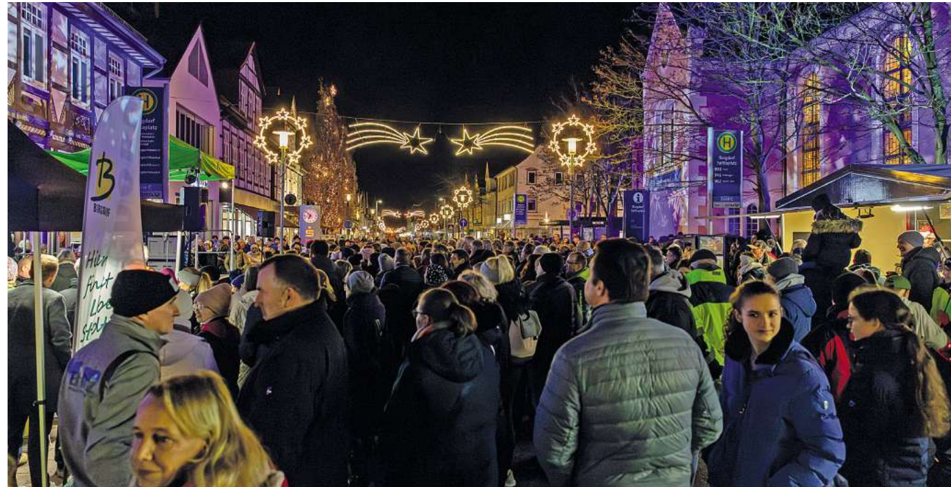
Die 20. Burgdorfer Lichtwochen hüllen die Innenstadt in festlichen Glanz.

Die Außenwirkung der Beleuchtung reicht dabei weit über die Stadtgrenzen hinaus. Bis zum 1. Januar 2026 bleiben die Lichter an und begleiten die Menschen durch die Adventszeit über das Weihnachtsfest bis auf den Neujahrstag. Wer die besinnliche Atmosphäre der Burgdorfer Lichtwochen erleben möchte, sollte sich die Gelegenheit nicht entgehen lassen, durch die festlich geschmückte Innenstadt zu schlendern, die sich als ein wahrer Lichtblick in der dunklen Jahreszeit offenbart.