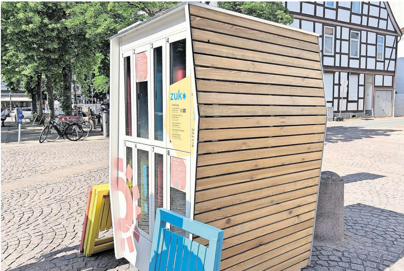
Seit Juni in Betrieb: An der „Zuko“-Verleihstation können sich Passanten in der Burgdorfer Innenstadt kostenlos Stühle ausleihen.

Nach der aktuellen Auswertung ist bei der Nutzung noch Luft nach oben – die Stadtverwaltung nennt es „zögerliche Neugier“. Zwischen dem 12. Juni und 23. Oktober, so das Ergebnis, wurden 204 Stühle verliehen. Für durchschnittlich 18 Minuten pro Stuhl. Meistens wurden zwei bis vier Stühle für einen längeren Zeitraum ausgeliehen, heißt 30 Minuten und mehr. Und: Einer von drei Nutzern hat den Klappstuhl mehrmals ausgeliehen. Die meisten Ausleihen gab es nachmittags bis abends in der Zeit von 14 bis 20 Uhr. Dazu die Stadt: „Diese