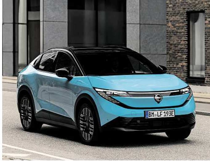
Der neue Nissan Leaf setzt erneut Maßstäbe. Foto: Nissan

des Innenraums, LED-Scheinwerfer mit Fernlichtassistent, LED-Rückleuchten, beheizbare, elektrisch verstellbare Außenspiegel sowie dunkel ge-