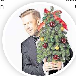
Mit Swing: Tom Gaebel spielt im Theater am Aegi.

Klezmer sowie Chanukka- und Musicals. Der Eintritt ist frei. ► Der Hannoversche Oratorienchor führt am Sonntag, 7. Dezember, ab 17 Uhr gemeinsam mit dem Barockensemble Concerto Ispirato in der Gartenkirche St. Marien, Marienstraße 35, Charentiers „Messe de Minuit pour Noël“ und weitere Werke auf. Der Eintritt ist frei. ► Der Heaven Can Wait Chor gastiert mit seinem „Christmas Special“ am Sonntag, 7. Dezember, ab 18 Uhr im Theater am Aegi. Tickets kosten 41,80 bis 62,50 Euro über HAZ/NP-Ticketshops. ► Das Junge Vokalensemble Hannover gestaltet das vorweihnachtliche Konzert „Europäische Weihnachten“ am Montag, 8. Dezember, ab 19.30 Uhr in der Gartenkirche St. Marien. ► Tom Gaebel und sein Orchester