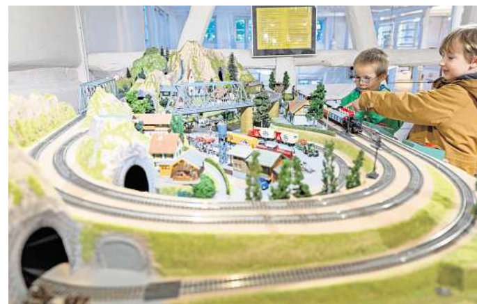
Für Modellbau-Fans gibt es im Dezember viel zu entdecken.

An beiden Tagen, 6. und 7. Dezember, findet zudem jeweils von 14 bis 17 Uhr ein Modell-eisenbahnflohmatt statt. Besucher können nach Sammlerstücken stöbern, Lokomotiven und Waggons erwerben oder sich mit Gleichgesinnten austauschen.