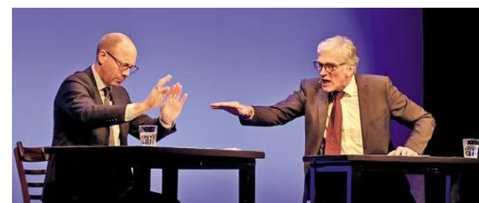
Mit dem Burgdorf Bonus gibt es 2 Eintrittskarten für das Theater am Berliner Ring zum Preis von 1 Karte, z.B. Lesung mit Johann von Bülow und Walter Sittler am 13. März 2026

pert GmbH und den Sanitärbetrieb Baran GmbH bis zur Elephant Solar GmbH (Phtovoltaikanlagen) und die Georg Parlasca Keksfabrik. Repräsentativ hervorzuheben sind ebenso das Bekleidungs- und das Restaurant Ayhan. Etliche Angebote für Kulturfreunde sind gleichfalls im Burgdorf Bonus zu finden. Dies betrifft unter anderem die Veranstaltungen des VVV und des Stadthauses.