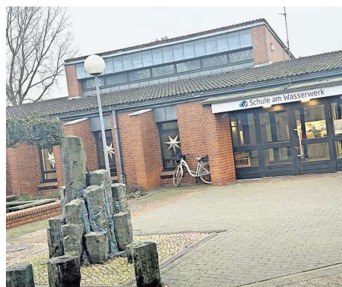
Der bisherige Standort der Schule am Wasserwerk entspricht nicht mehr den Anforderungen.

Außerdem reicht der Platz längst nicht mehr aus, um wachsenden Schülerzahlen und differenzierten Förderangeboten gerecht zu werden. Gebaut worden war die Schule einst für sieben Klassen, mittlerweile wird Platz für mehr als 20 benötigt. Die Förderschule nutzt deshalb gleich mehrere Außenstellen, unter anderem im alten IGS-Gebäude – mit entsprechenden