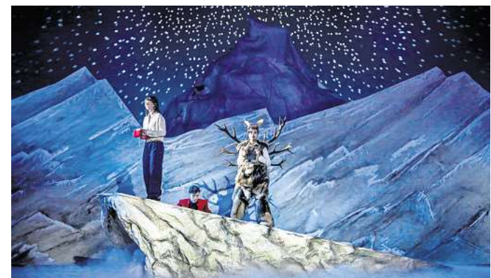
Wintermärchen: Das Schauspielhaus zeigt „Die Schneekönigin“.

► Weitere Termine und Tickets: staatstheater-hannover.de