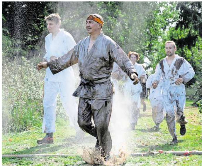
Das Krankenhaus-Team hat nach kurzer Zeit keine weißen Kittel mehr.

HEESSEL. Dreckige Kleidung, durchnässte Socken und ganz viel Matsch: Was auf den ersten Blick eher abschreckend klingt, ist beim „Gran Schlamm“ des SV Heebel seit Jahren die Grundlage für jede Menge Spaß. Bei strahlendem Sonnenschein gingen am Wochenende wieder Hunderte Menschen, teils sogar mit ihren Hunden, auf dem Sportplatz an den Start, um am beliebten Matschlauf teilzunehmen.