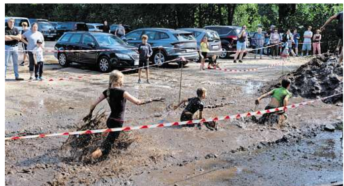
Beim GranSchlamm-Lauf bleibt niemand sauber.

Außerdem wächst man so nochmal ganz anders mit seinem Hund zusammen, weil man Dinge zusammen meistert – das ist wirklich schön“, sagte Trautmann.