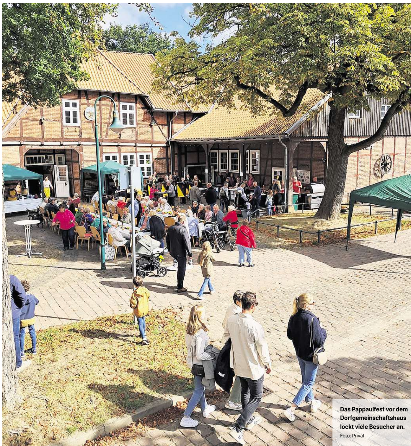
Das Pappaulfest vor dem Dorfgemeinschaftshaus lockt viele Besucher an.

Und auch bei den Kindern kommt währenddessen keine Langeweile auf. Denn für sie gibt es ein vielfältiges Mitmachprogramm. Beim Kinderschminken können sich die jüngsten Besucher in wilde Tiere, Superhelden oder Märchengestalten verwandeln lassen. Die Jugendpflege vom Pappaul, die Hänigser Kindergärten und die Kunstspirale laden zum Basteln und Spielen ein und die Landjugend baut eine Strohburg auf, auf der sich die Kinder nach Herzenslust austoben können. Der Bürgerschützenverein (BSV) Hänigsen bietet Schießen mit dem Lichtpunktgewehr an. Auch die Feuerwehr wird vor Ort sein und sich vorstellen.