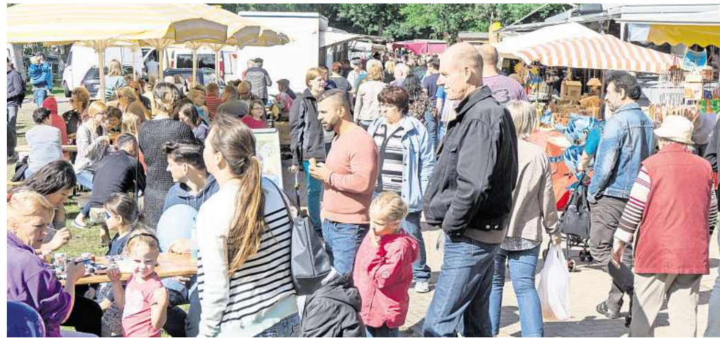
Die Saison der Pferde- und Hobbytiermärkte geht zu Ende.

Zum Saisonabschluss gibt es beim Pferde- und Hobbytiermarkt viele Mitmachaktionen für die jüngsten Besucher