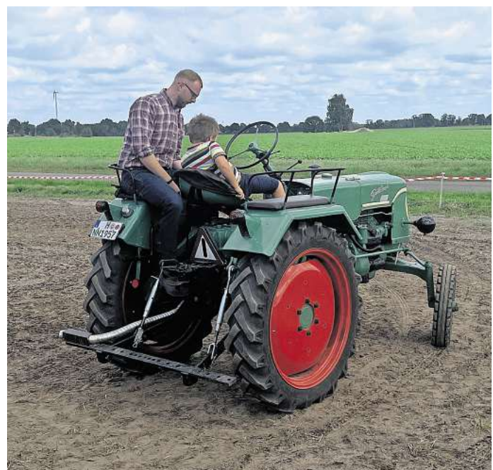
Kinder können einen Trecker steuern.