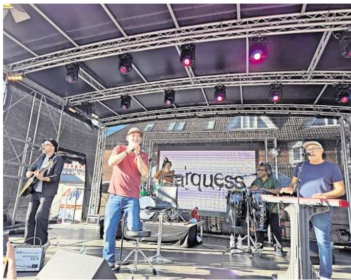
Die Band "Marquess" sorgt zum Abschluss des Zwiebelfestes auch musikalisch noch mal für die passende Sommerstimmung