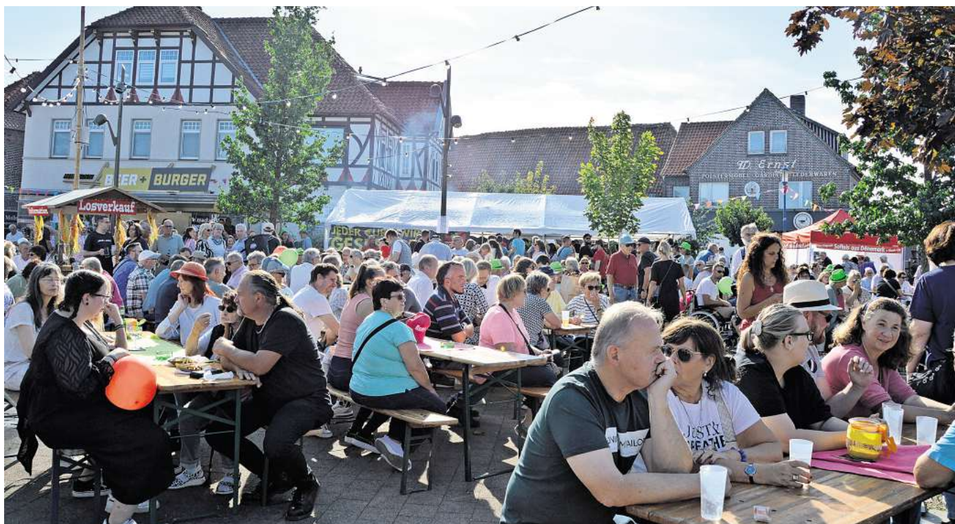
Bei traumhaftem Spätsommerwetter ist das Zwiebelfest an beiden Tagen gut besucht.

Eine Institution beim Zwiebelfest ist auch der Stand von „Chorange“, wo die Sängerinnen und Sänger des Ensembles wieder ihre legendäre Zwiebelsuppe servierten. „Die ist immer heißbe-