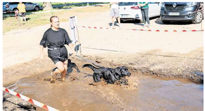
Auch die Hunde sind beim GranSchlamm-Lauf mit Begeisterung dabei.