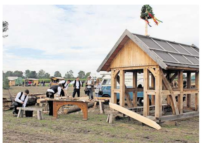
Die Besucher erleben, wie Zimmerer das Holz zu Balken verarbeiten und ein Fachwerkhaus errichten.

wird. Ab 11 Uhr beginnen dann die Vorfürungen. Zwischendurch gegen Mittag können die Kinder selbst in einem Parcours versuchen, einen Trecker zu steuern, natürlich dürfen das auch die Eltern testen. Außerdem gibt es eine Strohburg zum Toben, Basteln, Schminken und Ponyreiten. Ebenso wird das Dreschen von Getreide nicht fehlen, angetrieben von einem Lanz Bulldog, der per Riemenantrieb eine alte Dreschmaschine auf Trab bringt. An den Ständen gibt es Puffer, Eintopf aus der Gulaschkanone, Kartoffelstippe, Waffeln, Milchshakes, Flammkuchen, frisch gebackenes Brot und Bratwurst. Im Zelt stehen außerdem Kuchen, Torten und Kaffee bereit.