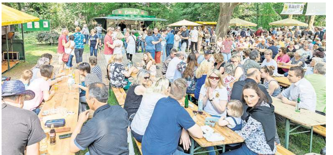
Die Veranstaltung "Musik und Tanz im Stadtpark" ist ein beliebtes Ausflugsziel am Himmelfahrtstag.