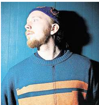
Live: Niklas Paschburg.