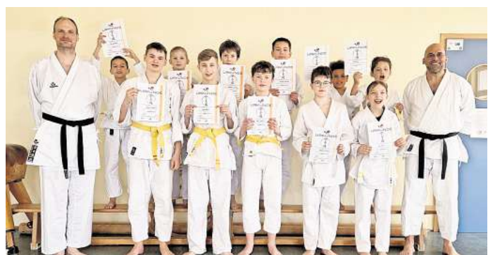
Elf Kinder haben beim Samurai Burgdorf ihre Karate-Prüfungen abgelegt und die nächste Gürtelstufe erreicht.

gezielt Ausdauer, Kraft und Technik. Dabei wird nicht nur die körperliche Fitness gefördert – auch Werte wie Respekt, Disziplin und Teamgeist spielen eine zentrale Rolle.