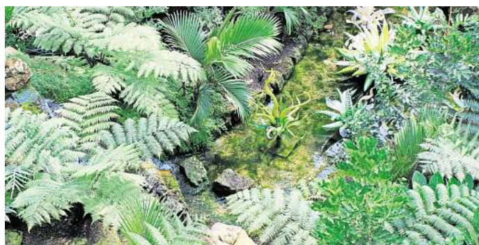
Farne sind nicht nur fürs Wohnzimmer geeignet – auch im Garten sorgen sie für Dschungelfeeling.

Für ein üppiges Beet eignen sich wegen ihrer gefiederten und rustikalen Blätter am besten Männerfarn, Königsfarn oder Tüpfelfarn. Wer eine Fassade mit Farnen begrünen will, kann sie mit Hortensien, Stiefmütterchen, Margeriten und Begonien kombinieren, um etwas Farbe ins Spiel zu bringen. (DPA)