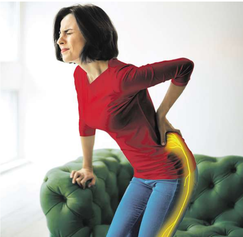
Der Ischiasnerv kann bis zu 40.000 Nervenfasern enthalten, die Informationen zwischen dem Gehirn und den Beinen transportieren.

Aus medizinischer Sicht ist es wichtig, für eine erfolgreiche Behandlung direkt an den Nervenschmerzen anzusetzen. Überraschend: Bei Nervenschmerzen zeigen viele Schmerzmittel nur wenig Wirkung, denn sie bekämpfen meist Entzündungen. Anders die Schmerztropfen Restaxil, die speziell zur Behandlung von Nervenschmerzen, wie z. B. bei einer Ischialgie, entwickelt wurden. So wird etwa der Arzneistoff Iris versicolor in Restaxil laut Arzneimittelbild vor allem bei Ischialgien mit ziehenden, reißenden und brennenden Schmerzen im Hüftnerv bis zum Fuß eingesetzt. Nicht weniger ein-drucksvoll wirkt Cimicifuga racemosa : Der Arzneistoff kommt erfolgreich bei aus-