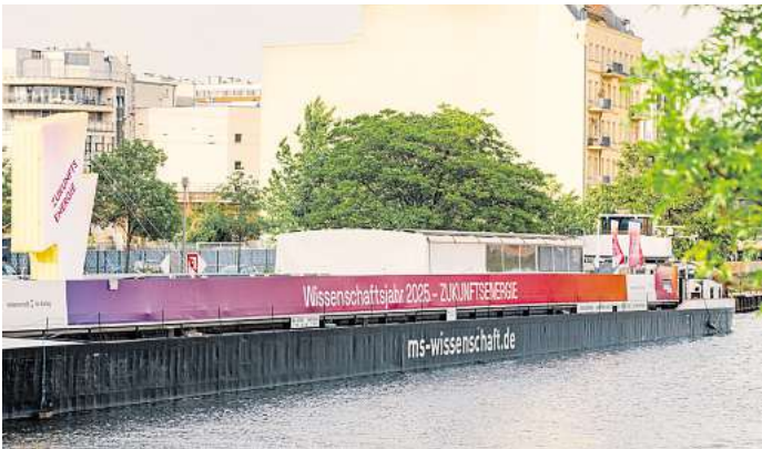
Die Ausstellung befindet sich im Bauch eines umgebauten Frachtschiffes.

künstlichen Blatt – seine Kombination von Photovoltaik und Elektrolyse in einer einzigen Zelle könnte in Zukunft grünen Wasserstoff im großen Stil produzieren. Wo und wie Wasserstoff eingesetzt werden kann, ist Thema weiterer Mitmach-Stationen.