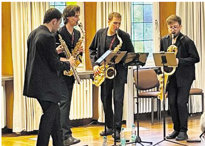
Das Kebyart Quartett zeigt, was das Saxophon zu bieten hat.