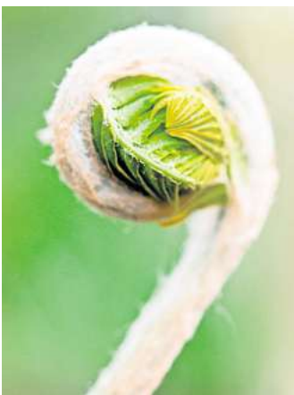
Majestätisch: Königsfarn ist einer der größten Farne für den Garten.