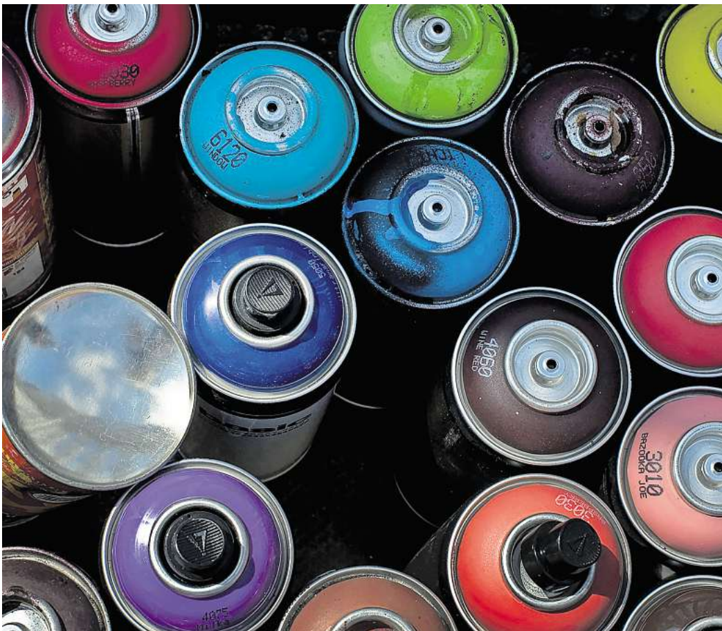
Auf Gefahrenhinweise achten – selten sind Spraydosen komplett leer, daher gehören sie auf den Wertstoffhof.