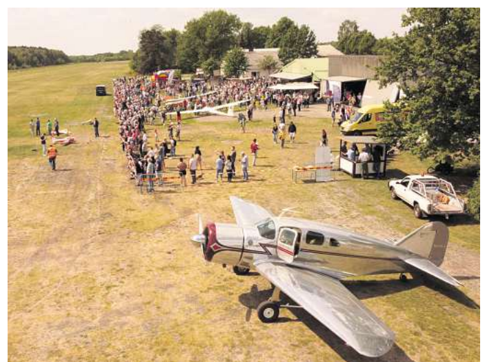
Der Luftsportverein Burgdorf lädt zum Tag der offenen Tür auf dem Flugplatz in Ehlershausen ein.

chen, Waffeln und Kuchen. Weitere Infos gibt es auf der Internetseite www.lsv-burghdorf.de .