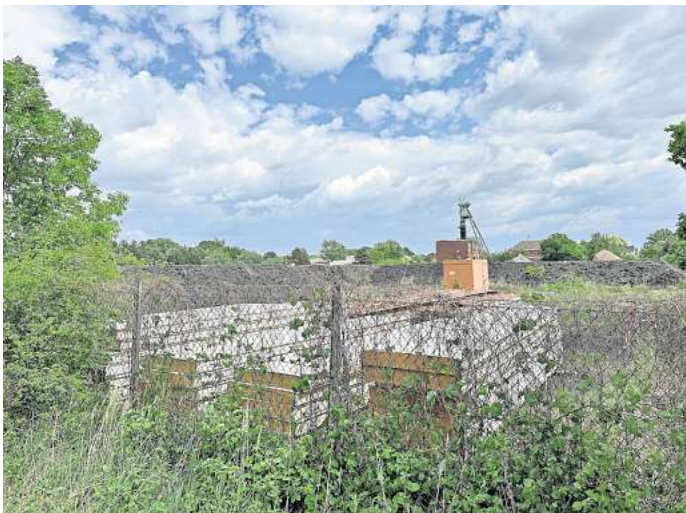
Hier soll ein neues Gewerbegebiet entstehen: Die Gemeinde Uetze steht den Plänen eines Lehrter Investors unter bestimmten Bedingungen positiv gegenüber.

Laut einem ersten Bodengutachten, das er in Auftrag gegeben hatte, sollte das Gelände um fünf Meter aufgeschüttet werden. Andernfalls sei die Standfestigkeit des Untergrunds zwischen Salzweg und Riedelweg in Hänigsens Ortsteil nicht gegeben. Gegen diese Einschätzung hatte es massive Kritik von den Anwohnenden gegeben. Für zusätzlichen Ärger sorgte, dass der Investor bereits tonnenweise Material aus dem Kohle- hafen des einstigen Kraftwerks in Peine-Mehrum nach Hänigsen brachte, obwohl noch das öffentliche Beteiligungsverfahren lief und es noch keinen Bebauungsplan für das Areal gibt. Die Uetzer Kommunalpolitiker hat-