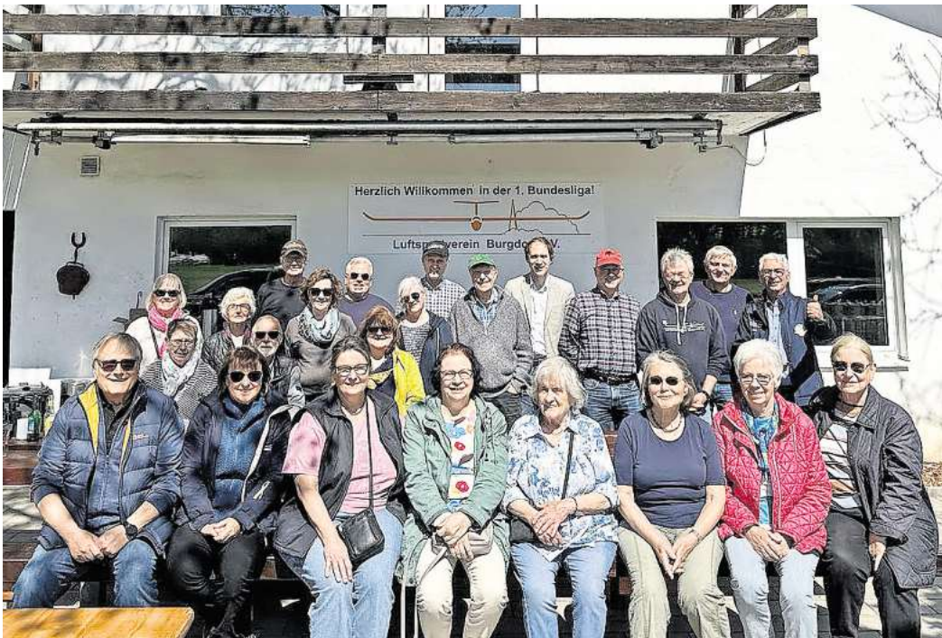
Zum Abschluss der Begegnungswoche haben die Teilnehmer den Luftsportverein in Ehlershausen besucht.

Am zweiten Tag wurde die Ausstellung „Unsere Stadt – unsere Geschichte“ in der KulturWerk