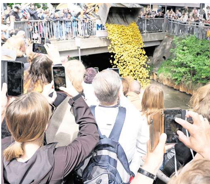
Mit Hilfe eines Baggers werden die gelben Plastikenten von der Brücke aus in die Aue geworfen.

Außerdem waren beim Pferdemarkt rund 50 historische Fahrzeuge zu sehen. Zahlreiche Sammler und Schrauber aus der Region waren angereist, um ihre liebevoll restaurierten Schmuckstücke zu zeigen und in ent-