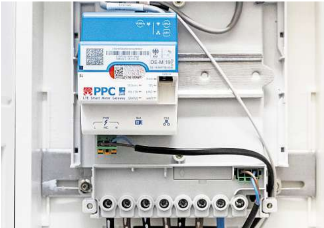
Smart Meter ermitteln den Stromverbrauch und können die erhobenen Daten direkt etwa an den Stromversorger oder den Netzbetreiber versenden.

Wichtig zu wissen für Wohnungseigentümergeinschaften: Der Zählerschrank gehört zum Gemeinschaftseigentum.