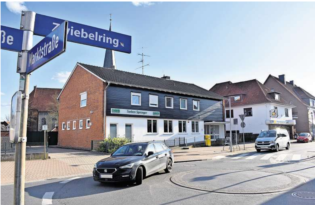
Der Zwiebelring in Uetze: Hier beginnt künftig die Tempo-20-Zone. Sie reicht bis zum Europakreisell.