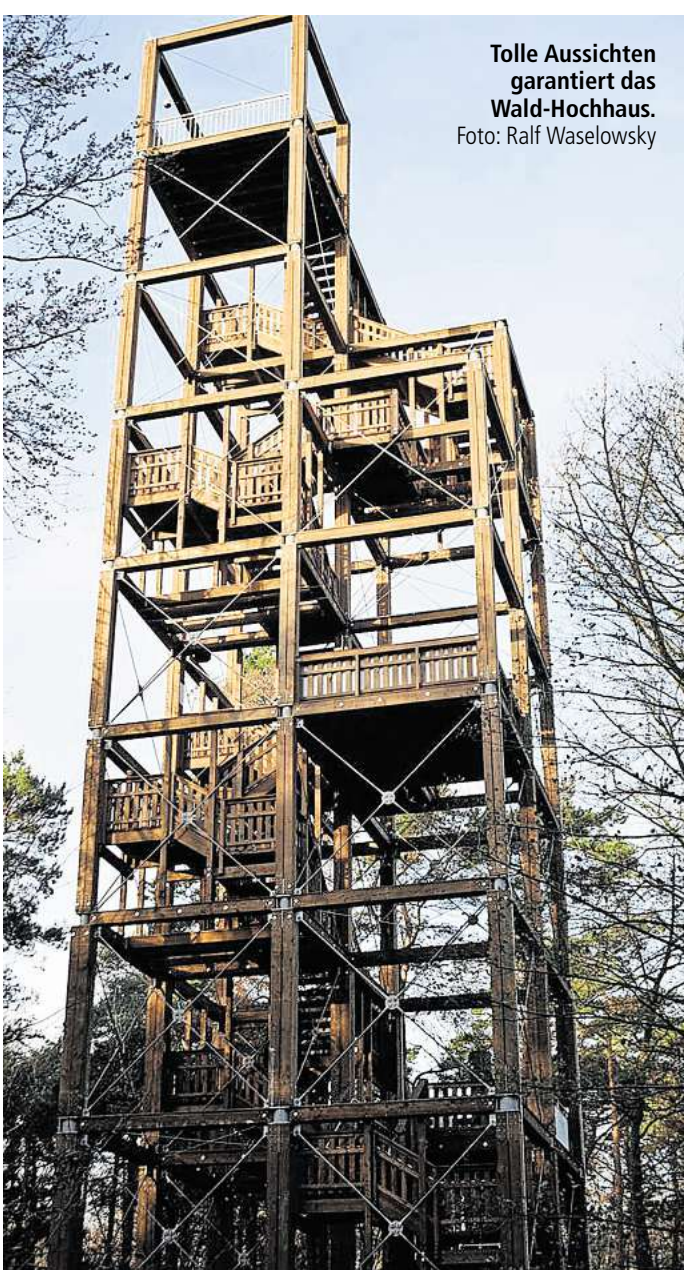
Tolle Aussichten garantiert das Wald-Hochhaus.