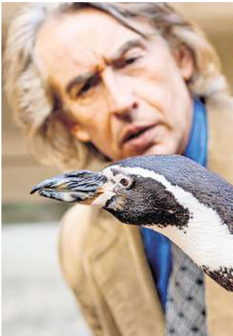
Der Spielfilm „Der Pinguin meines Lebens“ mit Steve Coogan basiert auf einer wahren Begebenheit.