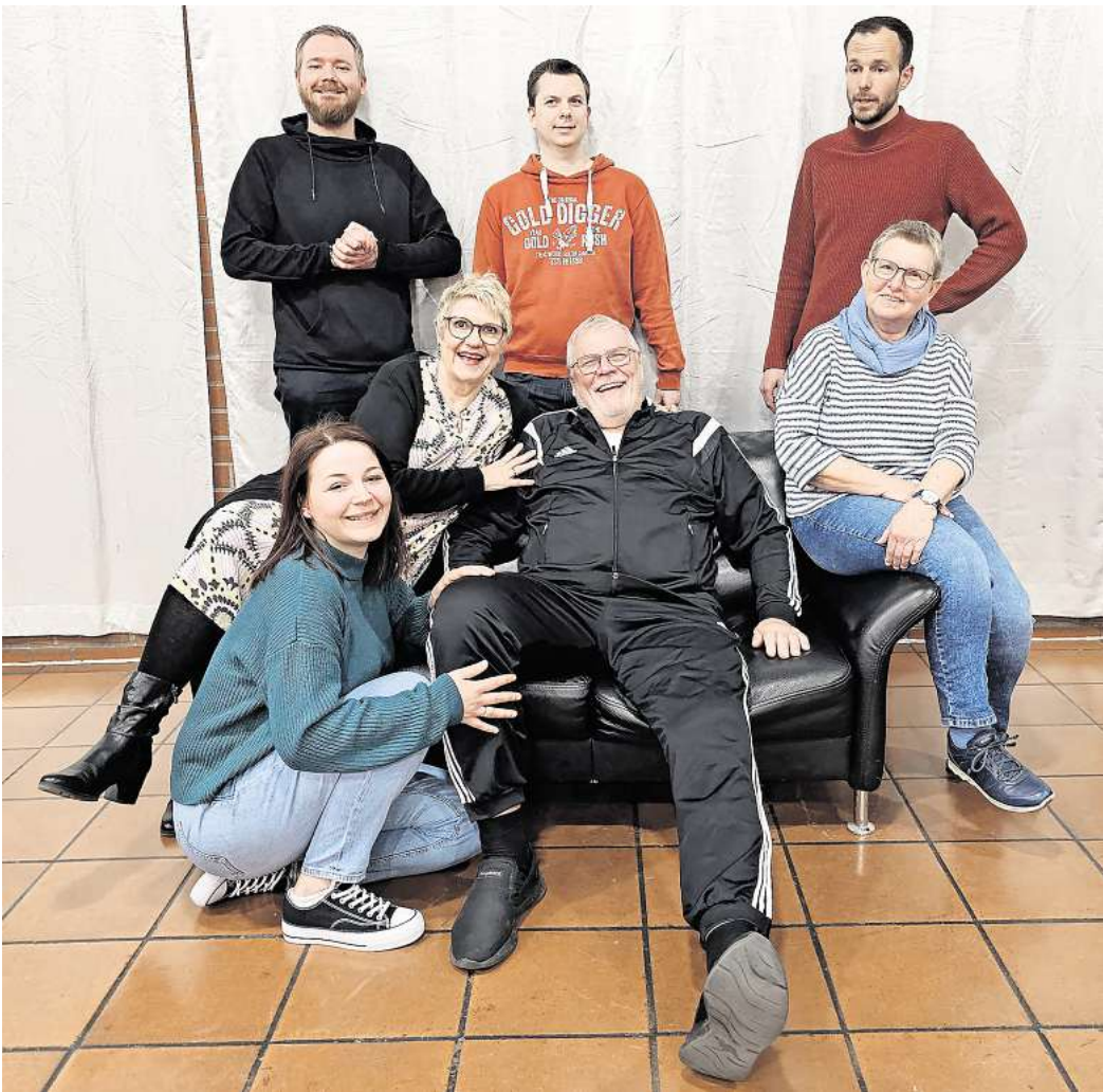
Die Amateurschauspieler vom VVV-Theater wollen ihr Publikum mit der Komödie „Resturlaub im Ladyhort“ unterhalten.

Die Premiere beginnt am Freitag, 2. Mai, um 19.30 Uhr im Thea-