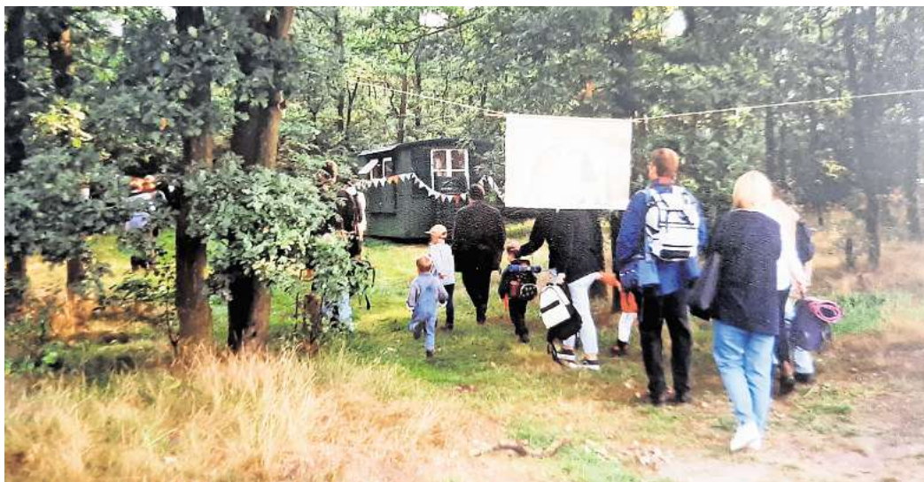
Im Sommer 2000 schauen sich Eltern und Kinder das neue Kita-Gelände an.

Seitdem hat sich einiges getan. Der einstige Bauwagen ist inzwischen einer festen Hütte gewichen, die auch noch über eine kleine Nebenhütte verfügt. Vor einigen Jahren wurde zudem ein Brunnen gebohrt, sodass Wasser zur Verfügung steht. Eine Solaranlage erzeugt den nötigen Strom. „In den Anfangsjahren haben wir immer Autobatterien hin und her ge-