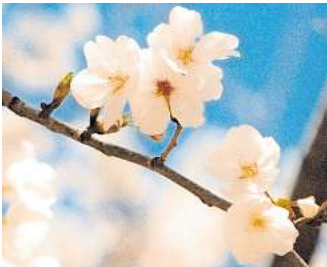
Die Kirschblüte wird beim Hanami gefeiert.

kunst, Shiatsu, Kalligrafie, Co-splay-Darbietungen, Origami, japanische Streetfashion Deko-Den und vieles mehr. Besonders Wert wird auf das Picknick gelegt, das sich die Gäste selbst mitbringen, so wie es in Japan Tradition ist. Bei schlechtem Wetter muss das Kirschblütenfest leider ausfallen. Aktuelle Informationen dazu gibt es dann auf der Webseite der Städtepartnerschaft facebook.com/twincitieshannover oder auf hannover.de. RED