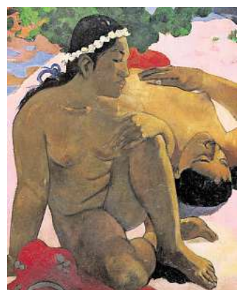
In den Gemälden von Paul Gauguin spiegelt sich seine kolonialistische und exotisierende Sicht wider.

ihrer eigenen Fantasie freien Lauf zu lassen. Nach eigenem Bekunden besitzt Schaffer mit mehr als 400.000 Figuren und drei Millionen Einzelteilen die größte Playmobil-Schauausstellung der Welt. Seit 2003 hat er Teile davon in 77 Schauen gezeigt – 2009 sogar im Pariser Musée des Arts décoratifs im Westflügel des weltberühmten Louvre.