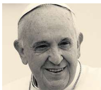
Papst Franziskus ist am Ostermontag gestorben.

BURGDORF (r/fh). „Heute Morgen um 7.35 Uhr ist der Bischof von Rom, Franziskus, ins Haus des Vaters zurückgekehrt“, verkündete Kardinal Kevin Farrell am Ostermontagmorgen. Tags zuvor spendete der Papst noch den Segen „Urbi et Orbi“. Seit 2013 stand er an der Spitze der katholischen Kirche.