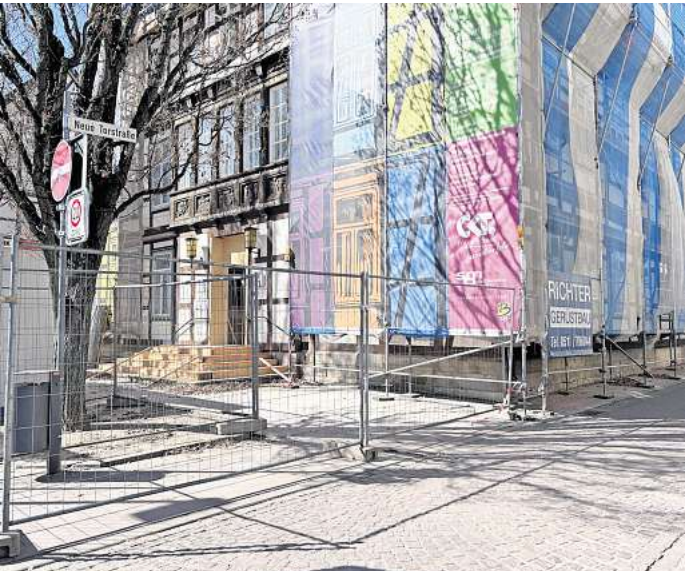
Die Sanierung des Rathauses I in Burgdorf schreitet planmäßig voran.

Die Decke wurde aus Bestandsbalken gebaut und nun weisen einige Teile Mängel auf. Hinzu kommt laut der Stadt, dass das statische System nicht vollständig umgesetzt wurde und der Einbau nicht bei allen Teilen fachlich korrekt erfolgt ist. Die Decke ist demnach nicht mehr ausreichend tragfähig. Daher wurde sie neu bemessen und es müssen einzelne Deckenbalken ausgetauscht werden. Altersbedingt werden auch im restlichen Gebäude einzelne beschädigte Balken ausgetauscht. Bei der geplanten Sanierung des Treppenhauses müssen auch einzelne Elemente erneuert werden.