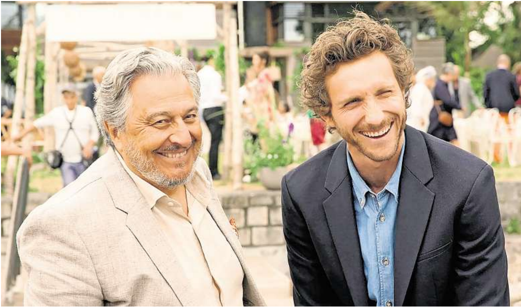
Die Neue Schauburg zeigt den Film „Voilà, Papa“.