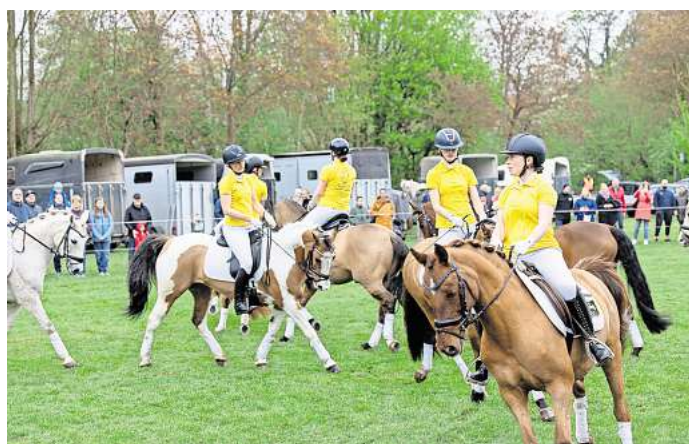
Ein besonderes Highlight war die Darbietung der Niedersächsischen Reitponyquadrille.

Ein besonderes Highlight war die eindrucksvolle Darbietung der Niedersächsischen Reitponyquadrille, die der Verein Burgdorfer Pferdeland auf seiner Vorführbahn präsentierte.