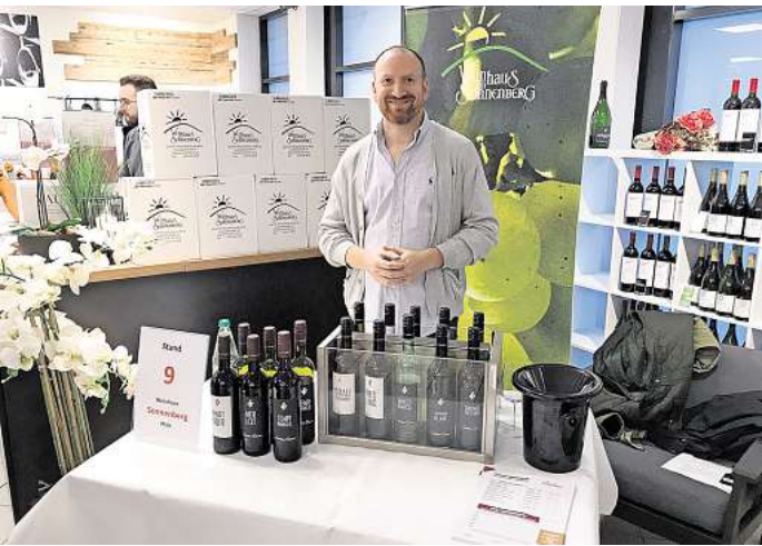
Das Weinhaus am Sonnenberg aus der Pfalz ist wieder bei der Cramer-Weinmesse vertreten.

Im Fokus stehen vor allem frische Weißweine, passend zur bevorstehenden Sommersaison. Rund 50 ausgewählte Weine und Sekte stehen zur Verkostung bereit. Besucherinnen und Besucher erhalten fachkundige Beratung direkt von den Winzern sowie vom Expertenteam der Cramer-Weinabteilung.