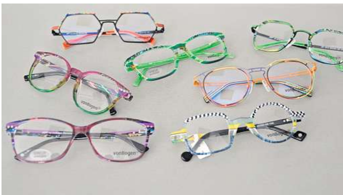
Die "Von Bogen"-Kollektion umfasst viele außergewöhnliche Farben und Formen.

es Screening-Angebot. Damit können Augenkrankheiten erkannt werden, wie Glaukom Grauer Star, Keratokonus oder das Syndrom des trockenen Auges. Zudem können Sehfehler festgestellt werden, einschließlich solcher, die das Nachtsehen beeinträchtigen. Jannien Sandbrink-Klaproth möchte ihr Team bei Trend-Optik erweitern. Sie sucht einen Augenoptiker und wirbt für deren Beruf. „Man hat den modischen, den handwerklichen und den medizinischen Aspekt und den täglichen Kontakt mit freundlichen Kunden“, betont sie. Interessierte können sich unter Telefon (05136) 85005 melden.