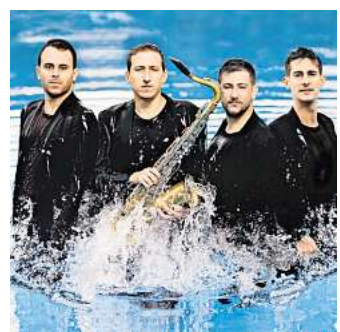
Das Kebyart Saxophon Ensemble kommt nach Burgdorf.

Karten für dieses Konzert gibt es im Vorverkauf bei Wegeners Buchhandlung (Marktstraße 65) und Bleich Drucken und Stempeln (Braunschweiger Straße 2) sowie an der Abendkasse. Außerdem können sie unter Telefon (05147) 720937 vorbestellt werden. Das Konzert ist nicht Bestandteil der Abonnements. Jugendliche haben freien Eintritt.