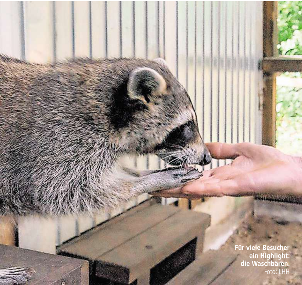
Für viele Besucher ein Highlight: die Waschbären.

Alle Infos und Termine findet Ihr hier: www.waldstation-eilenriede.de