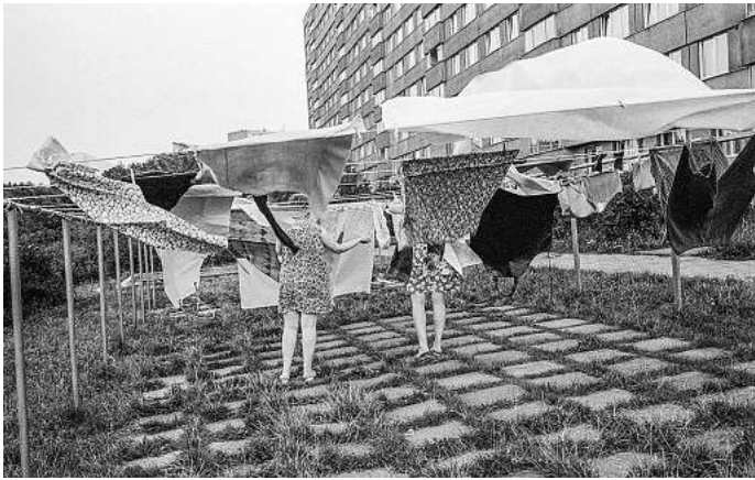
Juli 1981 in Ostrava-Vyskovice, Mutter und Tochter.

mend schwieriger wird, da den Fotografen mit Misstrauen begegnet wird. Am 23. Juni 2024 verstarb Hansgert Lambers in Berlin. Sein fotografischer Nachlass befindet sich in der Deutschen Fotothek in Dresden. Die GAF ist Donnerstag bis Sonntag jeweils von 12 bis 18 Uhr geöffnet. Der Eintritt ist frei. RED