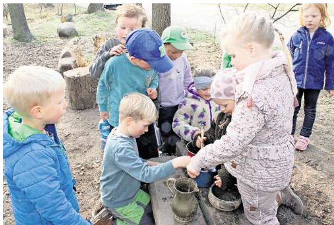
Die Kinder vergnügen sich auf dem Waldgrundstück.

Seit 2014 betreibt der Trägerverein der Waldkita zusätzlich noch eine Krippe, die an der Schulstraße in Uetze zu Hause ist. In den beiden Einrichtungen mit jeweils 15 Plätzen sei die Nachfrage groß. „Wir haben eine Warteliste“, so Kita-Leiterin Rönick.