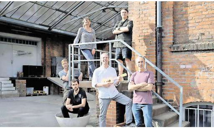
Das Ensemble S spielt im Calder-Saal.