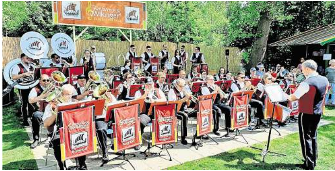
Die Wikinger laden zu ihrem traditionellen Frühschoppen-Konzert ein.

Fanfarencorps lädt zum Fröhschoppen am 1. Mai ein