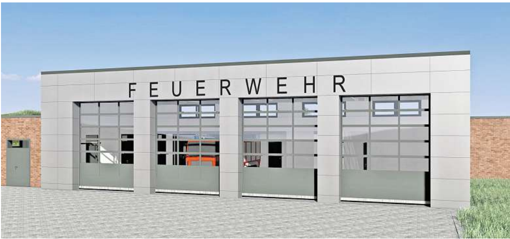
Neubau mit Modellcharakter: So oder ähnlich sollen die künftigen Gerätehäuser in Uetze ausschauen. Grafik: Gemeinde Uetze

Welle – in dem Gebäude sind auch Kita und Grundschule untergebracht – den Ansprüchen einer zeitgemäßen Feuerwehr nicht mehr genügt. Der Schulungsraum ist inzwischen viel zu klein. Zudem fehlen getrennte Umkleiden für Männer und Frauen, nach Geschlechtern getrennte Toiletten sowie Flächen für eine Geräterwerkstatt und ein Materiallager. Außerdem bietet die Halle keinen Platz für das vorgesehene dritte Fahrzeug. Jetzt soll etwa 100 Meter entfernt ein gut 720 Quadratmeter großes Gerätehaus am Rand des noch zu erschließenden Neubaugebiets an der Plockhorster Straße errichtet werden. Und zwar mit einer in die Umgebung passenden roten Klinkerfassade sowie mit begrüntem Dach und ausreichend Platz für eine Photovoltaikanlage, wie Architektin Elisabeth Bersuch erläuterte.