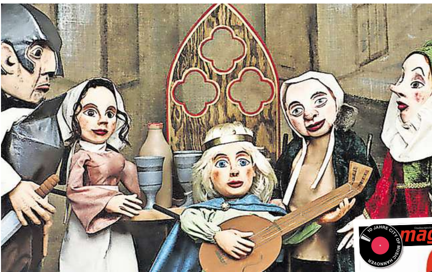
„Es lebe der König“ im Theatro.

Das Trio Gruberich aus Oberbayern spielt am 16. März ab 10.30 Uhr im Schloss Landestrost, in Neustadt am Rübenberge das Kinder-Erzählkonzert „Die Kuh will mehr“. Dabei geht es um eine Kuh, die Gedichte schreibt und Sehnsucht nach dem Meer bekommt. Das Erzählkonzert lädt zum Lauschen und Mitma-