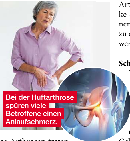
Bei der Hüftarthrose spüren viele Betroffene einen Anlaufschmerz.

Arthrose in den Fingern befällt in der Regel die beiden Endgelenke der Finger sowie das Grundgelenk des Daumens. Die-