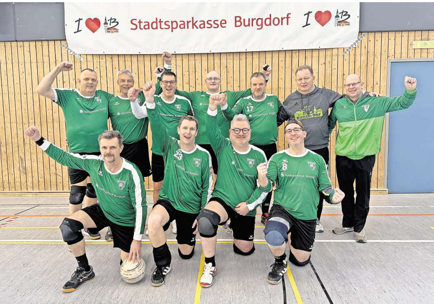
Das M45-Faustball-Team der TSV Burgdorf freut sich über die Qualifikation für die Deutsche Meisterschaft.

Männer 45 der TSV Burgdorf haben in eigener Halle die Norddeutschen Meisterschaften ausgerichtet