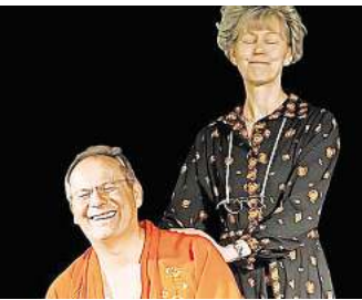
„Hausfreunde“