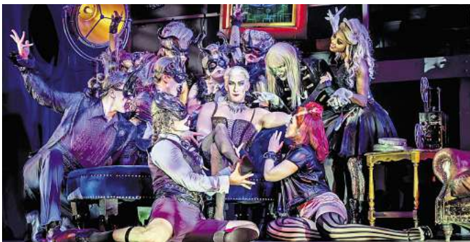
Der schrille Dr. Frank N. Furter feiert mit seinem Gefolge eine besondere „Geburtsstagsparty“.