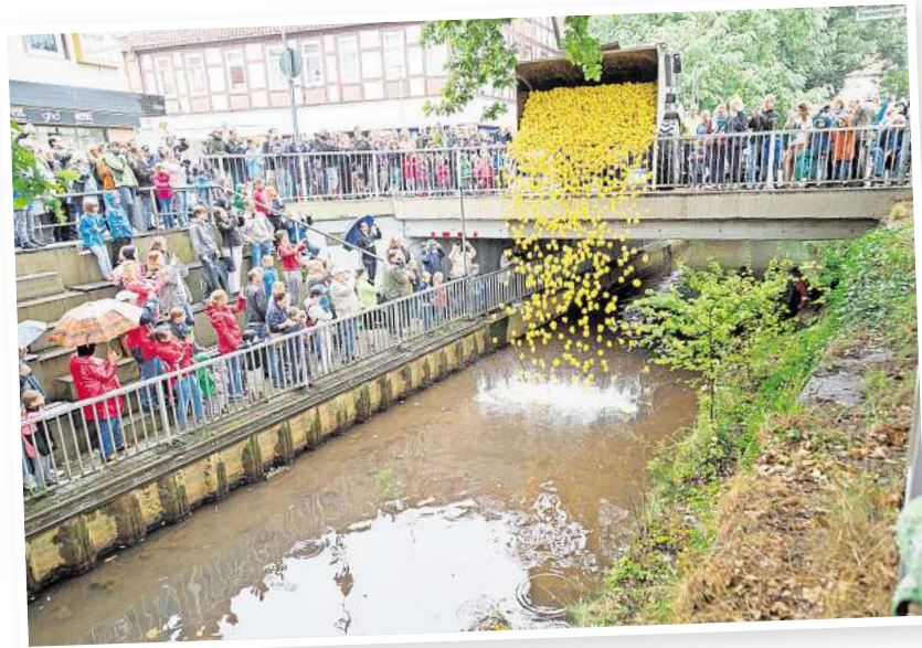
Beim Verkaufsoffenen Sonntag startet der Vorverkauf für das Entenrennen auf der Aue.

Veranstalter des Entenrennens ist der Verein für Kunst und Kultur in Burgdorf (VKK) in Zusammenarbeit mit der Stadtmarketing-Initiative „Ich kauf in Burgdorf“ und dem E-Center Cramer.