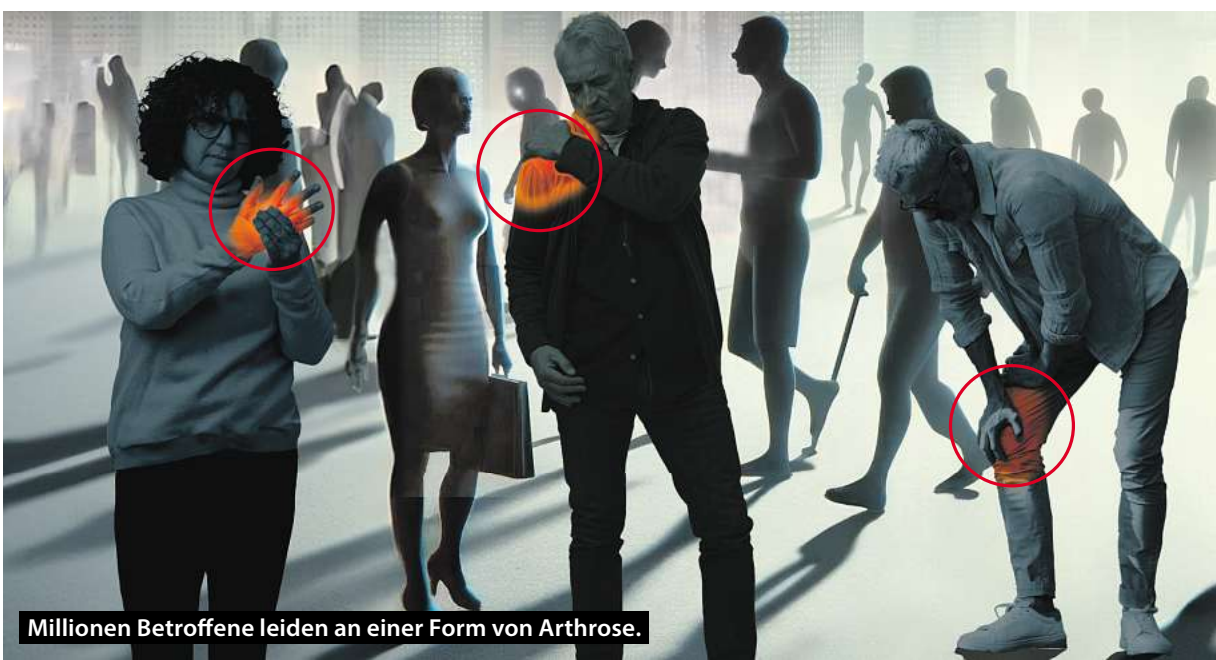
Millionen Betroffene leiden an einer Form von Arthrose.

Zunächst fällt es schwer, das Knie ganz durchzudrücken. Knack- und Reibegeräusche werden hörbar. Treppensteigen verursacht Schmerzen, die sich unter Belastung langsam steigern, aber auch plötzlich einschließen können. Im fortgeschrittenen Stadium treten schließlich starke Schmerzen beim Gehen auf.