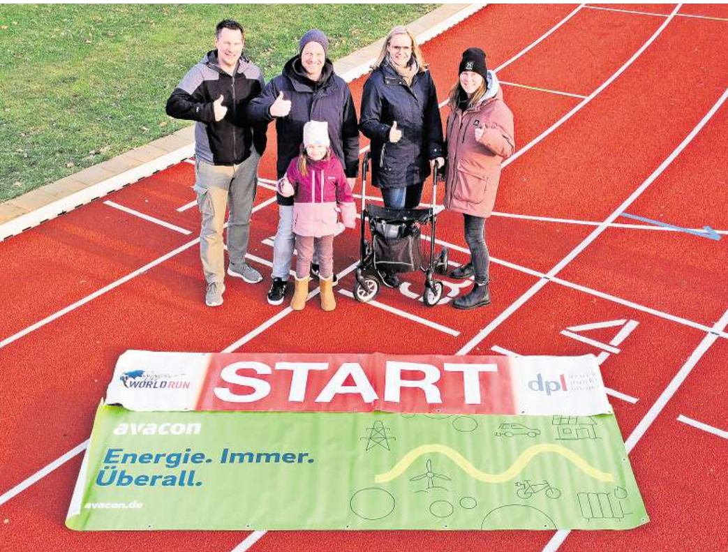
Auf der neuen Tartanbahn: Das Organisationsteam freut sich auf den dritten Spendenlauf für die "Wings for Life"-Stiftung.

Dass auch die Spendengelder, die in Uetze gesammelt werden, diesem Forschungszweck zugutekommen, ist kein