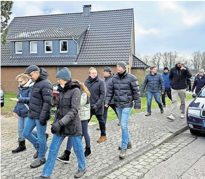
Zu Fuß macht sich die Gruppe auf den Weg.

Im Anschluss starteten drei Gruppen unter der Führung von