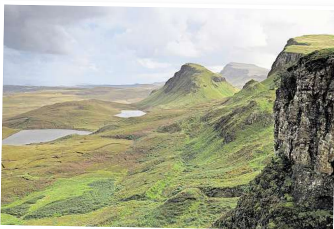
Die schottische Landschaft beeindruckt mit ihrer Vielfalt und ihren Farben.

Die Städte Edinburgh und Glasgow begeistern mit ihrer Architektur und Kultur. Auch Whisky, Dudelsackmusik und Kilts, also die berühmten Schottenröcke, kommen in der Live-Reisereportage nicht zu kurz.