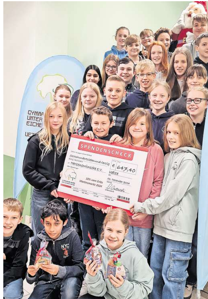
Die Klasse 7L überreicht einen symbolisch Scheck für den Verein Herzenswünsche.