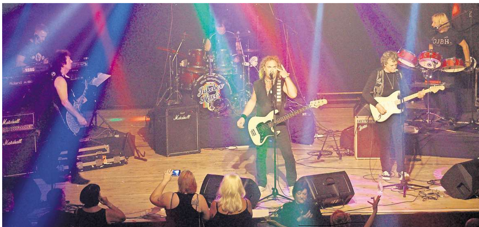
Die Show der Jukebox Heroes ist vollgepackt mit Klassikern.