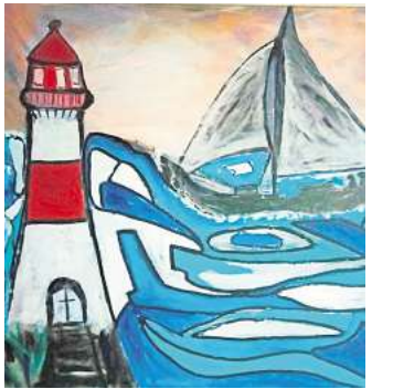
Das Gemälde "Leuchtturm in der Brandung" soll für den guten Zweck versteigert werden.

HÄNIGSEN. Der Uetzer Künstler Wilfried Hartung will sein Gemälde „Leuchtturm in der Brandung“ versteigern und den Erlös für soziale Zwecke spenden. Das Geld ist für die Uetzer Tafel sowie die Jugendfeuerwehren in Uetze und Hänigsen bestimmt.