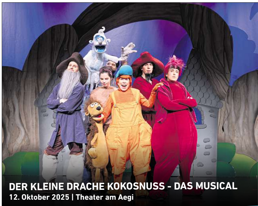
DER KLEINE DRACHE KOKOSNUSS - DAS MUSICAL 12. Oktober 2025 | Theater am Aegi

Das Gute: Dafr gibt es zustzliches Frdergeld. Seit dem Sommer werden bei Ein- und Zweifamilienhusern 50 Prozent des frderfhigen Beratungshonorars bernommen - maximal 650 Euro. Fr Gebude ab drei Wohneinheiten sind bis zu 850 Euro mglich. Fr Wohnungseigentmergemeinschaften gibt es zustzlich einmalig 250 Euro Frderung, wenn Beratungsergebnisse im Rahmen einer Wohnungseigentmerversammlung erluert werden. Die Frderung von Energieberatungen fr Wohngebude wird ber das Bafa-Portal abgewickelt.