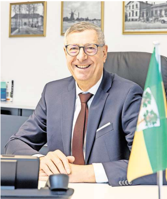
Bürgermeister Armin Pollehn will Burgdorf nachhaltig und zukunftsorientiert gestalten.

Ein Ratsbeschluss ermöglichte zudem die Reduzierung einzelner Gruppen in Kindertagesstätten, um den pädagogischen