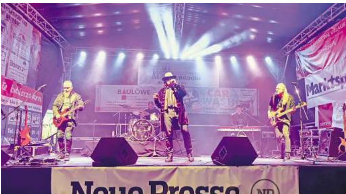
Auf der Bühne an der Poststraße hat „El Paniko und das Katastrophenorchester“ mit einer Hommage an die Rocklegende Udo Lindenberg für Stimmung gesorgt