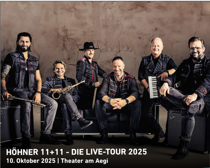
HÖHNER 11+11 - DIE LIVE-TOUR 2025 10. Oktober 2025 | Theater am Aegi

HANNOVER. Der Verein Fotografie & Kommunikation e.V. zeigt noch bis zum 15. Oktober seine Ausstellung „Region Hannover – Stadt, Land, Fluss“ im Stadtteilzentrum Ricklingen, Anne-Stache-Allee 7. Workshops, Fotowalks sowie Veranstaltungen zum Thema Fotografie gehören zum Portfolio des aktiven Vereins. Über 30 Fotografinnen und Fotografen steuerten Ihre Fotos zu Thema „Stadt, Land, Fluss“ bei. Ihre Blicke auf die Region Hannover sind dabei sehr individuell und sollen beim Betrachten dazu animieren, Bekanntes aus ganz anderen Perspektiven zu sehen. Geöffnet ist Montag bis Sonntag von 8 bis 22 Uhr und Sonntag von 10 bis 18 Uhr. Der Eintritt ist frei. RED