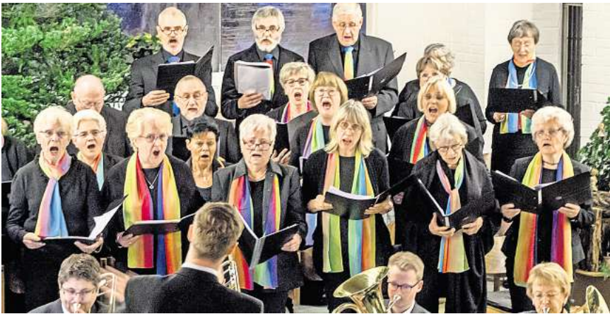
Der Kirchenchor der Martin-Luther-Gemeinde feiert sein 65-jähriges Bestehen.