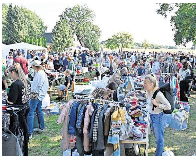
Der erste Flohmarkt auf der Sorgenser Bürgerwiese war gut besucht.