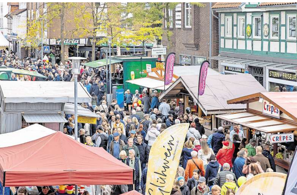
Das Stadtfest Oktobermarkt zog wieder Tausende Besucher aus Burgdorf und der Region an.

Nach dem Einzug der Festredner hatte Schrader zusammen mit Bürgermeister Armin Pollehn am Freitagnachmittag den offiziellen Startschuss gegeben. Gleich nach der Eröffnung löste