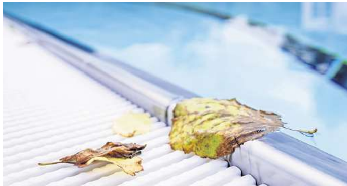
Wer einen Pool unter Nachbars Eichen baut, kann keine Entschädigung für den Laubfall verlangen.