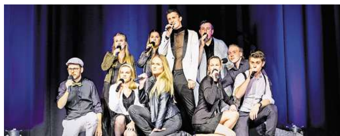
Die A-cappella-Gruppe Voxerience präsentiert Pop-Songs in neuem Gewand.