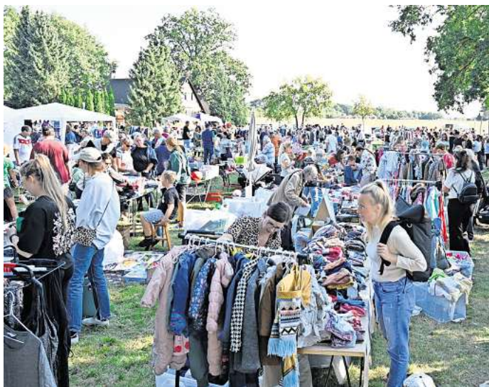
Der erste Flohmarkt auf der Sorgenser Bürgerwiese war gut besucht.