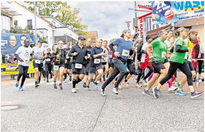
Beim Spargel-Lauf gab es einen neuen Teilnehmerrekord.