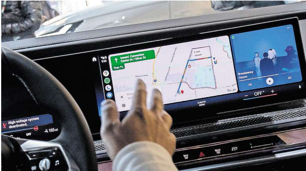
Welcher Weg zur Arbeit ist der kürzeste? Denn das ist in der Regel der, den Beschäftigte steuerlich geltend machen können.