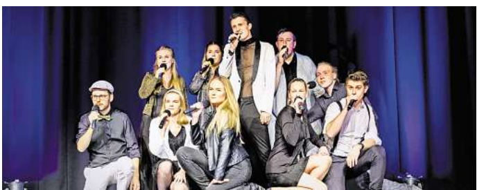
Die A-cappella-Gruppe Voxerience präsentiert Pop-Songs in neuem Gewand.