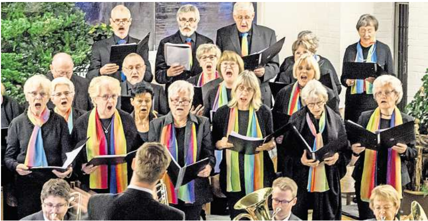
Der Kirchenchor der Martin-Luther-Gemeinde feiert sein 65-jähriges Bestehen.