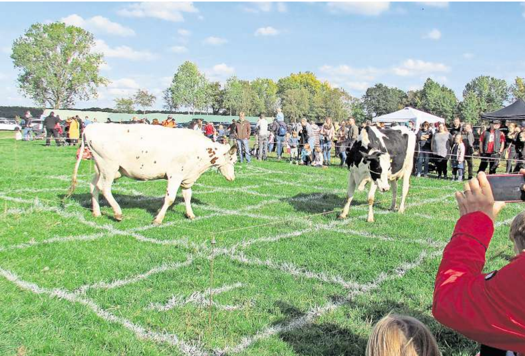
Beim Hof- und Drachenfest gibt es auch wieder ein Kuhfladen-Bingo.

Drachensteigen, Blicke hinter die Kulissen und Kuhfladen-Bingo