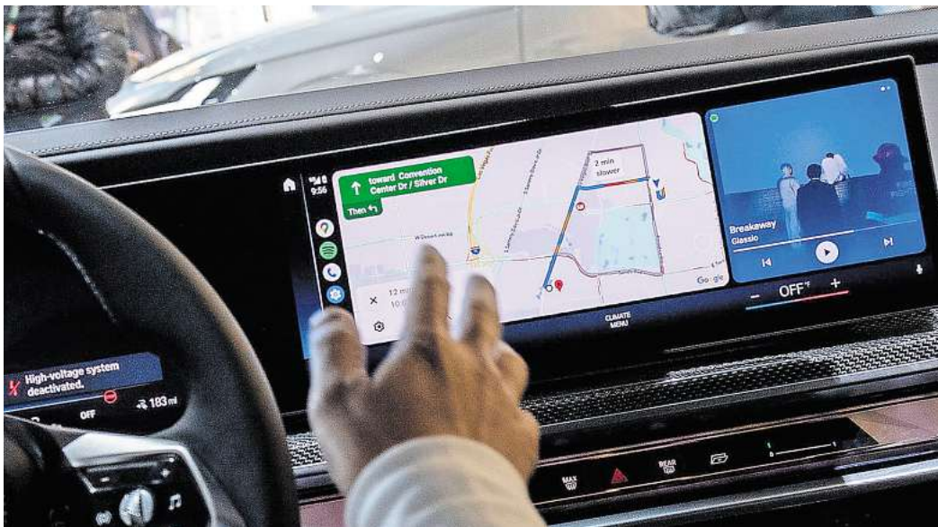
Welcher Weg zur Arbeit ist der kürzeste? Denn das ist in der Regel der, den Beschäftigte steuerlich geltend machen können.