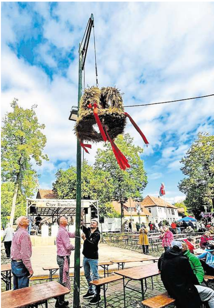
Zum Auftakt des Otzer Kartoffelmarktes wird die traditionelle Erntekrone angebracht.

Beim Kinderfest vergnügten sich am Freitag dann rund 450 junge Besucher bei vielfältigen Aktionen. Die Otzer Woche klang am Sonntag nach dem Kartoffelmarkt mit einem Erntedankgottesdienst und einem gemeinsamen Mittagessen aus.