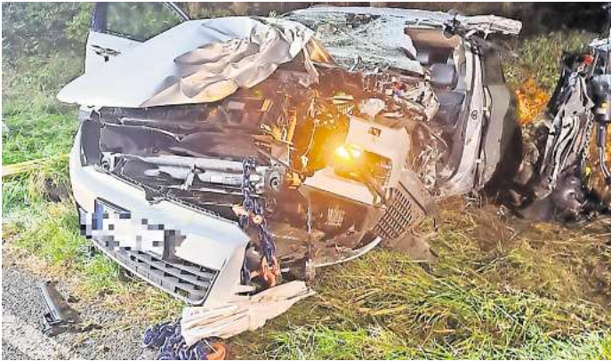
Das Auto ist nach dem Unfall stark beschädigt.

29-Jähriger wird im Auto eingeklemmt und erleidet schwere Verletzungen