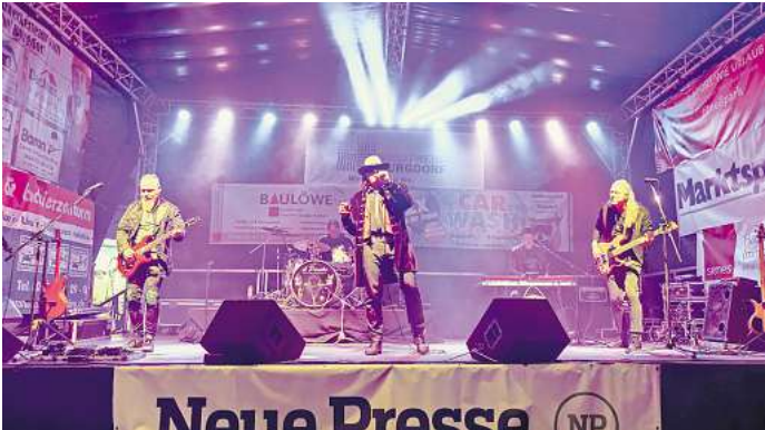
Auf der Bühne an der Poststraße hat „El Paniko und das Katastrophenorchester“ mit einer Hommage an die Rocklegende Udo Lindenberg für Stimmung gesorgt