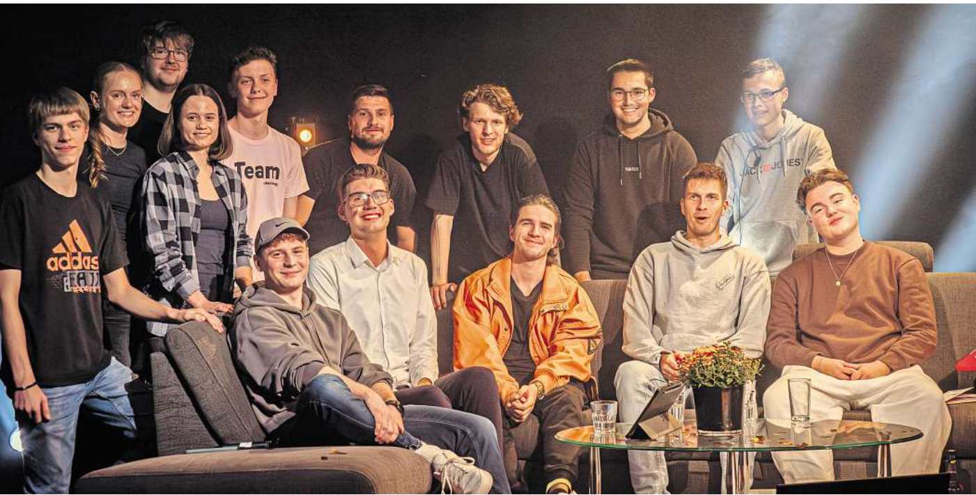
Das Klartext-Team hat sich mit einer großen Live-Show verabschiedet.

Bei der letzten Live-Show hat das Klartext-Team auf die vergangenen vier Jahre zurückgeblickt