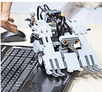
Bausteinprogrammierung mit Lego gehört zum Programm.

bausteinen entstehen einen Tag später, am 16. Oktober, programmierbare Konstruktionen wie „Super-Aufräumhilfe“, „Break Dancer“ oder „Gedächtnisspiel“. Analoges Programmieren gibt es beim Jump & Run mit Ozobots, indem ein cooler Parcours mit eigenen Hindernissen und kleinen Sprüngen gebaut wird. Musik und Tanz mit Hopspots ist am 17. Oktober angesagt, ebenso wie Gamedesign und -programmierung. „Makey Makey – Musik und Spiel neu ge-