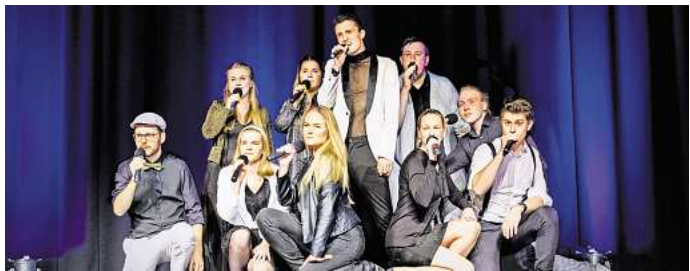
Die A-cappella-Gruppe Voxerience präsentiert Pop-Songs in neuem Gewand.