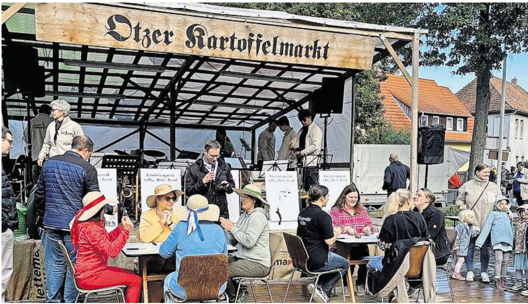
Der traditionelle Schälwettbewerb zählt zu den Höhepunkten des Otzer Kartoffelmarktes.

Für Unterhaltung sorgten die Auftritte der Jazzdance-Gruppen des SV Hertha Otze sowie