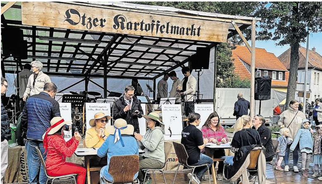
Der traditionelle Schälwettbewerb zählt zu den Höhepunkten des Otzer Kartoffelmarktes.

Für Unterhaltung sorgten die Auftritte der Jazzdance-Gruppen des SV Hertha Otze sowie