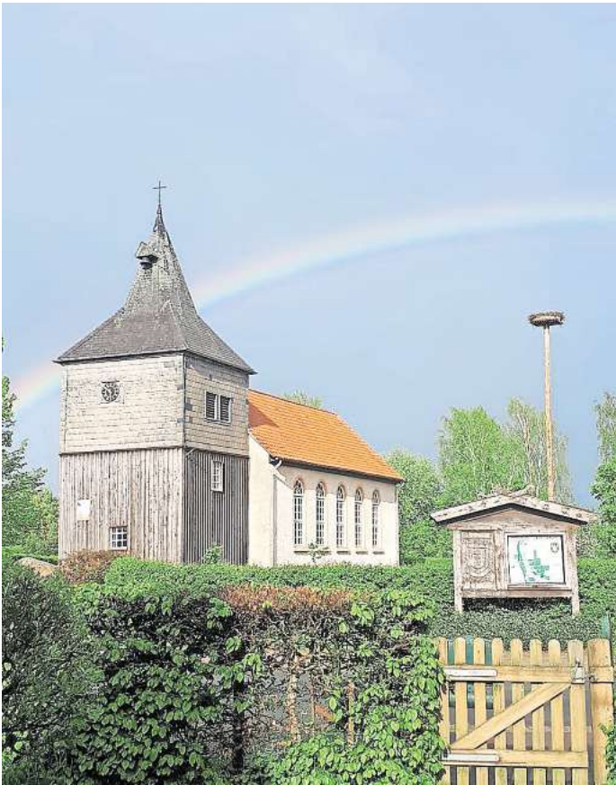
Die St.-Nicolai-Kirche wurde zu einem Dorfzentrum erweitert. Im Oktober wird dort diskutiert, was es braucht, damit Kirche auch in anderen Bereichen nah bei den Menschen ist.

Drei Gesprächsabende im Dorfzentrum St. Nicolai Obershagen