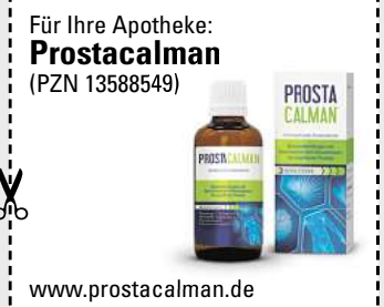
Abbildung Betroffenen nachempfunden PROSTACALMAN. Wirkstoffe: Serenoa repens, Pareira brava, Populus tremuloides Dtl. D2. ProstaCalman wird angewendet entsprechend den homöopathischen Arzneimittelbildern. Dazu gehören: Blasenentzündungen und Beschwerden beim Wasserlassen, bei vergrößerter Prostata. www.prostacalman.de • Zu Risiken und Nebenwirkungen lesen Sie die Packungsbeilage und fragen Sie Ihre Ärztin, Ihren Arzt oder in Ihrer Apotheke. • PharmaSGF GmbH, 82166 Gräfelfing

Häufiger Harndrang, der Urin kommt nur noch tröpfchenweise oder die Blase fühlt sich nicht entleert an? Schuld daran ist oft die Prostata. Dieses sogenannte „Männerorgan“ kann mit zunehmendem Alter wachsen und dadurch die Harnröhre blockieren. Experten haben ein Arzneimittel namens ProstaCalman entwickelt, das gleich drei Wirkstoffe in sich vereint: Serenoa repens, Pareira brava und Populus tremuloides. Diese Arzneistoffe sind dafür bekannt, u. a. den nächtlichen Harndrang zu reduzieren, den Urinfluss zu verstärken und den Restharn in der Blase zu verringern. Genial: ProstaCalman beeinträchtigt nicht die Sexualfunktion. Das Arzneimittel ist rezeptfrei in jeder Apotheke erhältlich.