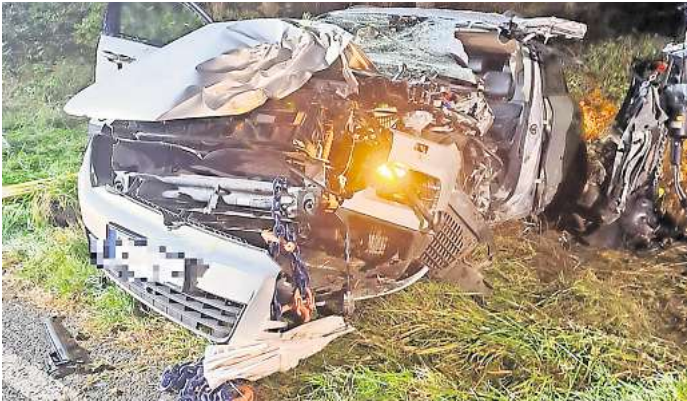
Das Auto ist nach dem Unfall stark beschädigt.

29-Jähriger wird im Auto eingeklemmt und erleidet schwere Verletzungen