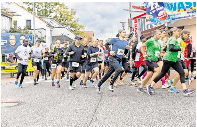
Beim Spargel-Lauf gab es einen neuen Teilnehmerrekord.