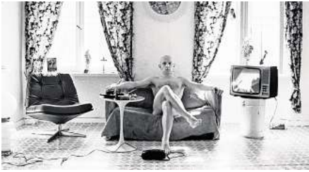
Szene aus „Baldiga“

Das komplette Programm steht auf www.perlenfilmfestival.de