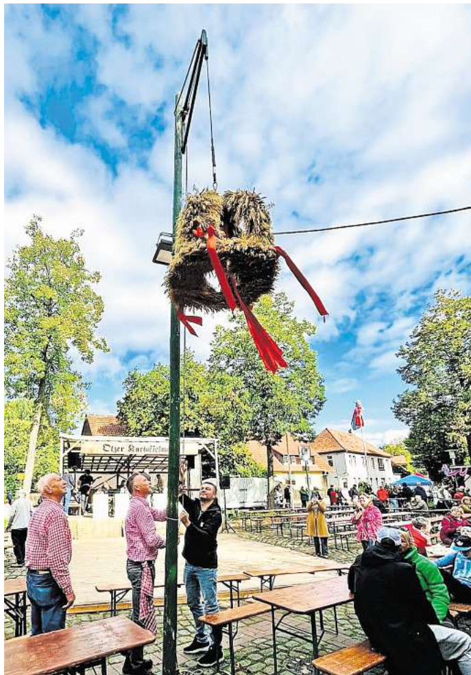
Zum Auftakt des Otzer Kartoffelmarktes wird die traditionelle Erntekrone angebracht.

Beim Kinderfest vergnügten sich am Freitag dann rund 450 junge Besucher bei vielfältigen Aktionen. Die Otzer Woche klang am Sonntag nach dem Kartoffelmarkt mit einem Erntedankgottesdienst und einem gemeinsamen Mittagessen aus.