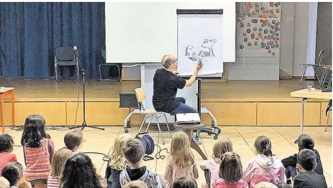
Bei der Lesung in der Grundschule: Kinderbuchautor Ingo Siegner zeichnet sich selbst an seinem Arbeitsplatz.