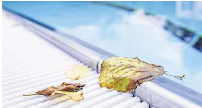
Wer einen Pool unter Nachbars Eichen baut, kann keine Entschädigung für den Laubfall verlangen.

- Laub von Bäumen auf dem Grundstück nebenan gilt meist als Teil der ortsüblichen Bepflanzung.