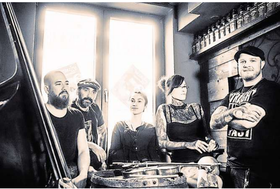
Feinster Pub Rock mit The Hoochigans am 23. August.