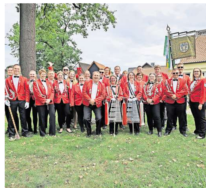
Der zum Schützenverein Schillerslage gehörende Spielmannszug feiert in diesem Jahr sein 60-jähriges Bestehen.