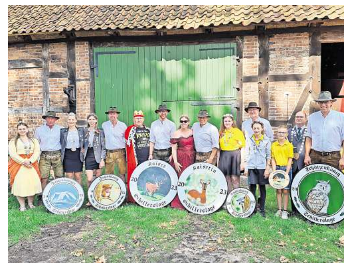
Die Majestäten von 2023 haben ihre Erfolge im vergangenen Jahr ausgelassen gefeiert – jetzt müssen sie ihre Ämter abgeben.

Am Sonntag, 25. August, schließlich beginnt der Tag um 12 Uhr mit dem gemeinsamen Königssessen (Anmeldung erforderlich), bevor um 14 Uhr der große Festumzug durch das Dorf starten wird. Nach diesem Ausmarsch haben sich alle Umzugsteilnehmerinnen und -teilnehmer zum Ende die Kaffeetafel verdient, mit der das Schützenfestwochenende in Schillerslage ausklingen wird.