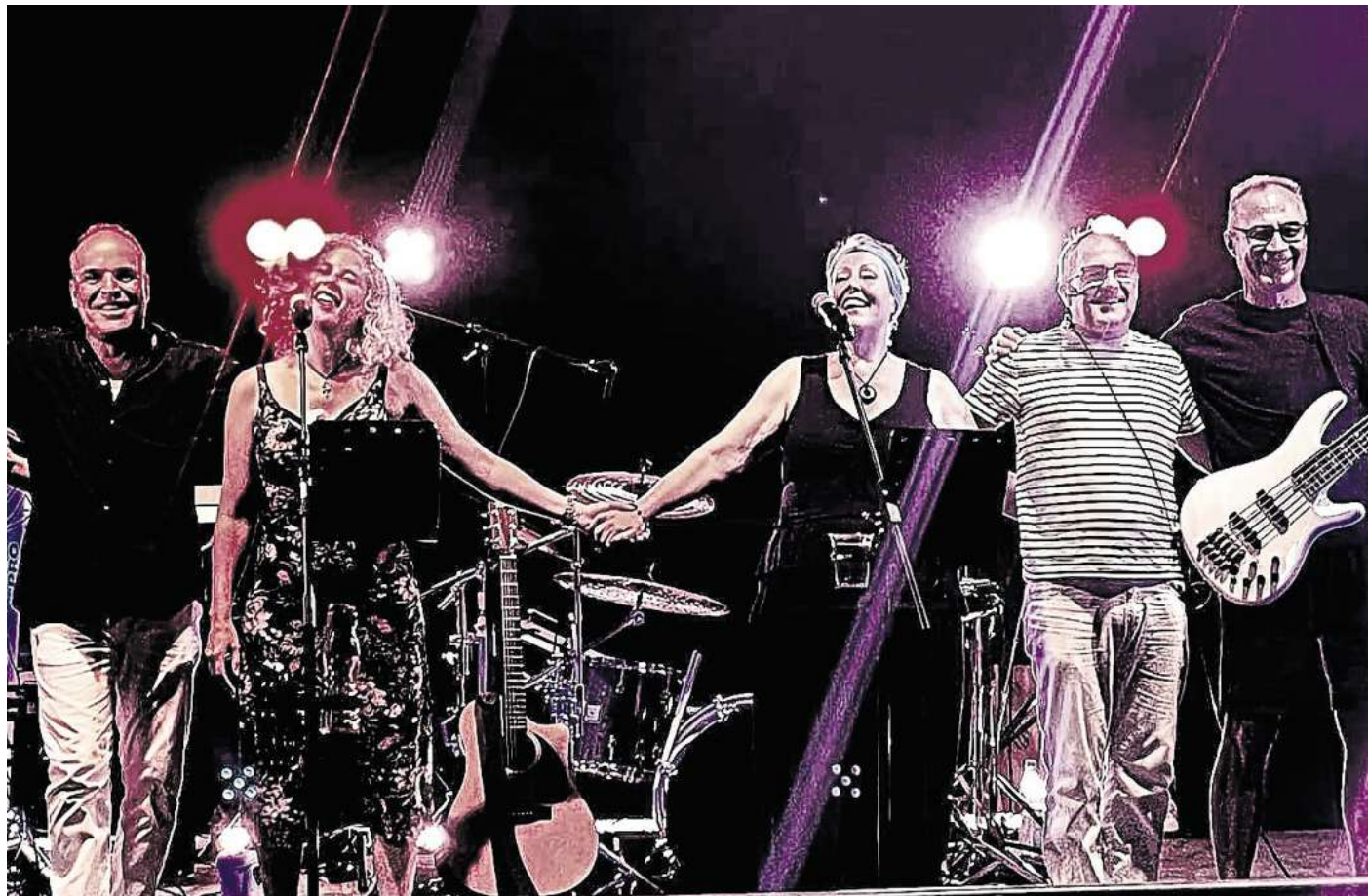
Die Partyband „Freshh“ aus Hannover sorgt am Sonnabend für Stimmung auf der Bühne und dem Tanzboden.