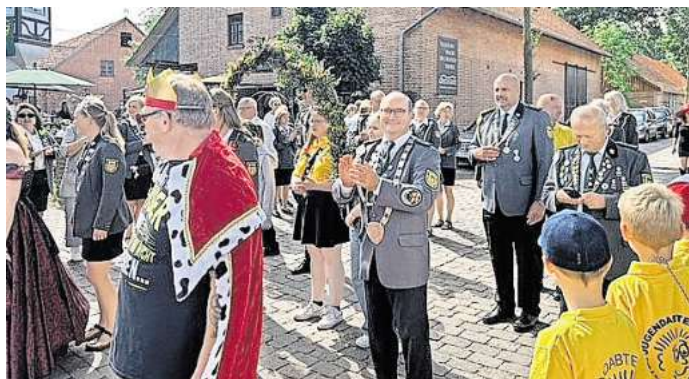
Die Schützen und ihre Gäste nehmen in ihrer Schützentracht oder in bunten Kostümen am Festumzug teil.

Begonnen hat die Erfolgsgeschichte im Jahr 1963, als rund 80 Bürgerinnen und Bürger aus Schillerslage beschlossen, den Schützenverein zu gründen. Aktuell hat der Verein knapp 700 Mitglieder: