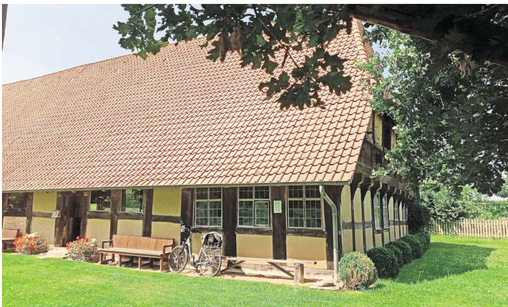
Das Baudenkmal in Wackerwinkel.