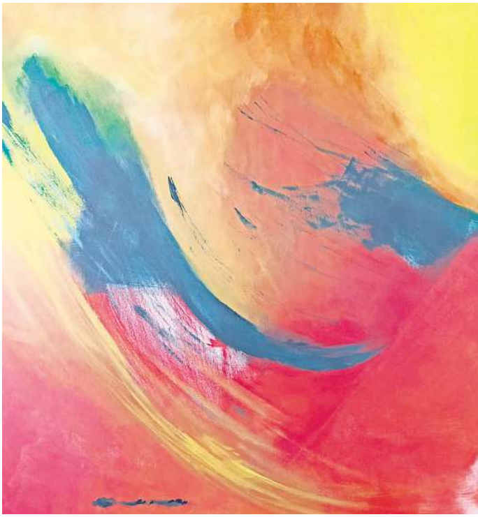
Bild von Karin Unnasch-Scheller in der Ausstellung "Farbenfreude pur".

Künstlerische Aus- und Weiterbildungen haben sie auf ihrem Weg der Kunst begleitet. Interessierte sind zur Vernissage am Mittwoch, 21. August, um 18 Uhr im Rathaus Uetze, Marktstraße 9, willkommen. Die Ausstellung kann fortan kostenlos während der Öffnungszeiten des Uetzer Rathauses bis zum 16. Oktober besucht werden.