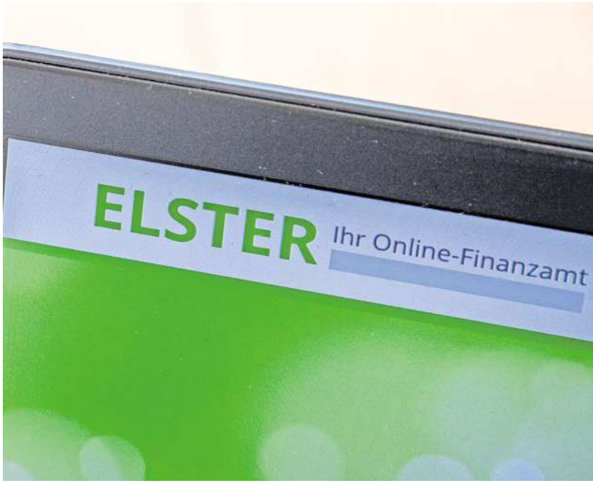
Ab sofort ist es Eltern wieder möglich, die Steuererklärung elektronisch zu versenden, ohne dass dafür die Steuer-ID des Kindes nötig ist.

die fehlende Steuer-ID des Kindes vorerst nicht zu beanstanden und auch die elektronische Übermittlung wieder zu ermöglichen. Das gilt ab sofort. Einem Sprecher des Bundesfinanzministeriums zufolge werden Steuerpflichtige zwar weiterhin auf die Angabe der an das Kind vergebenen Steuer-ID hingewiesen. Der Absendung der Erklärung stünden Hinweis und fehlende Identifikationsnummer aber nicht mehr entgegen. DPA