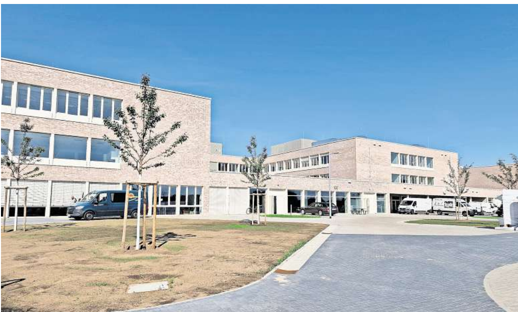
Der Neubau der Rudolf-Bembenneck-Gesamtschule Burgdorf ist pünktlich zum neuen Schuljahr fertig geworden.