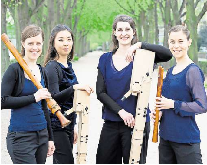
Das Boreas Quartett gastiert am 18. August im Burgdorfer Schloss.

BURGDORF. Vier Spielerinnen, vier Stimmen, vier eigenständige Linien: eine Fuge. In dem außergewöhnlichen Konzertabend am Sonntag, 18. August, um 17 Uhr im Ratssaal des Burgdorfer Schlosses wird sichtbar und hörbar, wie vier Musikerinnen ihren Part verteidigen – ohne das Gesamtwerk aus dem Blick zu verlieren. Der Abend führt durch das reichhaltige Fugen-Repertoire vom 13. Jahrhundert über Poglietti bis Bach und auch in das Hier und Jetzt. Auszüge aus Johann Sebastian Bachs „Kunst der Fuge“ werden kombiniert mit späteren Werken, welche die kompositorischen Möglichkeiten bis in ihre Extreme ausreizen. Da gerät die Welt schon mal „aus den Fugen“. Boreas – der Gott des Nordwindes – gab dem Bremer Blockflöten-Quartett seinen