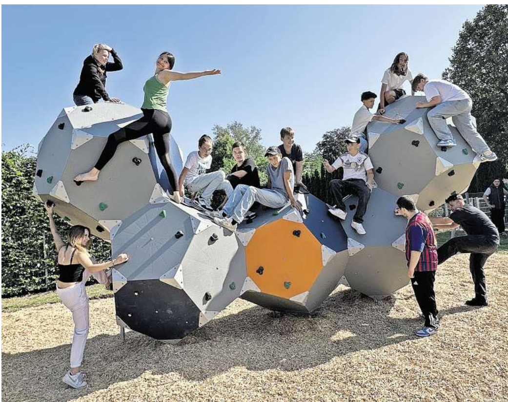
Es ist so weit: Der Nachwuchs nimmt den neuen Jugendplatz – hier den sogenannten Boulder-Würfel zum Klettern – in Beschlag.

ten Idee auch mit der Umsetzung so schnell gegangen. Seine Kommune sei bereits als „Energiemeister“ über die Region Hannover hinaus bekannt geworden – „wir wollen nun auch Spielplatzmeister werden“, kündigte der Bürgermeister an. Dieses Ziel werde trotz des engen finanziellen Spielraums weiterhin verfolgt: „Wir können nicht alles kaputtsparen.“ Auch in Zeiten knapper Kassen müsse in die Jugend und damit in die Zukunft investiert werden. Vom 22. bis 26. August wird der neue Jugendplatz an der Eichendorffstraße noch mal gesperrt. Grund dafür sind kleine Schönheitsreparaturen, die durchgeführt werden müssen. Im Herbst stehen außerdem einige Restarbeiten an, etwa Baumpflanzungen und die Installation von Mülleimern. Daran werden sich auch Jugendliche beteiligen.