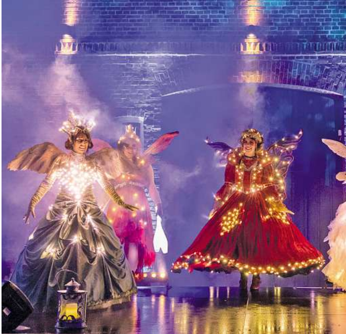
Burgdorfer Lichterzauber am Schwanenteich.

Der Einlass beginnt um 18.30 Uhr. Der Kartenvorverkauf läuft weiterhin auf Hochtouren: Eintrittskarten sind bei Bleich Drucken und Stempeln, Braunschweiger Str. 2, Tel. 05136-1862 sowie online über www.reservix.de erhältlich. SMB- und VVV-Mitglieder erhalten Vergünstigungen (nur in der Vorverkaufsstelle). Kinder bis sechs Jahre haben freien Eintritt. Für Kinder und Jugendliche im Alter von 7 bis 17 Jahren gibt es Ermäßigungen. Zu den Sponsoren des Abends gehören die Stadtparkkasse Burgdorf, Stadtwerke Burgdorf GmbH, halsdorfer + ingenieur projekt gmbh, Ambulante Pflege Burgdorf GmbH, Elephante Solar GmbH, Sicherheitsdienste Schmidt & Sohn GmbH, Hotel Restaurant Ayhan, Baran GmbH, Baran Garten- und Landschaftsbau, Electrotec GmbH und