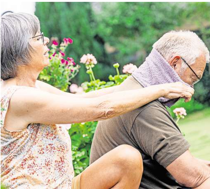
Feuchte Umschläge auf Armen, Beinen oder im Nacken sorgen an heißen Tagen für etwas Abkühlung.

Mehrere kleine, leichte Mahlzeiten sind gut an heißen Tagen. Das kann ein Salat sein, gedünstetes Gemüse und wasserreiche Rohkost wie Tomate, Gurke oder Wassermelone. Auch mageres Fleisch und Fisch sind bekömmlich. Salzgebäck hat gleich zwei positive Effekte: Es regt das Durstgefühl an und unterstützt den Salzhaushalt. Herrscht draußen Hitze, gilt es, sie nach Möglichkeit gar nicht erst ins Zimmer oder in die Wohnung zu lassen. Also am