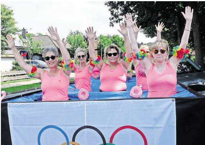
Sind fit für Olympia und haben die Spiele in Frankreich mit Fantasie in Szene gesetzt: Die „Synchronschwimmerinnen“ vom Sportverein Schwüblingen.