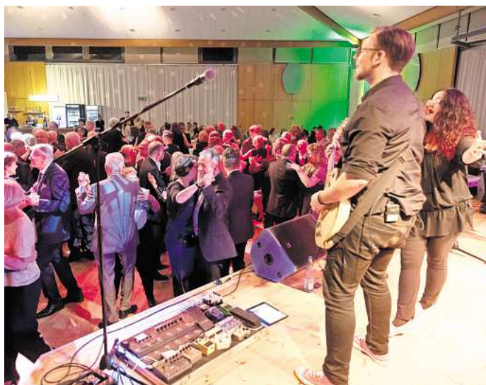
Beim Burgdorf-Ball können die Besucher wieder zu Live-Musik tanzen.

BURGDORF (r/fh). Der Stadtmarketingverein (SMB) lädt wieder zum Burgdorf-Ball ein. Er beginnt am Sonnabend, 16. November, um 19 Uhr im Stadthaus, Sorgenser Straße 31. Einlass ist ab 18 Uhr.