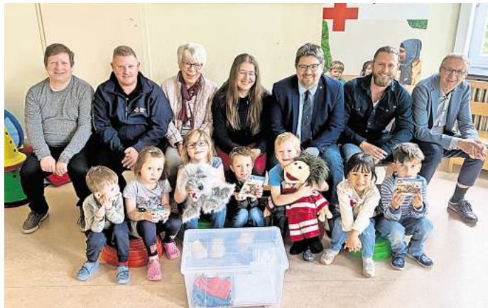
Der DRK-Ortsverein hat zwei Handpuppen an die Kita Villa Mercedes gespendet.

Henry und sein Hund Mischki sollen Kindern Einblicke in die Arbeit des Roten Kreuzes geben