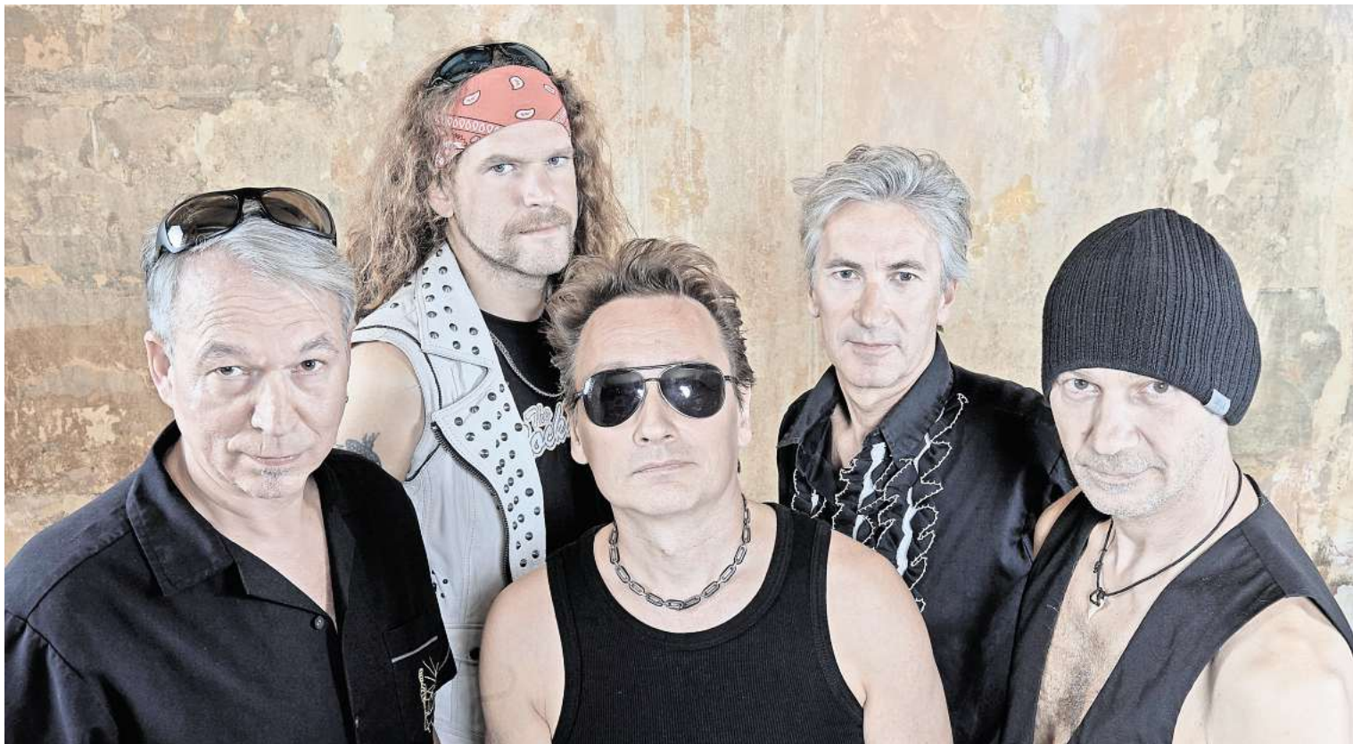
Soll ab 22 Uhr den Sportplatz als Hauptact zum Beben bringen: die Classic-Rock-Tribute-Band The Rockalots.

Drei Live-Bands spielen beim Schwüblingser Biker-Open-Air am 3. August