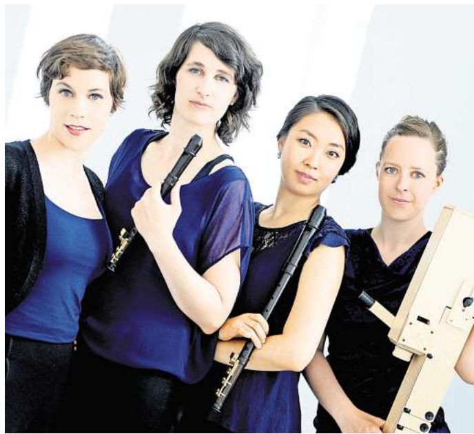
Das Boreas Quartett tritt in der Reihe „Vier Jahreszeiten“ auf.

„Ich konzipiere meine Werke aus meiner eigenen Realität heraus, gefiltert durch meine Beobachtung, um sie, wie ich hoffe, mit ein wenig Poesie und Ironie anderen zugänglich zu machen“, sagt sie.