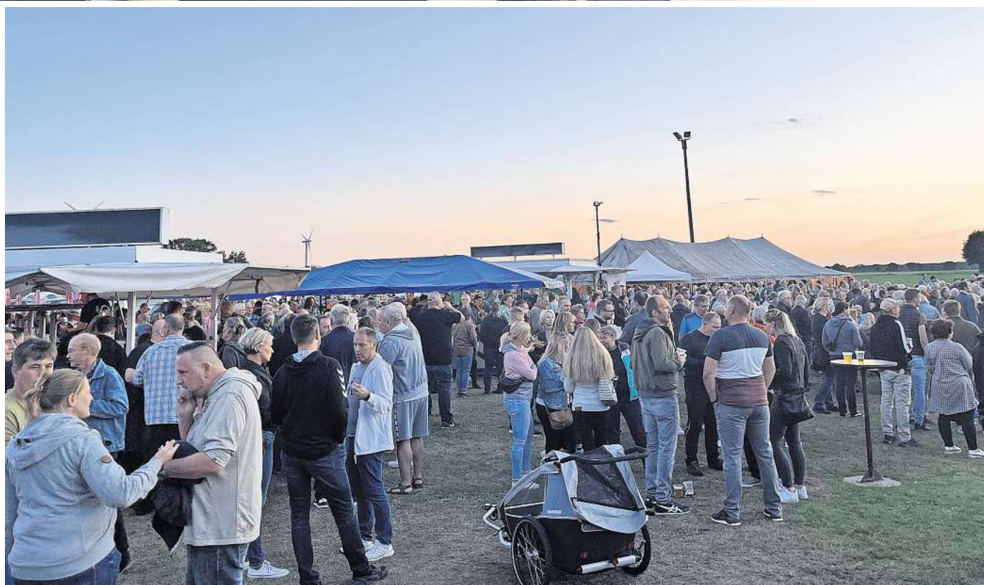
Das Schwüblingser Biker Open Air lockt viele Besucher an.

„Und ein paar Hartgesottene haben sogar in der Schlammwüste vor der Bühne getanzt“, erinnert