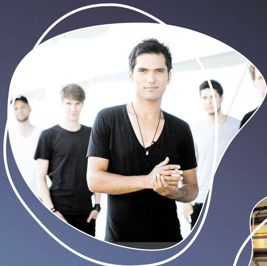
Mi, 31. Juli: The Jetlags Die beste Partyband Norddeutschlands eröffnet das Maschseefest