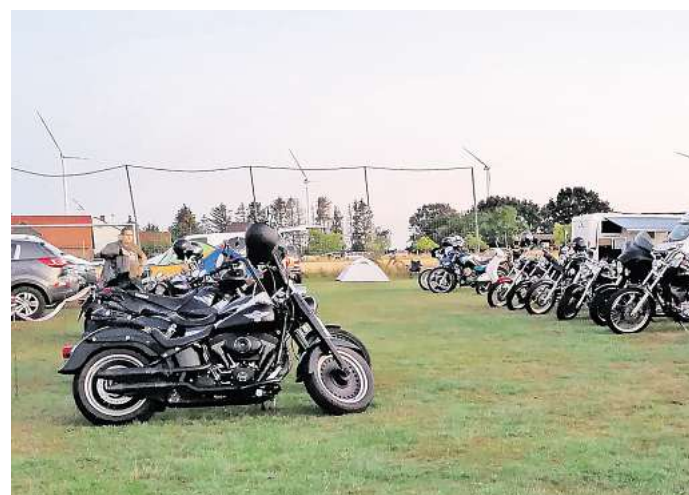
Bei einem waschechten Biker-Open-Air dürfen natürlich auch die Motorräder nicht fehlen.