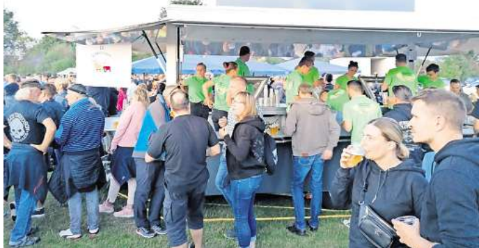
An mehreren Ständen gibt es Speisen und Getränke.