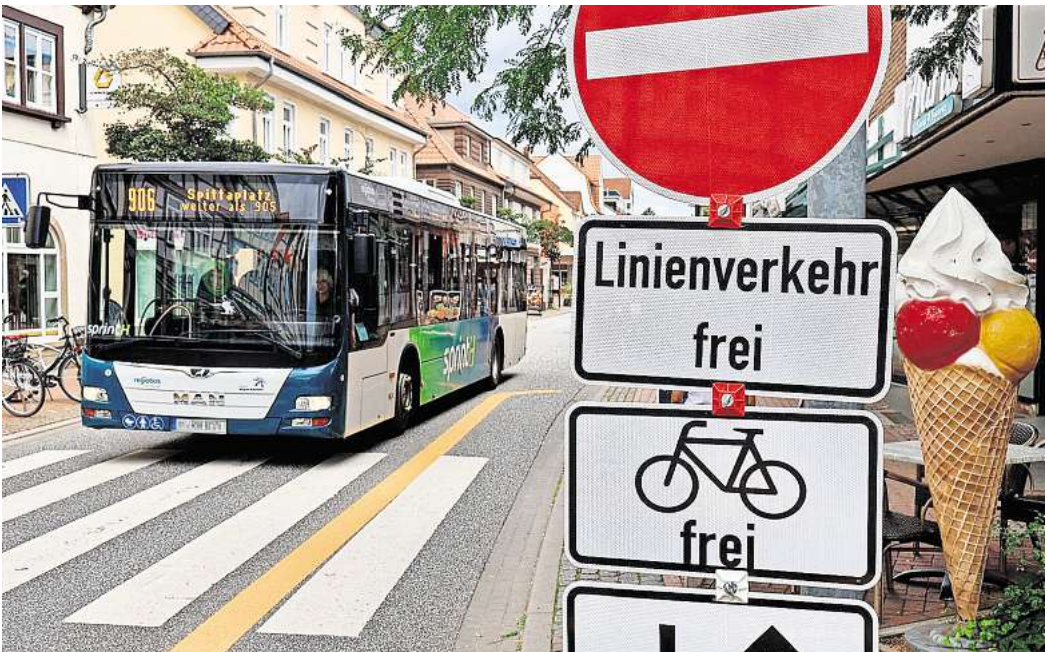
Die Einbahnstraßenregelung auf der Marktstraße soll im August aufgehoben werden.

Für den Seniorenrat ist das zwar ein Anfang, ihm ist aber auch klar: Das Problem mit der Marktstraße ist viel grundlegender. „Solange die Marktstraße die einzige Verbindungsstraße zwischen der Südstadt und der Weststadt ist, wird es schwer, sie zu entlasten. Im Prinzip hat der Verkehrsversuch auch nur das Symptom, aber nicht die Ursache bekämpft“, erklärt Schorr. Um das wirksam zu bekämpfen, müsse ein großräumiger Verkehrsplan geschaffen werden.