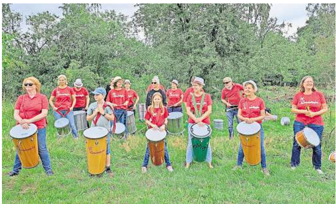
Die Trommelgruppe SambaZamba eröffnet das Biker-Open-Air.