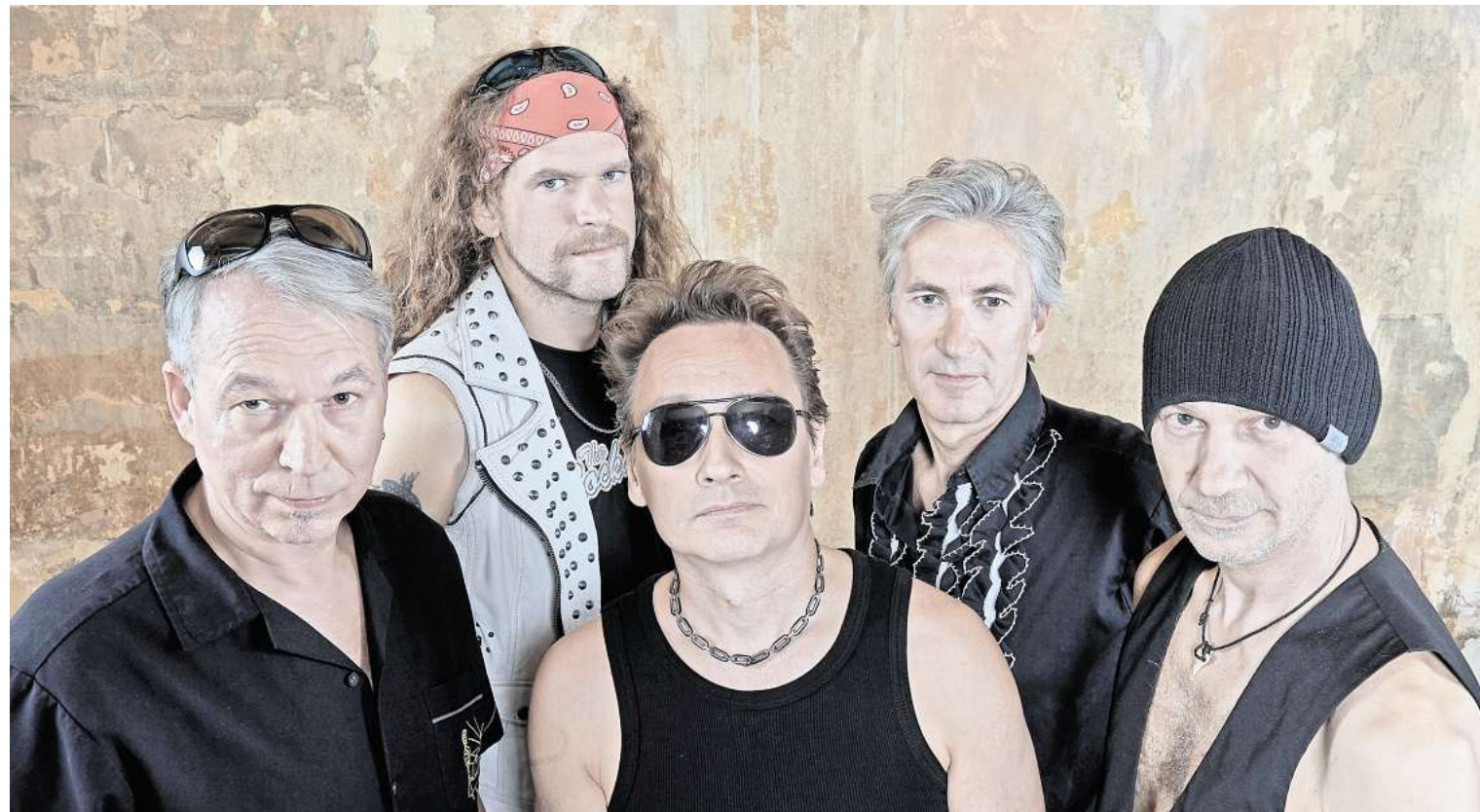
Soll ab 22 Uhr den Sportplatz als Hauptact zum Beben bringen: die Classic-Rock-Tribute-Band The Rockalots.

Drei Live-Bands spielen beim Schwüblingser Biker-Open-Air am 3. August