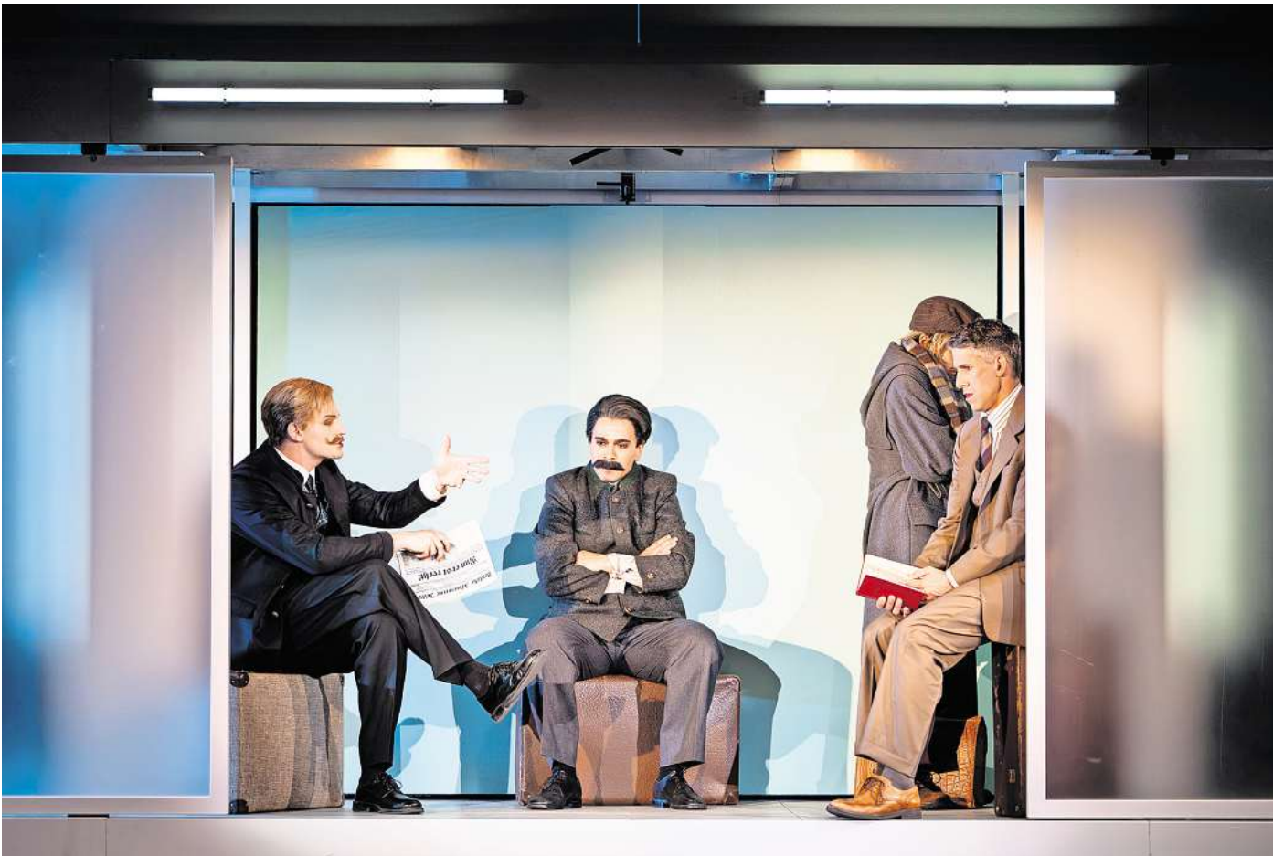
Zum Auftakt der neuen Spielzeit im Theater am Berliner Ring steht das Stück "Der ewige Spießer" nach dem gleichnamigen Roman von Ödön von Horváth auf dem Programm.