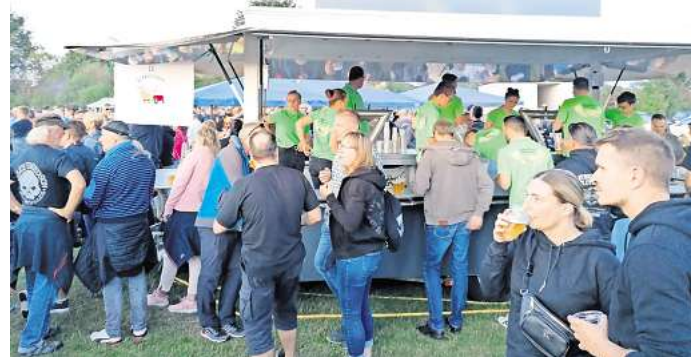
An mehreren Ständen gibt es Speisen und Getränke.

ging von Anfang an auf. Schon zur Premiere des Biker-Open-Airs im Jahr 1995 kamen viele Besucher aus dem Ort. „Es hat damals ganz spartanisch mit einer selbstgebauten Bühne und Trecker-Anhängern angefangen. Trotzdem kam es auf Anhieb gut an“, sagt Wehly. In all den Jahren habe es nie Beschwerden wegen Ruhestörung gegeben – und das, obwohl die Veranstaltung mit Live-Musik mitten im Ort stattfindet. „Da zeigt sich wieder einmal, was für eine tolle Dorfgemeinschaft wir hier in Schwüblingsen haben und wie groß der Zusammenhalt ist“, sagt Wehly.