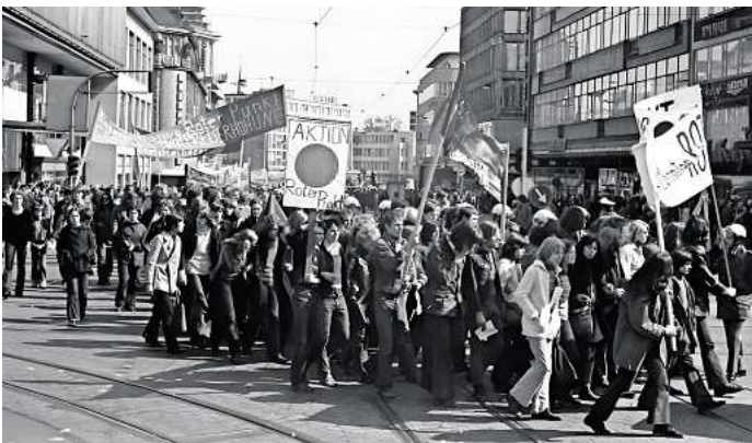
Der „Rote Punkt“ war im Juni 1969 ein prägnantes Symbol des Boykotts gegen eine überdurchschnittliche Preiserhöhung bei den Hannoverschen Verkehrsbetrieben.