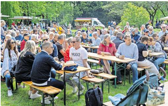
Viele Besucher genießen am Himmelfahrtstag das schöne Wetter und die entspannte Stimmung bei „Musik und Tanz im Stadtpark“.

ren bekannt war, da er jahrelang mit der Band „Nerbas & Nerbas“ bei der Traditionsveranstaltung im Stadtpark aufgetreten ist. Außerdem bot die Burgdorfer Tanzschule Studio B5 ein kurzwöchiges Mitmachprogramm an und es gab vielfältige Aktionen für Kinder. Gemeinsame Gastgeber waren der Verkehrs- und Verschönerungsverein (VVV), der Marktspiegel, das Studio B5 und der Fitnesspark Burgdorf.