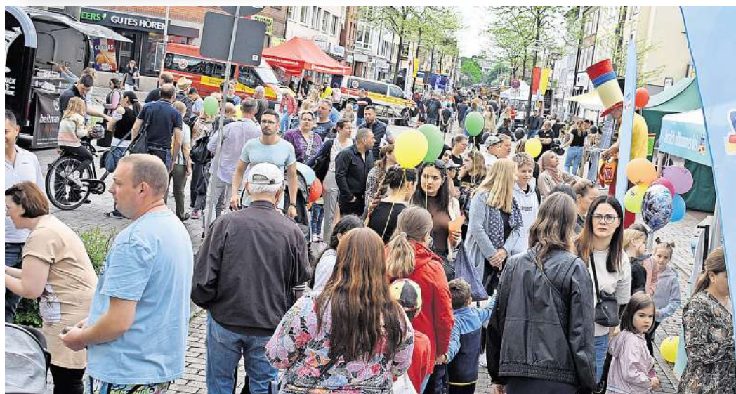
Gut besucht: Das Stadtfest 2023 wurde von den Veranstaltern als voller Erfolg bewertet. Deswegen gibt es im Konzept für 2024 keine großen Veränderungen.