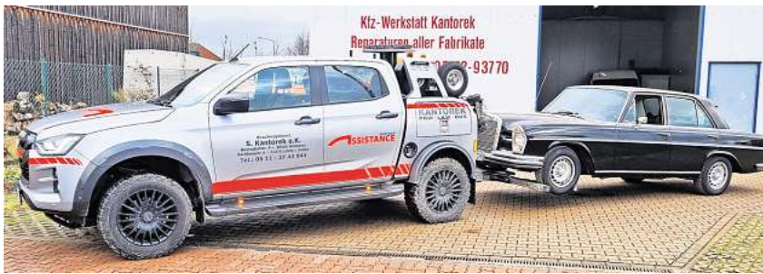
Von der Reparatur über die Inspektion bis hin zur Abschlepphilfe: Das Angebot der Firma Kantorek ist vielseitig.

Mehr Infos unter www.ab-schleppdienst-kantorek.de .