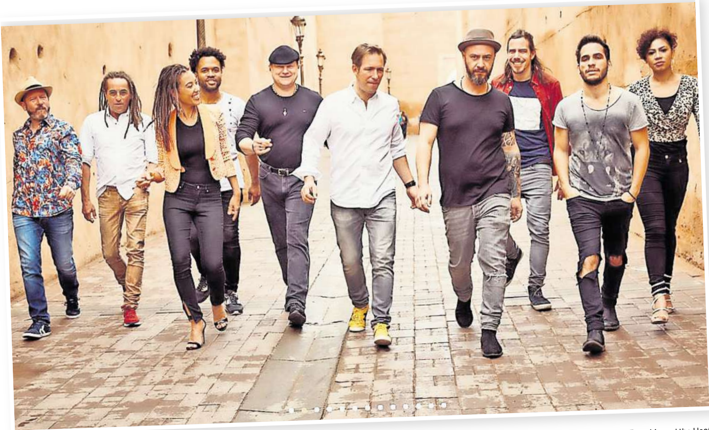
Die Hamburger Coverband Me and the Heat sorgt am Sonnabend ab 20 Uhr für Stimmung auf dem Stadtfest.