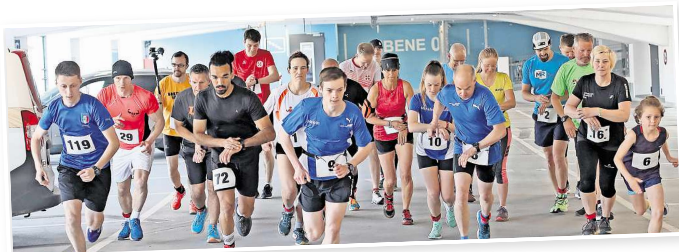
Rauf und runter: Am Sonntagvormittag steigt der 7. Parkhauslauf.