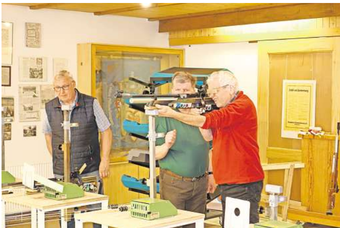
Die Burgdorfer Blasmusikanten und die Altmerdingser Schützen trafen sich zum Vergleichswettkampf im Luftgewehrschießen.

Im Anschluss probierten alle Anwesenden das vom Schüt-