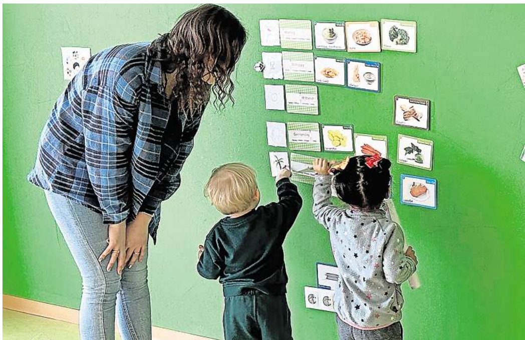
Mitsprache beim Speiseplan: In der AWO-Kita können die Kinder selbst entscheiden, welches Gericht sie wann essen möchten.

Deutsche Kinder- und Jugendstiftung würdigt das besondere Konzept der Einrichtung