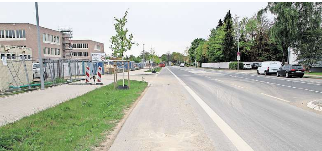
Die Fahrradstraßen der IGS Burgdorf lassen auf sich warten.

Alle diese Straßen haben ein Tempolimit von 20 oder 30 Stundenkilometern. Zusätzlich sollen Halteverbote in der Wallgartenstraße zwischen Gartenstraße und Heinrichstraße den Radverkehr sichern. Diese Maßnahme besteht, bis die Bauarbeiten und damit die Fahrradstraßen fertig sind. Auf einem Abschnitt der Straße Vor dem