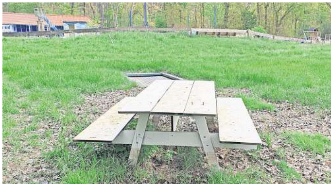
Die Bänke der Sitzgruppe waren vom Hochwasser komplett be- deckt.

Die Beseitigung der Hochwasserschäden ist nicht die erste Herausforderung im Waldbad. 2004 hatten sieben Menschen den Förderverein gegründet, um die von der Stadt Burgdorf angekündigte Schließung auf-