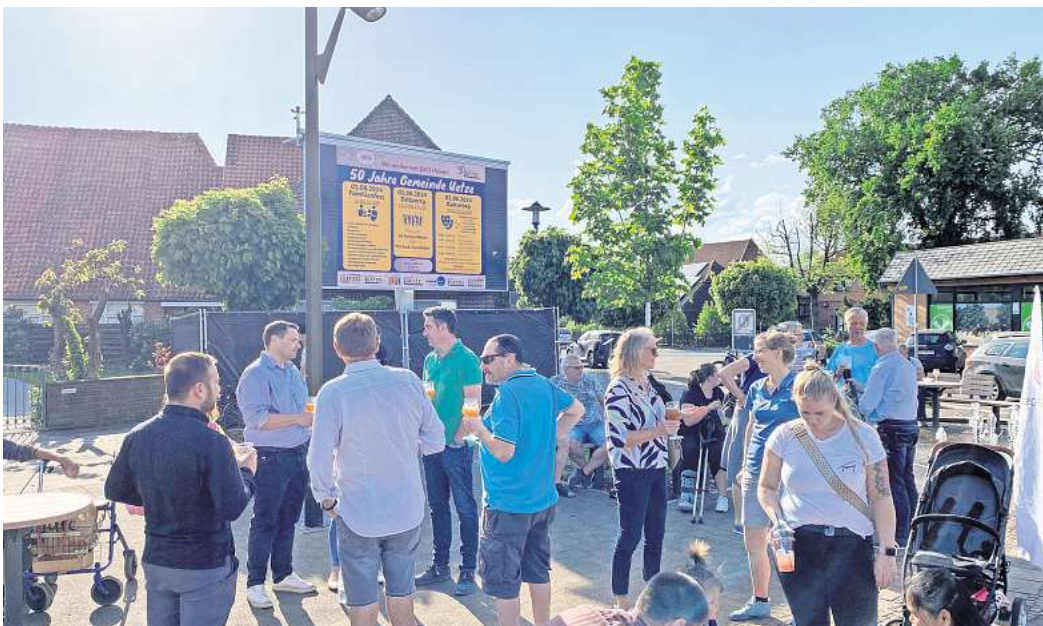
Erstmals präsentiert: Bei der After-Work-Party auf dem Hindenburgplatz sind historische Bilder aus der 50-jährigen Geschichte der Gemeinde Uetze gezeigt worden.

Das 50-jährige Bestehen der Gemeinde wird Anfang Juni mit einem Festwochenende rund um das Rathaus an der Marktstraße gefeiert. Ein Familienfest gibt es am Sonnabend, 1. Juni, zwischen 14 und 18 Uhr – mit Hüpfburg, Riesendarts, Torwandschießen und vielem mehr.