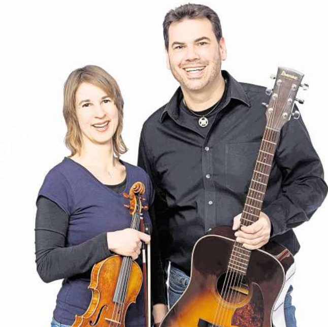
Das Duo Northbound nimmt die Zuhörer mit auf eine Reise durch Irland und Schottland.