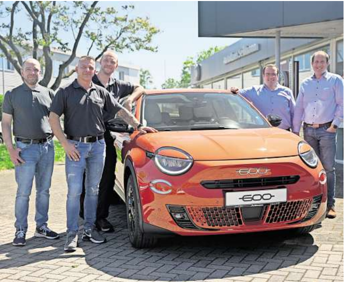
Mitarbeiter vom Autohaus Sellmann präsentieren den Fiat 600e.

Natürlich erfahren auch Autos mit allen anderen Antriebskonzepten viel Liebe im Autohaus Sellmann. Angeboten werden Modelle der Marken Fiat, Jeep, Abarth und Fiat Professional, der Werkstatt-Service steht zusätzlich Fahrzeugen von Alfa Romeo und Lancia offen.