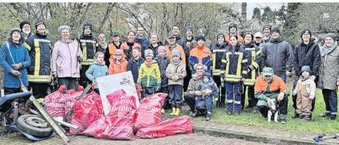
Viele Kinder und Erwachsene haben bei der Müllsammelaktion in Dachtmissen mitgeholfen.

Ab Mitte 2024 sollen auf der Pendlerstrecke zwischen Celle und Hannover längere Züge fahren, um mehr Fahrgäste befördern zu können. Dafür müssen mehrere Bahnhöfe umgebaut werden. In Aligse und Otze ist das bereits 2022 passiert. Doch in Ehlershausen stellte sich heraus, dass dafür auch Arbeiten an der Oberleitung und an einer Weichenstellung nötig sind. Daher musste der Baubeginn verschoben werden, der nun aber im Gange ist.