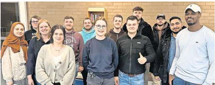
In der Pause haben die angehenden Speditionskaufleute von der BBS Burgdorf Snacks für den guten Zweck verkauft.