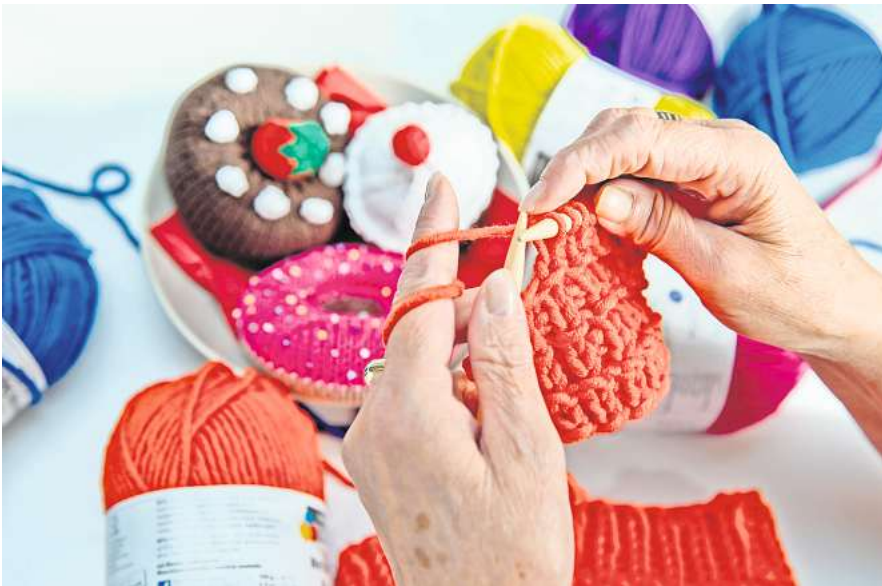
Hobbys fördern die körperliche, geistige und soziale Beweglichkeit.

der Universitätsmedizin Greifswald in der Zeitschrift „Senioren Ratgeber“ (Ausgabe 4/2024). So konnte eine Studie aus Großbritannien zeigen, dass Ältere, die einem Hobby nachgehen, gesünder und zufriedener sind und seltener zu Depressionen neigen. Ein komplexes Zopfmuster stricken oder einen neuen Golfplatz ausprobieren: Unserem Gehirn kommt außerdem zugute, dass Hobbys nie zur Routine werden, sondern uns neue Erfahrungen ermöglichen, wir also immer wieder dazulernen. Das kann Abbauprozessen im Gehirn entgegenwirken. Und: Viele Hobbys bedeuten körperliche Aktivität - auch das zählt auf die Gesundheit ein.