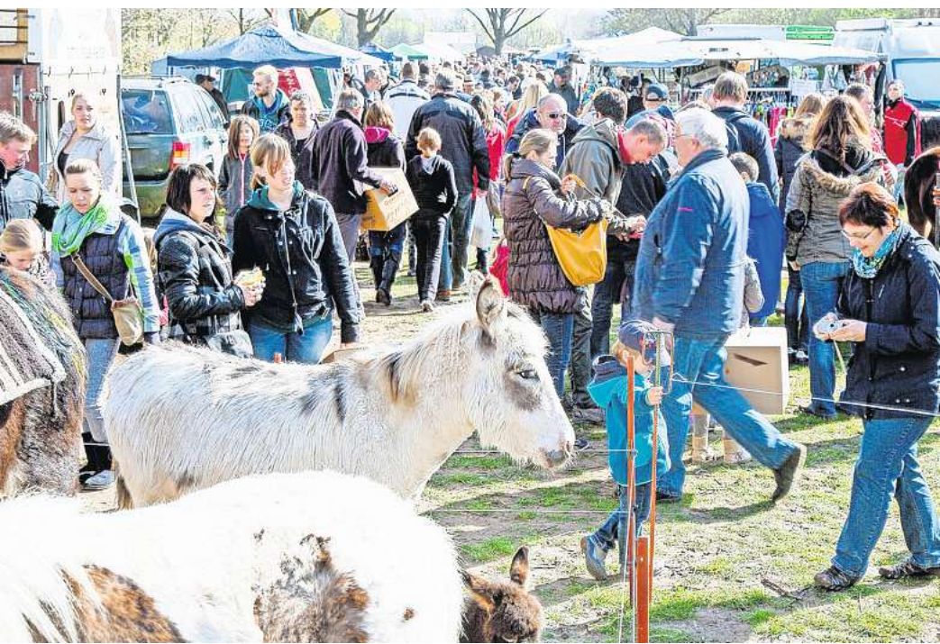
Die Saison der Pferde- und Hobbytiermärkte beginnt.