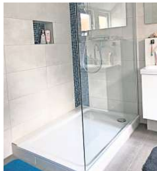
Der Fliesenlegerbetrieb übernimmt die Planung, Gestaltung und Sanierung von Bädern.