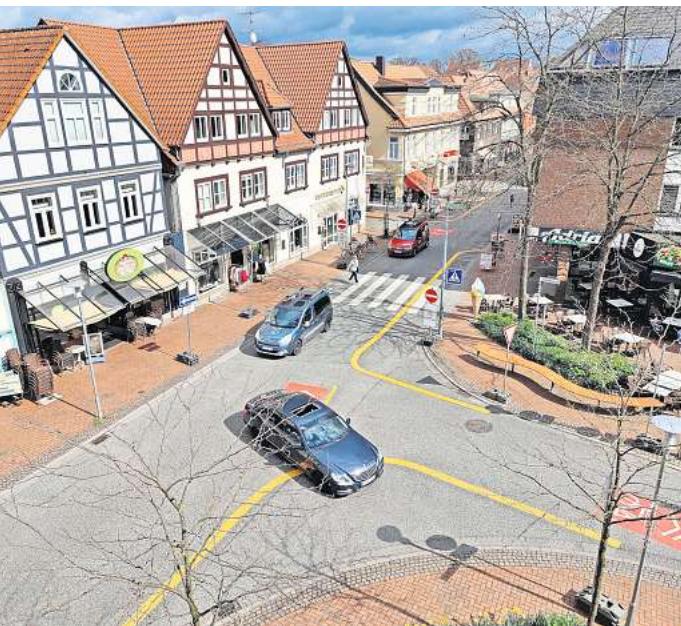
Von der Marktstraße aus auf die Poststraße fahren: Das ist nun nicht mehr erlaubt.

ders weit auf der Fahrbahn. Hinter dieser kommen nun einige Autos zum Stehen – denn sie haben unerlaubten Gegenverkehr, den sie erst einmal durchlassen müssen. Eine ähnliche Situation entsteht, wenn ein Bus vom Kreis aus in Richtung der Straße Vor dem Celler Tor fährt. Busse sind von der Regelung ausgenommen und fahren nach wie vor in beide Richtungen. Durch die Fahrbahnverengungen können Busse und Autos aber nicht mehr aneinander vorbeifahren. Stattdessen müssen Autos hinter den Sitzgelegenheiten anhalten und den Bus durchlassen. Bei zwei Haltestellen und mehr als 150 Bussen pro Tag und Fahrtrichtung sind hier auch langfristig Wartezeiten unvermeidlich. Abgesehen von den Sitzgelegenheiten und Pflanzen haben sich noch andere Dinge auf der Fahrbahn getan. Neue gelbe Linien verengen zusätzlich die Fahrbahn. Große rot-weiße Piktogramme zeigen Radfahrern, dass sie weiterhin in beide Richtungen auf der Straße fahren dürfen – und möglichst nicht auf dem Gehweg fahren sollen. Die Verkehrsveränderung beschränkt sich nicht nur auf die Marktstraße. Die bisherige Einbahnstraßenregelung an der Poststraße zwischen Schloß- und Marktstraße ist nun umgekehrt. Gleiches gilt für den westlichen Teil der Schloßstraße und für die Louisenstraße. Fußgänger und Radfahrer scheinen die neue Regelung