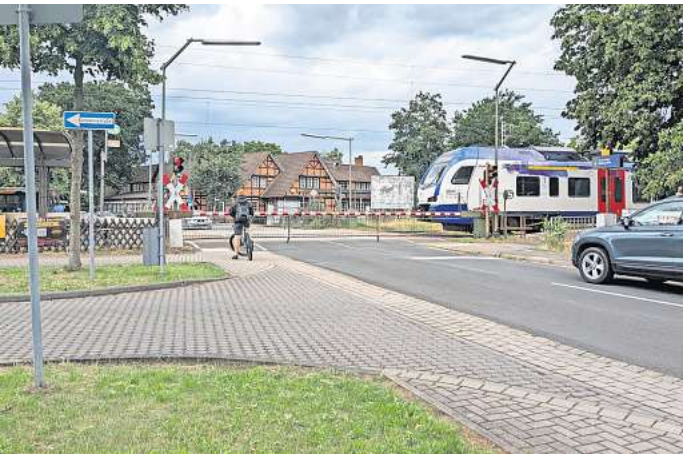
Am Bahnübergang Ehlershausen: Hier gibt es oft Stau.