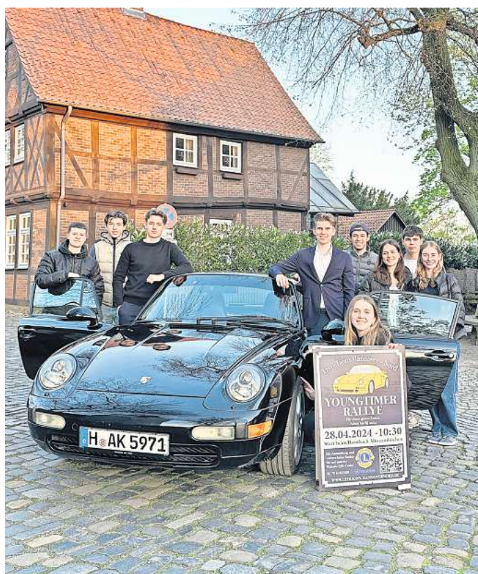
Die "Leos" vom Lions-Club Burgdorf-Isernhagen freuen sich auf die Rallye mit vielen Fahrzeugen älteren Baujahrs.

Die Teilnahme kostet 80 Euro. Im Preis enthalten sind ein Rallye-Readbook, ein Polo-Shirt und Snacks für die Fahrt. Die Erlöse der Veranstaltung sollen wohltätigen Zwecken zugutekommen, voraussichtlich dem Kinderhilfsprojekt „ASB Wünschewagen“. Alle Informationen zur Anmeldung finden sich auf der Internetseite www.leoli-on-hannovernd.de .