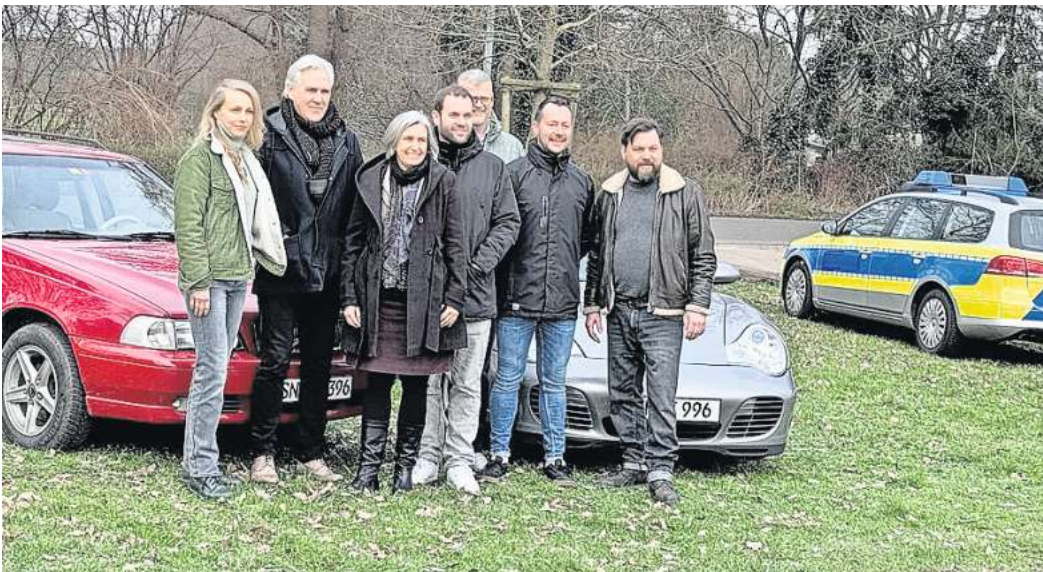
Versammelt: Die Verantwortlichen von „Die Toten von Marnow“.

KLEINBURGWEDEL (lek). Große Trailer parken auf dem Parkplatz vor dem Vereinsheim des TSV Kleinburgwedel. Ein Aufgebot an vermeintlichen Polizeiwagen blockiert die Straße. Es herrscht ein wildes Getümmel, vor allem vor dem Cateringwagen. An den Stehtischen versammeln sich einige Menschen, die über das weitere Vorgehen diskutieren. Der TSV Kleinburgwedel ist nicht etwa Ort eines Verbrechens geworden, sondern wird wieder einmal zur Filmkulisse. Die NDR-Serie „Die Toten von Marnow“ geht in die zweite Runde. Nachdem bereits Teile der ersten Staffel in Burgwedel gedreht wurden, ermitteln die Kommissare der Thrillerserie, die von den Schauspielern Petra Schmidt-Schaller und Sasha Gersak gespielt werden, für die zweite Staffel wieder hier.