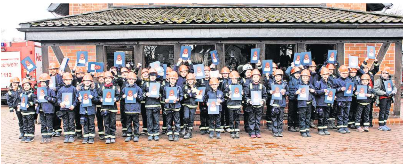
Stolz lächeln die 36 Prüflinge mit ihren Urkunden in die Kamera.

Ganz schön viel! Trotz dieser Hürde haben alle 36 Kinder die Abnahme mit Bravour gemeistert. Die Menge an Prüflingen beruht darauf, dass die Abnah-