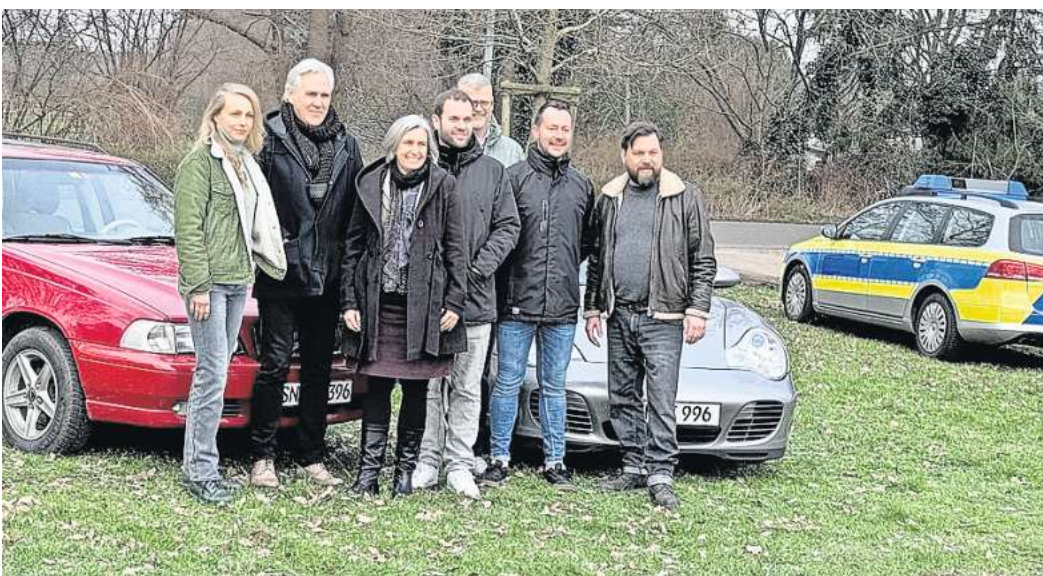
Versammelt: Die Verantwortlichen von „Die Toten von Marnow“.

KLEINBURGWEDEL (lek). Große Trailer parken auf dem Parkplatz vor dem Vereinsheim des TSV Kleinburgwedel. Ein Aufgebot an vermeintlichen Polizeiwagen blockiert die Straße. Es herrscht ein wildes Getümmel, vor allem vor dem Cateringwagen. An den Stehtischen versammeln sich einige Menschen, die über das weitere Vorgehen diskutieren. Der TSV Kleinburgwedel ist nicht etwa Ort eines Verbrechens geworden, sondern wird wieder einmal zur Filmkulisse. Die NDR-Serie „Die Toten von Marnow“ geht in die zweite Runde. Nachdem bereits Teile der ersten Staffel in Burgwedel gedreht wurden, ermitteln die Kommissare der Thrillerserie, die von den Schauspielern Petra Schmidt-Schaller und Sasha Gersak gespielt werden, für die zweite Staffel wieder hier.