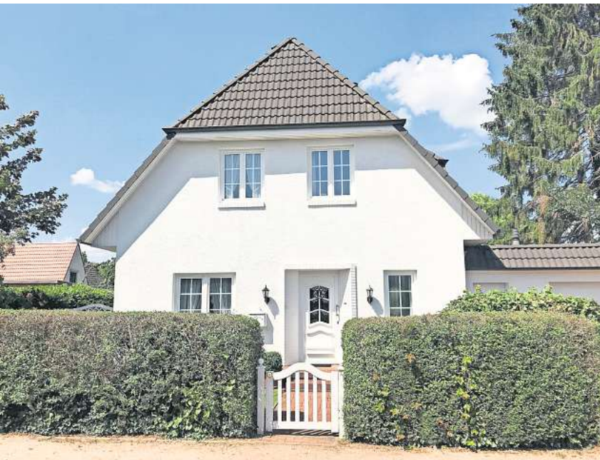
Auch Hausfassaden benötigen manchmal eine optische Aufwertung.