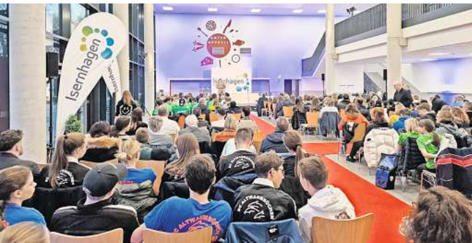
Volles Haus: Die Gemeinde Isernhagen ehrt Sportlerinnen und Sportler für ihre Leistungen.