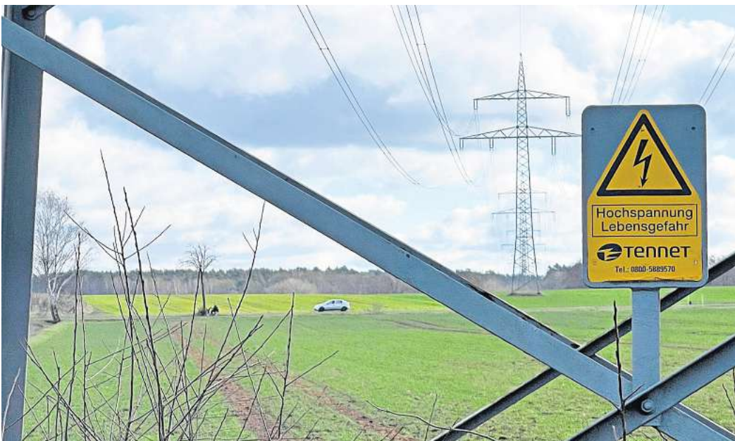
Hier fließt derzeit der Strom: Die alte Tennet-Trasse zwischen Klein- und Großburgwedel. Sie wurde in den 1960 Jahren gebaut.

Und das hat Gründe. „Eine Erdverkabelung ist deutlich teurer als eine herkömmliche Freileitung. Sie verursacht die sechs- bis achtfachen Kosten“, sagt Meyer. Doch es sind nicht nur die Kosten, die nach den Worten der Tennet-Referentin gegen das