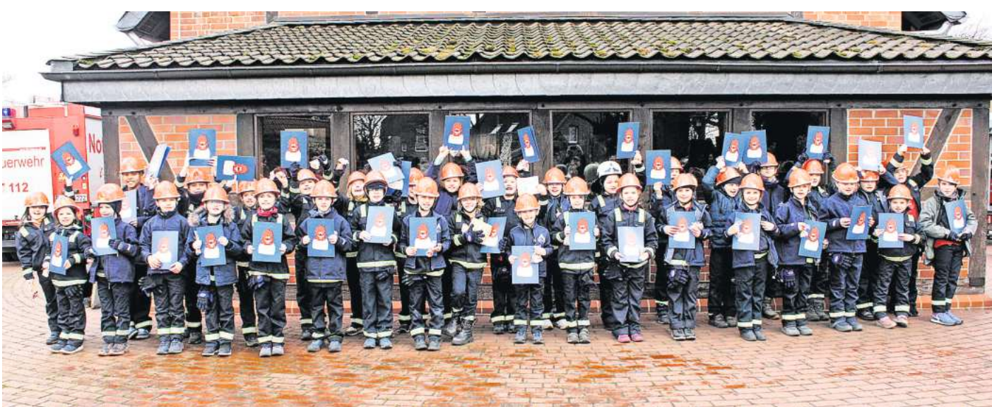
Stolz lächeln die 36 Prüflinge mit ihren Urkunden in die Kamera.

Ganz schön viel! Trotz dieser Hürde haben alle 36 Kinder die Abnahme mit Bravour gemeistert. Die Menge an Prüflingen beruht darauf, dass die Abnah-