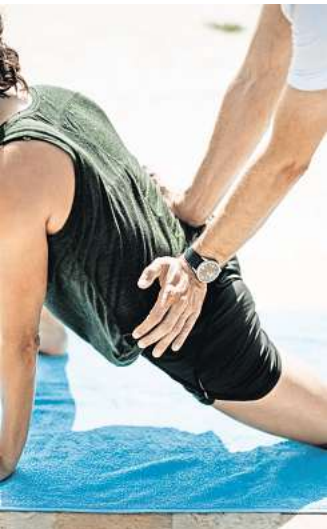
„Dein Kompass zur Rückengesundheit“ lautete das Motto am diesjährigen Tag der Rückengesundheit.