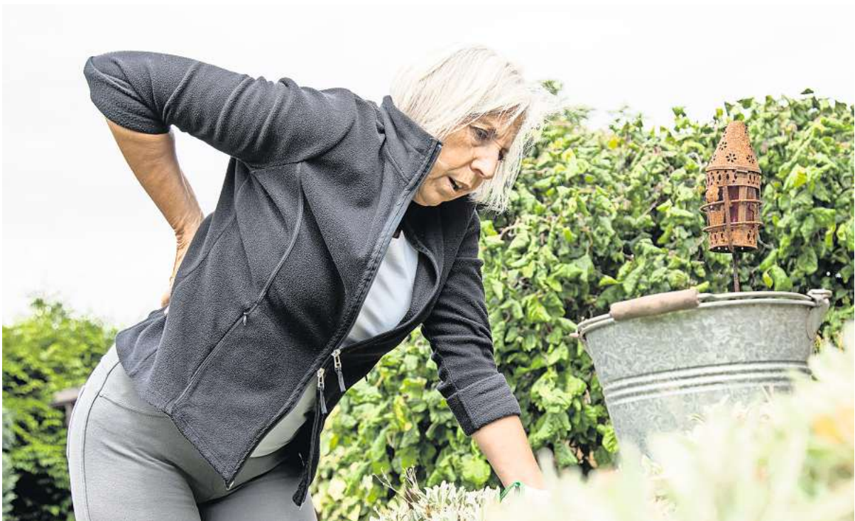
Autsch, ein Stich fährt durch den Rücken: Nach einem Hexenschuss können Wärme und Entspannung helfen.

Auf jeden Fall zum Arzt gehen sollte man, wenn man vor einem Hexenschuss gestürzt ist, Fieber hatte, an Osteoporose oder Krebs erkrankt ist, oder ins Bein aus-