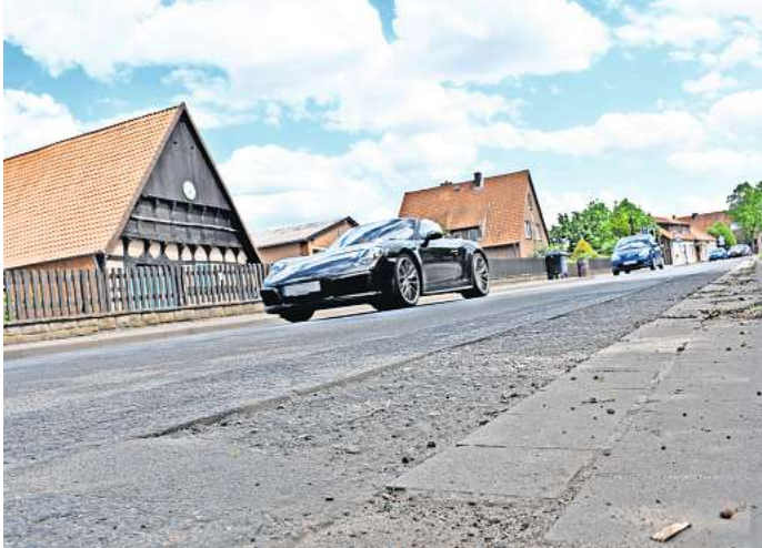
Fahrbahnsanierung: Die Dorfstraße in Isernhagen K.B. (K113) wird in den Osterferien zwei Wochen lang für den Verkehr gesperrt.

Da die Bauarbeiten aber abhängig von den Wetterverhältnissen in den nächsten Wochen sind, kann es laut Region zu zeit-