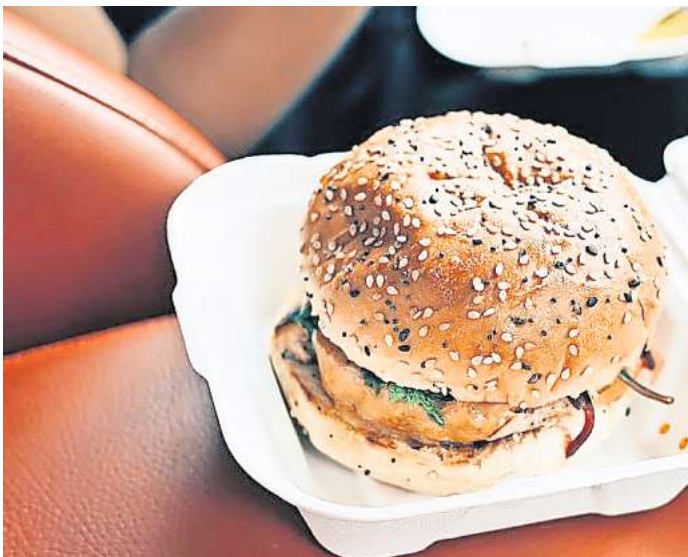
Den Burger während der Fahrt verzehren? Lieber nicht, die Aufmerksamkeit leidet.

Wenn sich beispielsweise die Aufmerksamkeit im Auto auf eine Mahlzeit richtet, kann es rasch zu einer Gefährdung anderer Verkehrsteilnehmer kommen. Gerichtsurteile gibt es zahlreich zu Unfällen, bei denen Ablenkung nachgewiesenermaßen der Auslöser oder begünstigender Faktor war. Natürlich kommt wohl niemand auf die Idee, ein Schnittzel auf den Knien mit Messer und Gabel zu schneiden. Aber auch die Plastikgabel in der Hand