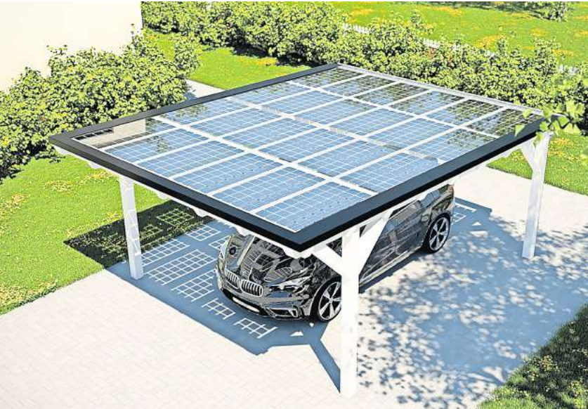
Solaranlagen können platzsparend auf dem Carport angebracht werden.