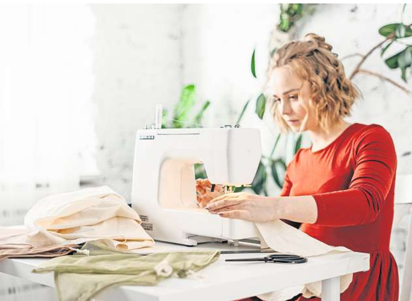
Aus einem hübschen Stück Stoff lässt sich ein Rollo nähen.

Mit Geduld zum individuellen Sonnenschutz gelangen