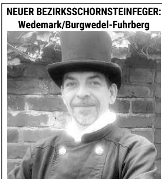
NEUER BEZIRKSSCHORNSTEINFEGER: Wedemark/Burgwedel-Fuhrberg