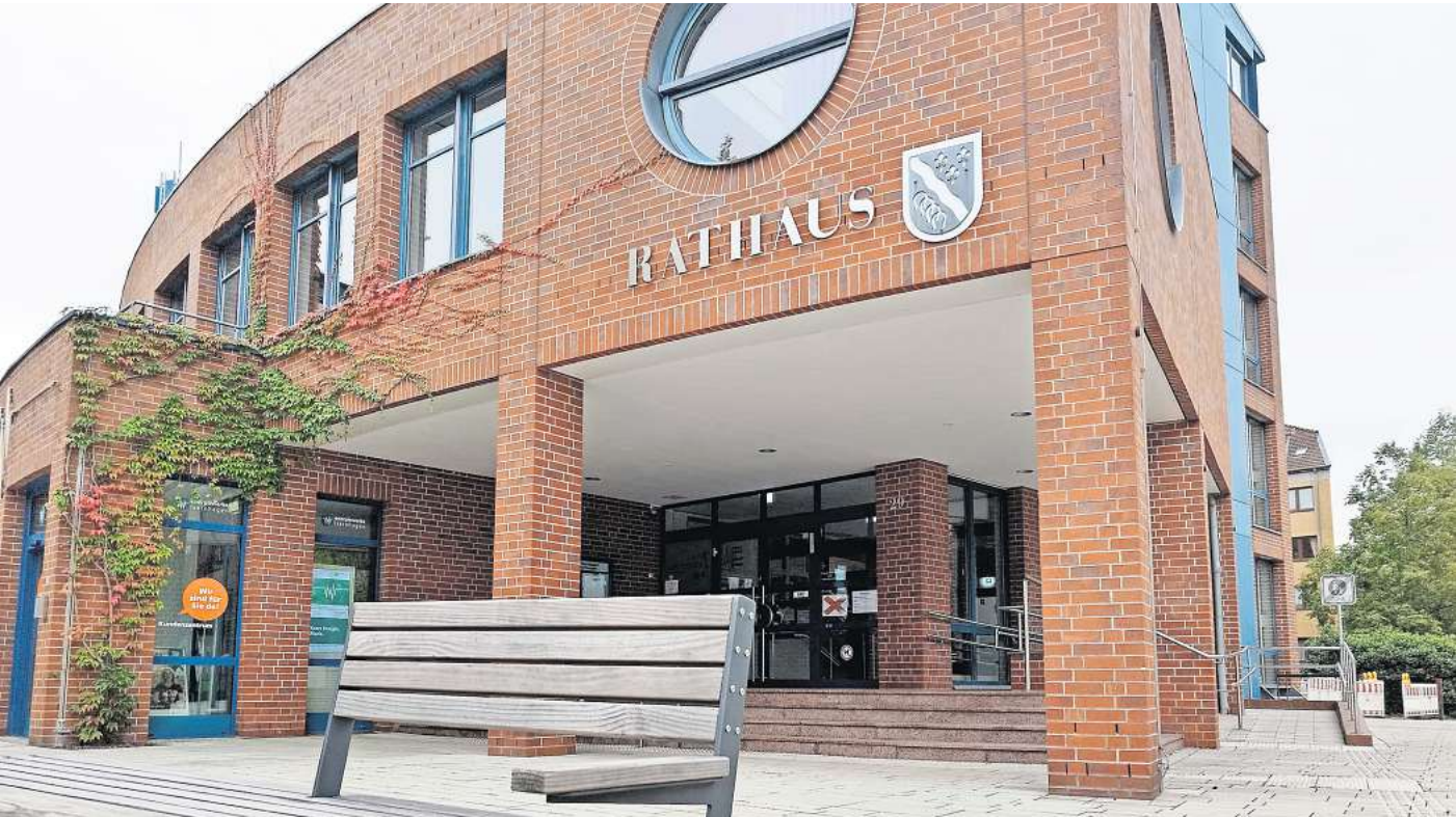
Hohe Investitionen und wachsende Haushaltslöcher: Die Gemeinde Isernhagen steht in den nächsten Jahren vor großen Herausforderungen. (Symbolbild)

Haushalt für 2024/2025: Für Bürger könnte es positive Veränderungen geben