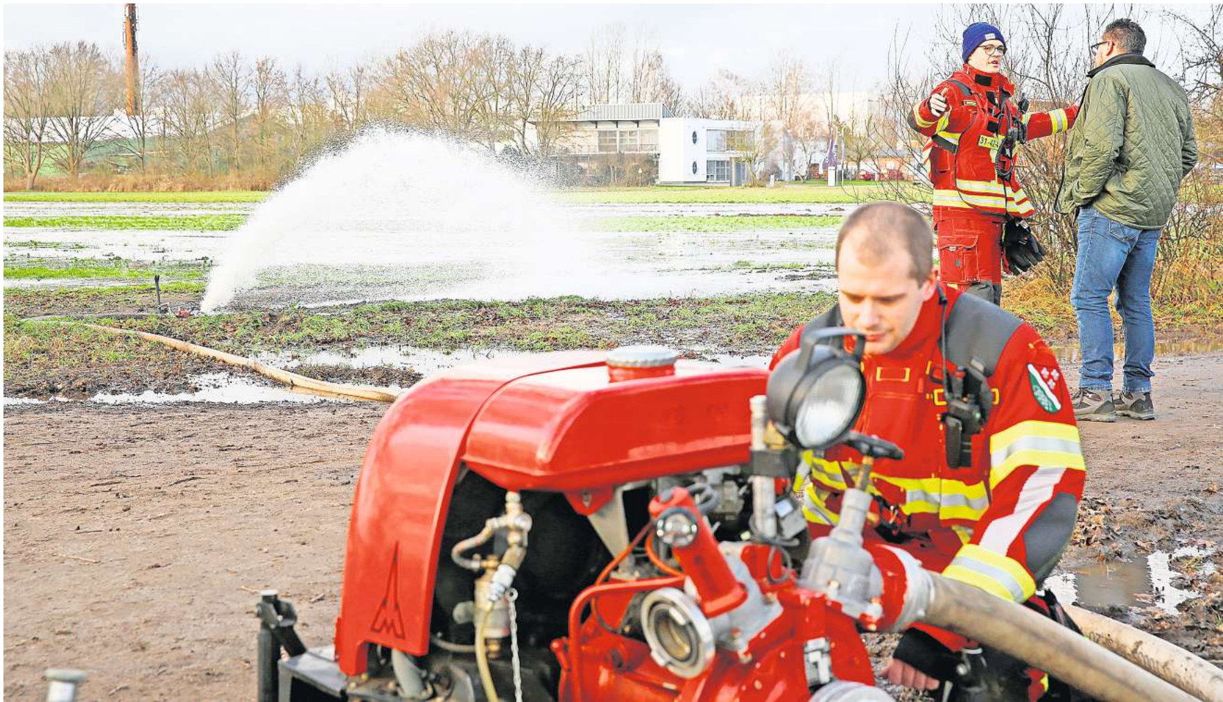
Wegen des Hochwassers war die Feuerwehr in Isernhagen N.B. im Dauereinsatz.

„Die Feuerwehren haben einen bombastischen Job gemacht“, lobt Isernhagens Bürgermeister Tim Mithöfer