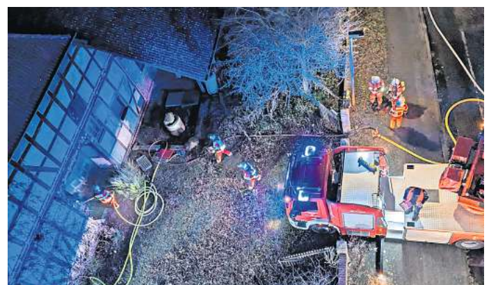
Blick aus dem Korb der Drehleiter der Feuerwehr Altwarmbüchen: Der erste Atemschutztrupp betritt das verqualmte Fachwerkhäus an der Steller Straße 16.