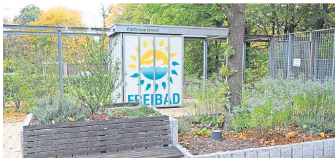
Eingang zum Freibad Großburgwedel: Badegäste können während der Saison ihre Eintrittskarten am Automaten kaufen.

Bisher hatte die Stadt Saisonkräfte eingestellt, die am Freibad-Eingang bei Problemen halfen. Dieser Service wird in der Saison 2024 entfallen. Auch das hat der Rat jetzt beschlossen. Die Stadt spart so Personalkosten in Höhe von rund 18.300 Euro. Da die meisten Störfälle am Kassenautomaten auf die Zahlung mit Bargeld zurückzuführen waren, wird diese nun abgeschafft. Wer also eine Karte für das Freibad kaufen möchte, muss das bargeldlos am Automaten tun oder vorab online. Kinder müssen sich vorab von ihren Eltern Eintrittskarten kaufen lassen. Per QR-Code auf dem Handy oder ausgedruckt auf Papier ist dann der Einlass möglich.