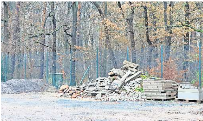
Privatgelände: An diesem Ort neben den Tennisplätzen hat der TSV Isernhagen Bauschutt von der Sanierung des Parkplatzes gelagert. Unbekannte haben ihren Bauschutt einfach dazu gekippt.

Der Bauschutt liegt also noch an Ort und Stelle. Eigentlich kein Problem – wenn der Haufen nicht bereits mehrfach plötzlich größer geworden wäre. Mindestens drei große Fuhren fremden Schutts hätten Unbekannte dort