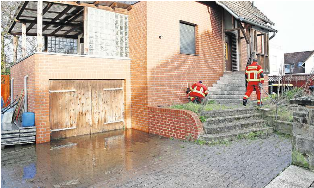
Alles im Blick: Immer wieder kontrolliert die Feuerwehr die Wasserstände in den Häusern.

Isernhagen N.B. gehört indes zu den am stärksten betroffenen Ortschaften in der Region Han-