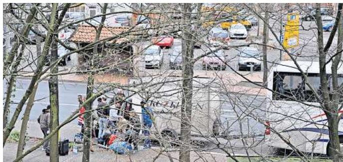
Geflüchtete räumen vor dem Rathaus ihre Habseligkeiten aus: In den vergangenen Jahren hat Burgwedel zahlreiche Menschen aufgenommen.

rainern ein. Diese Flüchtlinge kämen ohne Zuweisung, da sie privat untergebracht würden, erläutert die Ordnungsamtsleiterin. Auch in diesem Fall erfolge aber später eine Anrechnung auf die Aufnahmequote. Die Stadt Burgwedel verfügt über zahlreiche eigene oder angemietete Häuser, Sammelunterkünfte und Wohnungen in allen Ortsteilen. In keinem der Objekte leben mehr als 30 Geflüchtete unter einem Dach. Um den Prinzip der dezentralen Unterbringung weiterhin treu bleiben zu können, sucht die Kommune aktuell wieder Wohnraum. Sie präsentiert sich dabei als eine Art Mustermieterin. Man überweise nicht nur zuverlässig die im Mietvertrag vorgesehene Miete, sagt Stroker. „Wenn wir etwas mieten, bieten wir auch einen Rundumservice – ein Anruf unter (05139) 8973311 genügt, und wir schauen uns an, wer die geeigneten Bewohner für die Wohnung sind.“ Bei Problemen könnten Hauseigentümer sich jederzeit an die Stadt wenden, dann werde Abhilfe geschaffen. Wer Wohnraum zur Miete zur Verfügung stellen kann, kann sich auch per E-Mail an gebauedewirtschaft-rathaus@burgwedel.de oder info@burgwedel.de an die Stadt wenden.