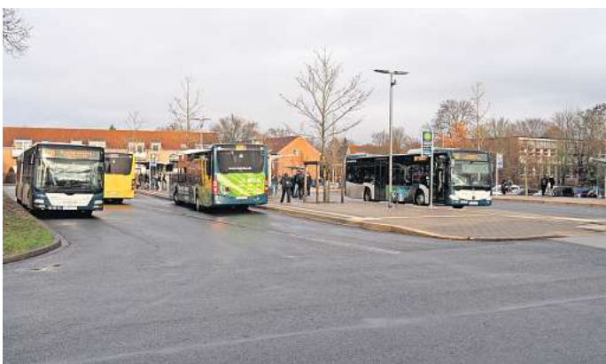
Bushaltestelle am Schulzentrum: Kinder aus Oldhorst können sich jetzt mit dem Sprinti zur Schule bringen lassen.

Eine Änderung des Busfahrplans, die sich Eltern, Kinder, Jugendliche und Ortsbürgermeister gleichermaßen wünscht, steht aktuell nicht zur Diskussion. Denn die Region Hannover als Trägerin des Schülerverkehrs verweist stattdessen auf eine andere Lösung: Seit dem 1. Oktober fährt der Sprinti in der Stadt. „Natürlich soll und kann dieser nicht einen regulären Linienbus ersetzen, der Schulkinder mitnimmt“, ergänzt Regionssprecher Christoph Borschel. Aber: Schülerinnen und Schüler können einen Minibus per App buchen, wenn es keine adäquate Linienbusverbindung innerhalb von 30 Minuten gibt und wenn der Fußweg zur nächsten Haltestelle nicht mehr als 600 Meter beträgt, wie