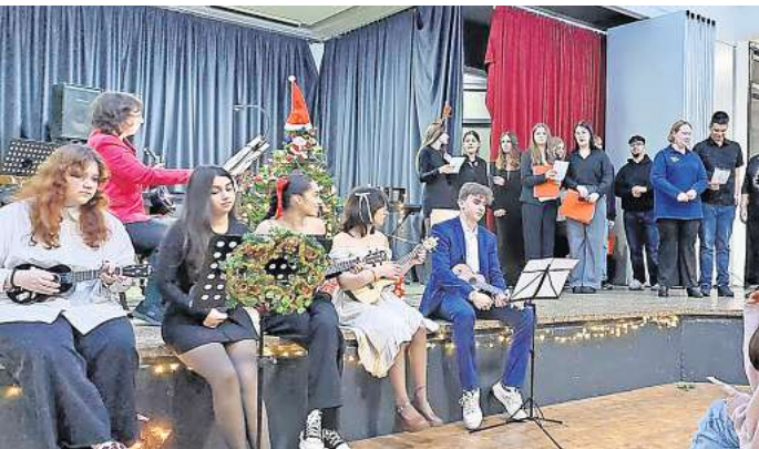
Schülerinnen und Schüler der IGS tragen Weihnachtslieder vor.