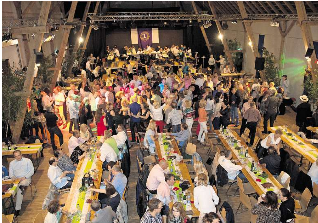
30. April: Lions laden wieder zum „Tanz in den Mai“ in Isernhagenhof ein.

Vom Tanz in den Mai 2025 hatte die DLRG Isernhagen profitiert. Aus dem Erlös, der laut Helmrich bei einer mittleren vierstelligen Summe liegt, schaffte sich die DLRG-Jugend ein 20 Quadrat-