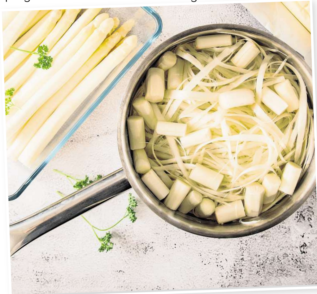
Vielfältige Rezepte, aber immer ein schnelles Gericht: Spargel lässt sich gut zubereiten.

Die Garzeit richtet sich beim grünen Spargel stark nach der Stärke der Stangen und beträgt häufig nur rund fünf Minuten, was ihn deutlich schneller gar werden lässt als seinen weißen Verwandten. Besonders dicke Stangen der ersten Güteklasse hingegen brauchen mitunter bis zu einer Viertel-