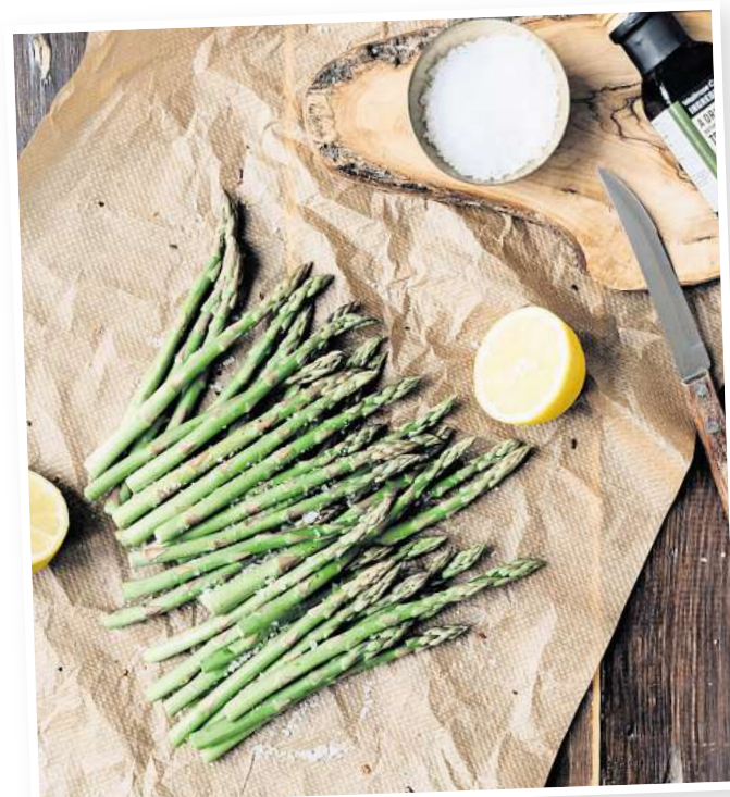
Grüner Spargel schmeckt kräftiger und hat hohe Nährstoffgehalte.

Aber es gibt auch Unterschiede, die durch die Wuchsform beziehungsweise den Erntezeitpunkt entstehen: Weißer Spargel wird gestochen, noch bevor die Köpfe die Erdoberfläche durchbrechen. Im Idealfall hat er keinerlei Sonnenlicht gesehen und ist durchgehend weiß. Grüne Stangen wachsen dagegen überirdisch. Sie enthalten etwas mehr Vitamin C und Beta-Carotin.