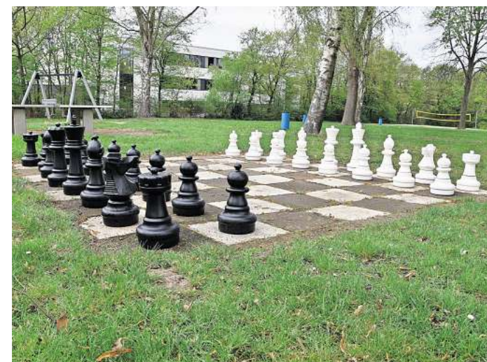
Die Schachfiguren stehen bereits: Blick über die Liegewiese des Freibads Großburgwedel.