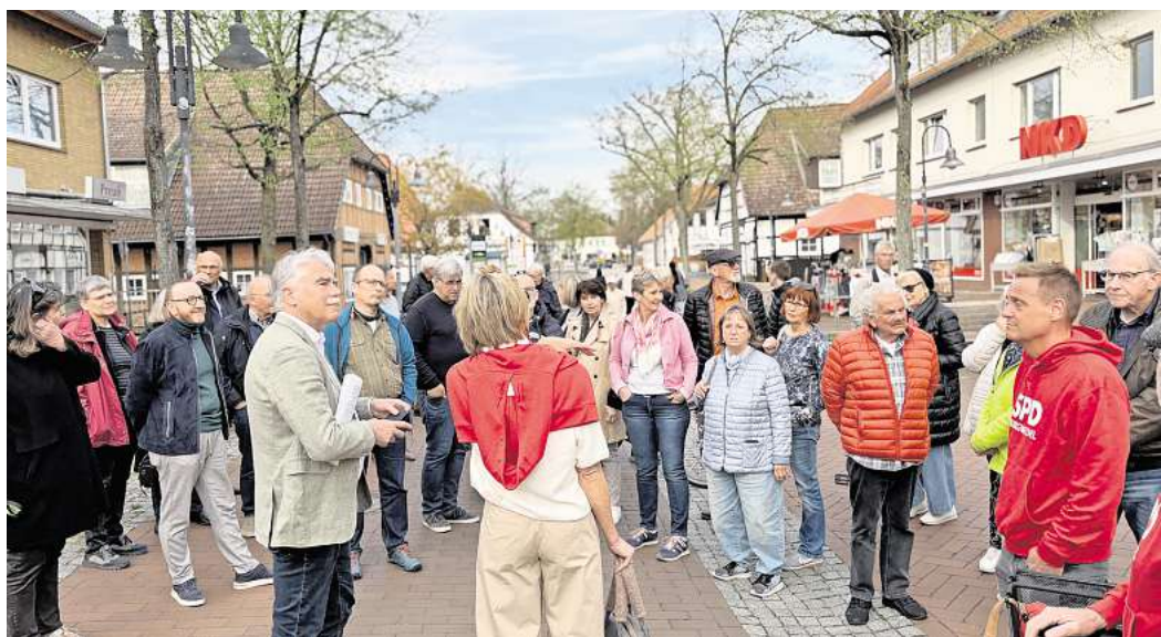
Neue Konzepte sollen Großburgwedels Innenstadt neuen Schwung geben.

Der Spaziergang begann am Domfrontplatz und machte bereits nach wenigen Metern Halt. Denn in den Fenstern des künftigen „Café Blume“ hing ein Zettel. „Leider dürfen wir aus behördlichen Gründen noch nicht mit dem von uns gewünschten Konzept starten“, heißt es dort. Laut Teilnehmern dürfe die Bestuhlung nicht im vorderen Bereich der Fußgängerzone aufgestellt werden. „Symptoma-