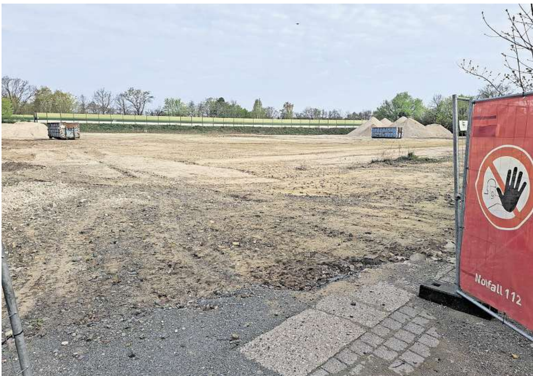
Hier sollen 150 neue Wohnungen entstehen: Nach Bürgerprotesten sehen Kommunalpolitiker weiteren Beratungsbedarf.

Auslöser für das Vorgehen von SPD und Grünen ist augenscheinlich der Umgang der Gemeindeverwaltung mit 77 Eingaben aus der Bevölkerung während der sogenannten Auslegung des Bebauungsplans. Die Bürgerinnen und Bürger hatten gegenüber der Verwaltung schriftlich ihre Bedenken zu einzelnen Aspekten des Projekts geäußert.