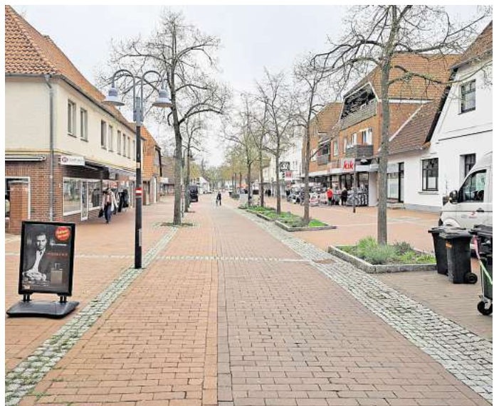
Keine echten Frequenzbringer mehr, kaum noch Laufkundschaft: die Von-Alten-Straße in Großburgwedel.