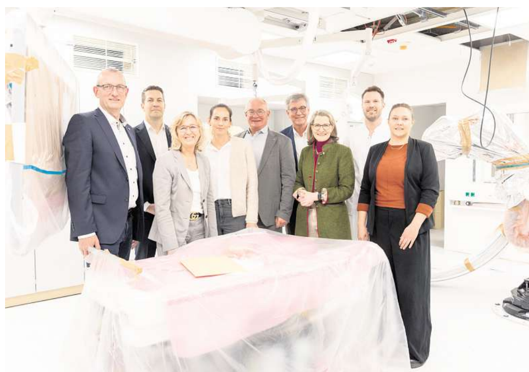
Im Rahmen einer Feierstunde wurden das Herzkatheterlabor und das moderne MRT vorgestellt.

Für das Herzkatheterlabor wurden Fördermittel in Höhe von 2,1 Millionen Euro eingesetzt, für das MRT rund 3 Millionen Euro. Der MRT-Bereich wurde als vorgefertigtes Raummodul angeliefert und vor Ort ange-