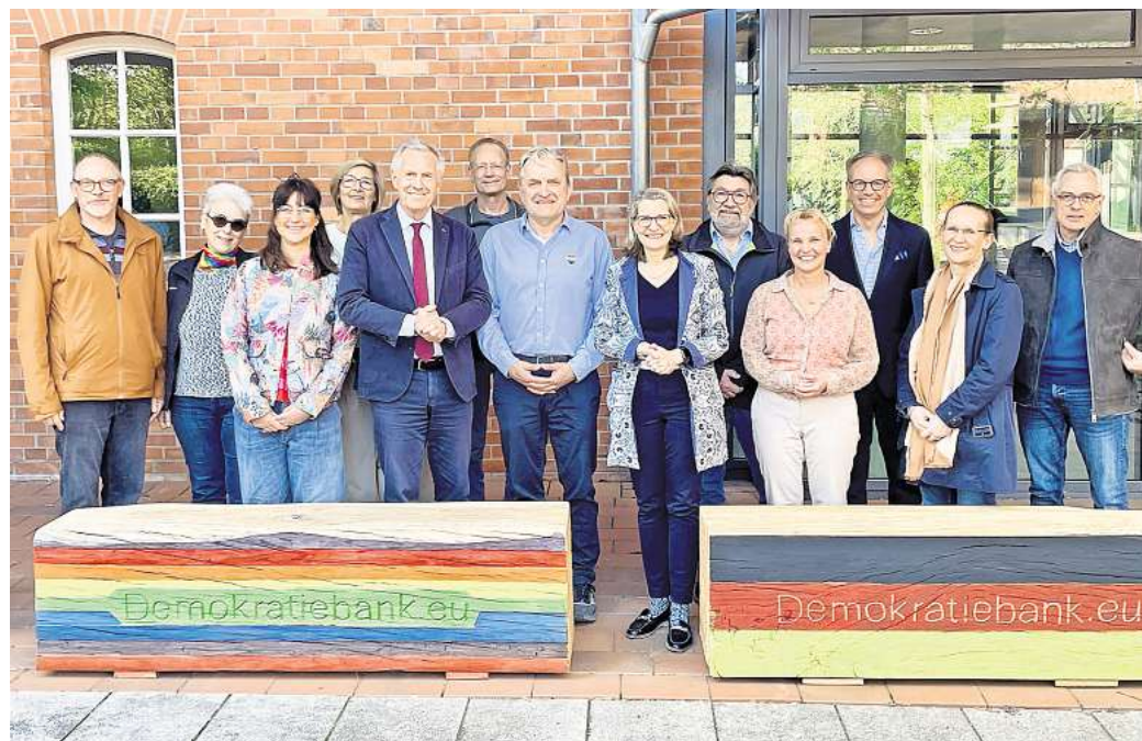
Übergabe der Bänke an den Stadtrat. Über den endgültigen Standort wird in den nächsten Wochen entschieden.