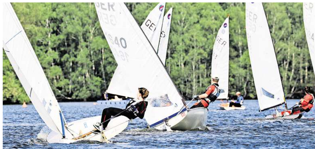
Auch die Segler blicken optimistisch auf die kommende Saison.

Auch die Segler blicken optimistisch auf die kommende Saison. Neben regelmäßigen Angeboten wie dem Mittwochsssegeln und verschiedenen Regatten stehen Ausbildung und