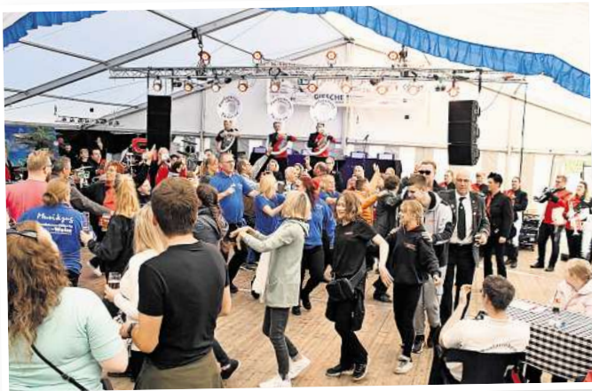
Beim Thönser Schützenfest herrscht immer beste Stimmung im Festzelt.

„Edelweiß“ Thönse eröffnet am 1. Mai die Saison der Burgwedeler Schützenfeste