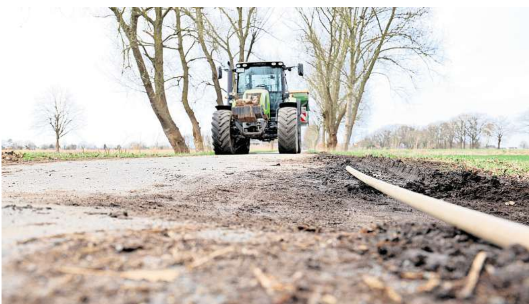
Abgesenkte Fahrbahn der Steller Moorstraße: Wer hier mit Tempo durchfährt wird kräftig durchgeschüttelt.

Aber der Reihe nach. Der Wirtschaftsweg ist eigentlich top – gut ausgebaut, asphaltiert, ohne größere Macken im Asphalt. Er gehört dem Realverband Stelle, und der kümmert sich um Erhalt und Pflege der Straße. Aktuell geht es lediglich um ein 62 Meter langes Teilstück unter der A37: den Bereich der Autobahnanterführung. Der liegt nicht in der Obhut der Landwirte, hat einen anderen Eigentümer, so Realverbandschef Ulrich von Rautenkranz. Und das seit dem Bau der