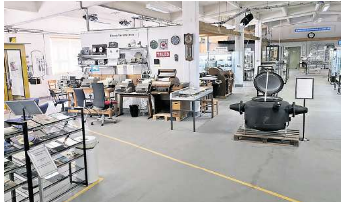
Besonders die Telex-Abteilung mit ihren zahlreichen funktionsfähigen und miteinander verbundenen Fernschreibern erfreut sich großer Beliebtheit.

Das Museum ist bequem mit einer der im 20-Minuten-Takt verkehrenden historischen Straßenbahnen erreichbar – Ausstieg direkt an der Haltestelle „Hohenfels Süd“. Weitere Informationen gibt es unter www.fernmeldeclub.de .