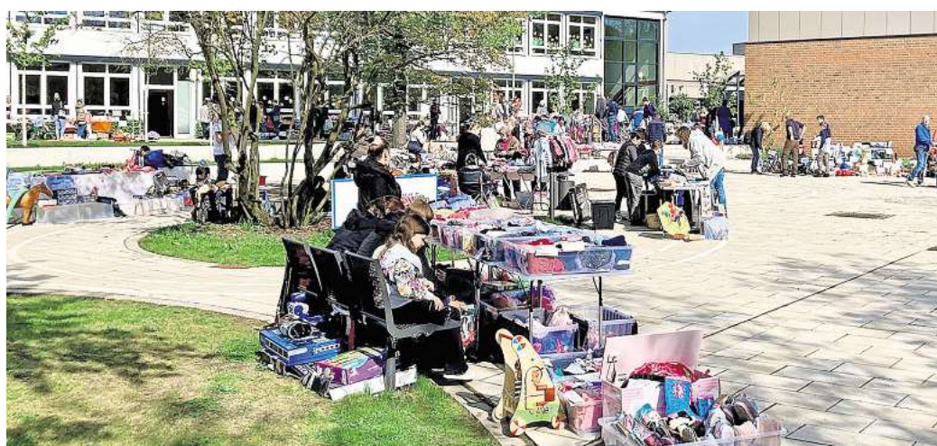
Der Kinderflohmarkt an der Burgschule Kleinburgwedel findet am 18. April von 9 bis 13 Uhr statt.

Auch für das leibliche Wohl ist bestens gesorgt: Ein großes Kuchenbuffet lädt dazu ein, sich während des Flohmarktbesuchs mit Kaffee und hausgemachten Kuchen zu stärken. Der Erlös kommt dem Förderverein und damit verschiedenen Projekten rund um die Burgschule Kleinburgwedel zugute. Wer selbst einen Stand anmelden möchte, kann dies noch bis zum 10. April