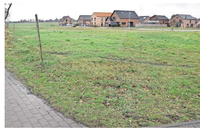
Noch ungenutzt: Zwei Grundstücke im Neubaugebiet warten weiterhin auf Investoren.

Zwei Mehrfamilienhäuser sollten im Bereich der Straße An den Gartenwiesen entstehen. Geplant waren zwei Gebäude mit insgesamt 26 Wohneinheiten und rund 1850 Quadratmetern Wohnfläche. Vorgesehen waren dabei unterschiedlich große Einheiten, wie sie auf dem übersichtlichen Wohnungsmarkt in Burgwedel eigentlich stetig gefragt sind: von Einzimmerwohnungen mit etwa 45 bis 50 Quadratmetern über Zweizimmerwohnungen mit rund 70 Quadratmetern bis zu Dreizimmerwohnungen mit etwa 80 Quadratmetern. Die entsprechenden Planungen wurden bereits vor längerer Zeit im Kleinburgwedeler Ortsrat vorgestellt, und zeitweise gab es auch Interesse von Investoren. Doch bislang ist das Projekt nicht umgesetzt worden – und nach Angaben von Orts-