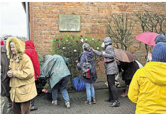
Blumen werden in den „Busch der Hoffnung“ unterhalb der Gedenktafel gesteckt – ein stilles Zeichen des Erinnerns.

GROßBURGWEDEL (r/bs). Auch in diesem Jahr erinnerte die Bürgerinitiative „Gegen das Vergessen“ an die Erschießung von KZ-Häftlingen auf dem Gelände der Pestalozzi-Stiftung. Seit mehr als 20 Jahren findet die Gedenkveranstaltung an der Scheune der Pestalozzi-Stiftung statt, um der Opfer der nationalsozialistischen Gewaltherrschaft zu gedenken.