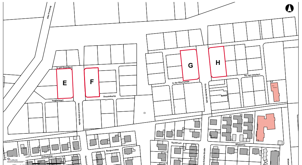
Lageplan Bausträgergrundstücke E - H

Unabhängig von der Änderung der NBauO wünscht die Gemeinde Isernhagen die Herstellung eines Stellplatzes pro Wohneinheit . Die im B-Plan definierten Vorgärten sind davon freizuhalten. So können die privaten und öffentlichen Grünflächen miteinander in Wechselwirkung treten und den Charakter des Gebietes als durchgrüntes Wohnquartier betonen. Je nach Beplanung sind 4-6 Wohneinheiten pro Fläche möglich, wobei durchaus auf einen ausgewogenen Mix aus Doppel- und Reihenhäusern gesetzt werden sollte.