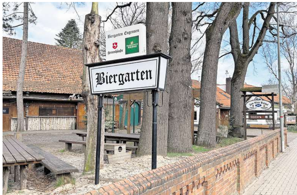
Das Aus ist besiegelt: Der "Waldbühne"-Biergarten in Engensen.