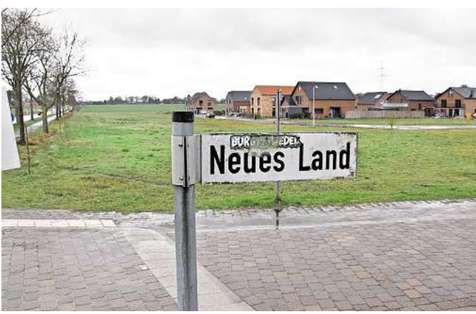
Stillstand im Neubaugebiet: Für die Mehrfamilienhäuser fehlen bislang Investoren.

KLEINBURGWEDEL (jba). Das Kleinburgwedeler Neubaugebiet „Im Lohfelde West“ wächst seit einigen Jahren kontinuierlich. Zahlreiche Einfamilienhäuser sind bereits entstanden, die meisten auch längst bezogen. Was geplante Mehrfamilienhäuser angeht, herrscht allerdings seit längerem Stillstand. Zwei dafür vorgesehene große Grundstücke stehen weiterhin leer – und zugleich sinnbildlich für die aktuellen Herausforderungen im Wohnungsbausektor.