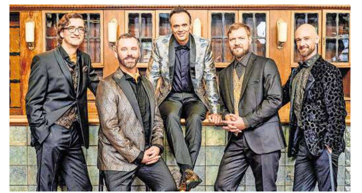
Vocaldente sind mit ihrem Programm „Let's be Gatsby“ zu Gast in der Scheune des Isernhagenhofes.

Karten für Vocaldente zum Preis von 25 Euro/ermäßigt 16 Euro können beim Isernhagenhof Kulturverein online unter www.isernhagenhof.de/tickets/ gebucht oder unter (05139) 894986 und info@isernhagenhof.de vorbestellt werden. Erhältlich sind sie auch bei den Vorverkaufsstellen C. Böhnert in Burgwedel und Isernhagen HB sowie beim TUI ReiseCenter Altwarmbüchen. Kurzschlösschen erhalten am Veranstaltungstag ab 19 Uhr Karten an der Abendkasse.