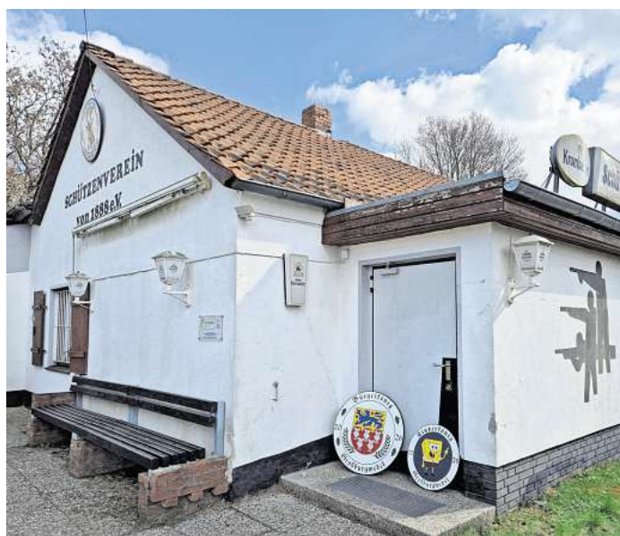
Die Wettbewerbe um die Königsscheiben werden im Schützenhaus Großburgwedel ausgetragen.

Die Jungmannen-Königsscheibe können alle unverheirateten Bürgerinnen und Bürger aus Großburgwedel im Alter von 16 bis unter 30 Jahren erringen. Die Kinder-Königsscheibe – geschossen mit dem Lichtpunktgewehr – steht allen Großburgwedeler Mädchen und Jungen bis einschließlich 15 Jahre offen; sie kann dienstags, donnerstags und sonntags geschossen werden. Die Schützenkönigsscheibe schließlich wird ausschließlich von Mitgliedern des Schützen-