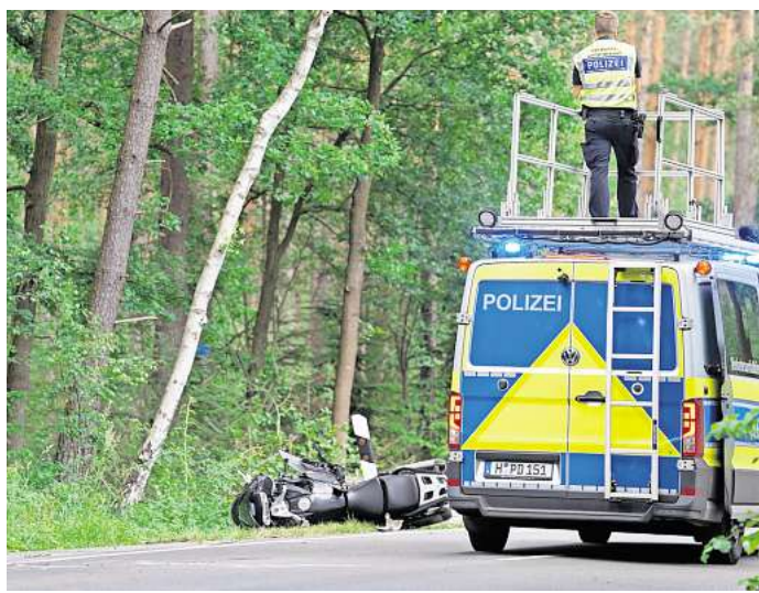
Endete tragisch: Der Zusammenstoß eines Motorradfahrers mit einem Auto zwischen Gailhof (Wedemark) und Fuhrberg (Burgwedel).

Wie die junge Frau, die nach Polizeiangaben nie eine Fahr-erlaubnis besessen hat, überhaupt an den Mietwagen ge-