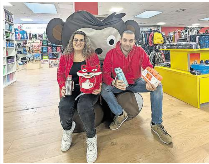
Affenzahn Kinderrucksack und passendes Zubehör.

Auf die angehenden Schulkinder und ihre Eltern warten viele Neuerungen: So gibt es zum Bei-