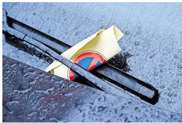
Ein Knöllchen steckt hinten dem Scheibenwischer: Die Gemeinde Isernhagen will ihren Ordnungsdienst verstärken.

Doch die „mangelnde personelle Ausstattung in der Ge-