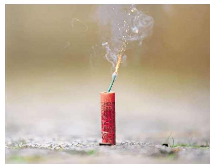
Wer Böller zündet verursacht Schäden zum Nachteil der Anwohner und der Umwelt.

Feuerwerke sorgen nicht nur für Feinstaub, Müll und Verletzungsgefahr für Menschen – sie bringen vor allem Unruhe in die Natur. Das Problem: Wildtiere können nicht zwischen Naturereignis und menschengemach-