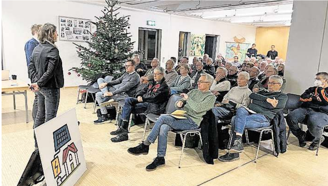
Zahlreiche Bürgerinnen und Bürger folgten der Einladung der Stadt Burgwedel und der Klimaschutzagentur Region Hannover zum Infoabend „Heizen ohne Wärmenetz“.

Die Veranstaltung fand im Rahmen der Beratungskampagne der Klimaschutzagentur Region Hannover statt und bot wertvolle Impulse für alle Bürgerinnen und Bürger, die ihre Wärmeversorgung klimafreundlich gestalten möchten.