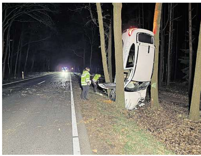
Kollision mit mehreren Bäumen: Eine 22-Jährige aus Burgwedel ist am Sonntagabend mit ihrem Auto von der Fahrbahn abgekommen – der Wagen blieb mit der Frontseite nach unten zwischen drei Bäumen stecken.

ruf hätten sich bislang keine weiteren Zeugen gemeldet. Eignet hatte sich der Unfall auf einem Abschnitt, auf dem lediglich Tempo 50 erlaubt ist. Auf der gesamt 2,7 Kilometer langen, teils schnurgeraden Strecke zwischen dem Fuhrberger Ortsausgang und der Autobahn